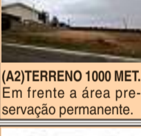
(A2) TERRENO 1000 MET. Em frente a área preservação permanente.