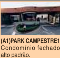
(A1) PARK CAMPESTRE 1 Condomínio fechado alto padrão.