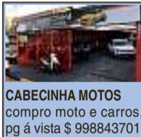
CABECINHA MOTOS compro moto e carros, pg á vista $ 998843701