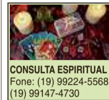
CONSULTA ESPIRITUAL Fone: (19) 99224-5568 (19) 99147-4730