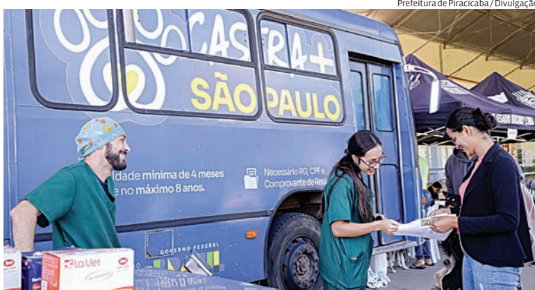
As vagas são limitadas e os tutores devem realizar cadastro prévio

A morte do ex-vereador e farmacêutico Arnaldo da Farmácia, aos 65 anos, gerou comoção em Jundiaí durante o feriado de Corpus Christi. Conhecido pela atuação na área da saúde e pelo contato próximo com a população, Arnaldo exerceu mandato na Câmara Municipal entre 2017 e 2020. Ao longo da semana, ele esteve internado e teve o protocolo de morte encefálica iniciado. Nas redes sociais, políticos, amigos e moradores prestaram homenagens e destacaram sua trajetória de atendimento à comunidade. O velório foi realizado durante a manhã e a tarde desta sexta-feira (5), e o sepultamento ocorreu às 15h, no Cemitério dos Ipês.