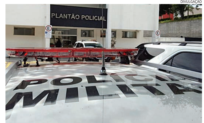
O delegado determinou a prisão em flagrante do marido

Ambos foram conduzidos à delegacia, onde o delegado determinou a prisão em flagrante do marido.