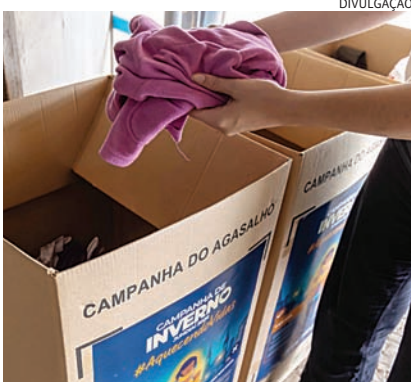
As doações devem estar em bom estado de conservação e limpas

Atualmente, a campanha conta com mais de 50 pontos de arrecadação distribuídos por diferentes regiões,