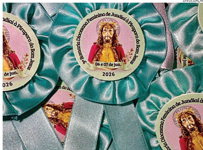
Todos os participantes recebem o broche de identificação para os romeiros