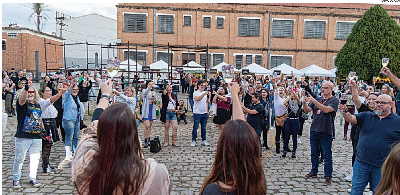
Os tradicionais brindes acontecem às 17h durante o pôr do sol