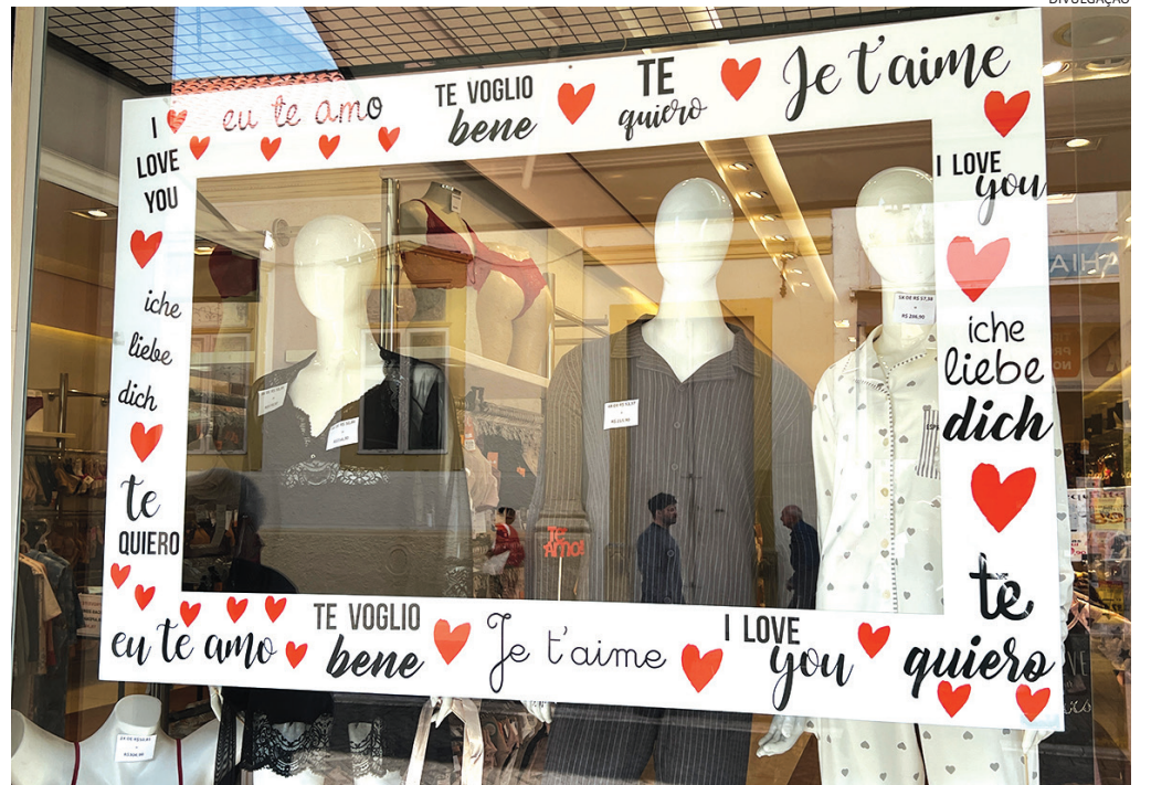
As lojas poderão ficar abertas neste sábado até as 18h

devem se destacar entre os setores mais procurados pelos casais, seguidas de eletrodomésticos, eletrônicos e lojas de departamentos, farmácias e perfumarias, que comercializam alguns dos itens mais procurados para a ocasião, a exemplo dos perfumes, cosméticos e produtos de beleza em geral. As lojas de móveis e decoração também devem atrair interesse dos consumidores.