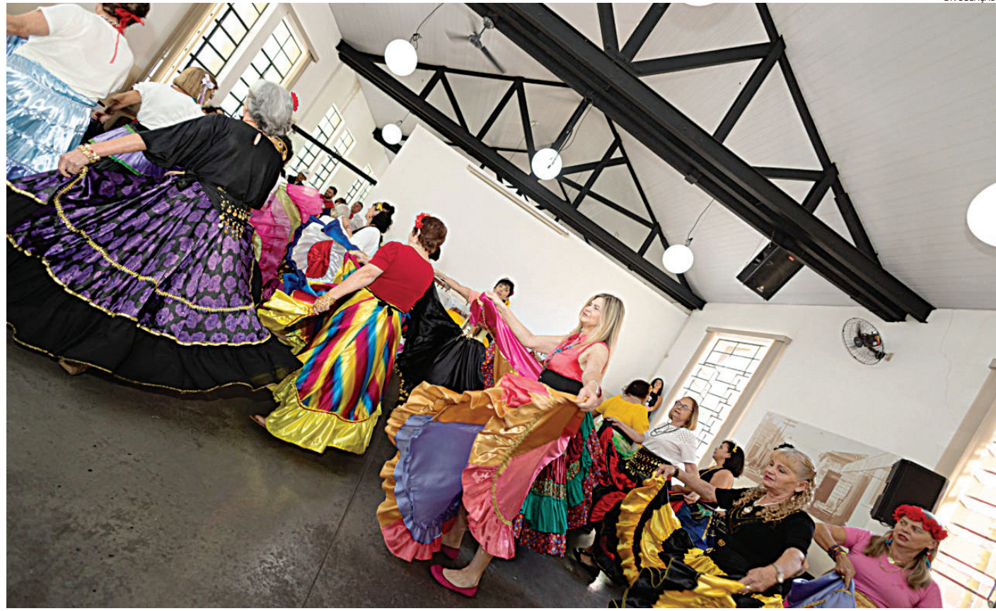
As atividades vão desde eventos sociais a palestra de saúde

A abertura das atividades será realizada no dia 10 de junho, às 14h, na Câmara Municipal de Jundiá, durante reunião da Comissão do Envelhecimento. O