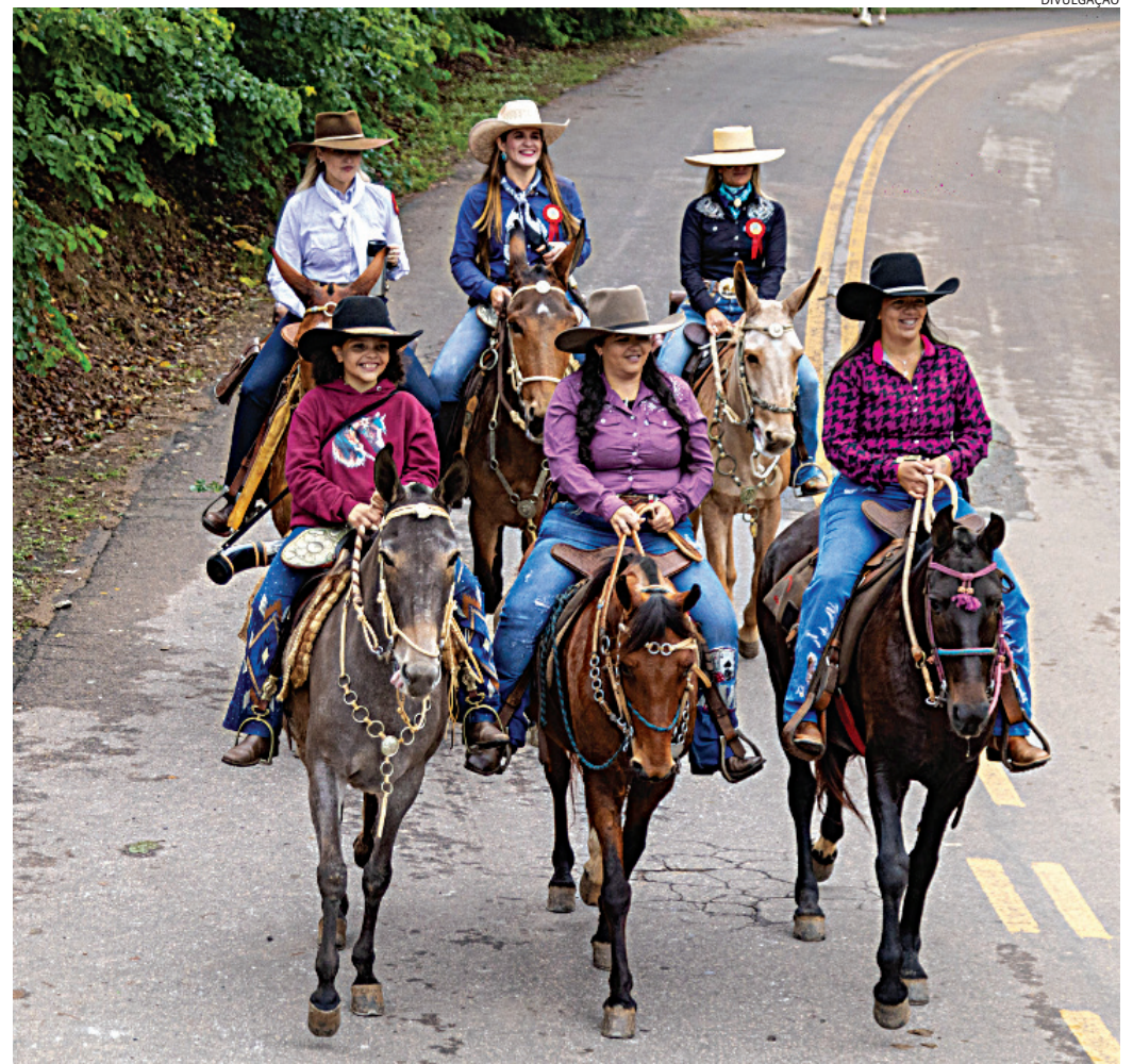
O grupo sairá de Jundiáí neste sábado por volta das 8h rumo a Pirapora

peregrinações centenárias contavam com um protagonismo essencialmente masculino, restando às mulheres um papel mais coadjuvante. Eu idealizei uma romaria composta exclusivamente por mulheres, mas tive apoio de muitas pessoas para estruturar o grupo que é focado em expressar a espiritualidade, a força e a conexão feminina com o meio rural."