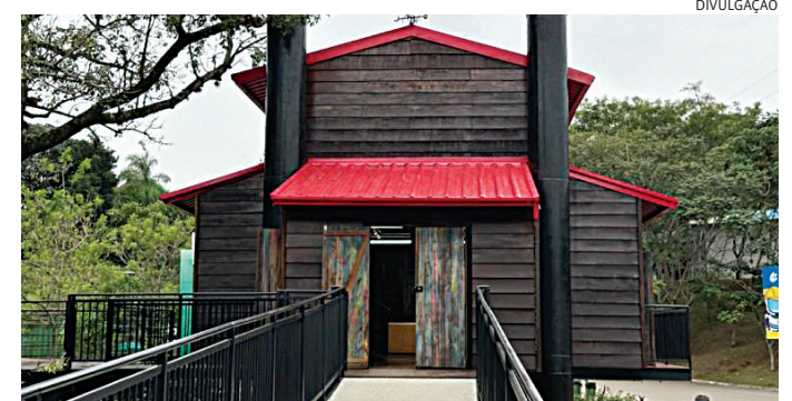
As intervenções fazem parte das ações de revitalização do espaço

A quadra de futebol, a parede de escalada, as fontes interativas, os muros de sustentação e o mirante já passaram por melhorias e estão novamente disponíveis para o público, como. As ações seguem em andamento. Outra novidade é o avanço nas etapas de implantação do Espaço Girassóis. O projeto prevê uma área inclusiva, com recursos sensoriais e psicomotores, além de uma casa de apoio com enfermaria, ampliando a estrutura de atendimento às famílias.