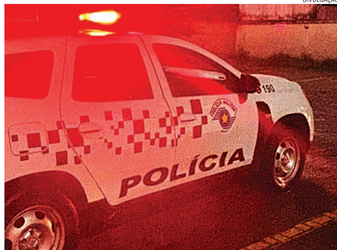
Ele recebeu voz de prisão e foi conduzido ao Plantão Policial

Cerca de uma hora e meia depois, porém, os policiais precisaram retornar ao mesmo endereço após um novo chamado feito pela mulher. Quando chegaram, avistaram o marido deixan-