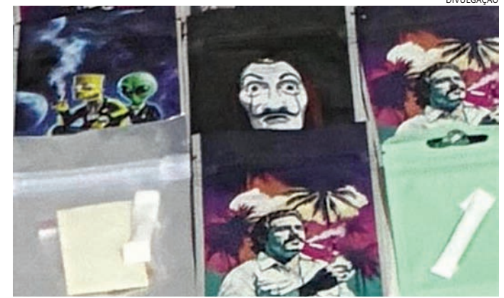
Havia estampas de figuras conhecidas do crime organizado

Segundo fontes policiais, as imagens contidas nas embalagens não seriam apenas ilustrativas, mas utilizadas para