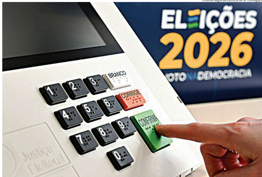
Eleições de 2026 devem ser marcadas pela polarização política e pela disputa de espaço