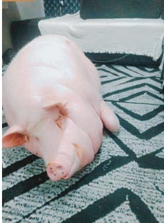
Tonico tem vídeos que ultrapassam 200 mil visualizações no Kwai e TikTok