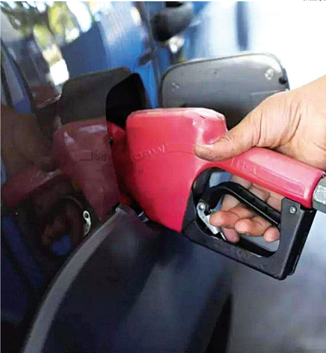
O abastecimento será mais uma alta prevista e que deve chegar ao consumidor já no início da próxima semana

A reunião do conselho da Petrobras para definir o reajuste do diesel acontece nesta quarta-feira (29). A justificativa para o aumento é a defasagem do combustível ante ao cenário internacional, que seria de cerca de 17%. Com as variações do ICMS dos estados e também do reajuste da Petrobras, especialistas estimam que