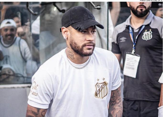
Neymar assinou um contrato de seis meses após saída do Al-Hilal

O Menino da Vila volta, a princípio, para um contrato de seis meses após rescindir no Al-Hilal. O Santos tentará convencê-lo a ficar até a Copa do Mundo de 2026.