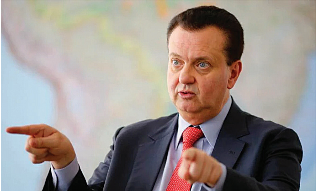
Kassab avalia que Tarcísio de Freitas é o maior nome de oposição ao governo Lula

O presidente do PSD - partido que tem ministérios no governo Lula - também mencionou a manifestação que