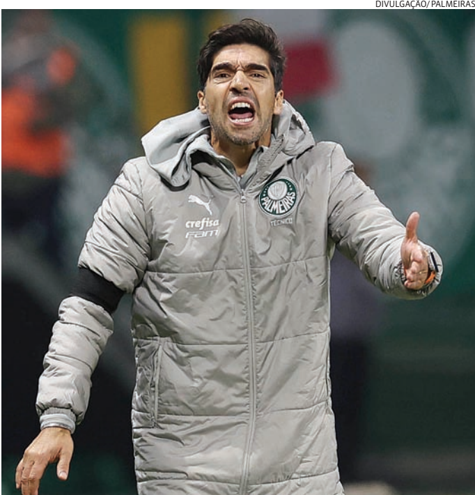
Abel Ferreira reiterou que está fechado com o Palmeiras

Abel reiterou que é um treinador de projeto, citou o ex-treinador do Liverpool e reforçou que está fechado com o Palmeiras, dias após dizer que vai para o seu último ano no Brasil — ele tem contrato até dezembro de 2025. Ainda não houve anúncio oficial sobre um