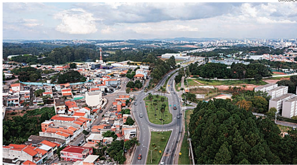
Jundiaí tem autorização apenas para atuar entre o km 64,5 e km 71

Atualmente, a Prefeitura possui autorização para atuar apenas entre o km 64,5