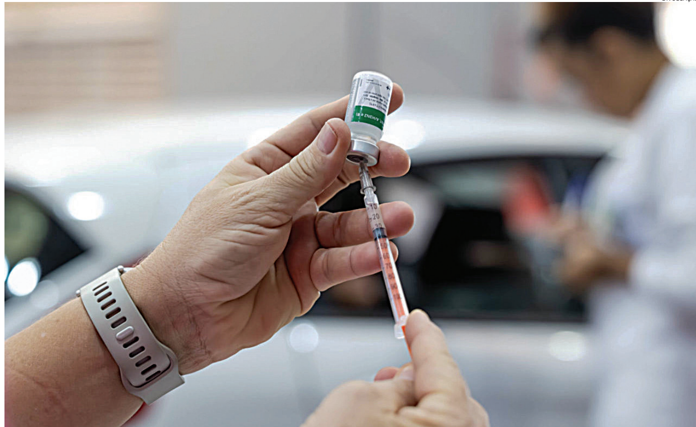
A aplicação está disponível nas UBSs e Clínicas da Família

Até o dia 28 de maio, Jundiaí já aplicou 80.864 doses da vacina contra a influenza. Entre os grupos prioritários, foram aplicadas