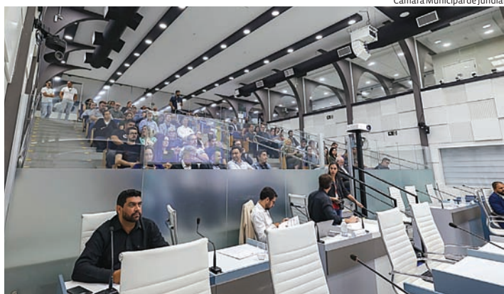
Poder público e sociedade civil se reuniram para balanço do primeiro quadrimestre

Jundiaí foi escolhida para sediar o 55º Congresso Nacional de Saneamento da Assemæe, previsto para maio de 2027. A cidade venceu a disputa com Vitória (ES), Balneário Camboriú (SC) e Joinville (SC), sendo selecionada por critérios como capacidade técnica, infraestrutura e atuação no setor de saneamento. O evento é considerado um dos principais do país na área e reúne gestores públicos, especialistas, empresas e representantes de serviços municipais de saneamento. A escolha levou em consideração critérios como infraestrutura, capacidade de organização do evento e indicadores do município na área de saneamento.