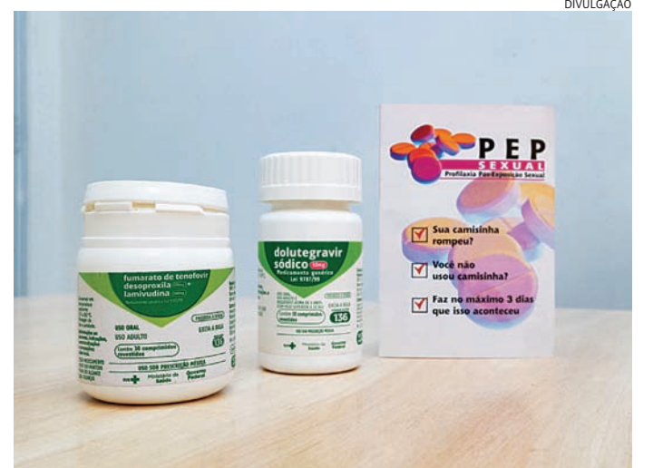
Todas as UBSs e Clínicas da Família poderão realizar a prescrição

Para a implementação da nova estratégia, a rede muni-