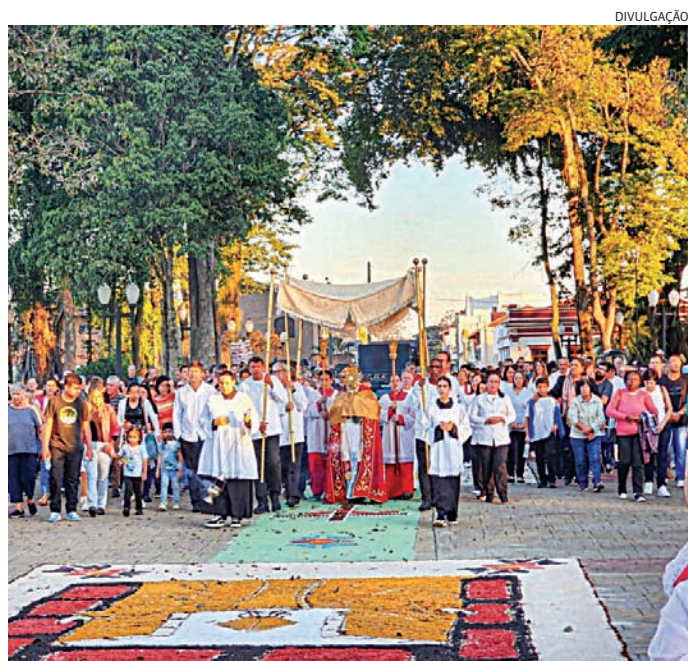
As estimativas apontam para cerca de 3,35 milhões de turistas em trânsito

O 4º Colóquio Científico integra a programação do Mês do Meio Ambiente, organizado pela Secretaria Municipal de Planejamento Urbano e Meio Ambiente (SMPUMA). As atividades tiveram início no dia 13 de maio e seguem até 13 de junho, com ações voltadas à conscientização ambiental, educação, sustentabilidade e preservação dos recursos naturais no município.