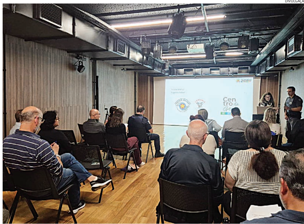
Poder público e sociedade civil discutiram os avanços e desafios da revitalização

Durante a reunião também foram apresentadas premissas, diretrizes e áreas