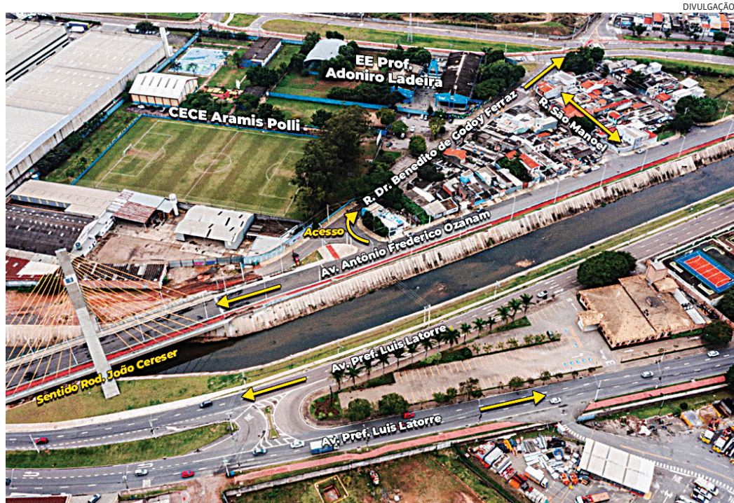
Os motoristas devem ficar atento às alterações do trânsito no entorno

pelo acolhimento dos usuários e pela prescrição da PEP, garantindo um atendimento qualificado e seguro à população. Leia mais na versão on-line do JJ ( jj.com.br ).