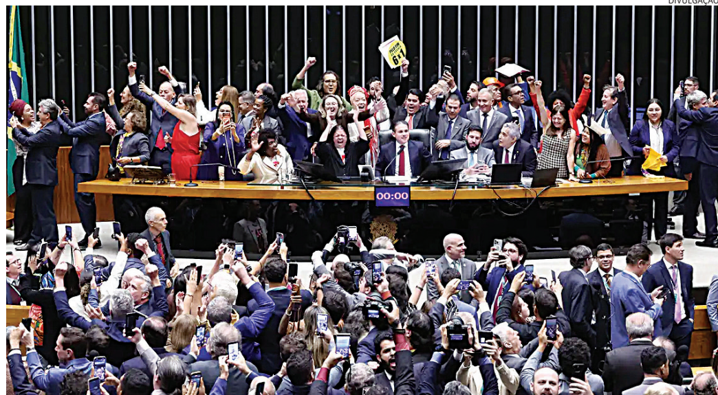
Câmara Federal aprovou nesta semana o fim da escala 6x1

A peça principal termina com o slogan “é o governo do Brasil do lado do trabalhador,