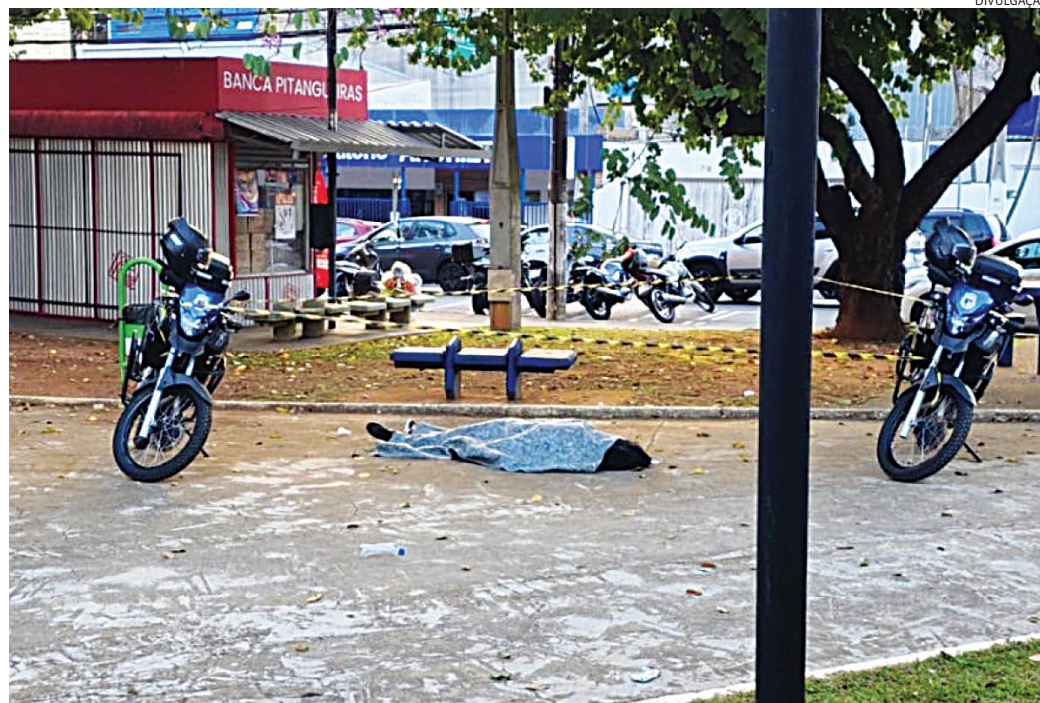
A ocorrência foi atendida por GMs do Tático Motos, que preservaram a área

O médico da equipe de resgate constatou o óbito ainda no local. A Perícia Técnica também foi acionada e, segundo as pri-