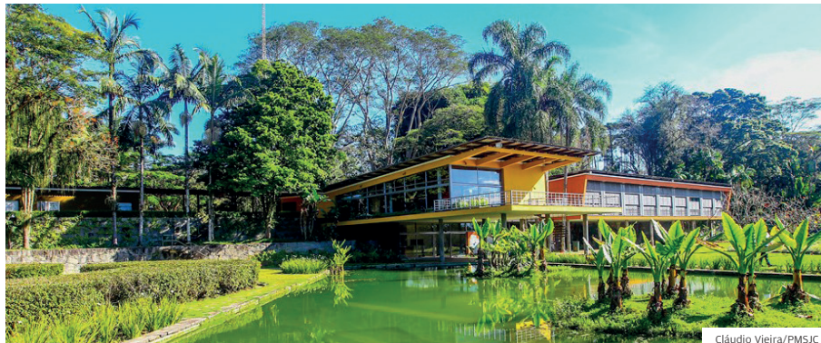
Prefeitura faz projeto para restaurar jardins de Burle Marx

PRESERVAÇÃO CIDADE SE DESTACA POR AÇÕES SUSTENTÁVEIS E PROJETOS INOVADORES