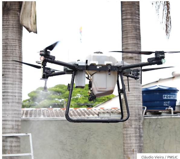
Tecnologia. Drone auxilia no combate à dengue