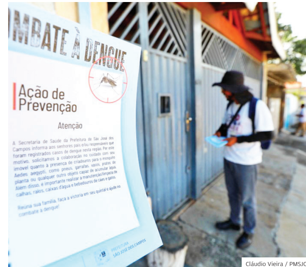
Prevenção. Combate à dengue é feito em toda a cidade