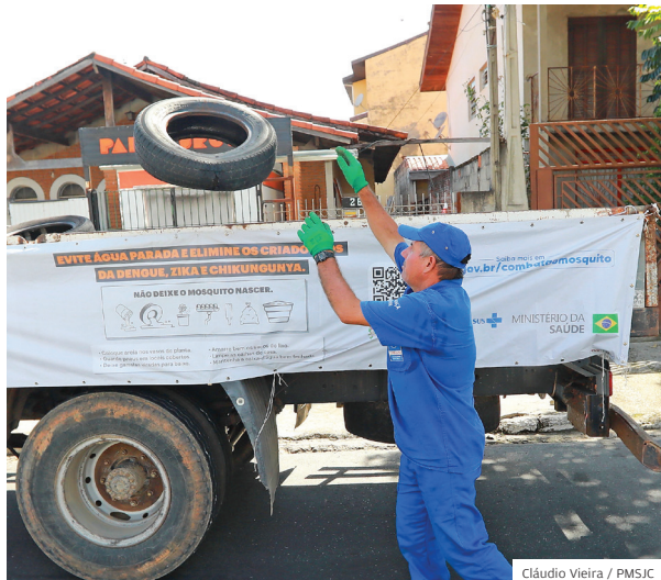
Casa limpa. Caminhões recolhem possíveis criadouros

CONSCIENTIZAÇÃO EM 2024 FORAM MAIS DE 98 MIL CASOS DE DENGUE. COLABORAÇÃO DE TODOS É ESSENCIAL PARA COMBATER A DOENÇA