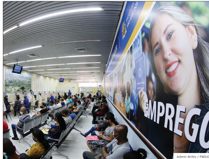
PAT. Funcionamento de segunda a sexta-feira, das 8h às 16h