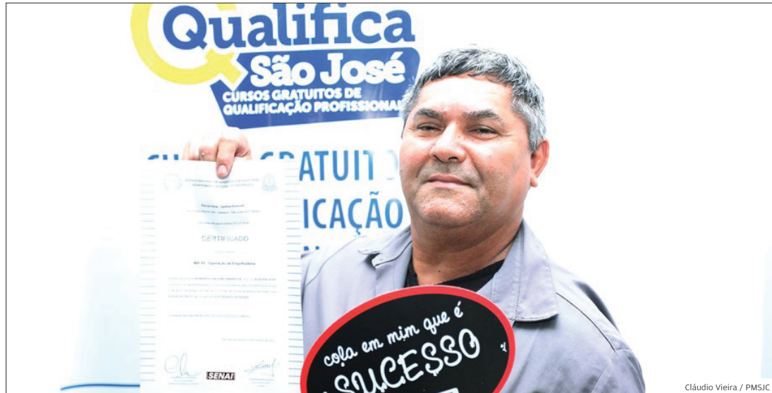
Para todos. Perfil de vagas ofertadas é variado, para diversos setores e cargos

OPORTUNIDADES PROGRAMA QUALIFICA OFERECE QUASE 5.000 VAGAS DE CURSOS GRATUITOS