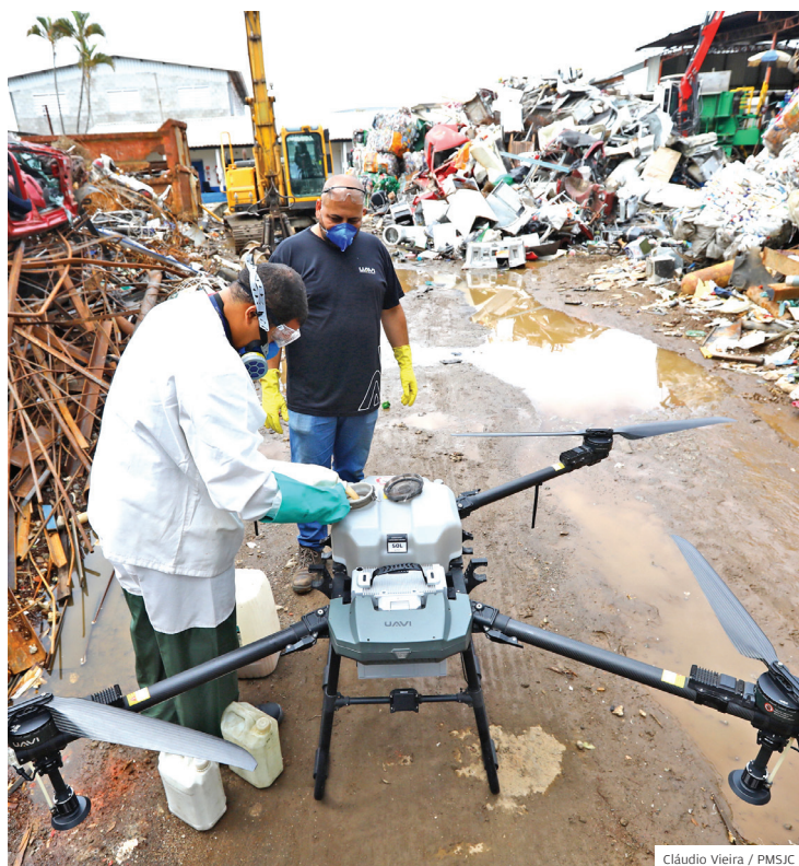
Combate à dengue. Tecnologia contra o Aedes aegypti em S. José

Tecnologia faz toda a diferença na luta contra o Aedes aegypti . Os dias mais quentes e chuvosos são propícios para proliferação das larvas e é fundamental que a população também redobre os cuidados dentro de casa, não acumulando entulho e lixo e mantendo a limpeza em dia