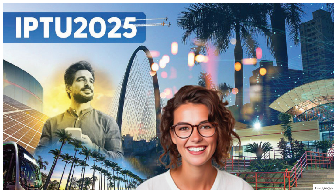
IPTU. Pagando o IPTU, contribuintes têm acesso a projetos e serviços que melhoram a qualidade de vida

ARRECADÇÃO TRIBUTOS SÃO REVERTIDOS COM INVESTIMENTOS EM DIVERSAS ÁREAS, COMO SAÚDE, OBRAS E EDUCAÇÃO