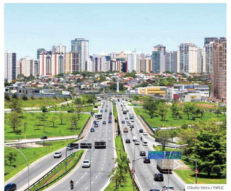
Melhorias. Quem paga o IPTU à vista tem desconto