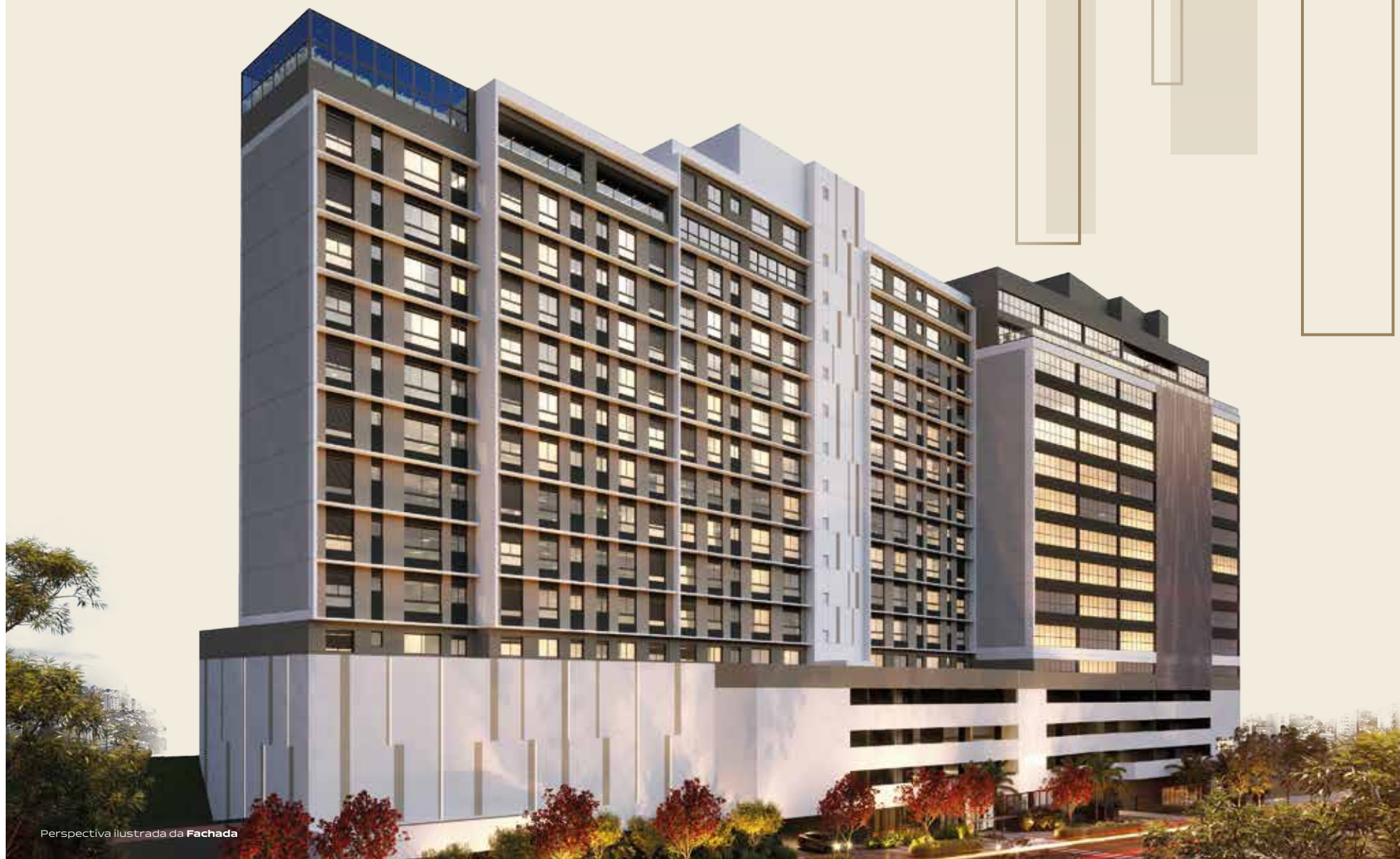
Perspectiva ilustrada da Fachada