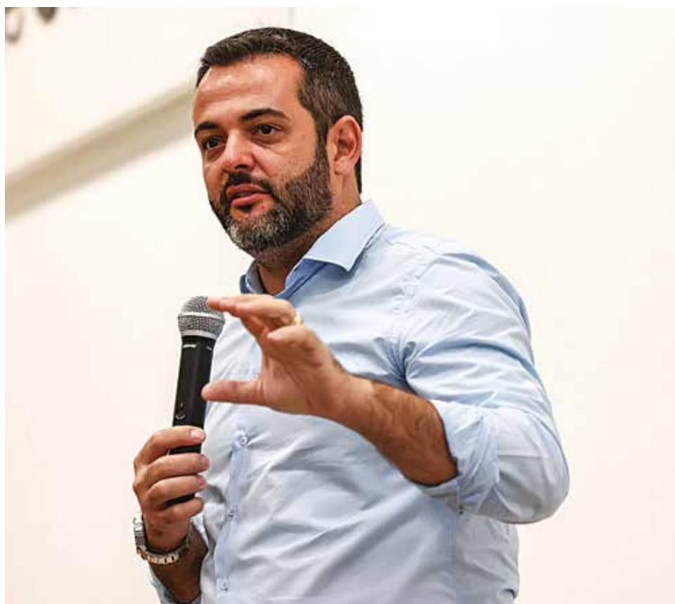
Prefeito Gustavo Martinelli faz grandes entregas durante a comemoração de aniversário de Jundiaí

Entre os destaques, temos uma grande entrega na saúde: a nova UBS do Rio Branco, que foi entregue à população no dia 13 de dezembro. Vamos lançar a Casa da Família, um espaço da Assistência destinado a acolher famílias em situações de emergência e calamidade climática, garantindo proteção, dignidade e o sentimento de lar mesmo nos momentos mais difíceis. Também entregaremos a primeira etapa da Vila de Oportunidades, reunindo projetos de Assistência e Desenvolvimento Social.