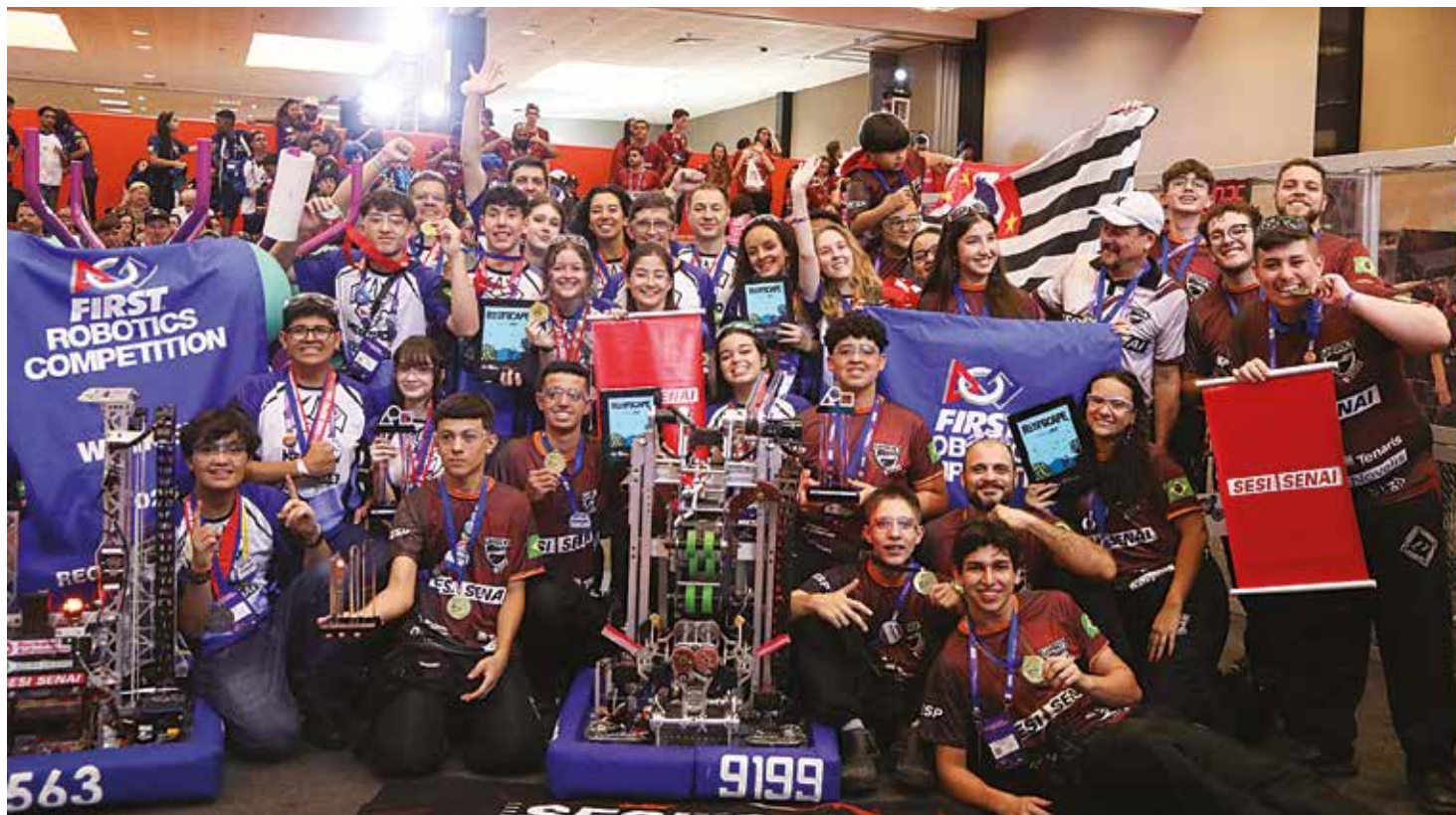
A Megazord é a atual campeã brasileira da FIRST Robotics Competition