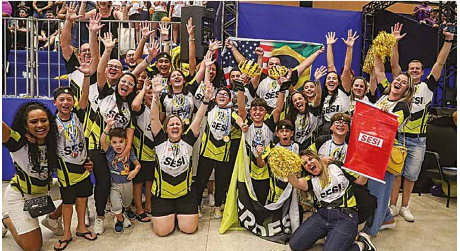
Equipe Heroes foi campeã mundial no Texas, nos EUA

A equipe Heroes, formada por estudantes do Sesi Jundiaí, fez história ao conquistar o título de campeã mundial da FIRST LEGO League (FLL), considerada a maior competi-