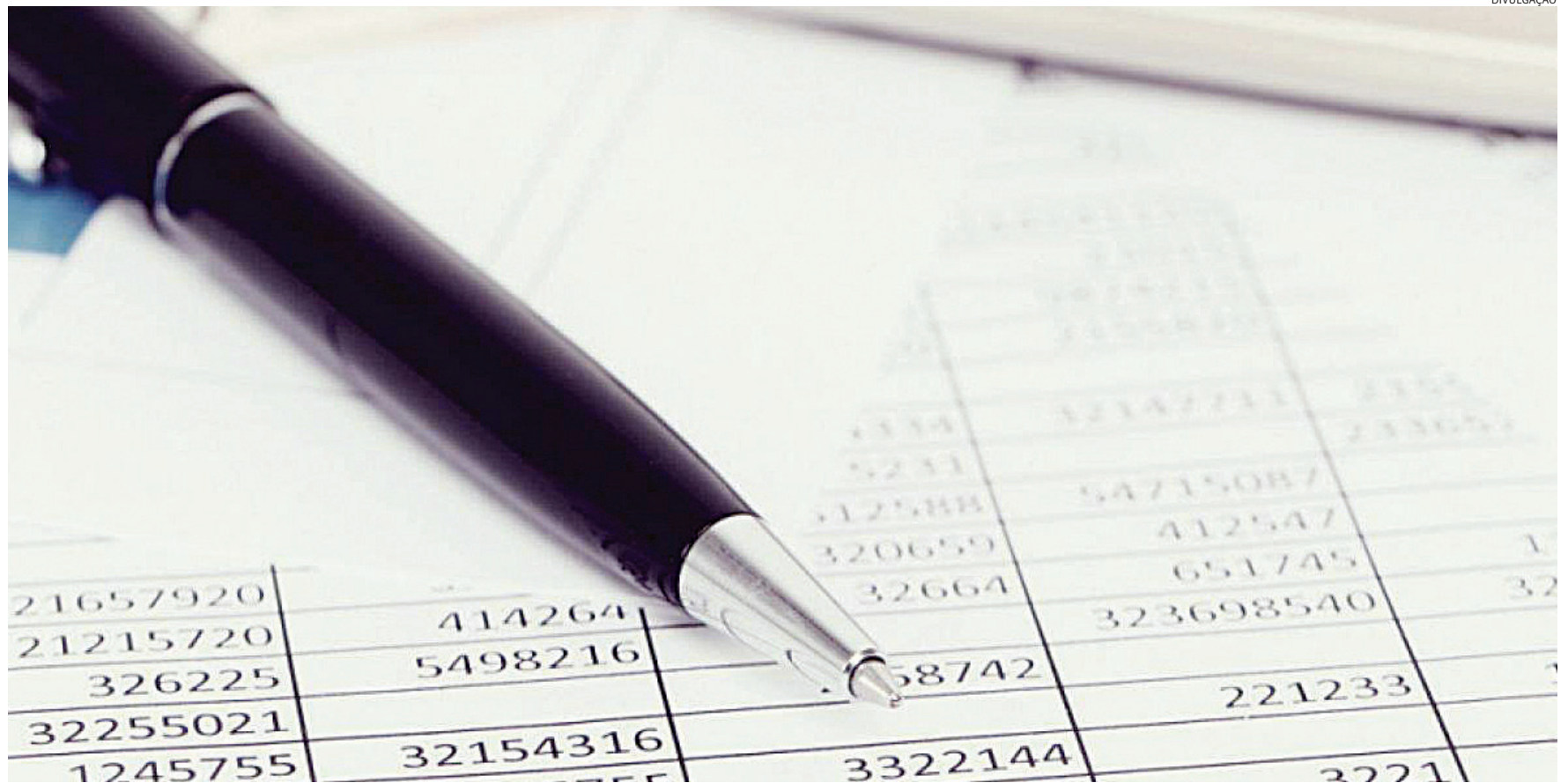
A empresa e o MEI que regularizarem a totalidade de suas pendências dentro do prazo mencionado não serão excluídos pelos débitos constantes do referido Termo de Exclusão

Em Jundiaí, a dívida dos 2.862 MEIs com pendên-