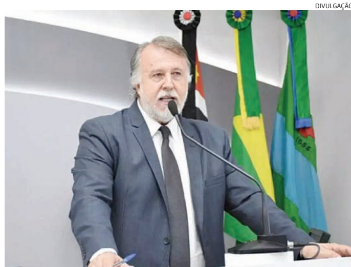
Albino faz campanha nas ruas e também atua na Câmara Municipal