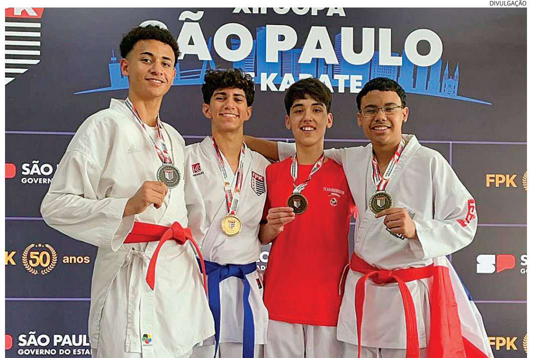
A competição acontece em Paulínia e contou com mais de 1.600 atletas

A Prefeitura Municipal, através da Unidade Gestora de Esporte, Lazer, Cultura e Turismo apoiou os atletas, fornecendo o transporte para a competição.