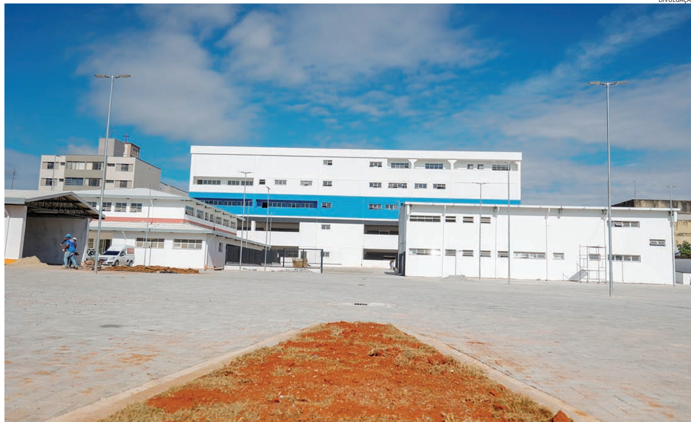
Além da estrutura dos prédios, os órgãos contarão com acréscimo em tecnologia, como o CICCOM, que tem investimento previsto de R$ 15 milhões

“Este é um dos mais modernos complexos de urgência e emergência do Brasil. Com investimentos acima de R$ 100 milhões e operacionalização conjunta, o