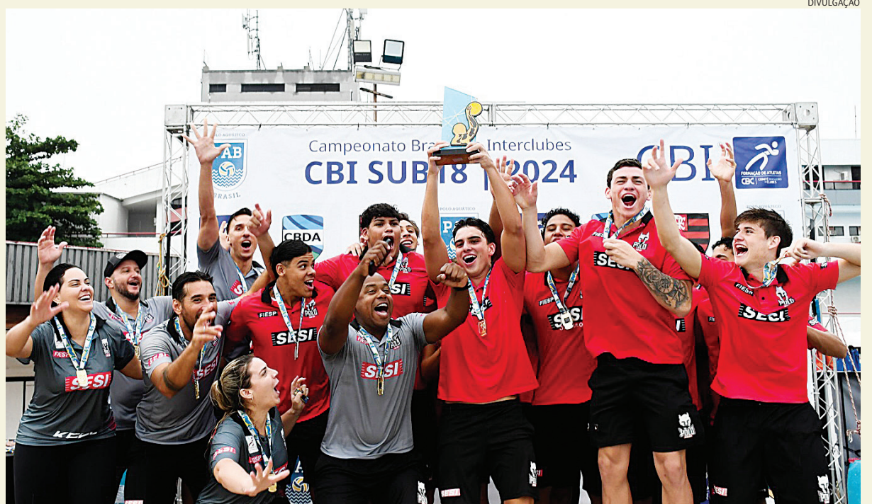
Invicto, Sesi-Jundiaí vence campeonato brasileiro de pólo aquático