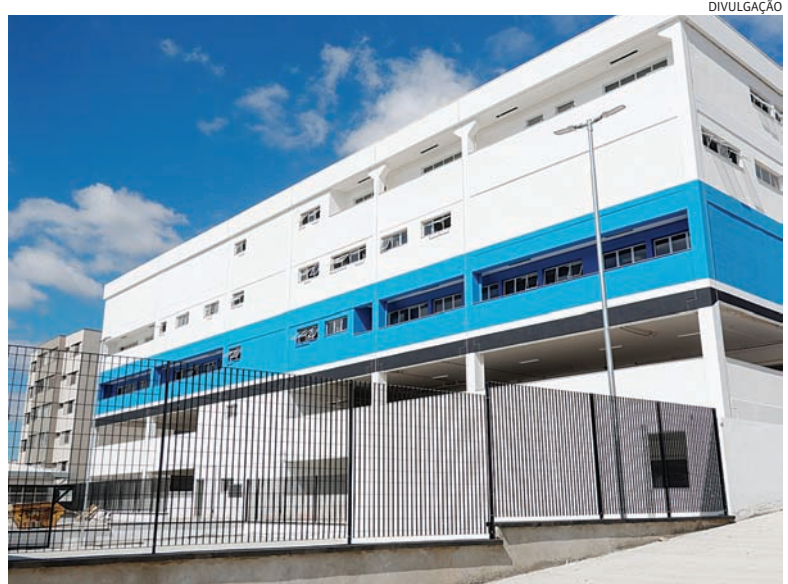
Prefeito, gestores e técnicos vistoriaram ontem os prédios do novo complexo

de emergência e segurança para o início das etapas de operacionalização, a partir de novembro. Ontem (22), prefeito Luiz Fernando Machado foi visitar o complexo, que tem investimento de R$ 100 milhões. Cidades 5