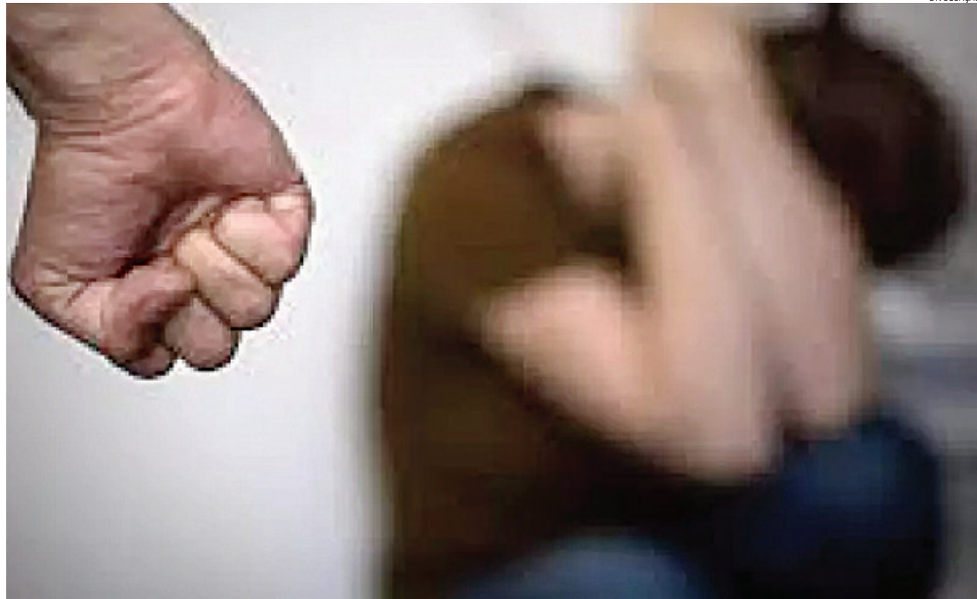
A vítima foi agredida com soco e chute no meio da rua, em Itatiba

para o Plantão Policial, onde ele se negou a prestar depoimento ou assinar qualquer registro da ocorrência.