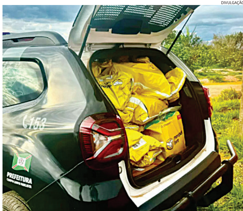
A mercadoria foi localizada em uma construção abandonada

A equipe do Centro de Controle Operacional