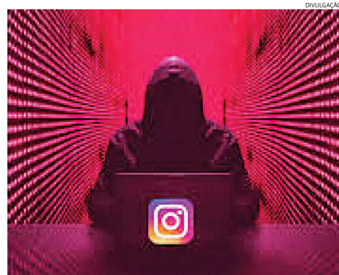
Mesmo após a alteração da senha, o criminoso continua na conta

O Velório Municipal informou sobre 5 óbitos, autorizada pelas famílias.