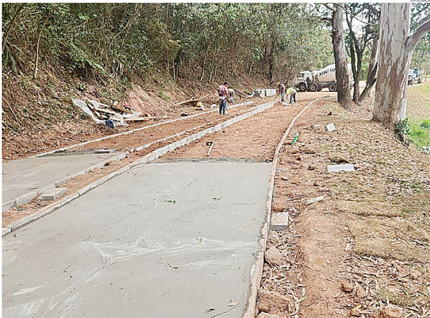
A ciclovia e a pista de caminhada estão praticamente finalizadas, com 70% das obras já concluídas as duas tem, aproximadamente, 1 km cada