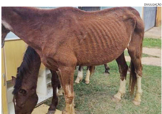
Animais são encontrados magros, com ossos aparentes

Segundo a Ugisp, a multa referente ao animal de grande porte em via pública tem valor de 20 UFM's, R$ 4.418,60. O protocolo de atendimento é realizado com a notificação, que é realizada pelo Debea, que notifica o proprietário, coleta as informações do animal e proprietário, logo após o animal é microchipado. Caso haja reincidência ou maus tratos aos animais, a multa é aplicada. Em casos severos, onde há riscos à população, pode ocorrer multa imediatamente, mesmo sem notificação, porém cada caso é avaliado.