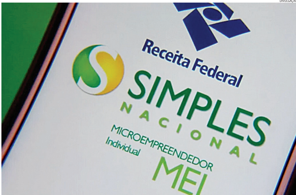
Consultas podem ser feitas pelo Portal do Simples Nacional ou pelo Portal e-CAC do site da Receita Federal

Em Jundiaí, há 2.862 MEIs e 2.179 MEs e EPPs com pendências tributárias. Microempresários individuais (MEIs), microempresas (ME) e empresas de pequeno porte (EPP) têm até o dia 1º de no-