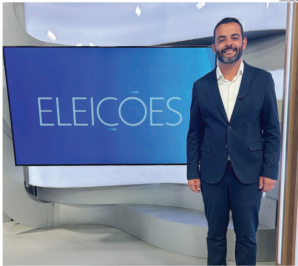
Advogados de Martinelli pedem prazo para que resultado não prejudique o 2º turno

tavo foi indeferida no último dia 24 de setembro diante da reprovação de suas contas pelo Tribunal de Contas enquanto presidente da Câmara em 2018, notadamente por pagamento de horas extras a funcionários, de forma contínua e indevida, caracterizando improbidade administrativa. Além dos embargos, no próprio TRE, o candidato ainda pode recorrer ao TSE (Tribunal Superior Eleitoral).