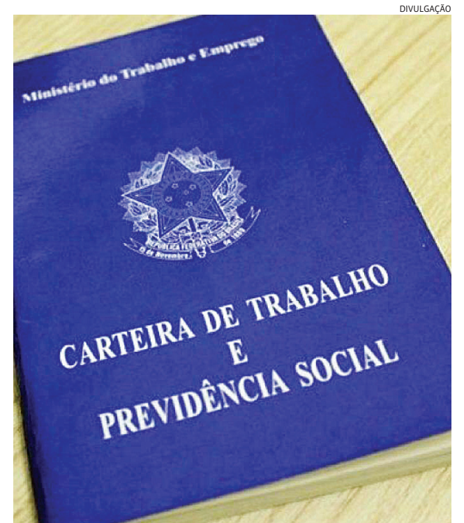
As vagas em Louveira podem ser acessadas pelo Portal da Sedec

Veja todas as vagas pelo Portal da Sedec no site da Prefeitura, na aba SAT - Vagas Disponíveis.