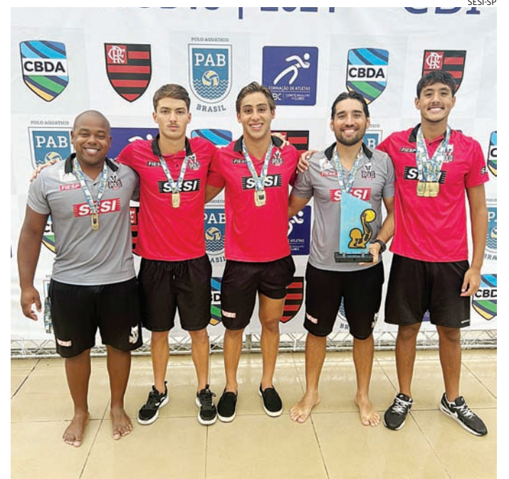
Atletas e membros da comissão técnica que representaram Jundiaí

mengo, com um placar de 16 a 6 e, na grande final, os atletas enfrentaram o CAP novamente em um duelo equilibrado, mas conseguiram conquistar a vitória por 8 a 7 e levaram o título invicto para casa.