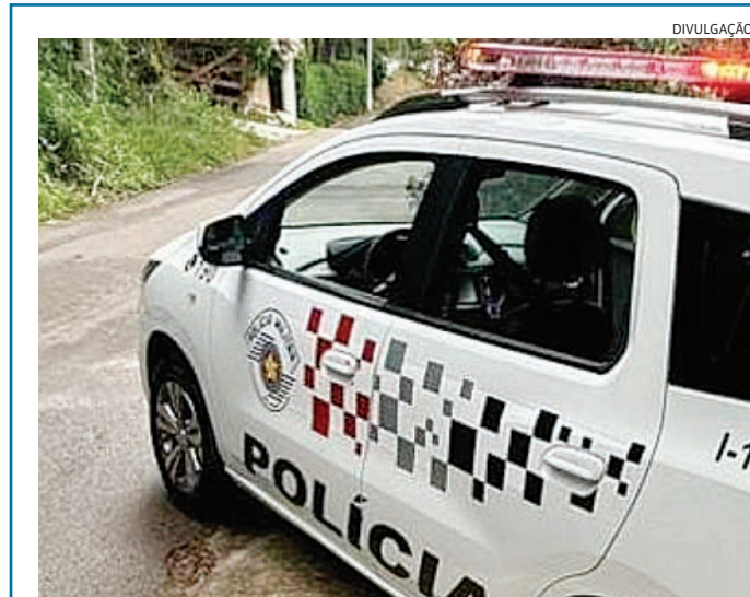
Ele foi capturado por PMs da 2ª Cia do 11º Batalhão

A motocicleta foi recolhida administrativamente pela Polícia Militar e diversas autuações foram feitas por causa das irregularidades constatadas.