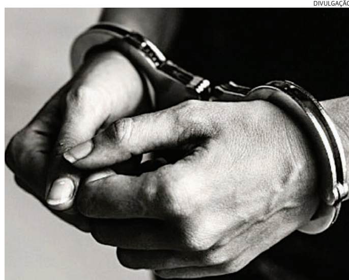
Ele foi levado para o DP, onde o mandado foi cumprido

Durante a revista pessoal, nenhum objeto ilícito foi encontrado. No entanto, ao consultarem os dados do abordado nos sistemas policiais, os agen-