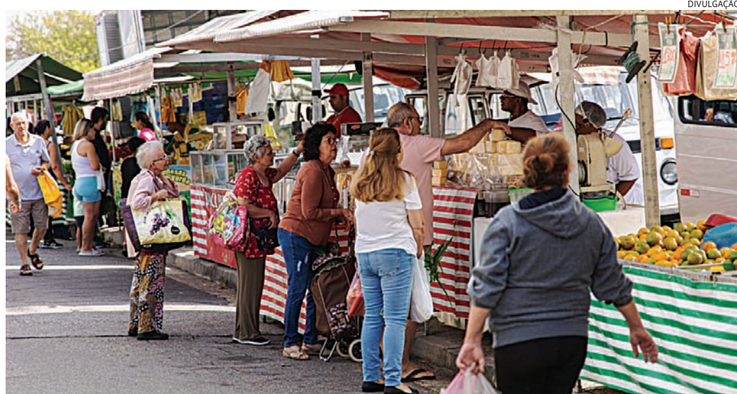
A ferramenta reforça os cuidados relacionados à qualidade dos produtos