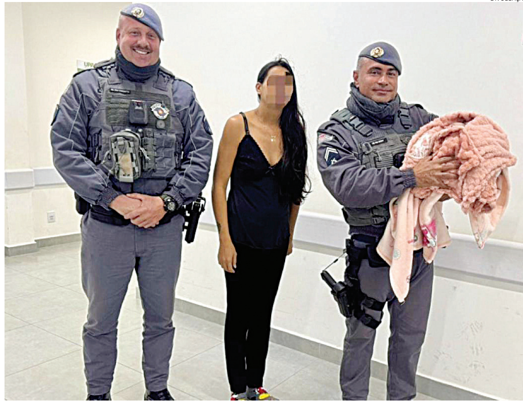
O quadro foi estabilizado e a criança permaneceu em observação, sem risco

Ao pararem para verificar a situação, os policiais encontraram uma mulher