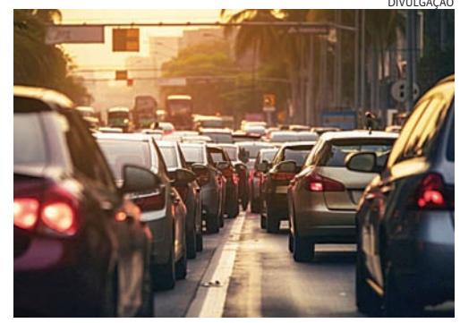
O maior fluxo de veículos deve se concentrar entre quarta e quinta

maior movimento serão nesta quarta (3), das 16h às 20h – no sentido capital-interior - saída para o feriado; na quinta (4), das 9h às 13h – no sentido capital-interior - saída para o feriado; e domingo (7), das 15h às 22h – no sentido interior-capital - retorno do feriado. Leia mais na versão on-line do JJ (jj.com.br)