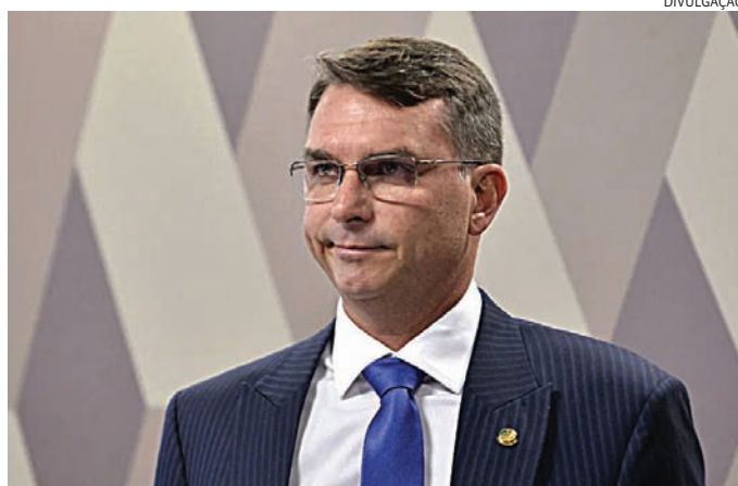
Após sua visita aos EUA, Flávio Bolsonaro tem sido alvo de críticas

aos EUA defender o Brasil e nossa economia. O filho de Bolsonaro foi defender sua própria família, trair o país e de lá para cá as coisas só pioraram”, escreveu o petista no X (ex-Twitter).