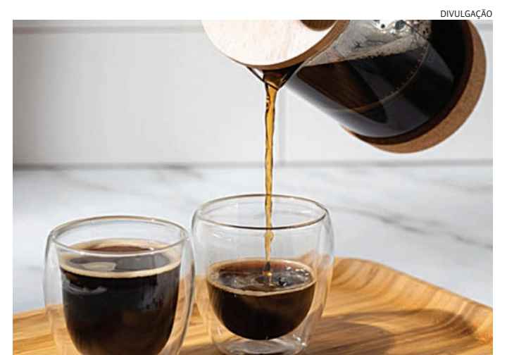
O IPS/Fipe apontou redução de 4,41% no preço do café

Já em relação ao preço das carnes, destaque para a queda no preço do coxão mole – corte considerado do "dia a dia" do consumidor – que ficou 3,80% mais barato em abril, de acordo com o IPS, assim como o lagarto, cuja redução de 2,80% no mesmo mês. Alcatra e contrafile também registraram quedas no período, de 2,26% e 1,97% respectivamente. O estudo da Apas em parceria com a Fipe destaca ainda a redução das bebidas não alcoólicas (0,63%) e nos produtos de limpeza (0,58%).