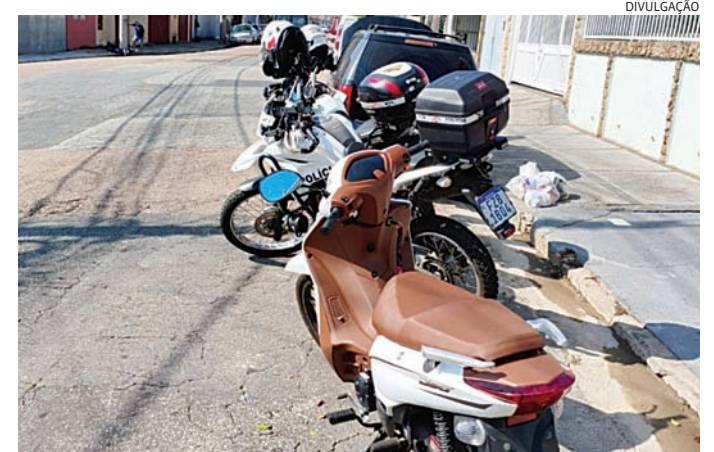
A motocicleta foi recolhida administrativamente pela Polícia Militar

Na averiguação, os policiais consultaram o número do chassi da motocicleta e constataram que o veículo não possuía registro de roubo ou furto. Em seguida, foi realizada pesquisa criminal do abordado, sendo verificado que ele estava em liberdade condicional por crime