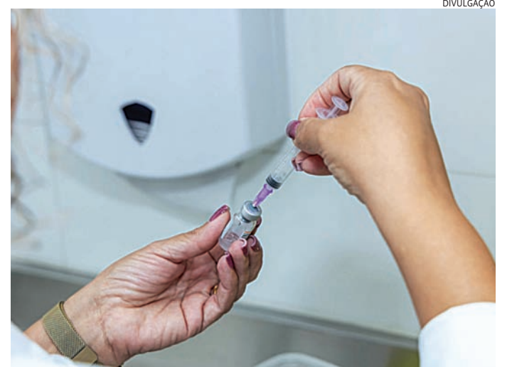
Para receber a dose é preciso estar com documentos em mãos

Para receber a dose, é necessário apresentar um documento com CPF. Para crianças de até 9 anos, é obrigatório levar carteira de vacinação. A vacina é segura, gratuita e continua sendo a principal forma de preven-