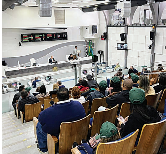
Vereadores reclamaram de falta de quórum para aprovar projetos