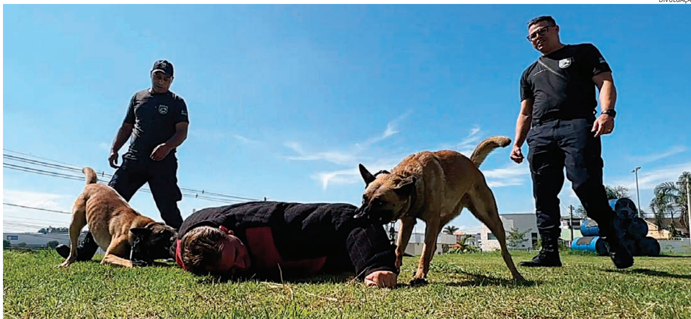
Hoje com 16 cães, o canil já tem sede própria para os treinamentos