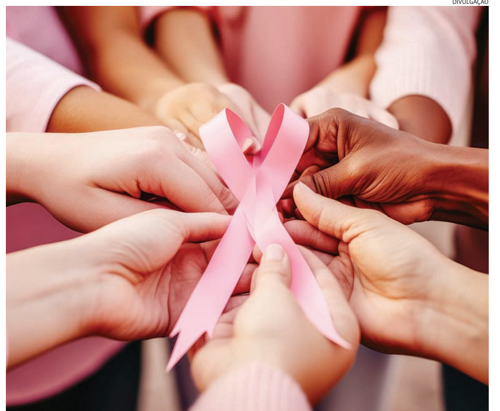
Com a campanha Outubro Rosa, a Prefeitura reforça a importância de cuidar da saúde e prevenir o câncer

a Prefeitura reforça a importância de cuidar da saúde e prevenir o câncer de mama, incentivando as mulheres a se priorizarem e buscarem orientação nas UBS's do município.