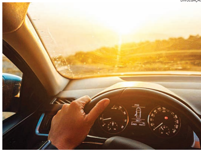
A exposição prolongada aos raios solares pode causar danos