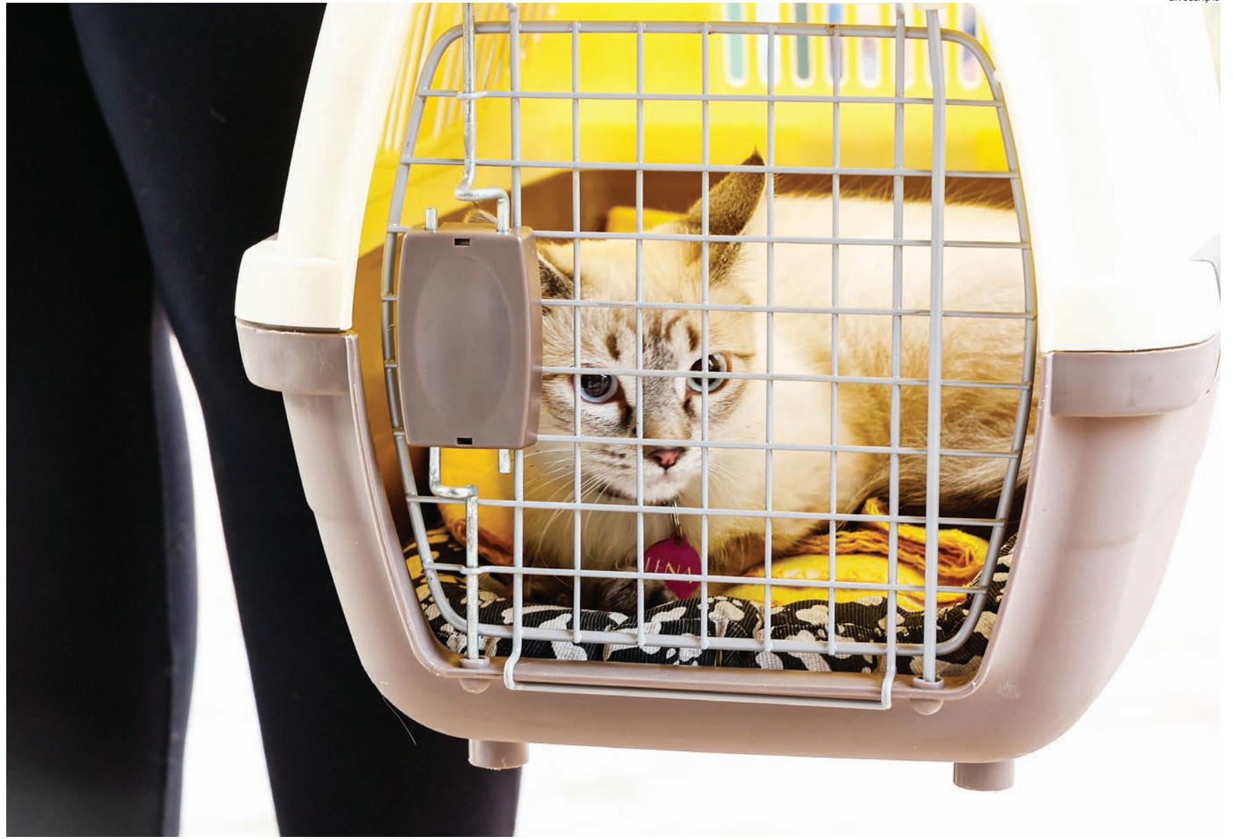
O objetivo do agendamento prévio, que será realizado das 8h30 às 16h na paróquia Santo Antônio de Pádua, é preencher as vagas disponíveis para aquela região.

Já foram realizadas 3,5 mil castrações, mas a meta é chegar a 5,1 mil até o fim do ano. O tutor interessado deve cadastrar-se pelo site da Prefeitura ou do DEBEA e aguardar o contato. É importante manter os números de telefone e e-mail sempre atualizados.