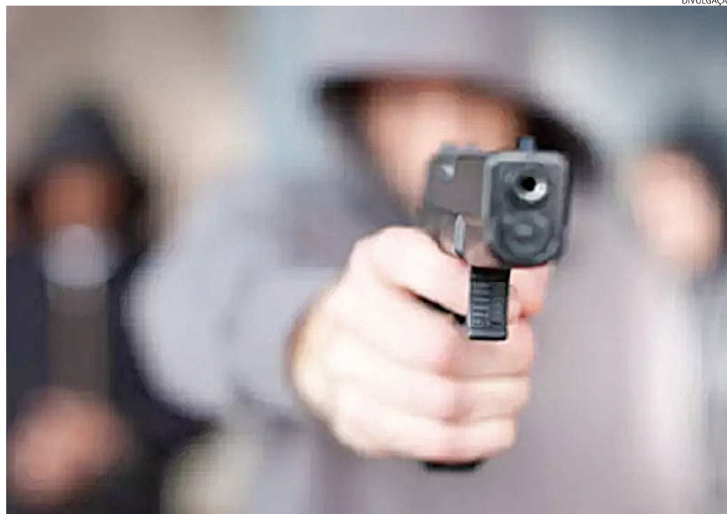
Ele foi rendido por dois bandidos e, no cativoiro, chegou um terceiro ladrão

No local, eles vasculharam o veículo atrás de aparelho rastreador, mas não encontraram. Pouco tem-