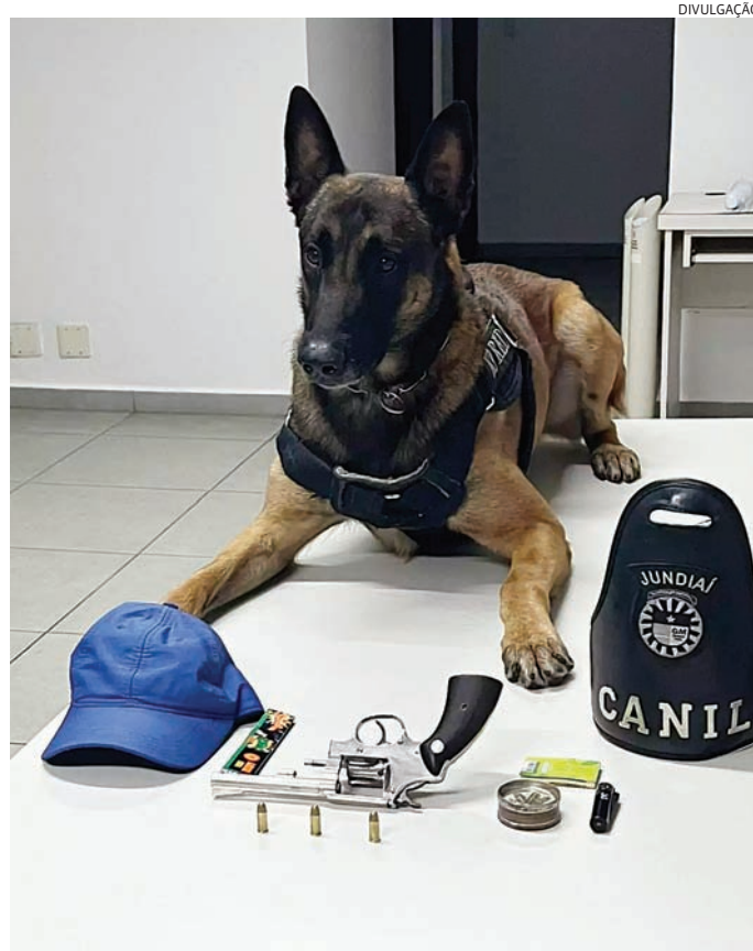
Arma foi apreendida e será periciada

De acordo com os guardas, ele disse que estava com a arma porque iria empre-