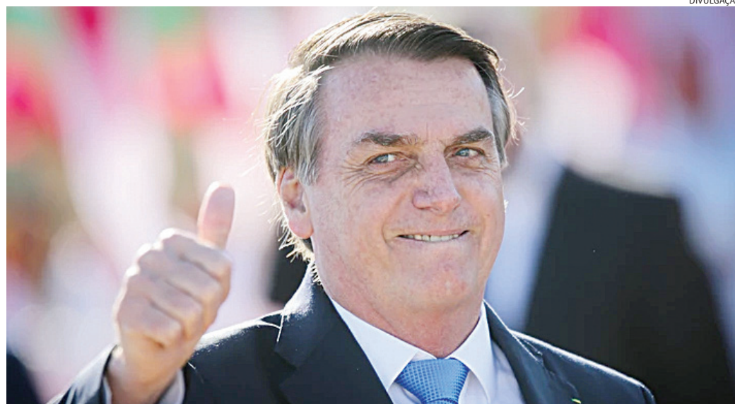
Mesmo sem poder se candidatar, Bolsonaro faz campanha no 2º turno