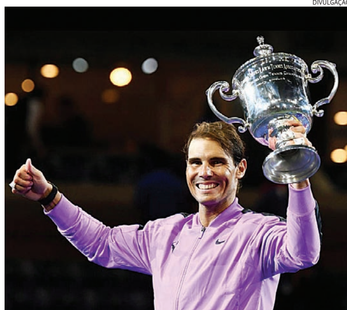
Nadal vinha sofrendo com problemas físicos nos últimos anos

“Rei de Paris”, Nadal participou do revezamento da tocha olímpica nos Jogos deste ano. O espanhol é o maior vencedor em Roland Garros, com 14 títulos. Tem dois ouros olímpicos, tendo ganhado em 2008 no simples e em 2016 nas duplas. Foi porta-bandeira da Espanha nas Olimpíadas do Rio. Nadal vinha sofren-