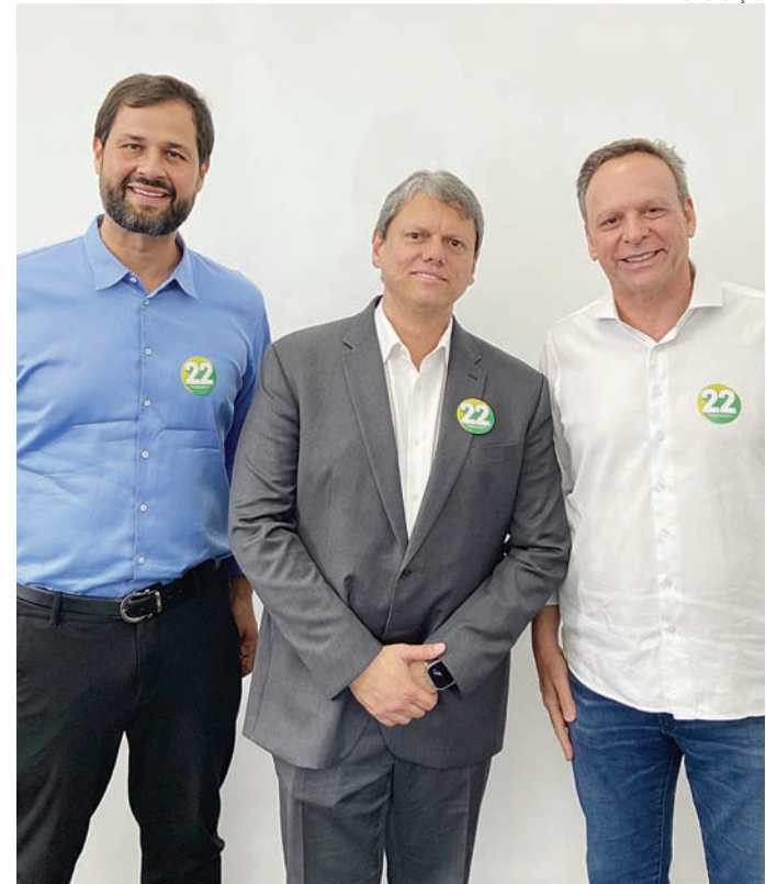
Governador Tarcísio apoia Parimoschi e reforça parcerias

to estratégico de Jundiaí, como saúde, na educação, atração de investimentos produtivos e formação de mão de obra dos nossos jovens. Também lembro do projeto de municipalização do segundo ciclo da educação e o Centro de Referência do Autismo. A confiança do governador demonstra que estamos no caminho certo, com projetos sólidos e uma visão de desenvolvimento que beneficia nossa população em diversas áreas”, reforçou Parimoschi.