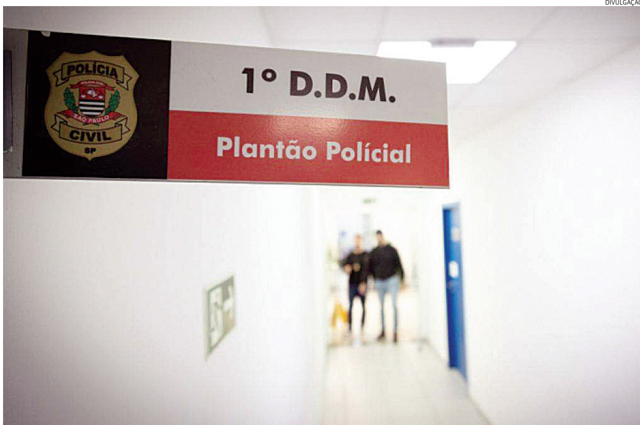
Cerca de 75% dos casos não tinham nenhum boletim de ocorrência prévio

Os serviços da Delegacia de Defesa da Mulher (DDM) do Estado de São Paulo registraram, entre janeiro e agosto de 2024, 65 mil pedidos à Justiça de medida protetiva de urgência para vítimas de violência doméstica e familiar. O número representa uma média