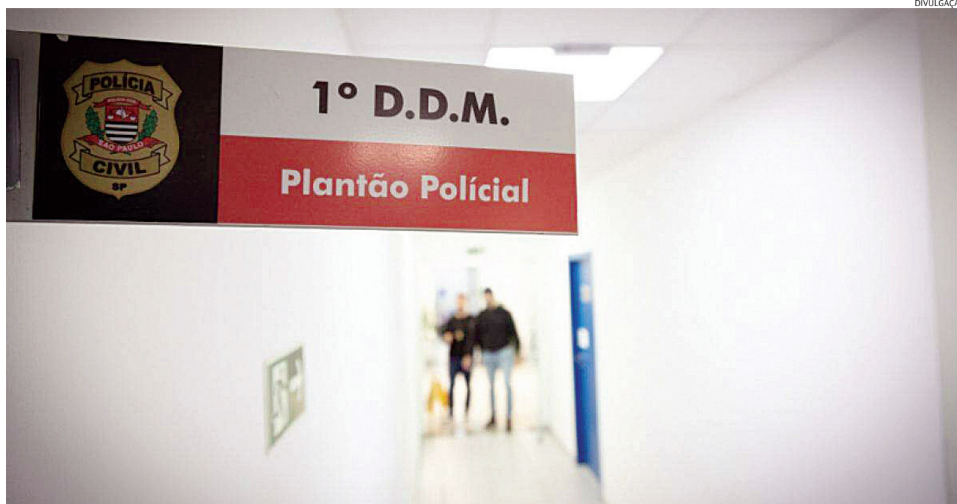
Dados da DDM apontam para um aumento de quase 57% das solicitações de medidas protetivas para vítimas de violência doméstica em 2024

Segundo a Secretaria da Segurança Pública, quatro a cada cinco vítimas de feminicídio no estado em 2023 não possuíam medidas pro-