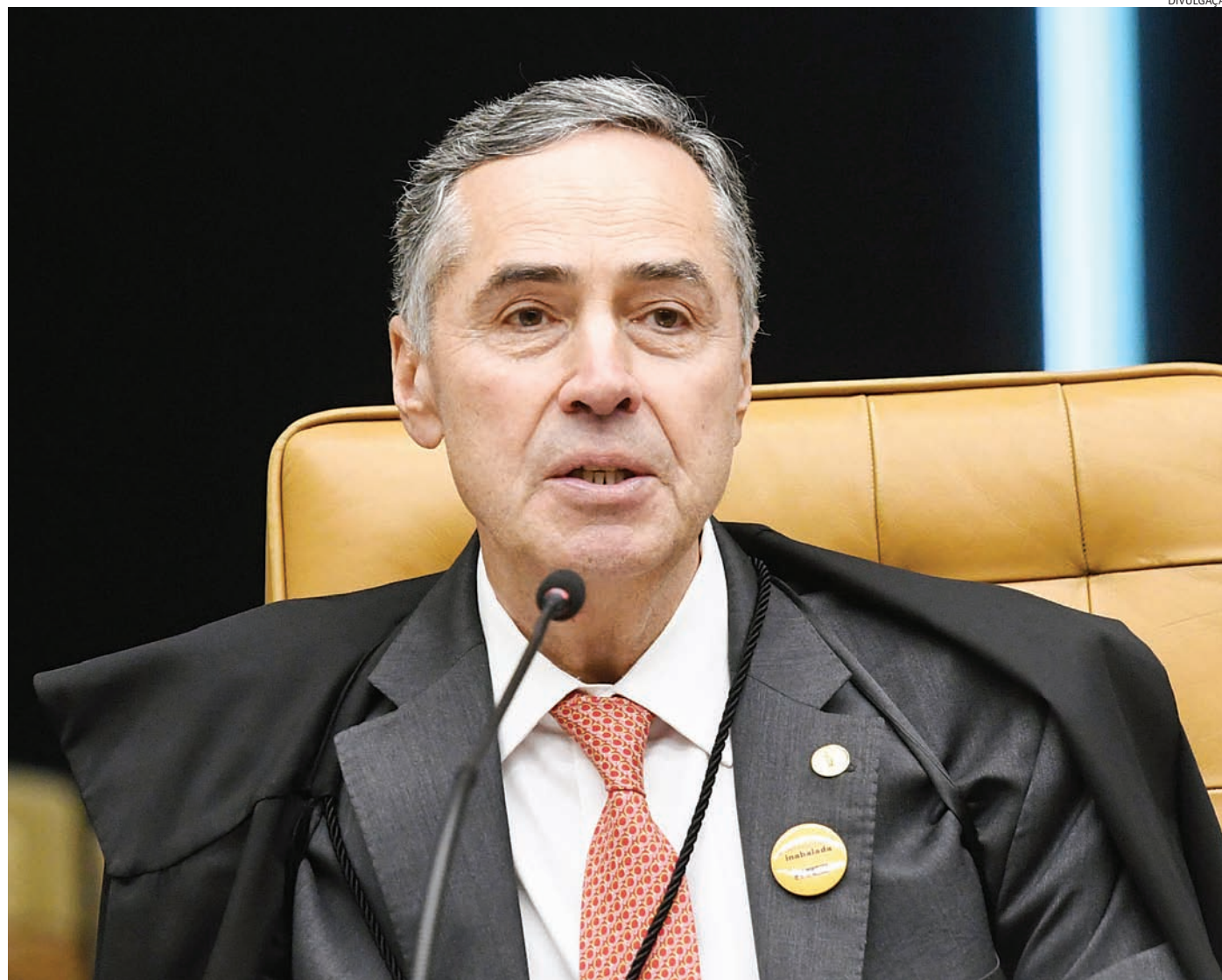
Ministro Barroso afirma que não se mexe em instituições que estão funcionando

“Se o propósito de uma Constituição é assegurar o governo da maioria, o Estado de direito e os direitos fundamentais, e se o seu guardião é o Supremo, chega-se à reconfortante constatação de que o tribunal cumpriu o seu papel e serviu bem ao país nesses 36 anos de vigência da Carta