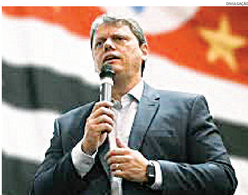
Governador Tarcísio afirma que Jundiaí irá receber novas parcerias