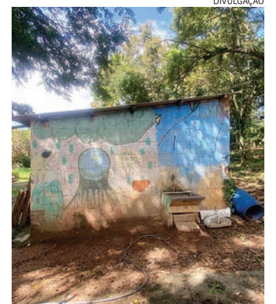
A Casa de Nazaré acolhe jovens encaminhados pela Justiça

A Casa de Nazaré, uma associação beneficente de Jundiaí, em parceria com a ONG Sonhar Acordado, está lançando um projeto de reforma para revitalizar o bosque no quintal da instituição, proporcionando um espaço de lazer seguro para crianças e adolescentes em situação de vulnerabilidade social. A iniciativa conta com a participação de engenheiros e voluntários e busca doações de materiais para que o projeto se torne realidade.