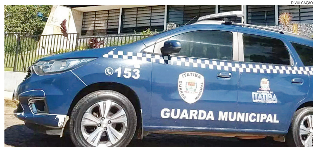
Os suspeitos tentaram fugir, mas acabaram presos pela Guarda Municipal