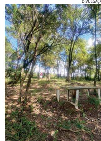
Com a reforma, o espaço será transformado em um local de convivência adequado

O bosque, que atualmente se encontra abandonado e acumulando resíduos, apresenta riscos físicos devido a bancos quebrados e o terreno irregular. Com a reforma, o espaço será transformado em um local de convivência adequado, onde as crianças poderão brincar e relaxar com segurança. O projeto inclui a limpeza do terreno, o plantio de nova vegetação, a construção de caminhos pavimentados e