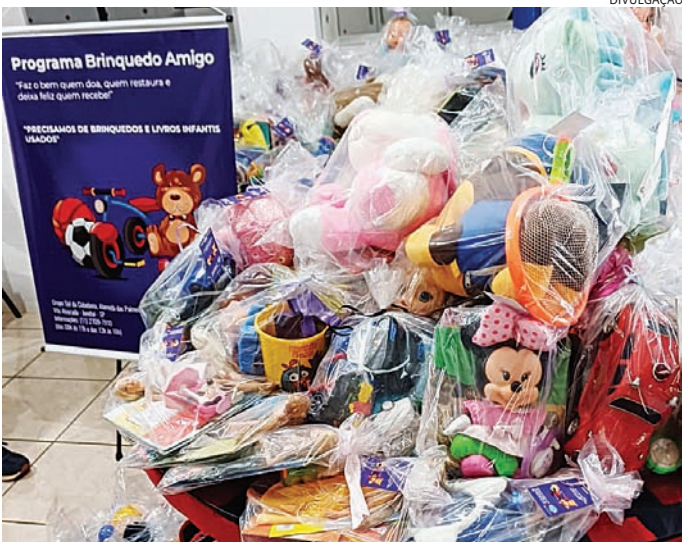
As instituições pedem que os brinquedos estejam em bom estado

Outra iniciativa vem do Jardim Fepasa, onde líderes comunitários organizam um movimento carinhoso: atender os pedidos de brinquedos das crianças do bairro. Antes, elas pediam ajuda nos semáforos da Avenida Frederico