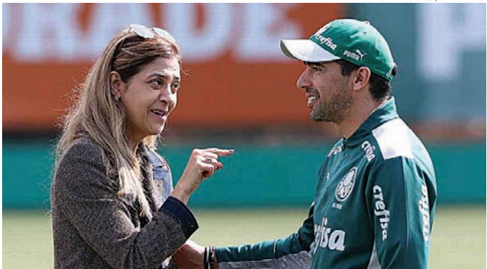
A manutenção do trabalho é tratada como essencial pela diretoria

A preparação para a decisão contra o Flamengo, porém, trouxe outra atmosfera. Houve conversas longas entre diretoria e comissão técnica, e a avaliação interna era de que Abel havia conseguido reorganizar o foco e a concentração do elenco. A percepção na véspera, no hotel de Lima, era positiva. Havia a sensação de que o time