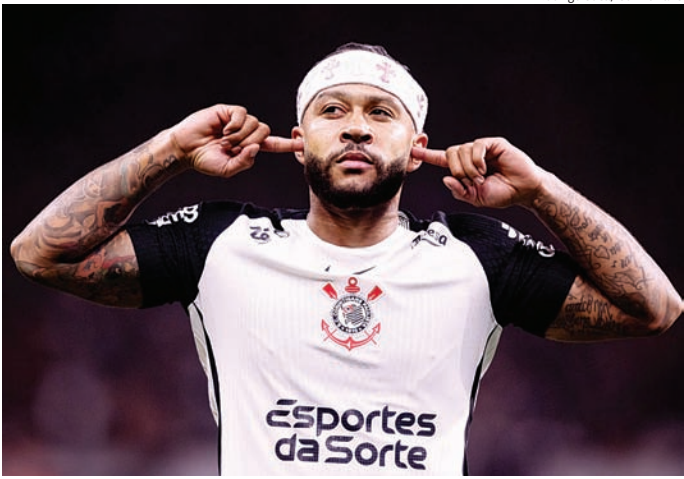
O Timão busca recuperar Depay com foco nas semifinais

O Corinthians busca recuperar Depay, com foco nas semifinais da Copa do Brasil, contra o Cruzeiro. O camisa