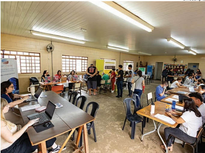
Empresas de vários segmentos estarão juntas para ofertar as vagas

A ação contará com a presença das empresas Delfos e Mercado Livre, que estarão no local para selecionar candidatos para diversas vagas. Além disso, uma instituição qualificadora especializada em programas de Menor Aprendiz também participará do atendimento, oferecendo orientação e encaminhamento para jovens interessados em iniciar sua carreira com capacitação profissional. A diretora de Fomen-