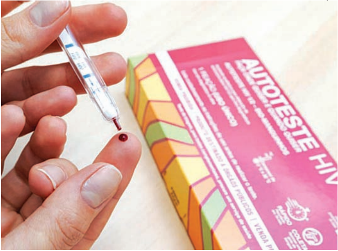
Os testes gratuitos são feitos diretamente na sede do CTA

A campanha, promovida em todo o Estado de São Paulo há 18 anos, tem como obje-