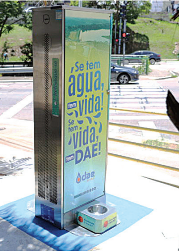
Os primeiros totens estão localizados na avenida 9 de Julho

“Queremos facilitar o acesso à água de qualidade e incentivar hábitos sustentáveis. A instalação des-