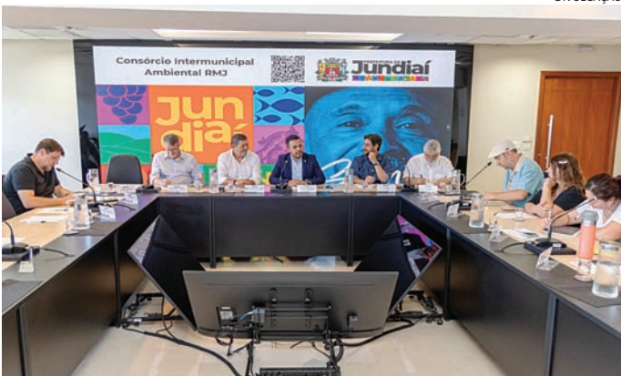
Representantes das prefeituras se reuniram integrantes do Estado