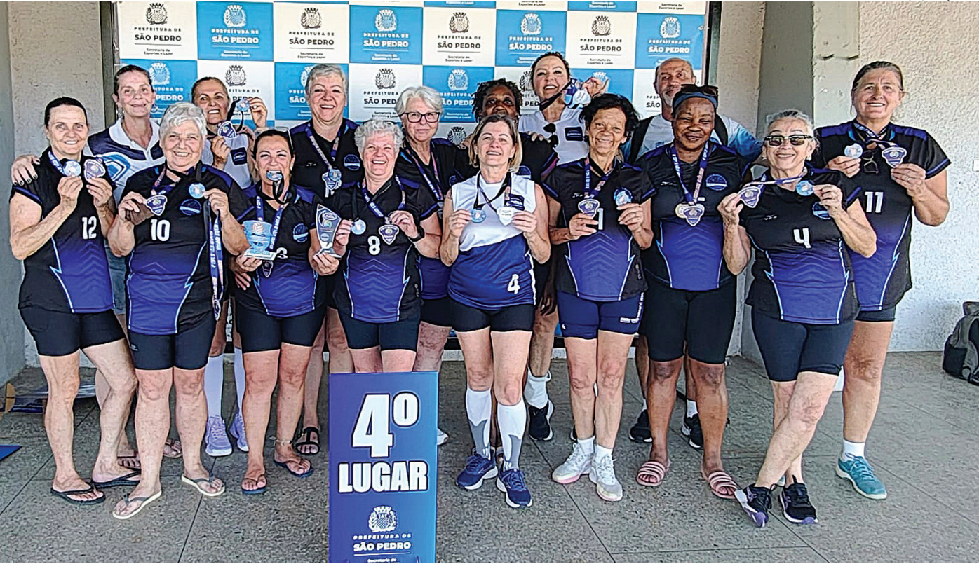
Equipe 60+ terminou em 4º lugar no torneio disputado em São Pedro