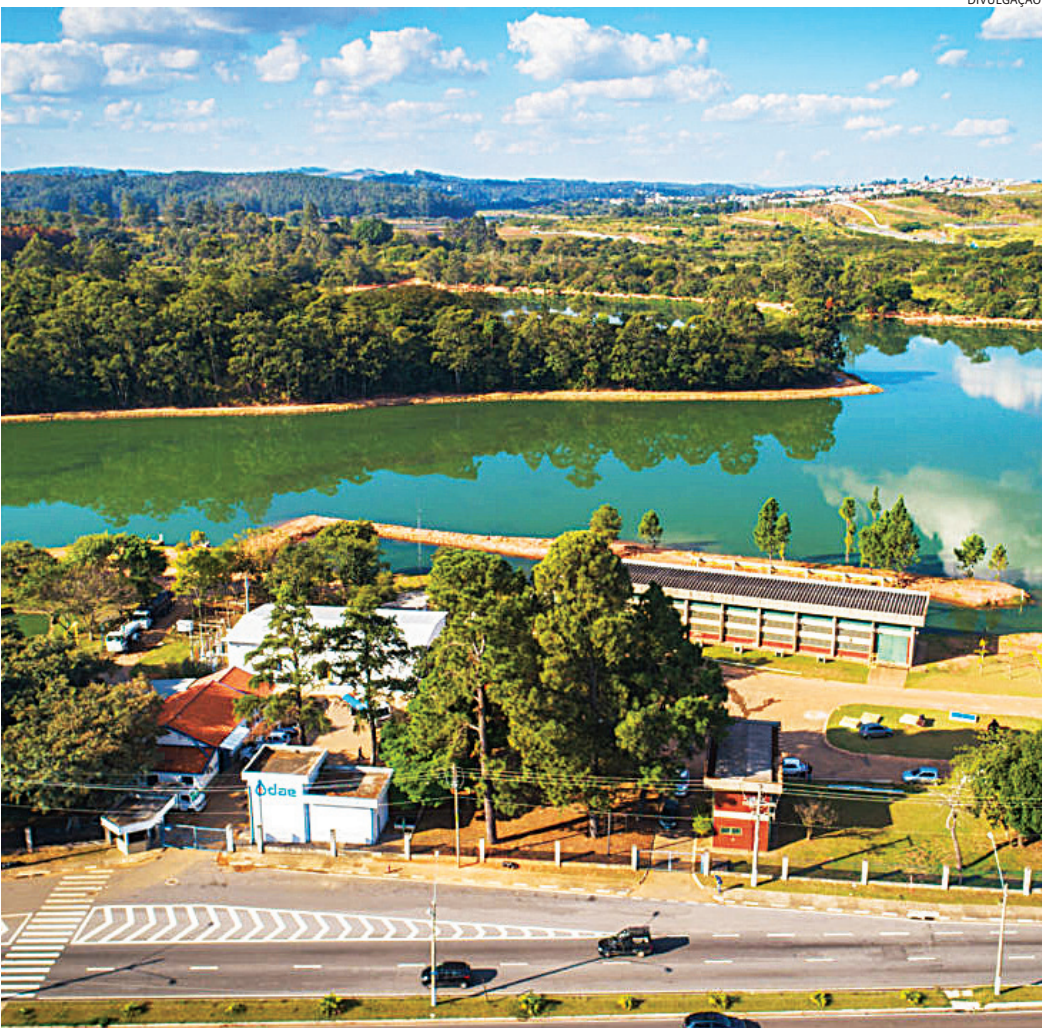
Represa de Jundiaí está com 66% da capacidade e demanda atenção, apesar de situação ser estável

bém é de estabilidade. A Sabesp informa que o abastecimento em Campo Limpo Paulista, Várzea Paulista, Itupeva, Jarinu e Cabreúva segue normal. Segundo a companhia, as vazões dos mananciais continuam suficientes para atender à demanda, graças à recupera-