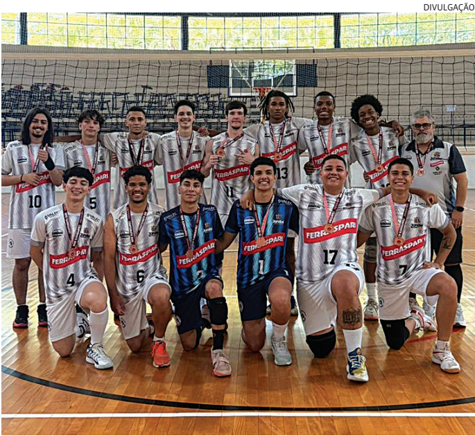
Jovens do sub-21 venceram a equipe de Itapevi por 3 sets a 0