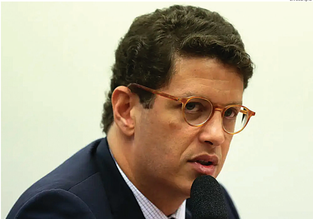
Ricardo Salles pode se reaproximar do PL e tentar uma vaga