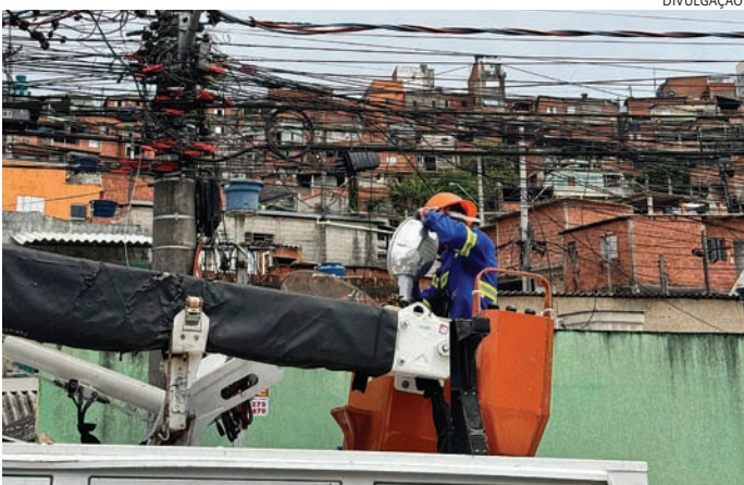
Nova iluminação no bairro começa a ser instalada e auxilia na revitalização

A Polícia Federal (PF) deflagrou nesta terça-feira (19) a Operação Lei do Retorno para desarticular uma organização criminosa suspeita de desviar mais de R$ 50 milhões de recursos do Fundo de Manutenção e Desenvolvimento da Edu-