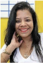
SIMONE DE OLIVEIRA