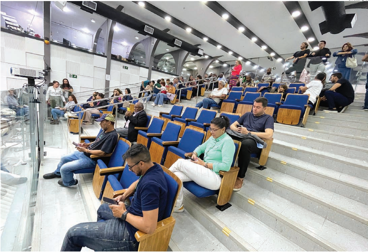
Câmara não recebeu grande público para sessão em clima de paz