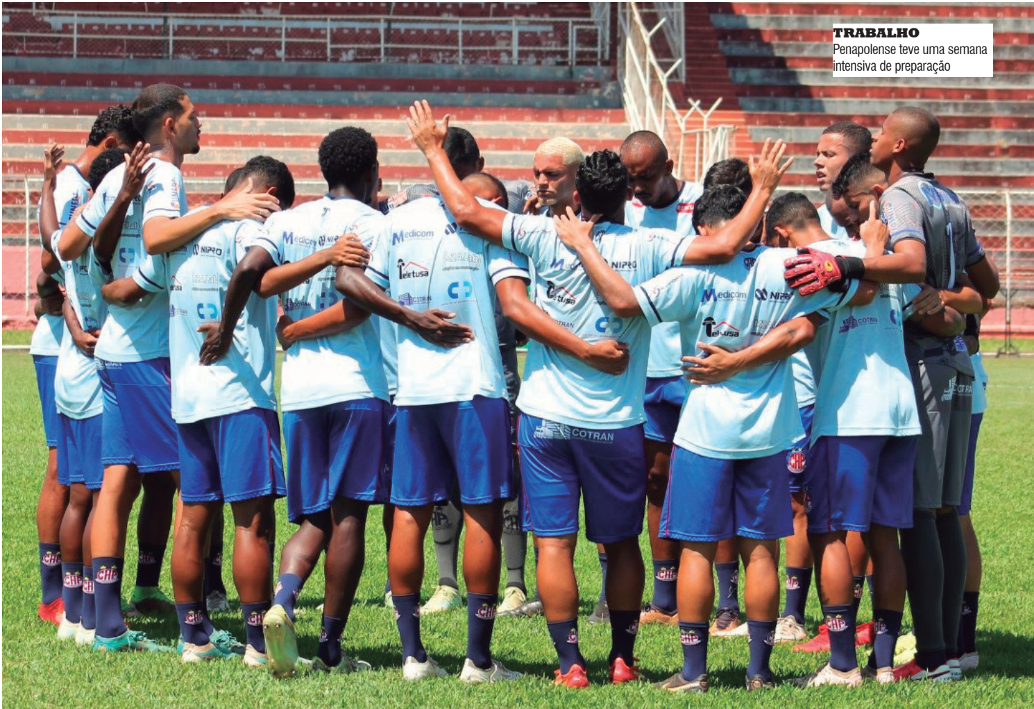
TRABALHO Penapolense teve uma semana intensiva de preparação