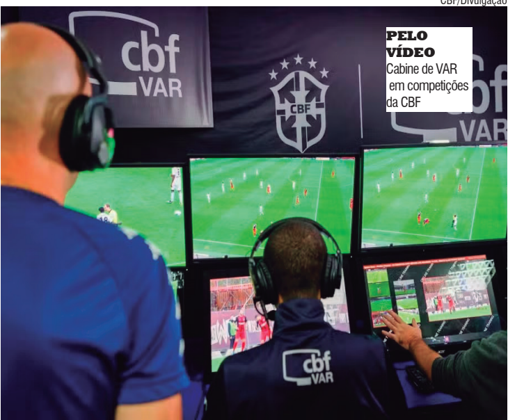
PELO VÍDEO Cabeine de VAR em competições da CBF

A comunicação das decisões chegou a ser testada recentemente no Mundial de Clubes da Fifa