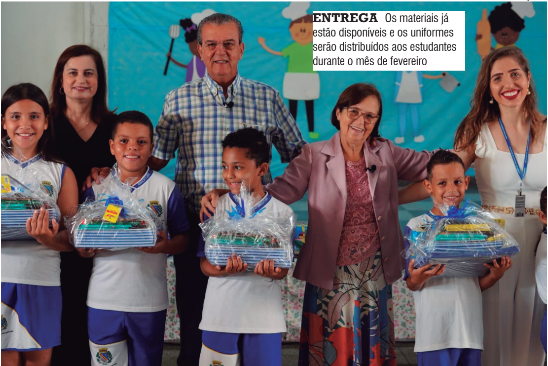
ENTREGA Os materiais já estão disponíveis e os uniformes serão distribuídos aos estudantes durante o mês de fevereiro