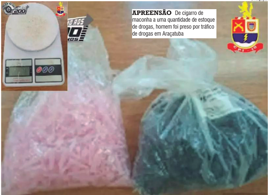
APREENSÃO De cigarro de maconha a uma quantidade de estoque de drogas, homem foi preso por tráfico de drogas em Araçatuba

“A entrega desse material e uniformes representa o compromisso com a educação, um investimento no futuro de nossa cidade”, discursou o prefeito.