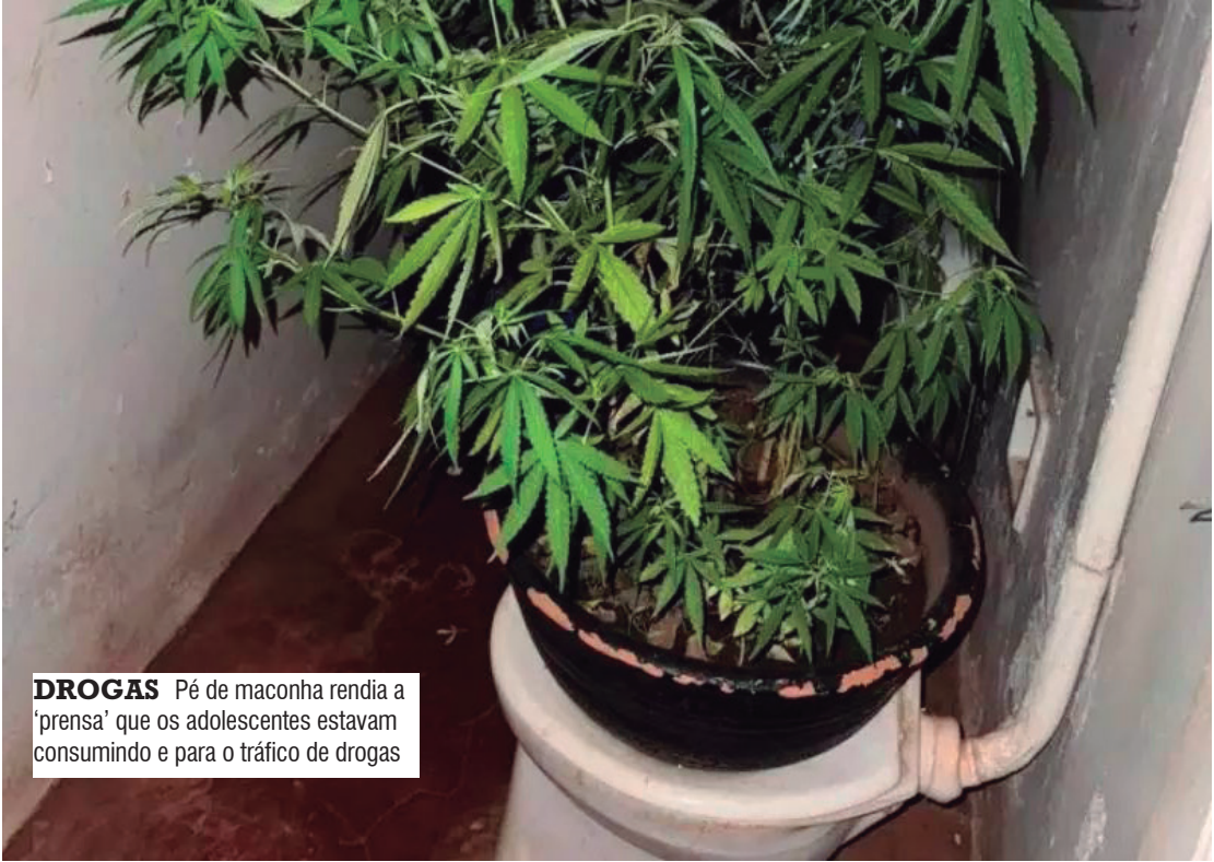
DROGAS Pé de maconha rendia a 'prensa' que os adolescentes estavam consumindo e para o tráfico de drogas

Diante dos fatos, todos, incluindo o pé de maconha, foram encaminhados ao distrito policial, onde o adolescente de 15 anos foi apreendido por ato infracional de tráfico de entorpecentes e encaminhado à Fundação Casa de Araçatuba. Já o segundo adolescente, de 16 anos, foi ouvido e liberado após o registro de infracional de posse ilegal de entorpecente.