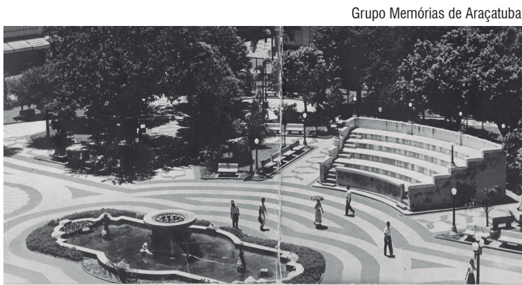
Praça Rui Barbosa