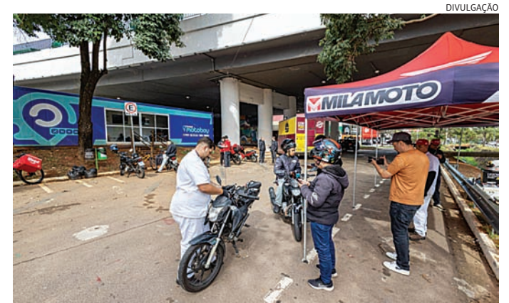
A ideia do ‘pit stop’ é dicas sobre condução inteligente no trânsito

O Pit Stop voltará a ocorrer nas outras segundas-feiras de maio (dias 18 e 25), também com a entrega de brindes, sorteios e ações de conscientização.