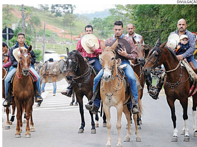
A Romaria Diocesana já é tradição em Jundiaí e no Estado

Entre as pautas discutidas estiveram as ações integradas entre as secretarias municipais e a organização da Romaria, com foco na segurança, mobilidade e acolhimento dos romeiros ao longo de todo o