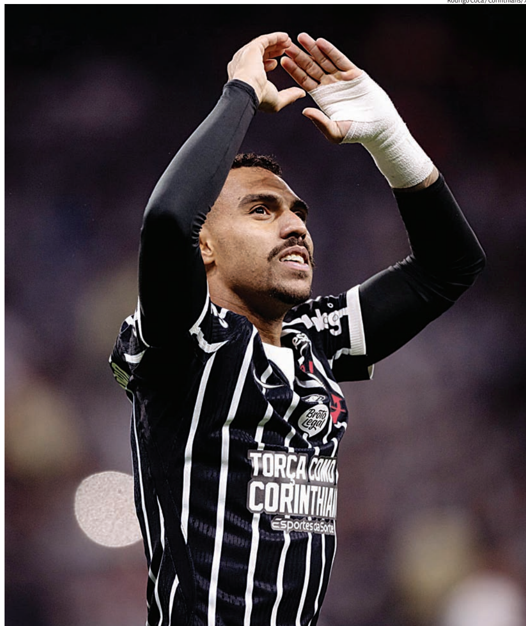
No confronto de ida, disputado em Santa Catarina, o Corinthians conquistou vantagem e agora joga em casa

A partida terá transmissão da Amazon Prime Video. Além da vaga na próxima fase, o confronto vale premiação milionária, considerada importante para o planejamento financeiro dos dois clubes ao longo do ano.