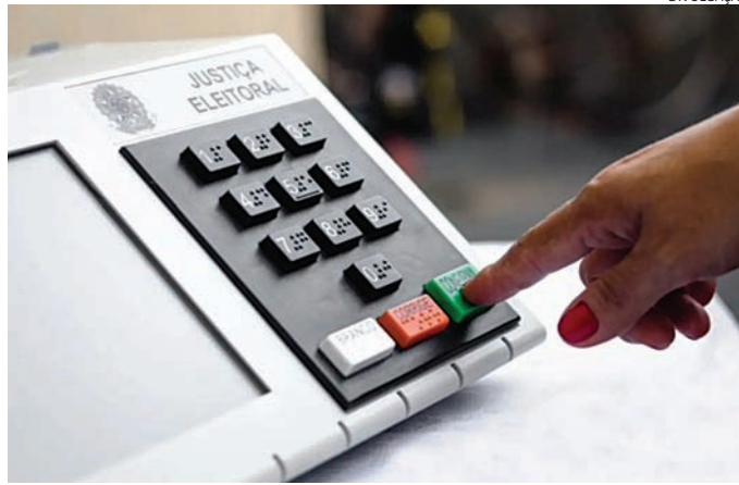
Fim da reeleição volta a ser discutido entre as lideranças políticas