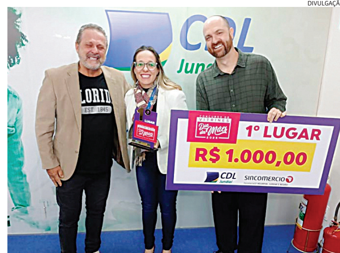
O incentivo buscou ainda o fortalecimento do comércio local