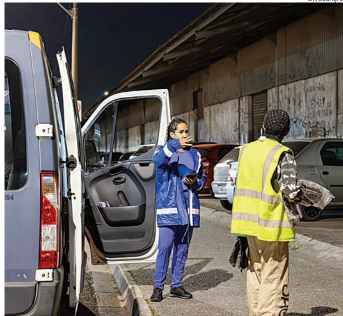
Ainda não foi identificado um aumento expressivo na busca dos serviços

Com o Centro Pop reformado, também há maior disponibilidade de vagas para o pernoite. Além de melhores condições físicas e estruturais, esta população passa por atendimento técnico na manhã seguinte.