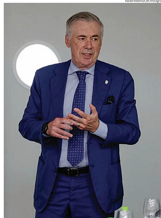
Jogadores fora da relação inicial ainda podem disputar a Copa

A lista final da Seleção Brasileira deve ser anunciada nas próximas sema-