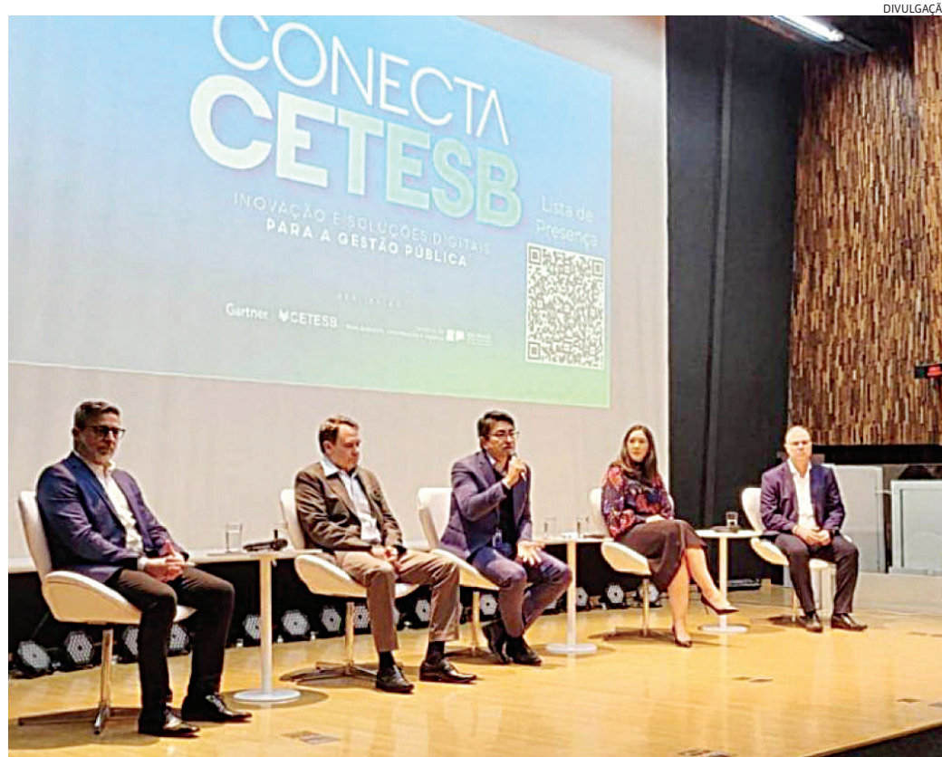
A ferramenta integra informações e organiza o fluxo de análises