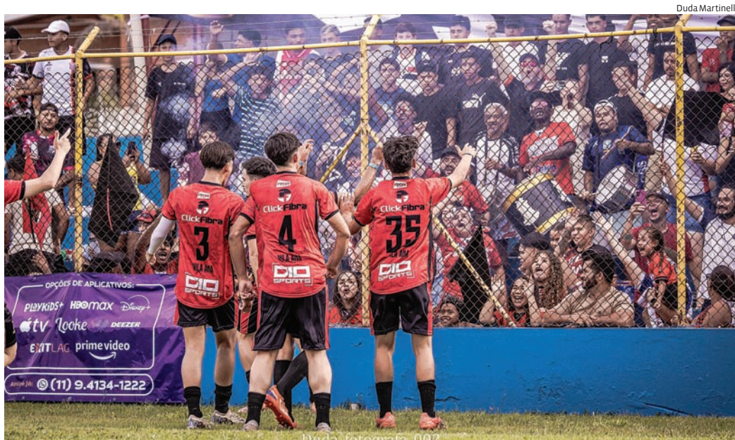
Quartas do masculino e rodada feminina agitam Jundiaí pela competição

fim de semana completam a rodada decisiva da primeira fase. Água Doce enfrenta Igoturucaia e Jardim Antonieta joga contra FEPASA no sábado. No domingo, Novo Horizonte encara Vila Ana, enquanto Vila Esperança mede forças com o Complexo Santa Gertrudes. A organização espera grande presença de público nas arquibancadas e partidas equilibradas na reta decisiva do torneio.