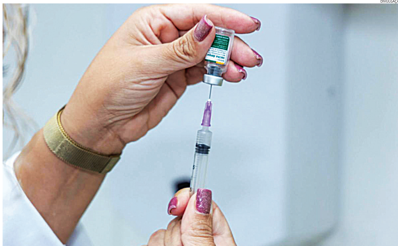
O imunizante contra a dengue do Instituto Butantan (Butantan-DV) está disponível, neste momento, em dose única

O imunizante contra a dengue do Instituto Butantan (Butantan-DV) está disponível, neste momento, em dose única. A vacinação também continua para crianças e adolescentes entre 10 e 14 anos, em esquema de duas doses com o imunizante QDenga. Segundo a unidade, a definição da faixa etária segue critérios técnicos e regulatórios da Anvisa. As faixas etárias podem ser ampliadas futuramente, conforme novos estudos científicos