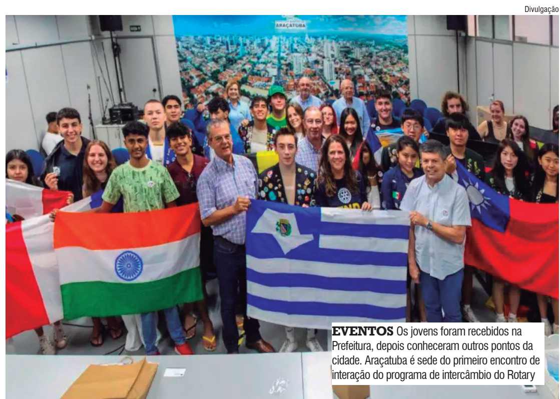
EVENTOS Os jovens foram recebidos na Prefeitura, depois conheceram outros pontos da cidade. Araçatuba é sede do primeiro encontro de interação do programa de intercâmbio do Rotary