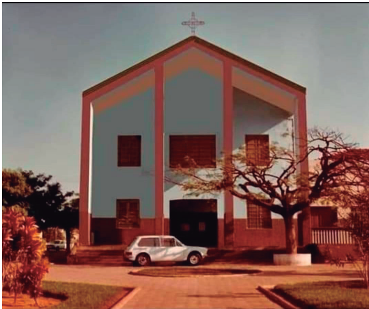
Paróquia do bairro Paraíso