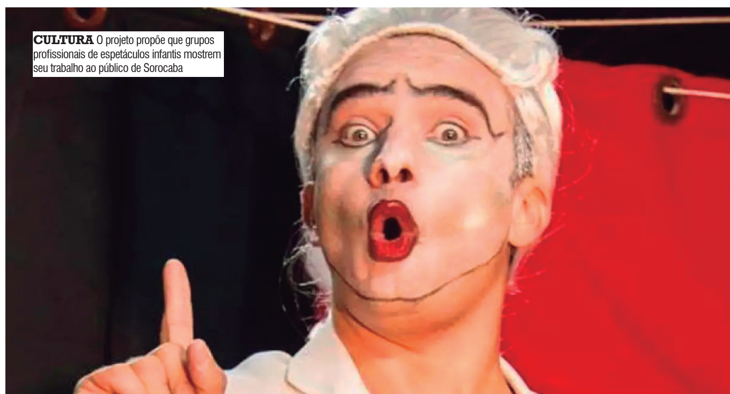
CULTURA O projeto propõe que grupos profissionais de espetáculos infantis mostrem seu trabalho ao público de Sorocaba

A realização do festival é da Pri Produção Artística que foi contemplada com recursos da LINC 2023, da Secretaria de Cultura de Sorocaba.