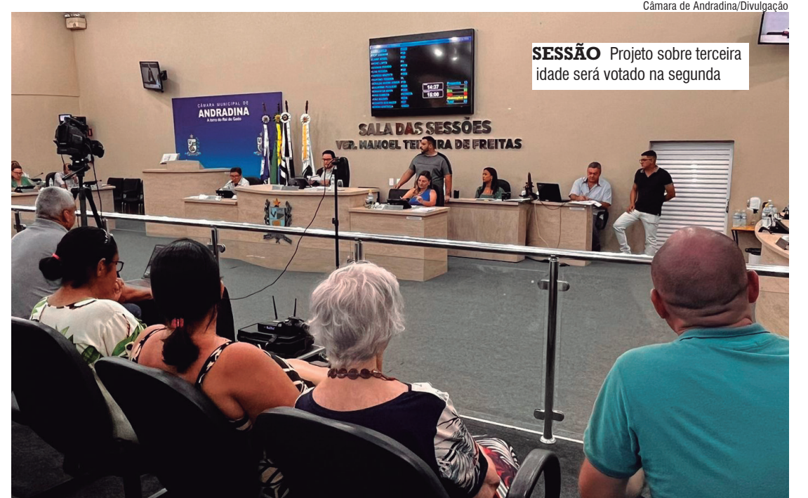
SESSÃO Projeto sobre terceira idade será votado na segunda