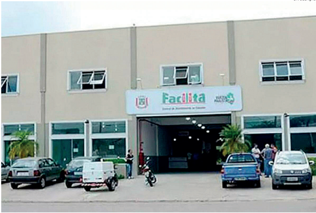
O cadastro é feito no Facilita, com apresentação de requerimento preenchido e também cópias de documentos