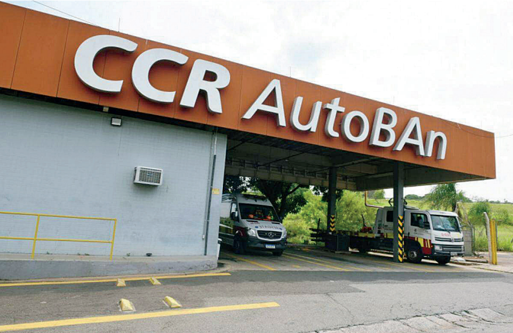
A CCR AutoBan informa o cronograma das obras que serão executadas no Sistema Anhanguera-Bandeirantes

Dia: 03 de agosto (sábado) Horário: Das 9h às 12h Local: Hub do Anchieta – av. Odila Azalim, 575 (Prédio Administrativo – térreo), Vila Jundiainópolis - Jundiaí Modelo Híbrido: online e presencial Inscrições pelo Sympla: https://www.sympla.com.br/2-cafe-paliativo-integrativo---online__2571314 Presencial: https://www.sympla.com.br/2-cafe-paliativo-integrativo---presencial__2571304