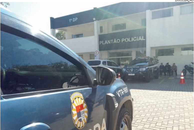
Morador acionou a GM para notificá-la sobre a idosa abandonada e pedindo socorro

MODULINHO: CLASSIFICADOS QUE TODO MUNDO LÊ