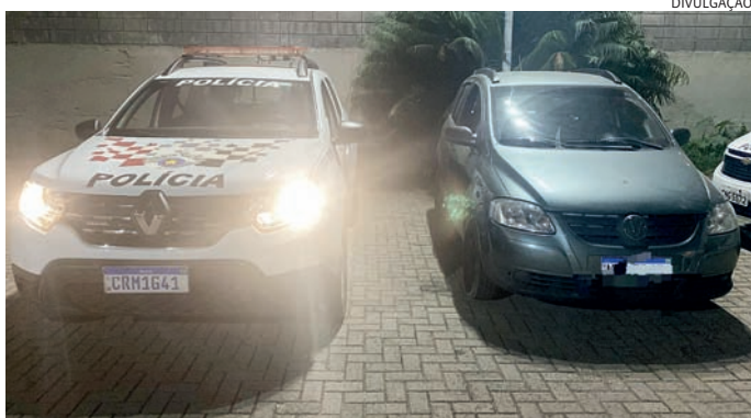
O carro foi recuperado e devolvido ao proprietário

Os suspeitos não obedeceram a ordem e saíram em fuga, dando início à perseguição, que acabou na avenida Nami Azem, onde os ocupantes do veículo invadiram uma chácara e desembarcaram, correndo para uma área de mata. Os PMs foram atrás e conseguiram deter um dos suspeitos.