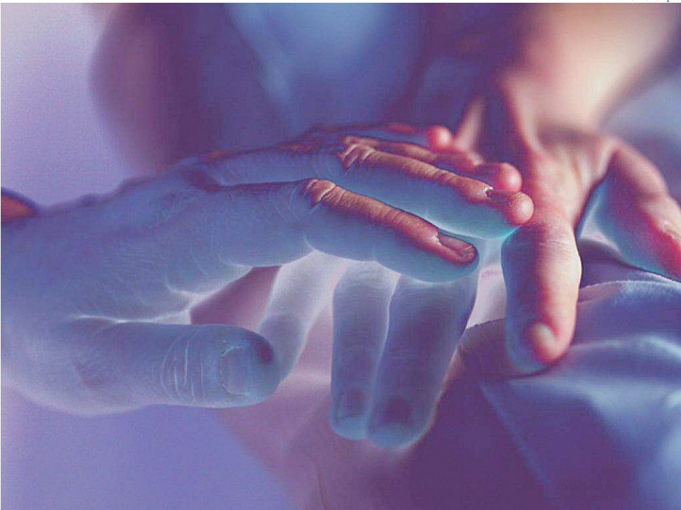
Desde 2020, o município teve 22 pessoas que morreram sem identificação, 20 homens e uma mulher

O objetivo é que pessoas que procuram por entes desaparecidos possam fazer a consulta ao banco para, talvez, identificar algum dos óbitos sem registro. Assim, podem ter uma resposta sobre o ente que desapareceu e findar buscas, que podem durar décadas. Uma vez confirmada a identidade, a família poderá pedir ao cartório, por meio do site, a emissão da certidão de óbito – que também tem os dados do boletim de ocorrência.