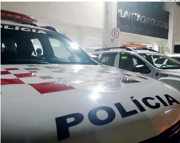
Uma funcionária da papelaria deteve o suspeito e acionou a PM

Outro funcionário, porém, não permitiu e acio-