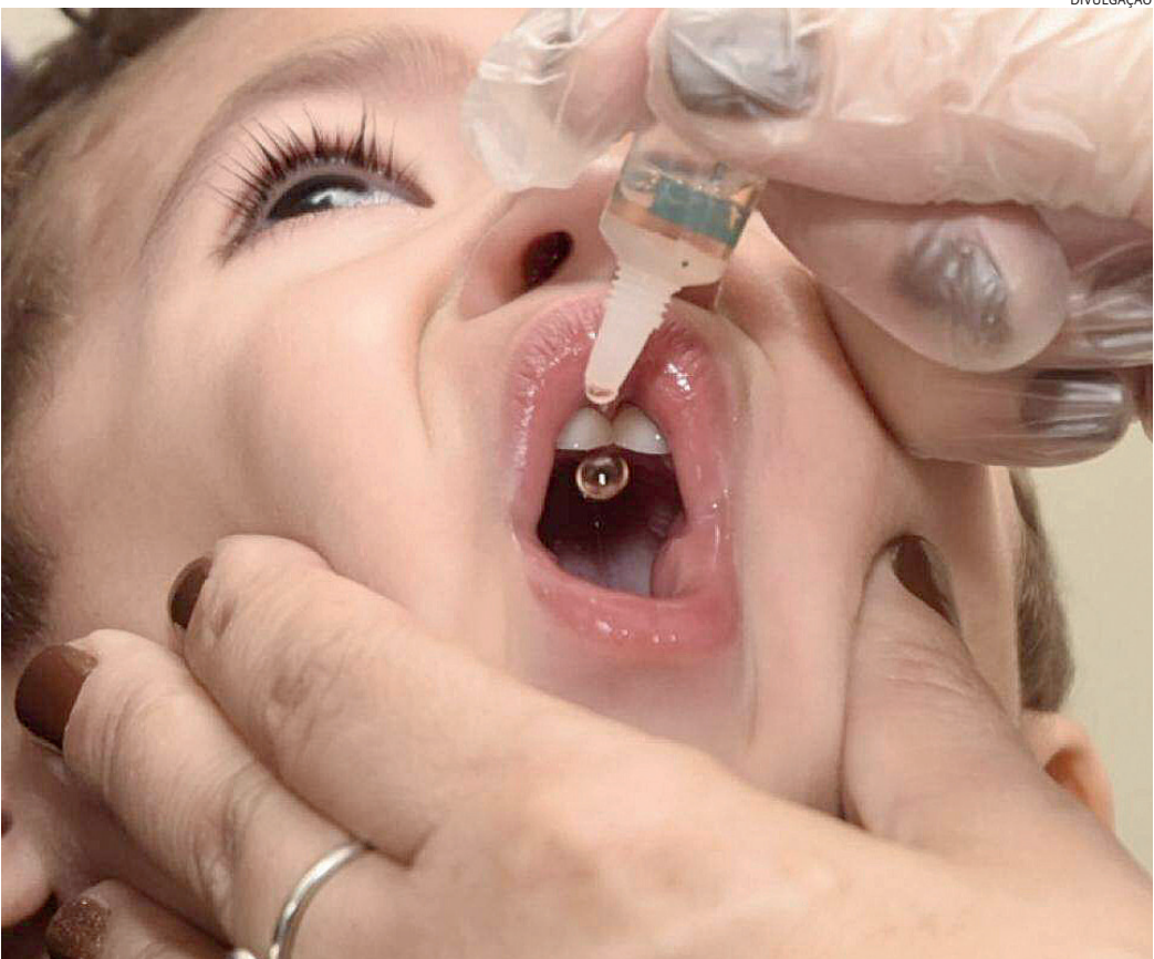
Com coberturas vacinais aquém das estabelecidas, a busca casa a casa oferecerá os imunizantes

Monitoramento das Estratégias de Vacinação (MEV) contra a Poliomielite e o Sarampo no Brasil faz parte dos compromissos assumidos com os países-membros da OPAS para a erradicação da poliomielite e a eliminação do sarampo, em conformidade com as recomendações da Organização Mundial da Saúde (OMS) e das suas respectivas Comissões Globais e Regionais. Esta metodologia permite avaliar o progresso das atividades realizadas e identificar locais com fragilidade de cobertura das ações de vacinação por meio do rastreamento e da vacinação de crianças menores de 5 anos de idade ainda não vacinadas.