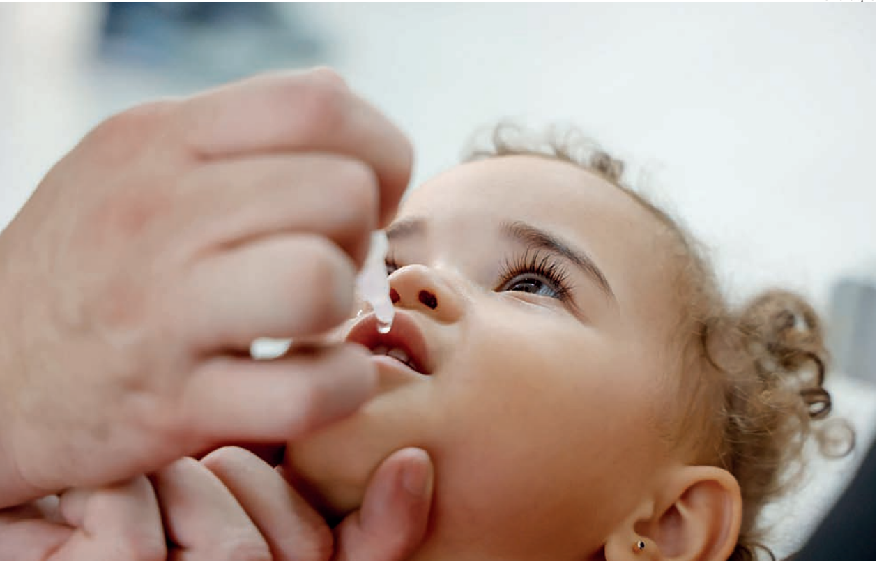
Vacina contra a paralisia infantil tem esquema de duas gotas, exclusivamente oral