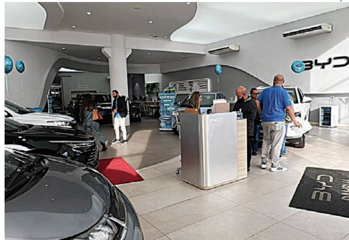
Os eletrificados passaram a disputar um público mais consistente