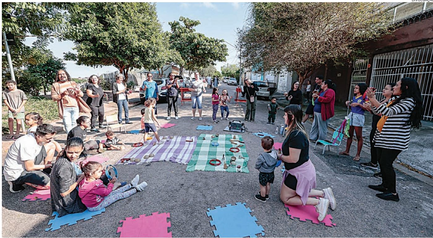
O encontro terá educadores e gestores de diversos municípios

Em Jundiaí, a programação irá destacar as experiências desenvolvidas no município, como o Comitê das Crianças, a Fábrica das Infâncias Japy, o Mundo das Crianças e o Centro Internacional de Estudos, Memórias e Pesquisas da Infância (CIEMPI), além de ações voltadas à participação infantil, educação e inclusão. O evento terá como base os princípios da Convenção sobre os Direitos da Criança da ONU, especialmente o