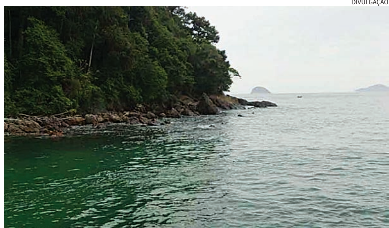
A ocorrência foi registrada como morte suspeita

do e planejavam retornar para Jundiaí logo depois. Porém, enquanto estavam juntos no mar, uma onda os separou e o corpo foi encontrado posteriormente pelos Bombeiros. Polícia 6