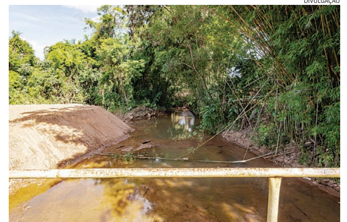
As ações incluem desassoreamento de rios e córregos e limpeza de galerias

Os trabalhos de desassoreamento são executados em áreas urbanas e rurais. Paralelamente, as equipes realizam a limpeza de bocas de lobo e o hidrojateamento das galerias pluviais que desembocam diretamente nos córregos e rios da cidade.