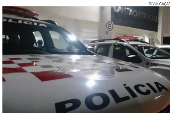
A PM foi chamada pela filha da vítima

O homem foi detido e negou as acusações. As partes foram conduzidas ao Plantão Policial, onde o marido foi preso em flagrante.