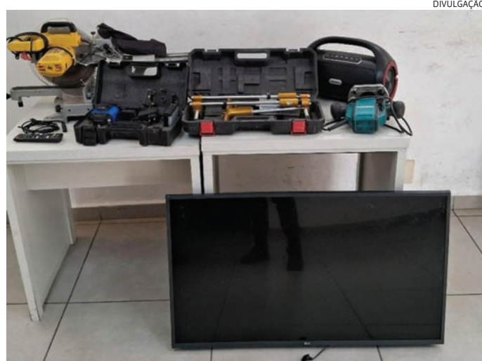
Foram recuperados uma TV, notebooks, além de outros itens

Durante a tentativa de abordagem, um deles arremessou a TV em um dos guardas e correu, sendo acompanhado pelo comparça. Ambos se jogaram em