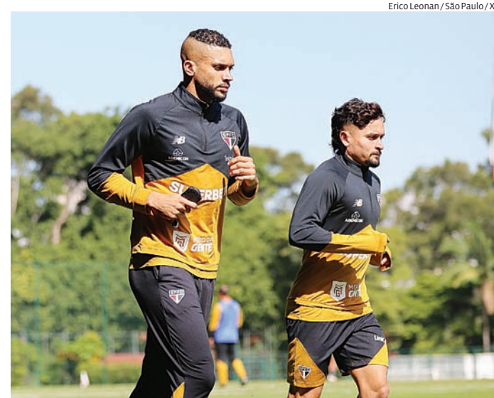
Erico Leonan / São Paulo / X

O confronto terá transmissão do Sportv e Premiere. A classificação para a próxima fase garante premiação milionária aos clubes, aumentando a importância do duelo em Caxias do Sul.