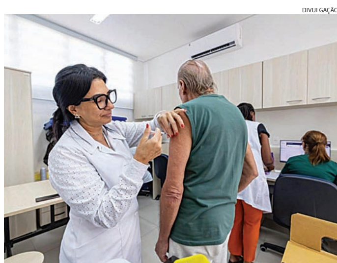
Os estoques estão reabastecidos para os grupos prioritários