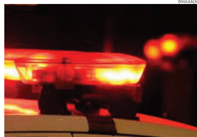
Na delegacia, ele demonstrou arrependimento

No dia seguinte, a jovem contou à mãe sobre as ameaças. Ao retornar do tra-