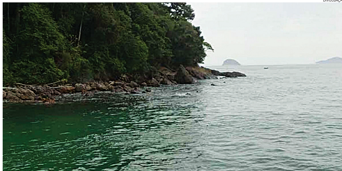
O Corpo de Bombeiros foi acionado e durante as buscas encontrou o corpo do homem

O Corpo de Bombeiros foi acionado e durante as buscas encontrou o corpo do homem. A ocorrência foi registrada como morte suspeita.