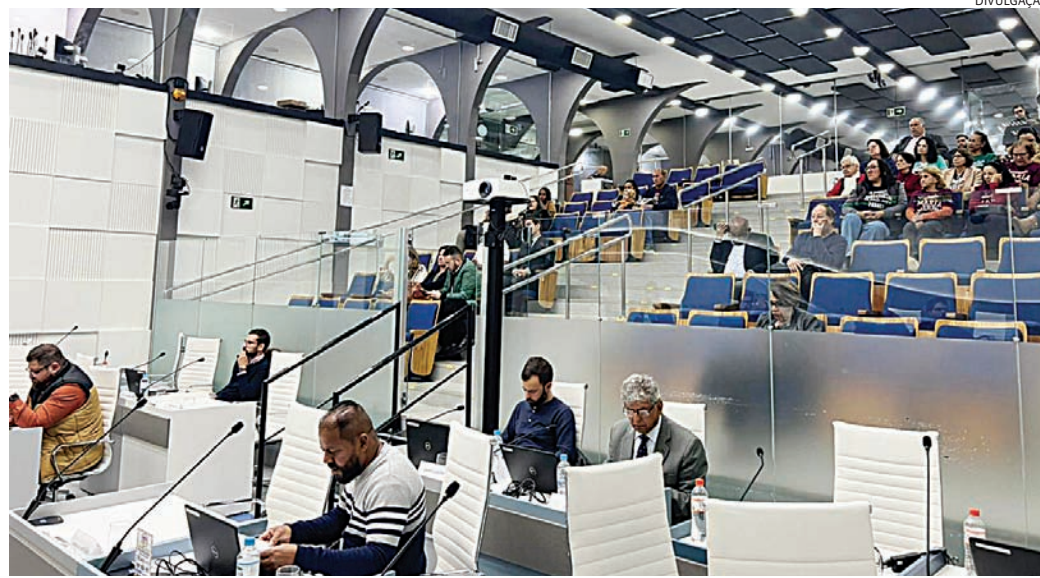
Sessão da Câmara foi rápida, com aprovação de gratificação a funcionários públicos

Na área da saúde e assistência social, o projeto nº 15.219/2026, de autoria de Leandro Basson (PODE), prevê medidas de humanização do tratamento de pessoas com câncer e familiares, como oferta de toucas de resfriamento capilar para reduzir a queda de cabelo causada pela quimioterapia, atendimento prioritário em serviços públicos e privados, vagas exclusivas de estacionamento e incentivo à criação de casas de apoio para pacientes e acompanhantes. Segundo o autor, “é um projeto que procura humanizar, tratar e trazer direitos para pessoas com câncer no