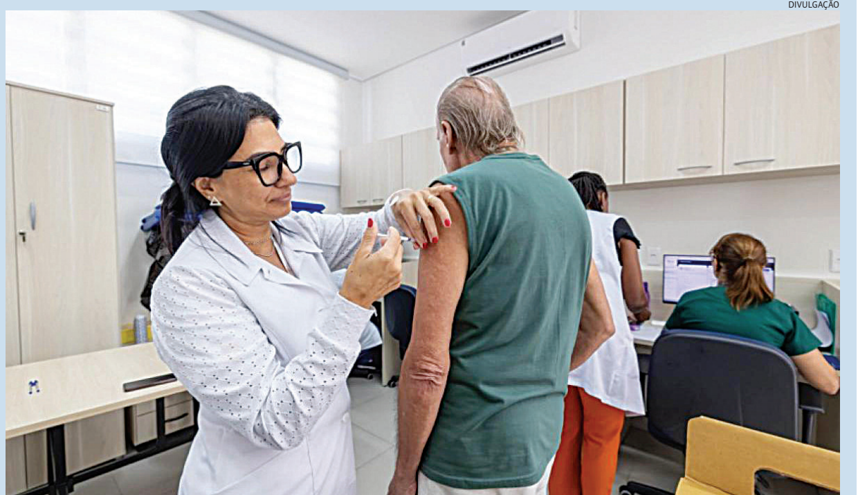
Os estoques foram reabastecidos para os grupos prioritários

Família normalizando a situação dos estoques nas unidades do município. Cidades 5