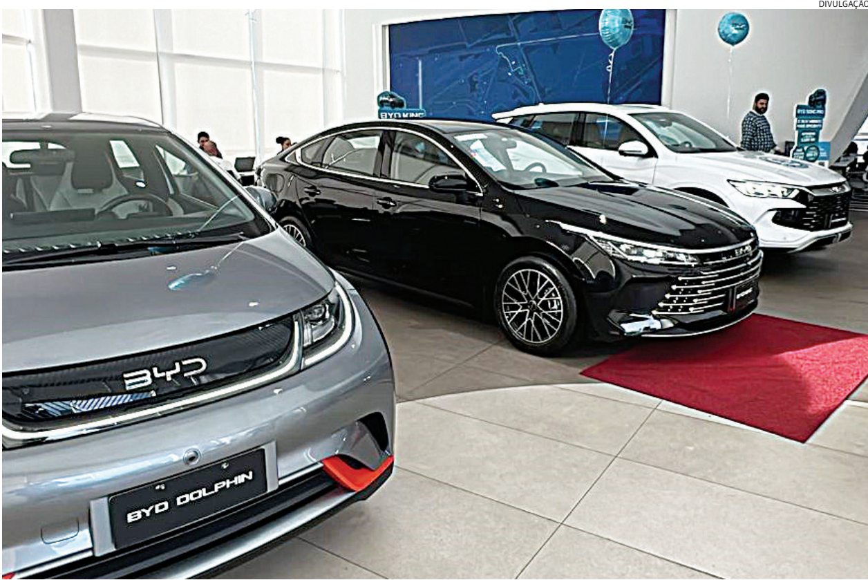
Motoristas de outras cidades da RMJ também aderiram ao carro elétrico

Segundo dados do Detran-SP, de janeiro a maio de 2026 foram registrados 4.390 veículos elétricos circulando em Jundiaí contra 3.552 unidades no mesmo período