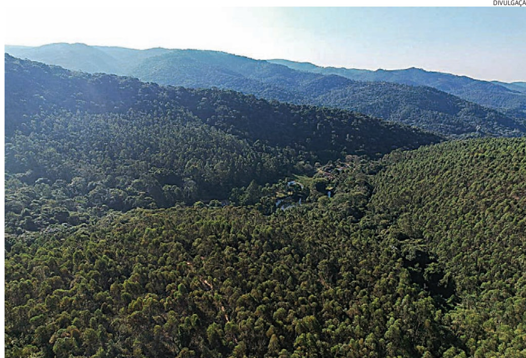
A abertura será dia 14 com o painel ‘Caminhos do Vale do Rio Jundiaí’

A abertura oficial será realizada no dia 14 de maio, das 19h às 21h30, com a sole-