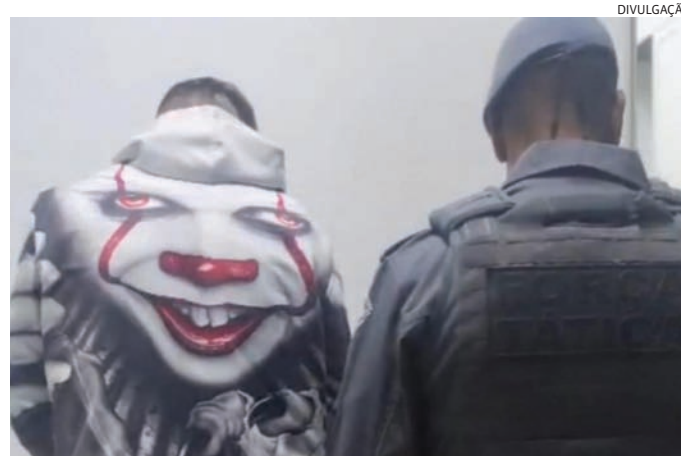
Encaminhado ao Plantão Policial, o homem foi preso em flagrante

Ao perceber a aproximação da viatura, o homem