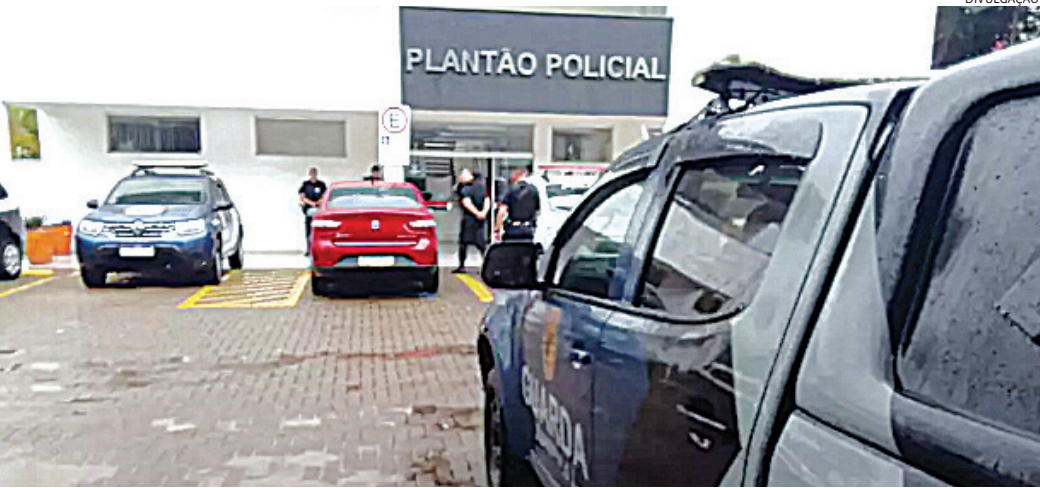
Ele foi levado para a delegacia, onde acabou preso em flagrante

O Velório Municipal informou sobre 5 óbitos, autorizando pelas famílias.