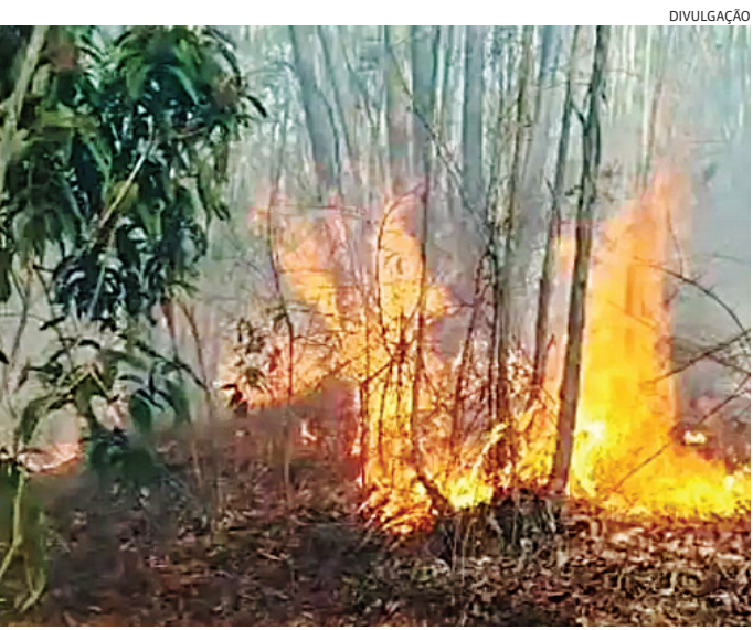
Os GMs devem voltar ao local, que fica em área de difícil acesso

Ainda no domingo a DIG identificou a vítima e comunicou familiares dela, que foram ouvidos para registro da ocorrência e deram depoimentos parecidos, relatando que ela tinha um relacionamento amoroso conturbado, há cinco anos, com um homem classificado como “tóxico” e “babaca”. Ele então passou a ser tratado como principal suspeito do crime.