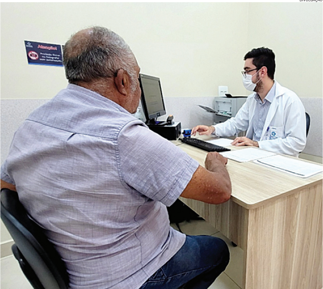
O hospital também instituiu recentemente a Comissão do Hospital Amigo do Idoso