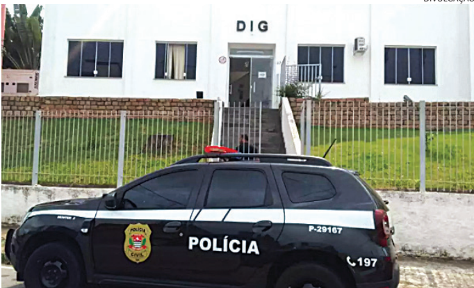
O caso está sendo investigado pela DIG de Jundiaí

O CASO O corpo foi encontrado por populares, que acionaram a Guarda Municipal. Uma equipe foi enviada e, após constatação, os GMs