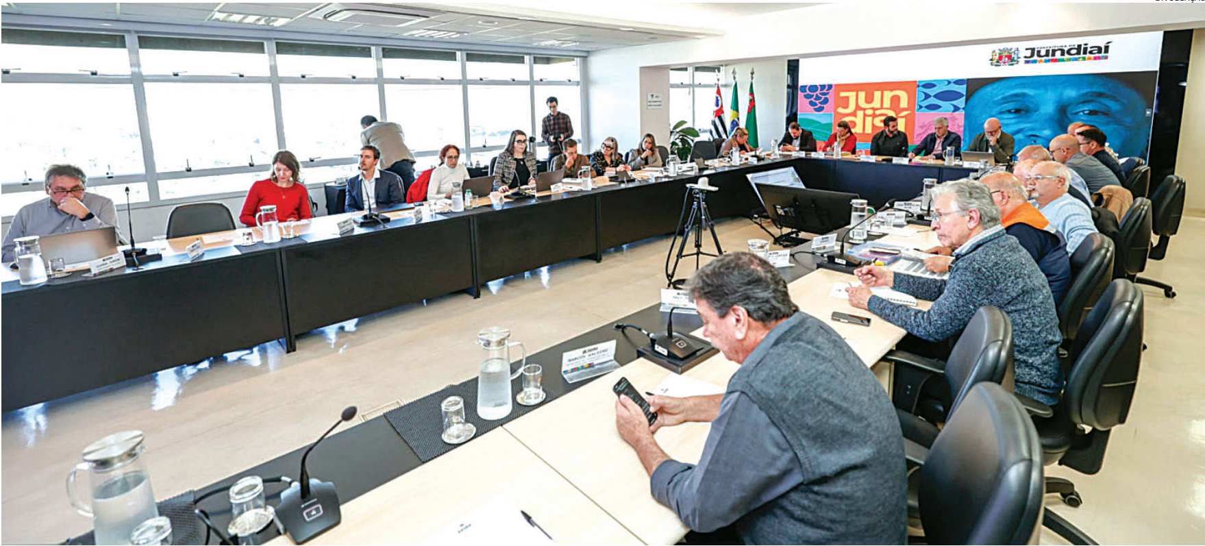
Gestores realizaram reuniões prévias para definição das metas

A audiência é mais uma das etapas do processo conduzido pela Unidade de Gestão de Governo e Finanças (UGGF), em parceria com as demais Unidades de Gestão. Anteriormente, segundo a Prefeitura, foram realizadas reuniões internas, análises de impacto orçamentário e a consolidação de propostas apresentadas por cada área da