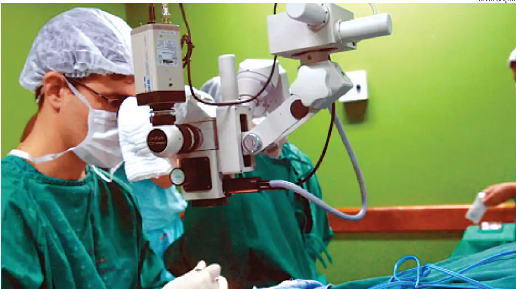
Pessoas com fatores de risco devem começar os exames de rastreamento antes dos 50 anos