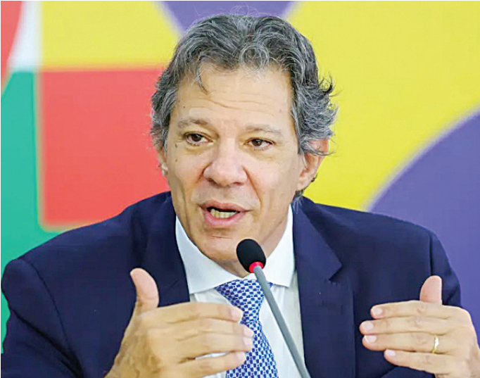
Fernando Haddad afirma que alternativas serão mostradas a Lula

“O Brasil não vai sair da mesa de negociação. A determinação do presidente Lula é de que nós não demos nenhuma razão para sofrer esse tipo de sanção e a orientação dele é a seguinte: o vice-presidente [Geraldo] Alckmin, o Ministério da Fazenda e o Itamaraty estão engajados permanentemente [na negociação]. Mandamos uma segunda carta [ao governo dos Estados Unidos] na semana passada, em acréscimo à de maio, da qual nós não obtivemos resposta até agora, mas nós vamos insistir na negociação comercial para que possamos encontrar um caminho de aproximação dos dois países que não têm razão nenhuma para esta-