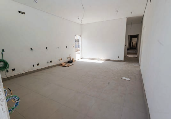
Neste momento, a obra na unidade já recebe acabamentos finais

O prefeito Gustavo Martinelli destacou a importância da UBS para a população da Vila Rio Branco e bairros do entorno. “A nova UBS representa um avanço significativo na ampliação e qualificação da rede de atenção básica em Jundiaí. Estamos empenhados em entregar uma estrutura de qualidade, com mais conforto, mais