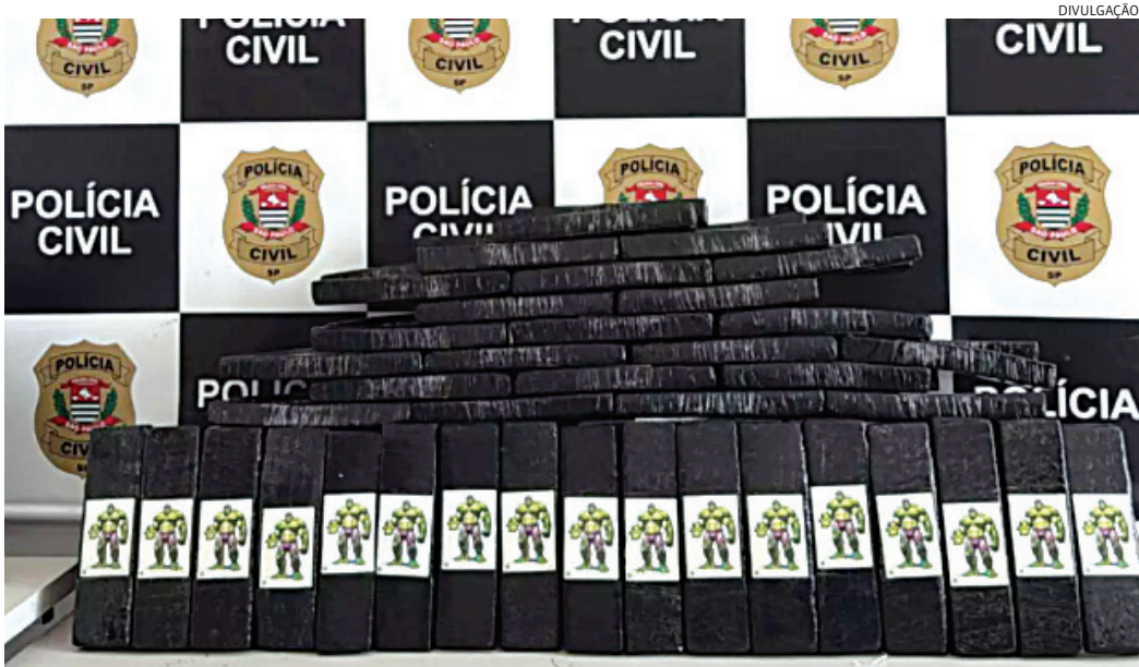
Os tijolos traziam um selo com a imagem do super-herói Hulk

Policiais da Delegacia de Investigações Sobre Entorpecentes (Dise), de Jundiaí, localizaram e apreenderam 100 kg de maconha, divididos em 118 tijolos, que estavam armazenados dentro de uma guarita abandonada em área rural e de mata, em Louveira, na manhã desta segunda-feira (21). Os tijolos traziam um selo com a imagem do super-herói Hulk, informação que deve ajudar nas investigações. Ninguém foi preso durante a operação. A Dise recebeu informações de que traficantes da região de Jundiaí estariam nesta área, em local ermo e com aspecto de abandono, escondendo grande quanti-