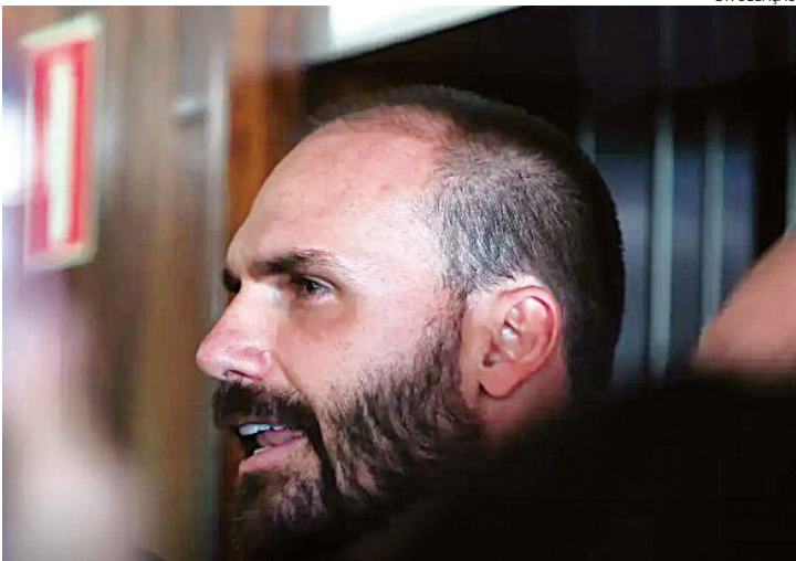
Eduardo Bolsonaro pediu afastamento cargo de deputado e foi para os EUA

O vice-prefeito e gestor de Governo e Finanças, Ricardo Benassi, está de