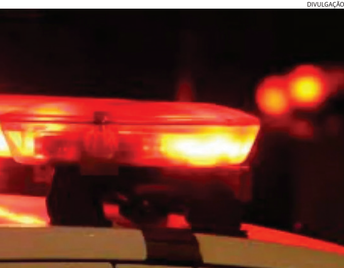
A moto foi apreendida e será periciada durante as investigações

averiguação. Durante checagem aos seus dados pessoais, constou um mandado de prisão por tráfico, expedido pela Justiça de Ribeirão Preto. Ele foi conduzido Conduzido ao Plantão, onde foi dado cumprimento ao mandado de prisão.