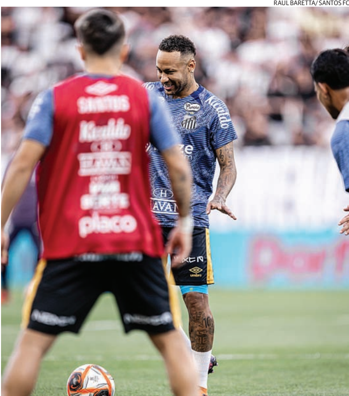
Neymar não saiu do banco de reservas durante a partida da semifinal

Neymar tentou até o último minuto estar ap-