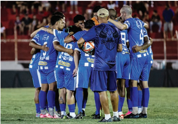
Lanterna da A4, a Matonense soma 30 jogos sem vitória

O ano da Matonense começou com derrota para o