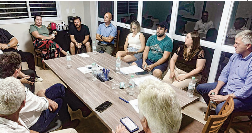
Reunião com moradores para esclarecer sobre a situação da obra do viaduto do bairro Corrupira