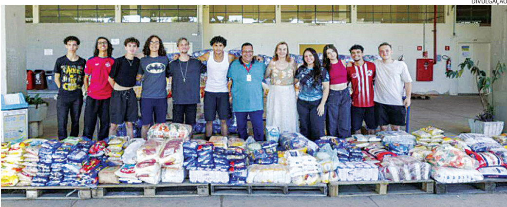
Os alimentos foram doados ao Fundo Social de Solidariedade de Jundiaí e serão destinados a entidades