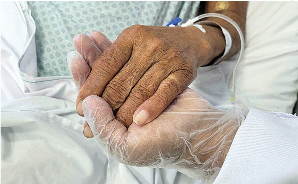
A pesquisa foi implementada em 2023 e o índice de satisfação do paciente atingiu 90% em 2024

“Ofertar um atendimento humanizado demonstra o valor de uma instituição que acolhe o paciente em todas as suas necessidades, não só em nível técnico. Nossa missão é promover um atendimento de excelência e, consequentemente, melhor qualidade de vida aos pacientes que contam conosco”, aponta Liba.