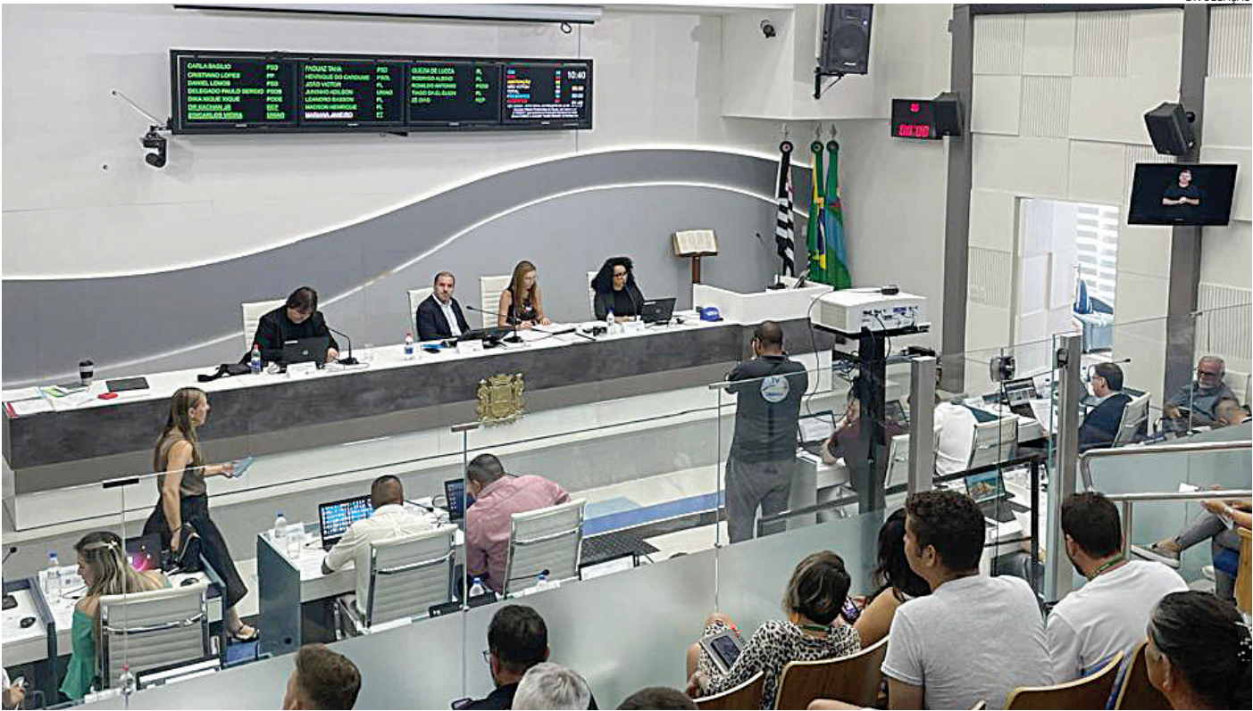
Vereador propõe medidas para fortalecer a segurança e o bem-estar da população idosa

O vereador pretende ampliar o projeto por meio de conversas com o gestor da Guarda Municipal, a fim de fortalecer as ações de proteção e garantir a efetividade das medidas propostas a exemplo do que já ocorre com a Guardiã Maria da Penha, serviço da GM que atende mulheres vítimas de violência, em especial a efetividade do cumprimento das medidas protetivas.