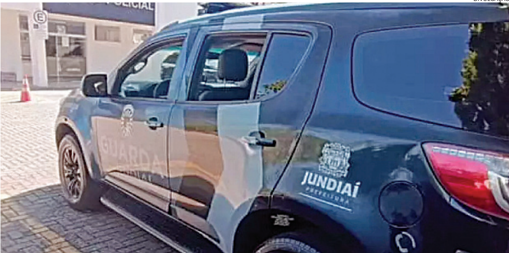
Os GMs o detiveram para averiguação e descobriram o mandado de prisão

foram recuperados. O adolescente e o adulto - que haviam fugido pela área de mata -, e o dono do Corsa foram detidos e com conduzidos ao Plantão Policial, onde os maiores ficaram presos e o adolescente foi apreendido.