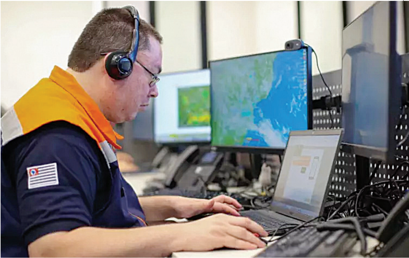
A Defesa Civil recomenda atenção para possíveis temporais e reforça a importância de acompanhar os alertas meteorológicos

Na quarta-feira (12), as condições voltam a ser típicas do verão: calor ao longo do dia, seguido por pancadas de chuva no período da tarde. Já na quinta-feira (13), uma nova frente fria avança pelo Sul do Brasil e deve