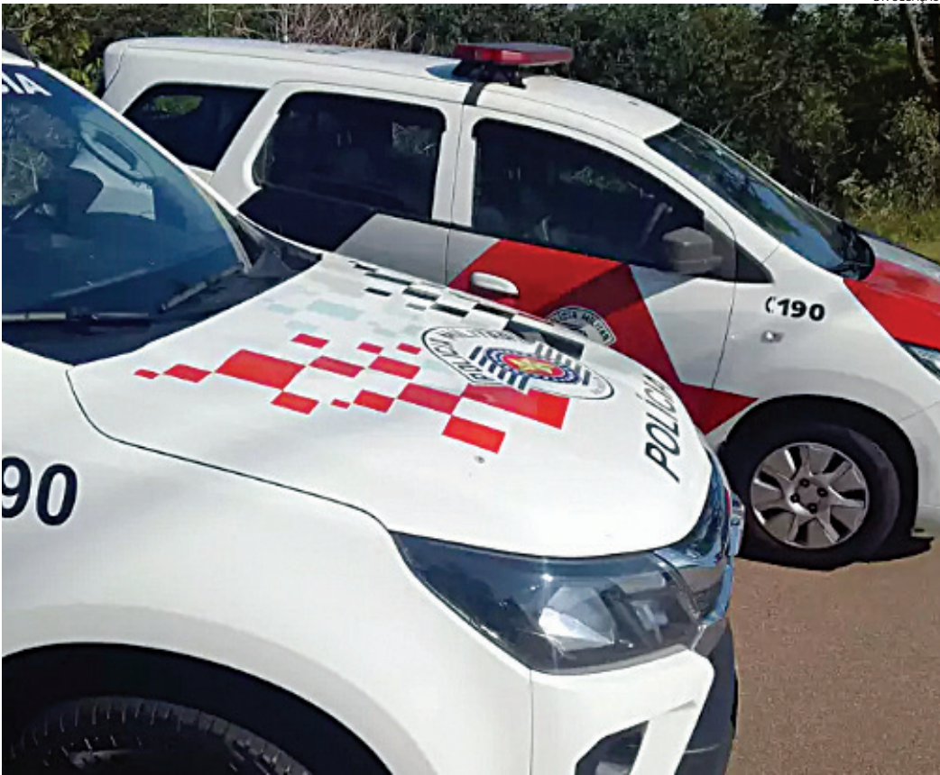
A PM foi acionada e, durante diligências, prendeu o pai das crianças

Dois irmãos, uma menina de 5 anos e um garoto de 3, foram resgatados por populares às margens da rodovia Alkindar Monteiro Junqueira, no Jardim Monte Verde, em Itatiba, na tarde deste domingo (9), após terem sido abandonados. A Polícia Militar foi acionada e, durante diligências, prendeu o pai das crianças, por abandono de incapaz. Ele foi encontrado em casa, bêbado e sentado sobre as próprias fezes. A PM foi acionada por populares que haviam resgatado e faziam a vigia e proteção de duas crianças, abandonadas. Os policiais chegaram e conversaram com a menina, que comentou que seu pai estava alcoolizado e que