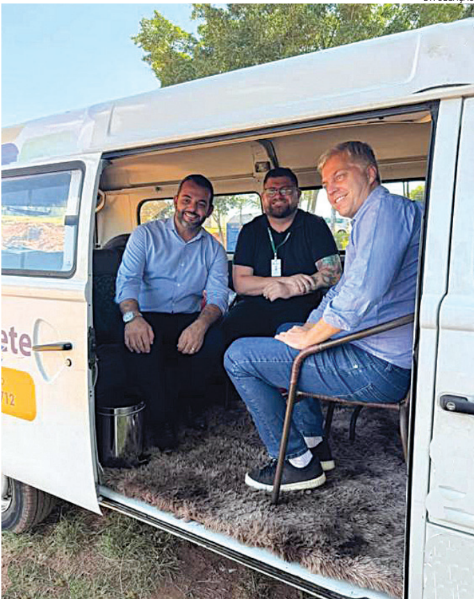
O projeto já atendeu mais de 200 ações, este ano foram 14 atendimentos

A Prefeitura de Itatiba, por meio da Secretaria de Ação Social, Trabalho e Renda, realizou a entrega de 82 certificados de conclusão dos cursos/oficinas de capacitação profissional ofertadas por meio do setor de Inclusão Produtiva, responsável