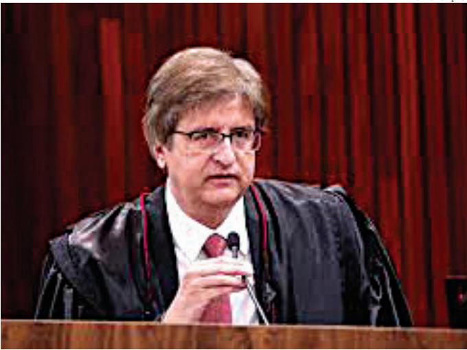
Gaeco nacional irá combater crimes de corrupção e combate a facções

A equipe será coordenada por um subprocurador-geral da República, que é o último nível de carreira de um procurador do MPF,