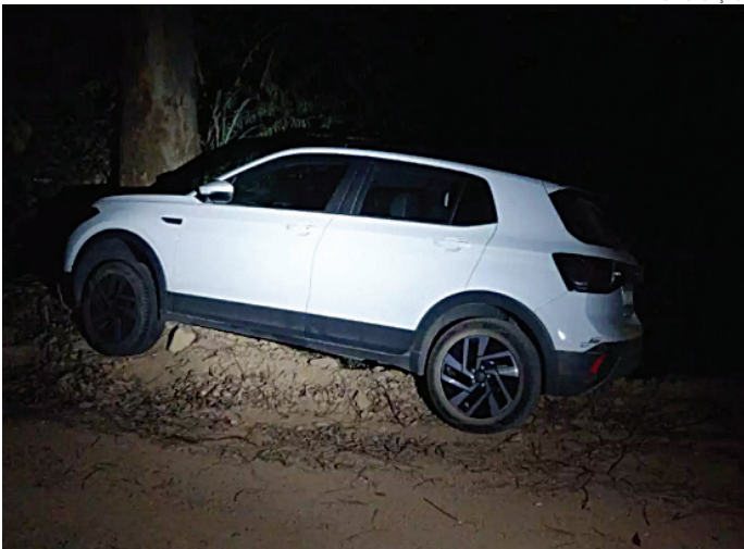
O veículo foi abandonado pelos criminosos após acidente

Um adolescente foi apreendido e dois homens foram presos, por policiais militares, em Cabreúva, na noite deste domingo (9), suspeitos de roubarem um veículo T Cross, em Itu. As detenções ocorreram após perseguição, acidente e fuga pela mata. O veículo foi recuperado. A PM recebeu informações de que um veículo levado em um assalto, em Itu, estava circulando por Cabreúva. Foi intensificado patrulhamento em áreas estratégicas, até que uma equipe de deparou com o veículo alvo em alta velocidade pela estrada dos Romeiros. Após uma breve perseguição, os suspeitos sofreram um acidente e abandonaram o carro, correndo para uma área de mata, conseguindo êxito na fuga