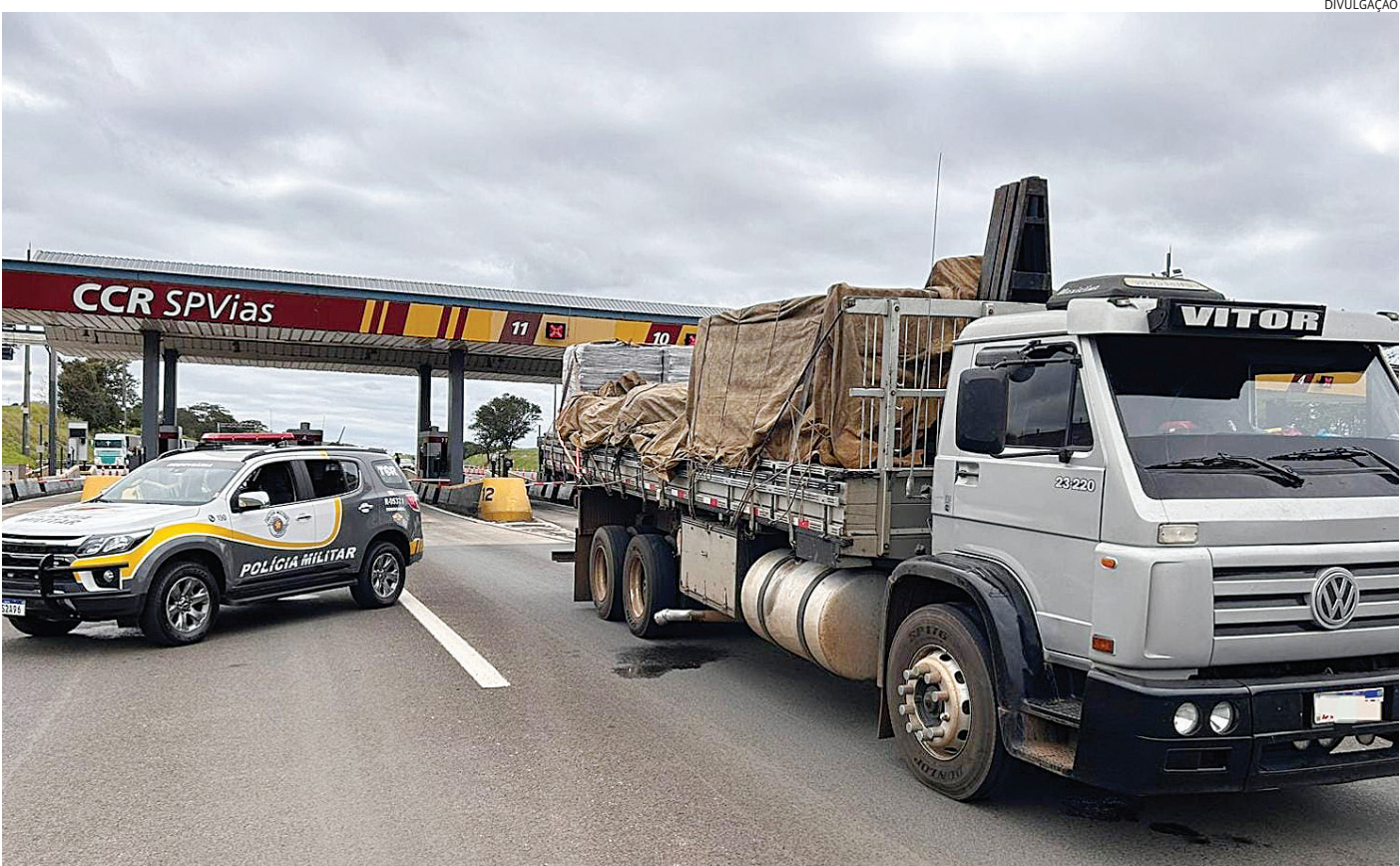
Mesmo com queda nos casos, o roubo de cargas continua preocupando transportadores em Jundiaí e região

De acordo com a consultoria Overhaul, o Estado de São Paulo liderou o ranking na