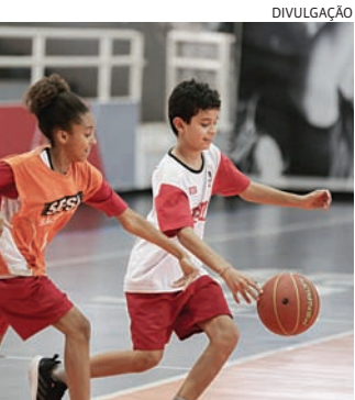
As vagas são gratuitas, limitadas e abertas para toda a comunidade

Para participar do programa, os responsáveis interessados deverão comparecer na secretaria do CAT Sesi Jundiaí, na Avenida Antonio Segre, 695 – Jardim Brasil, munido dos seguintes documentos: CPF, RG e comprovante de endereço (tanto da criança, quanto do responsável direto);