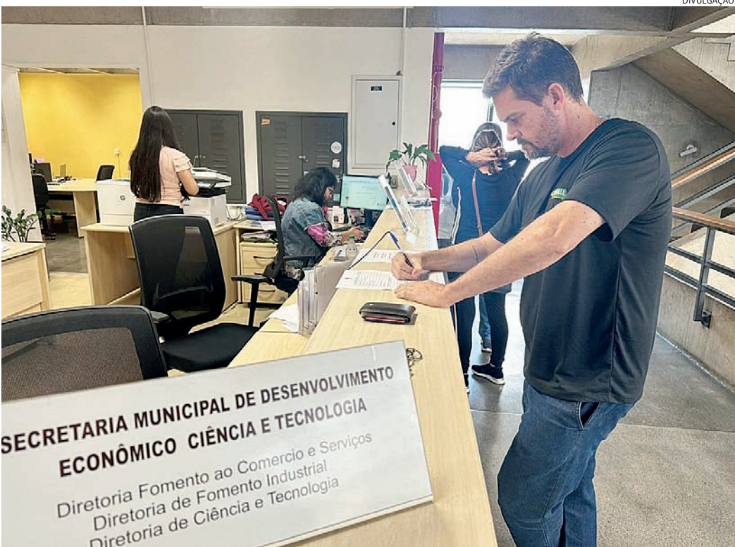
Os convocados podem confirmar presencialmente na UGDECT, localizada no sexto andar do Paço Municipal

A confirmação dos expositores para a 6ª FENS – Feira do Empreendedor, Negócios e Serviços, promovida pela Prefeitura de Jundiaí, continua até o dia 28 de junho. Os convocados podem confirmar presencialmente na Unidade de Gestão de Desenvolvimento Econômico, Ciência e Tecnologia (UGDECT), localizada no sexto andar do Paço Municipal, Ala Norte.