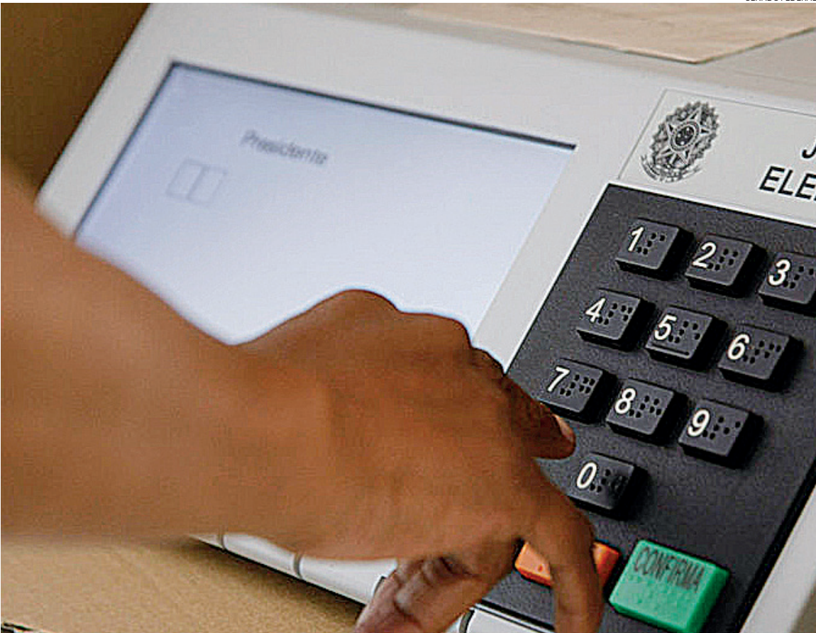
Esta será a primeira eleição municipal com a participação das federações partidárias

As federações criadas funcionam como uma única agremiação partidária e podem apoiar qualquer candidato ou candidata, desde que permaneçam assim durante todo o mandato. Isso significa que elas