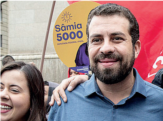
Boulos e seu partido são multados por propaganda antecipada

O apresentador José Luiz Datena vai lançar a pré-candidatura à prefeitura de São Paulo pelo Partido da Social Democracia Brasileira (PSDB) nesta quinta (13). O evento acontecerá às 11h em um hotel no centro de São Paulo. O presidente nacional do partido, Marconi Perillo, e o deputado federal Aécio Neves devem participar. Datena se filiou ao PSDB em abril, quase quatro meses depois de se filiar ao PSB. É o décimo primeiro partido ao qual se filia. O apresentador já ensaiou disputar diferentes cargos em pleitos anteriores, mas nunca chegou, de fato, a concorrer. O PSDB se divide quanto aos apoios para o pleito em São Paulo. O diretório municipal do partido decidiu não apoiar a reeleição do prefeito Ricardo Nunes (MDB), o que levou a uma debandada de vereadores do partido. Uma ala defende a composição de uma chapa com Tabata Amaral (PSB), ficando com a vice. E outra parte defendia o lançamento de uma candidatura própria. Segundo a última pesquisa Datafolha, Datena tem 8% das intenções de voto na capital paulista, empatado com Tabata.