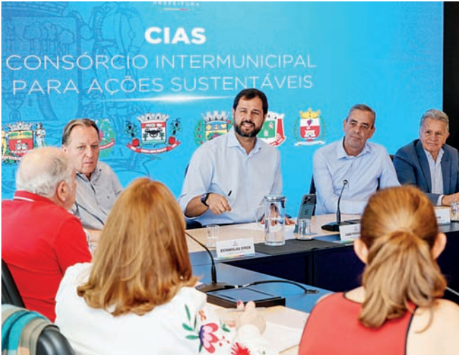
Prefeito de Jundiaí é eleito para reassumir o CIAS