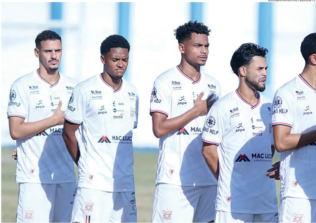
Na próxima partida, o Paulista recebe o Flamengo de Guarulhos, no Jayme Cintra