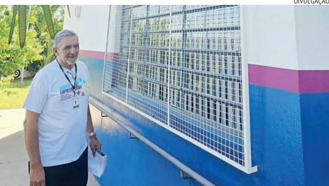
Os candidatos, foram convocados exclusivamente através do WhatsApp

O evento teve como objetivo promover oportunidades de emprego para o público prioritário atendido pelo CRAS, além de divulgar o portal Jundiaí Empreendedora para a comunidade local. A ação foi especialmente