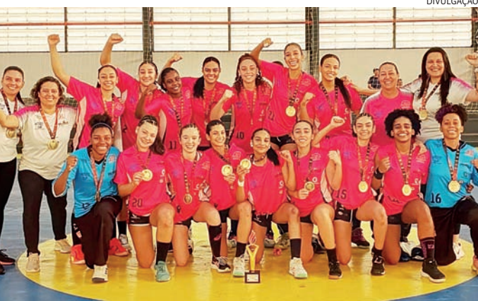
O título do handebol feminino se juntou às conquistas da equipe

Ginástica Artística Feminina – 2º lugar Ginástica Artística Masculina – Campeão Atletismo Feminino – Campeão Atletismo Masculino – 13º lugar Futebol Feminino – 3º lugar Handebol Feminino – Campeão Xadrez Masculino – 4º lugar