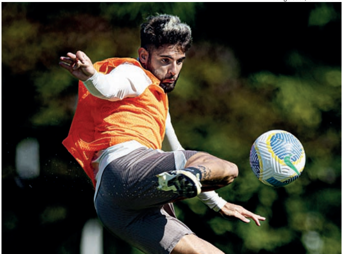
O Timão amarga a 17ª posição do campeonato, com cinco pontos