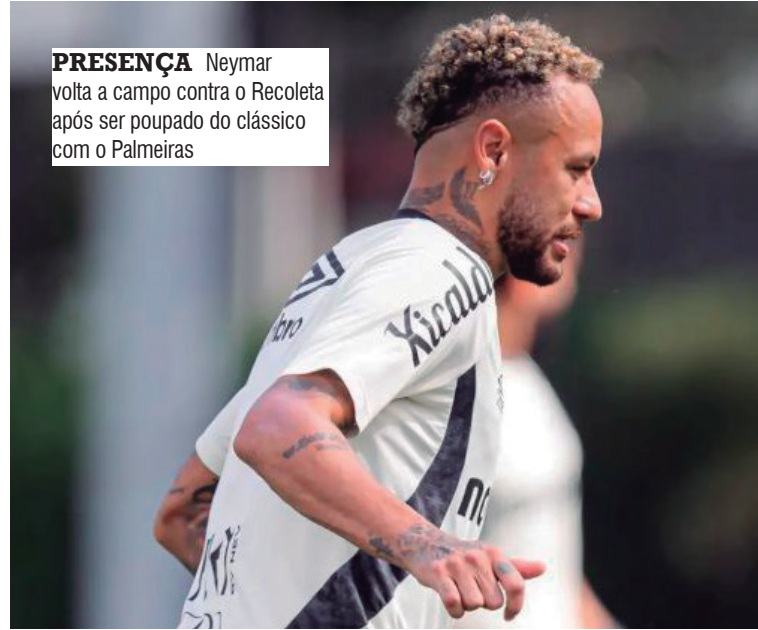
PRESEÇA Neymar volta a campo contra o Recoleta após ser poupado do clássico com o Palmeiras