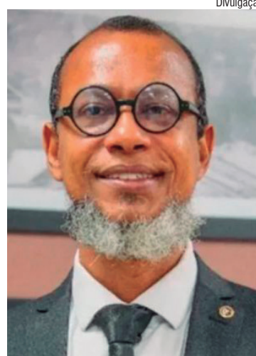
DEFENESTRADO O magistrado ainda estava em estágio probatório, período em que são avaliados desempenho técnico e conduta

Segundo o tribunal, a apuração identificou um ambiente