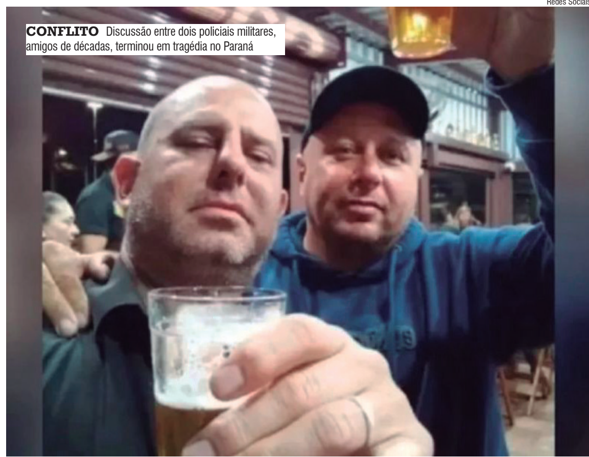
CONFLITO Discussão entre dois policiais militares, amigos de décadas, terminou em tragédia no Paraná