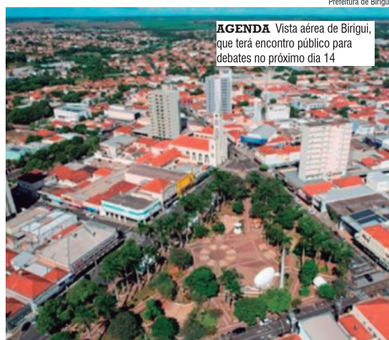
Prefeitura de Birigui AGENDA Vista aérea de Birigui, que terá encontro público para debates no próximo dia 14

Sustenta que ela vai proporcionar, na realidade, estruturação para tornar os espaços mais úteis à população. "A participação popular é considerada essencial no processo, já que a audiência permite que moradores acompanhem, opinem e contribuam diretamente nas decisões que impactam o desenvolvimento da cidade", afirma.