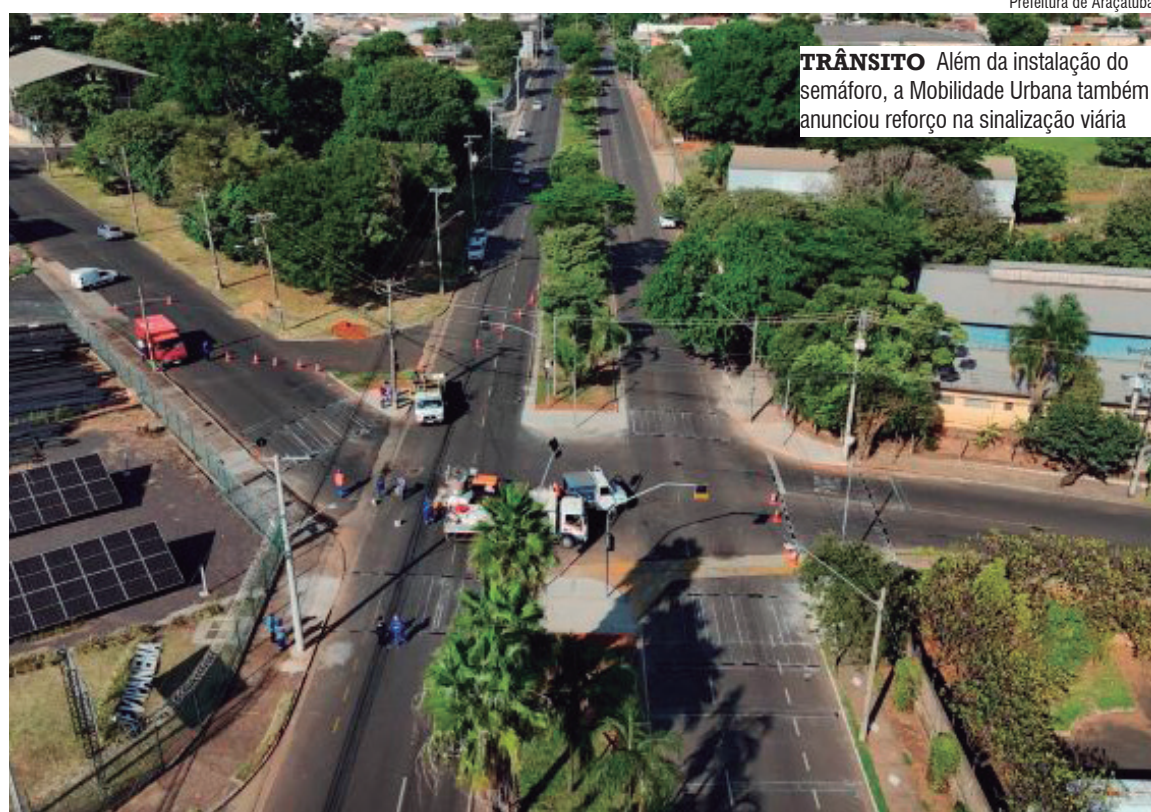
Prefeitura de Araçatuba TRÂNSITO Além da instalação do semáforo, a Mobilidade Urbana também anunciou reforço na sinalização viária

De acordo com a secretaria, o prazo para execução do serviço é de até dez dias, podendo haver interdições parciais no trânsito durante o período de obras. A recomendação é para que motoristas redobrem a atenção e busquem rotas alternativas.