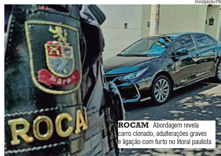
ROCAM Abordagem revela carro clonado, adulterações graves e ligação com furto no litoral paulista

principalmente, pelo valor abaixo do mercado. Os policiais constataram que as placas pertenciam a outro veículo regular da cidade de Ibaté, cujo proprietário confirmou estar com o carro original, enviando fotos para comprovação.