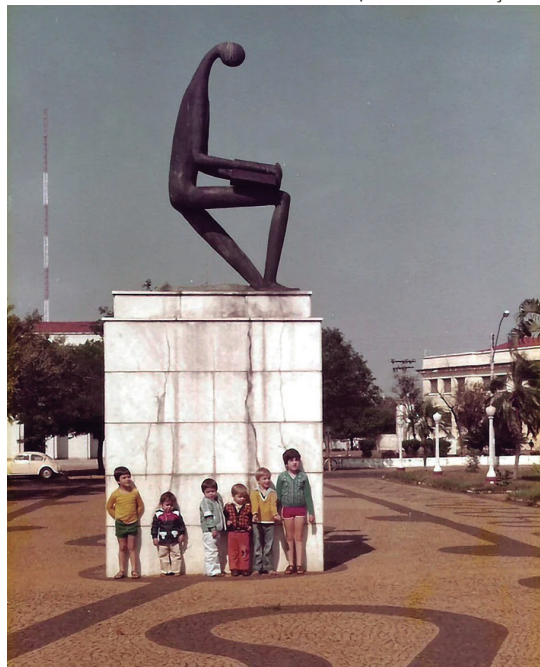
Monumento ao Estudante Brasileiro (idealizado por Genilson Senche), na praça Getúlio Vargas, em foto do início da década de 1980