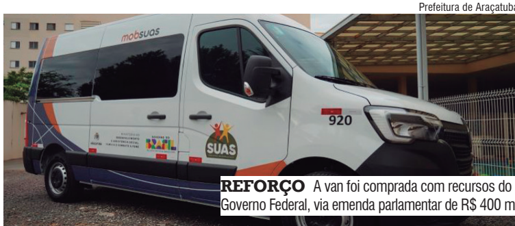
REFORÇO A van foi comprada com recursos do Governo Federal, via emenda parlamentar de R$ 400 mil

A van foi adquirida com recursos do Governo Federal, por meio de emenda parlamentar do deputado federal Ricardo Salles, que destinou R$ 400 mil. Parte da verba foi utilizada na compra do veículo, com capacidade para 15 passageiros, que custou R$ 287,9 mil.