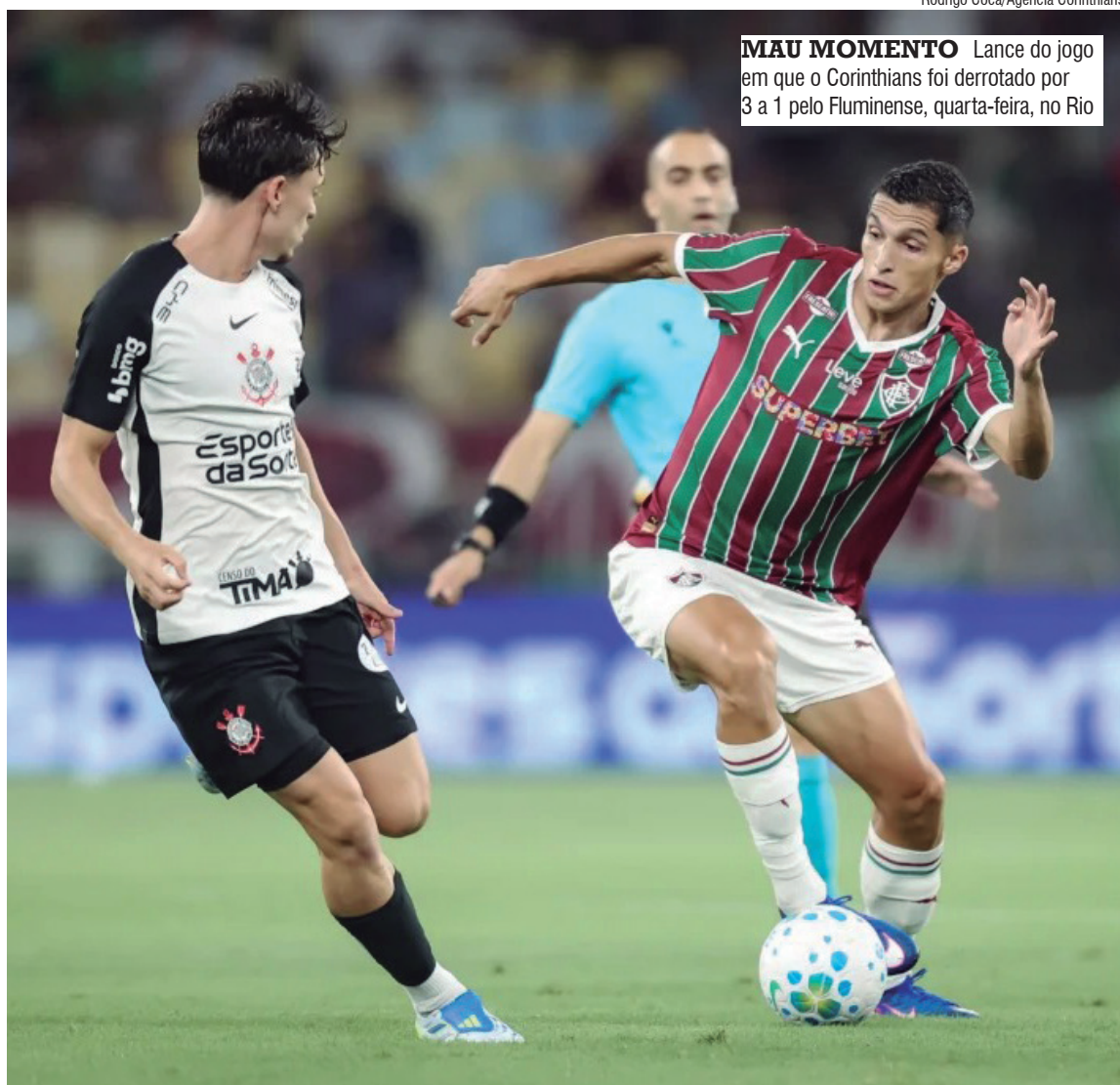
MAU MOMENTO Lance do jogo em que o Corinthians foi derrotado por 3 a 1 pelo Fluminense, quarta-feira, no Rio

O resultado negativo diante do Tricolor das Laranjeiras ampliou a sequência sem vitórias do Corinthians, que agora soma oito jogos sem saber o que é somar três pontos na temporada. Com isso, a pressão sobre o técnico Dorival Júnior aumentou.