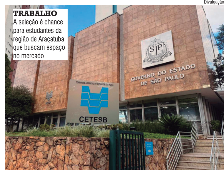
TRABALHO A seleção é chance para estudantes da região de Araçatuba que buscam espaço no mercado

Também há oportunidades para alunos de cursos tecnológicos e de gestão como gestão ambiental, geoprocessamento, meio ambiente e recursos hí-