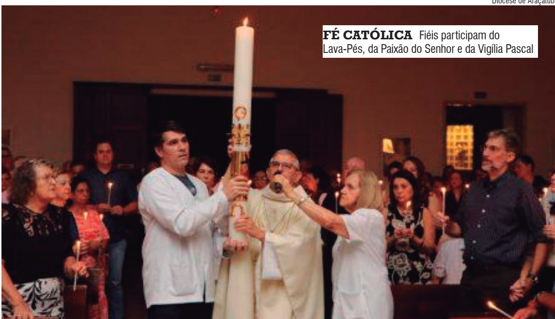
FÉ CATÓLICA Fiéis participam do Lava-Pés, da Paixão do Senhor e da Vigília Pascal

O Tríduo começou ontem com a Missa da Ceia do Senhor e o rito do Lava-Pés, que recorda o gesto de serviço de Jesus. Nesta sexta-feira santa, o ponto alto é a celebração da Paixão do Senhor, tradicionalmente às 15h, horário associado à morte de Cristo.