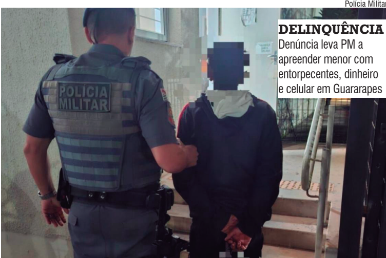
DELINQUÊNCIA Denúncia leva PM a apreender menor com entorpecentes, dinheiro e celular em Guararapes

Durante a revista, um dos suspeitos, menor de idade, admitiu estar com porções de maco-