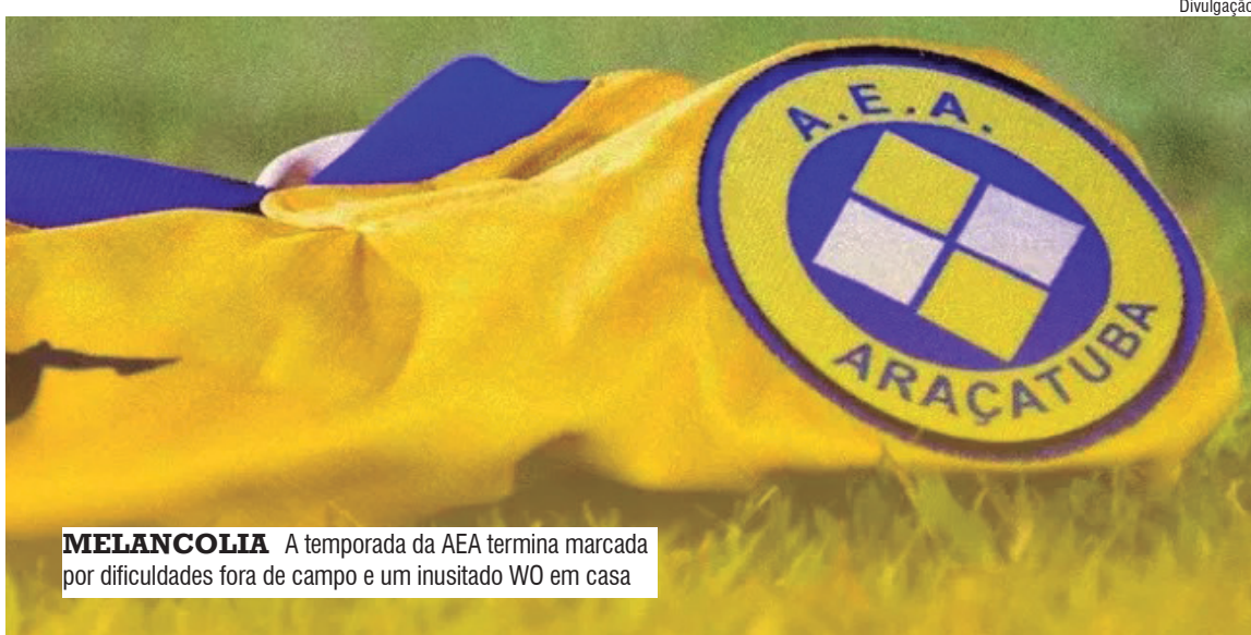
MELANCOLIA A temporada da AEA termina marcada por dificuldades fora de campo e um inusitado WO em casa

A decisão ocorre após o rebaixamento da equipe, confirmado de forma matemática na rodada anterior da competição. Com isso, o Canário encerra sua participação no campeonato de forma antecipada e com uma campanha bastante negativa.