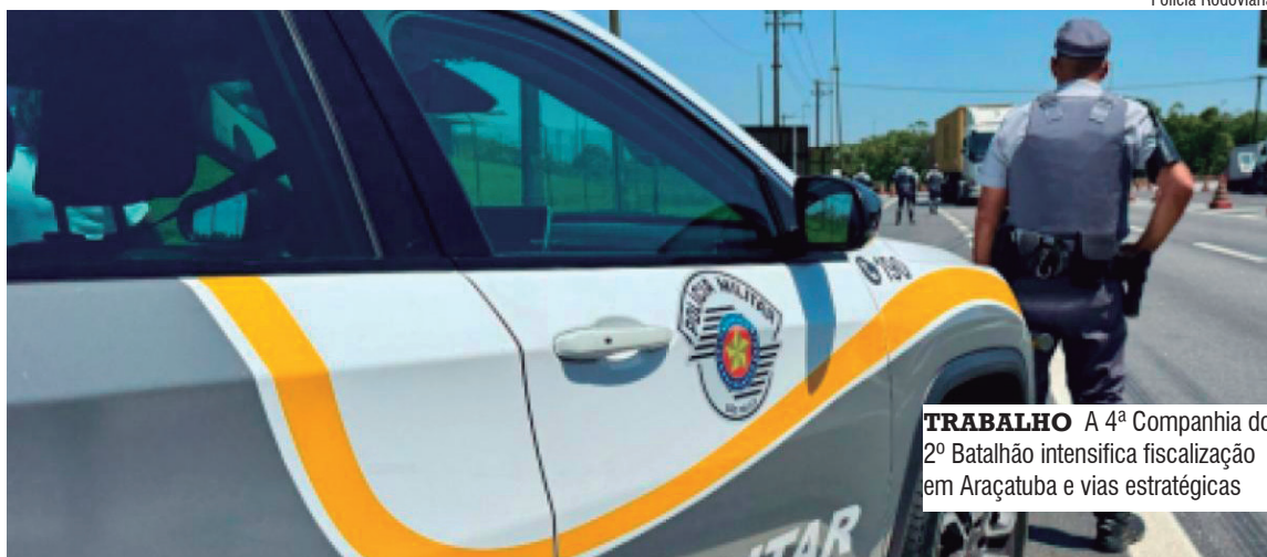
TRABALHO A 4ª Companhia do 2º Batalhão intensifica fiscalização em Araçatuba e vias estratégicas

Também haverá fiscalização direcionada aos horários de maior