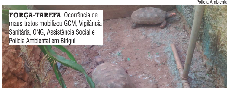
FORÇA-TAREFA Ocorrência de maus-tratos mobilizou GCM, Vigilância Sanitária, ONG, Assistência Social e Polícia Ambiental em Birigui

Segundo o registro da ocorrência, dentro da residência foram localizados 12 filhotes de gatos em uma gaiola de grande porte, sem água disponível, além de outros felinos soltos pelo imóvel. Já na parte externa havia cães presos por correntes, com