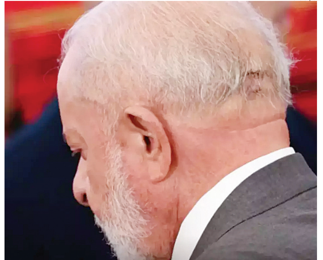
Para evitar novos sangramentos, Lula passa hoje por nova intervenção cirúrgica