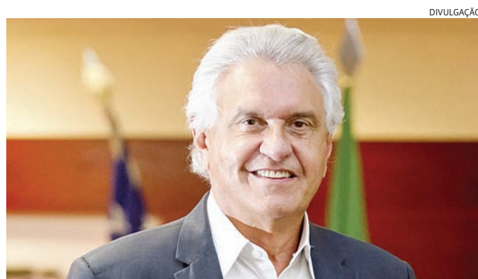
Ronaldo afirmou que regiões que o apoiassem teriam benefícios

A Comissão de Ciência e Tecnologia (CCT) aprovou nesta quarta-feira (11) o projeto de lei que permite a instituições de pesquisa e desenvolvimento privadas participarem de regimes tributários especiais