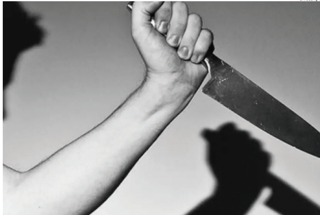
A ex-esposa levou uma facada e a companheira dela foi golpeada várias vezes, inclusive nas costas

Era fim de noite desta terça-feira (10), quando o suspeito surpreendeu a ex e sua nova companheira, o que o deixou nervoso. Houve uma discussão e as duas teriam se beijado na frente dele, o que o deixou ain-