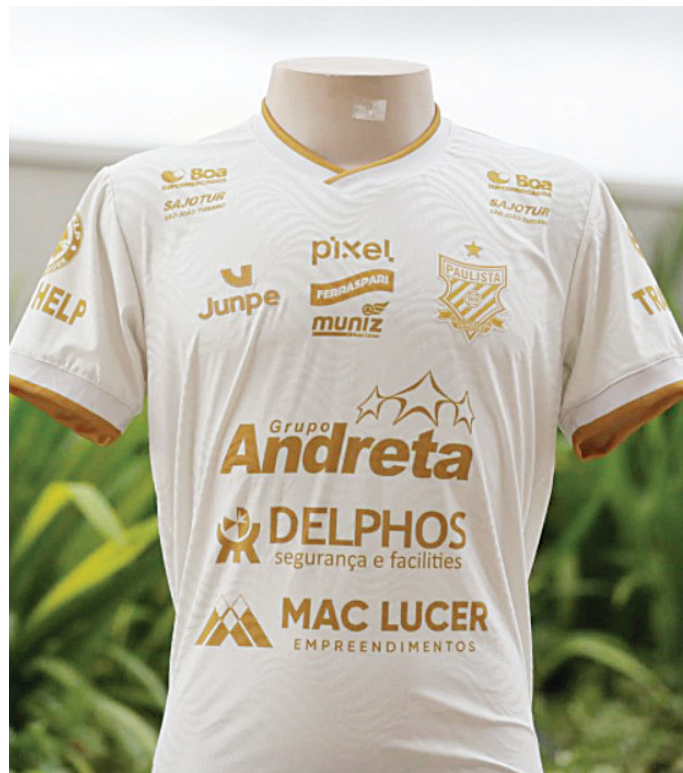
A camisa 2 é branca com detalhes em dourado