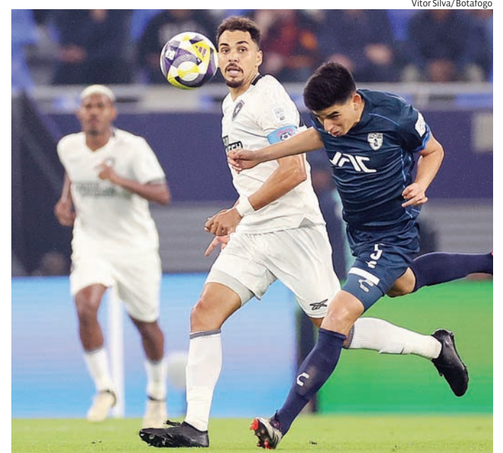
O Botafogo perdeu por 3 a 0 para o time mexicano

Os outros quatro times sul-americanos que também foram derrotados nas