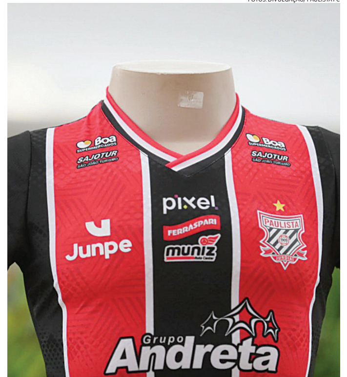
O uniforme 3 é formado pelas três cores do clube