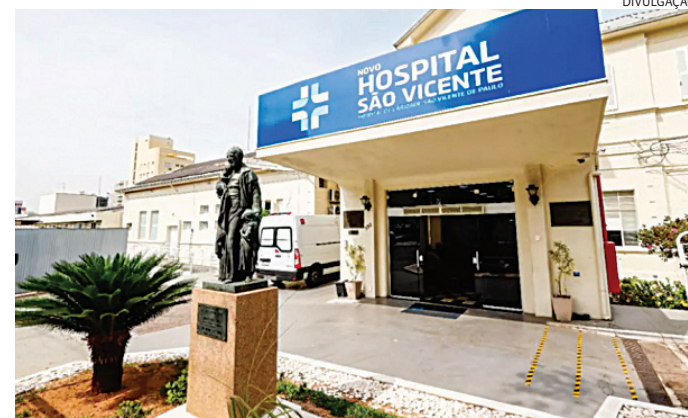
Uma vítima segue internada e recebendo a assistência médica necessária

Segundo apurou o Jornal de Jundiaí/Rede Samapi, o ônibus levava 25 pessoas. Parte das vítimas foram deslocadas ao Hospital São Vicente e uma para o Hospital Santa Teresa, em Campinas.