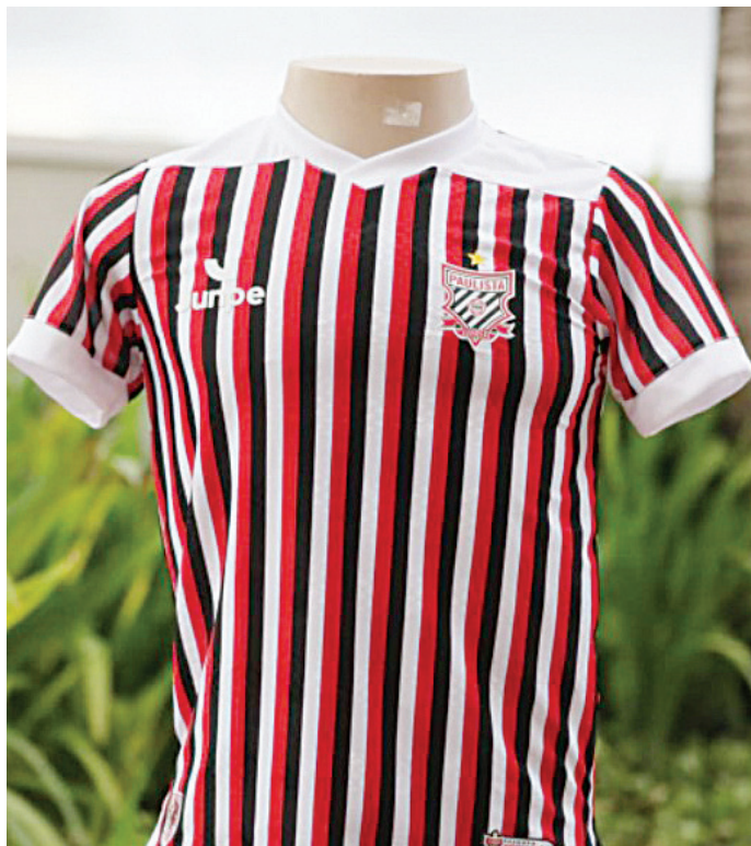
O manto principal leva o estilo clássico das listras finas

O evento de lançamento aconteceu no Hotel Ibis e contou com a presença de jogadores, membros da diretoria, torcedores, conselheiros e autoridades do município.