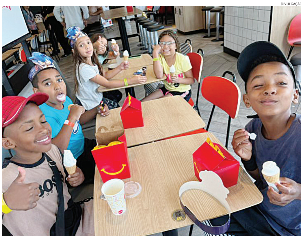
Após um passeio no Mundo das Crianças, as crianças assistidas pelo projeto podem comer os lanches

Com o encerramento das atividades de 2024, o Mc Tour reafirma seu compromisso com a inclusão social e o desenvolvimento integral das crianças de Jundiaí, fortalecendo as políticas públicas voltadas para a infância e a terceira idade no município.