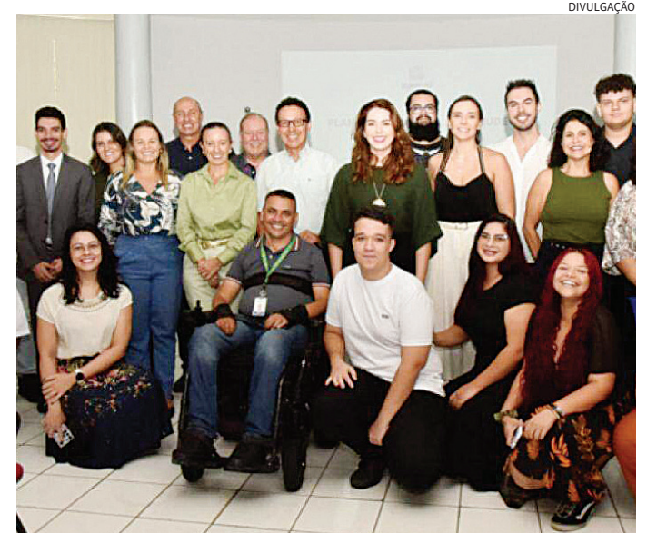
Jundiaí dispõe de um Plano Municipal da Juventude, lançado em abril

O recurso deve chegar a Jundiaí no primeiro semestre do próximo ano.