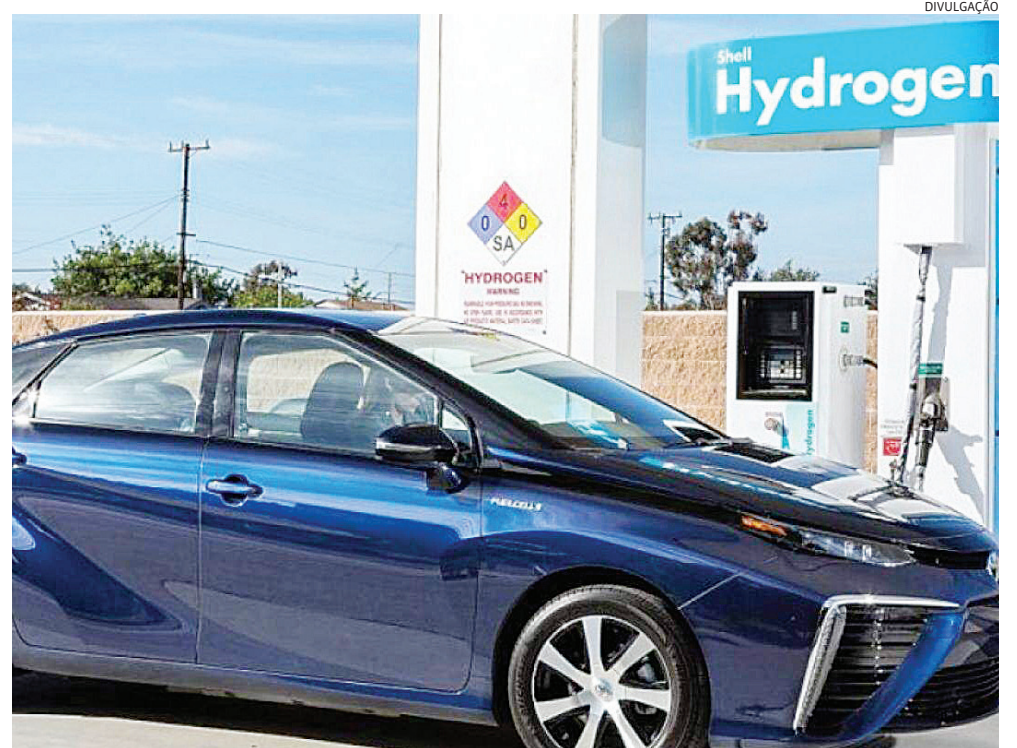
Veículos a hidrogênio ainda são muito raros e medida deve beneficiar mais os proprietários de híbridos