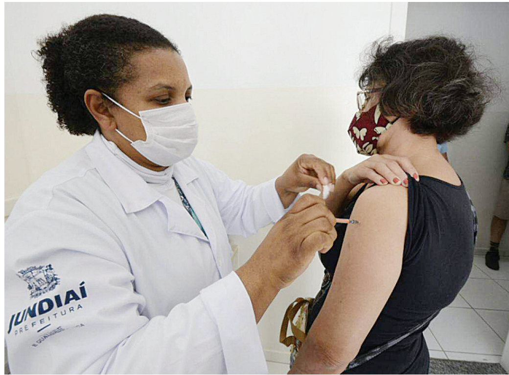
Retomada da vacinação acontece depois de um desabastecimento de doses na cidade

lância Epidemiológica (VE) aponta que em crianças de 6 meses a menores de 5 anos foram aplicadas 3.598 doses da vacina Spikevax. A população