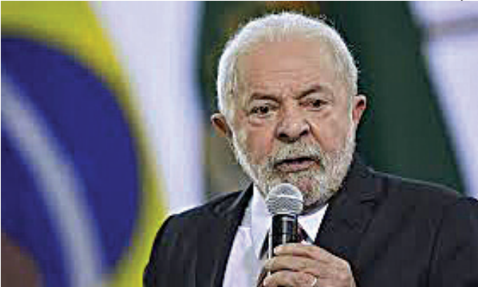
Governo Lula estuda ressarcir os aposentados com dinheiro do orçamento

Ainda de acordo com integrantes do governo, a ideia é que o Executivo argue que com as despesas e busque o ressarcimento futuro junto às entidades fraudadoras. Para acelerar a liberação de recursos, o governo deve se valer de um artigo da Constituição Federal que trata da responsabilidade civil do Estado e das pessoas jurídicas de direito