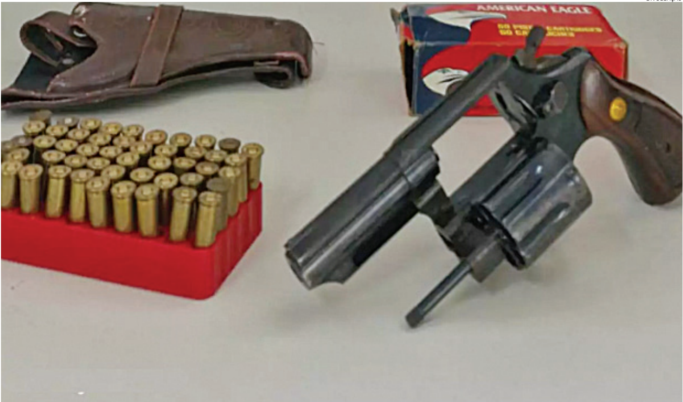
A PM vinha recebendo denúncias de moradores do bairro de que um homem vinha causando medo na comunidade

Ele foi conduzido à delegacia, onde acabou preso em flagrante por porte ilegal de arma de fogo.