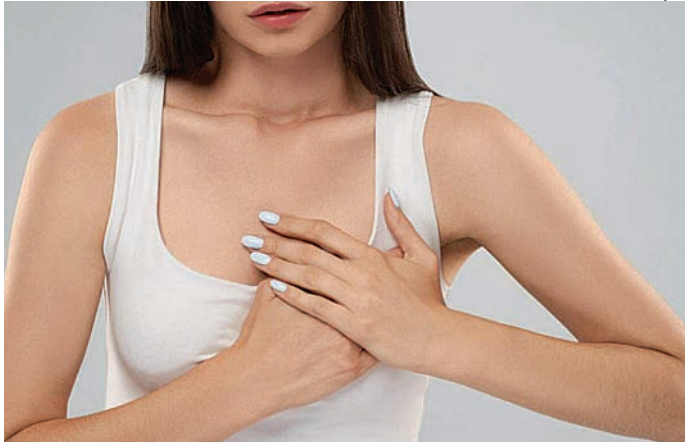
Pintura sem aval em prédio histórico custa até R$ 55 mil

Além da reconstrução mamária, definida como