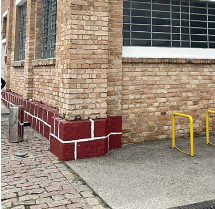
Danificar um patrimônio histórico pode gerar multa de até R$ 55 mil