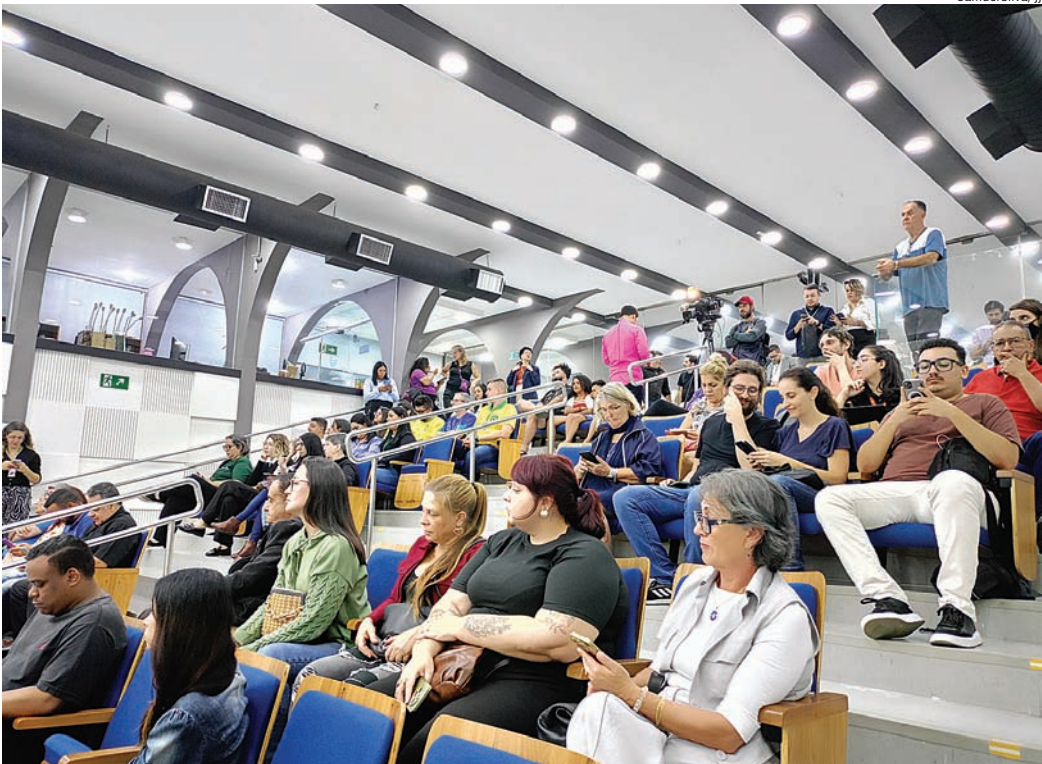
Público foi chegando aos poucos para a sessão da Câmara, em novo horário, às 16h

O trabalho dos vereadores de fato começou após às 19 horas. Nas três primeiras horas foram feitas as falas