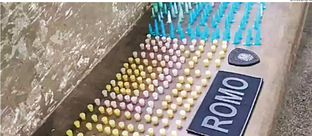
A droga foi apreendida e o caso será investigado pela Polícia Civil

os agentes localizaram dezenas de porções de cocaína e crack. A droga foi recolhida e levada para a delegacia, onde o caso foi registrado para posterior investigação da Polícia Civil.