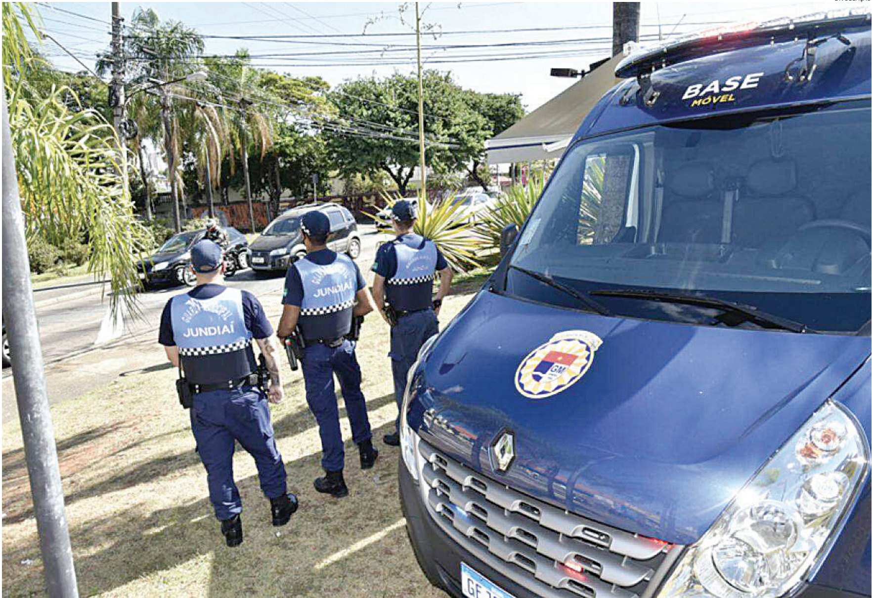
A Guarda Municipal fez em abril 60 atendimentos de denúncias de perturbação do sossego

Também no mês passado, a corporação jundiaien-