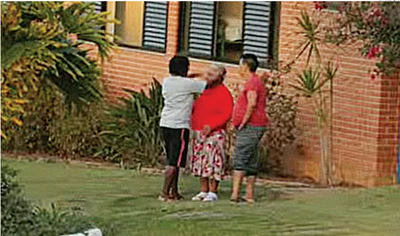
A Prefeitura de Jundiaí mantém o posicionamento de que a responsabilidade sobre o funcionamento da Missão Belém é inteiramente da instituição

Em nota, a Prefeitura de Jundiaí mantém o posicionamento de que a responsabilidade sobre o funcionamento da Missão Belém é inteiramente da instituição. A administração informou que “caso haja necessidade de remoção das pessoas acolhidas, a Prefeitura, por meio da Unidade de Gestão de Assistência e Desenvolvimento Social (UGADS) e com apoio de outras unidades, prestará o suporte necessário, considerando o perfil do público atendido, que em sua maioria é composto por pessoas