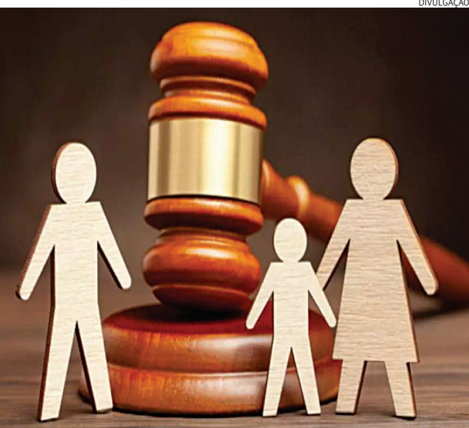
Foi dado cumprimento de mandado de prisão do pai devedor

Guardas Municipais apreenderam drogas em dois pontos de tráfico, distantes apenas alguns metros um do outro, no bairro São José, em Campo Limpo Paulista.