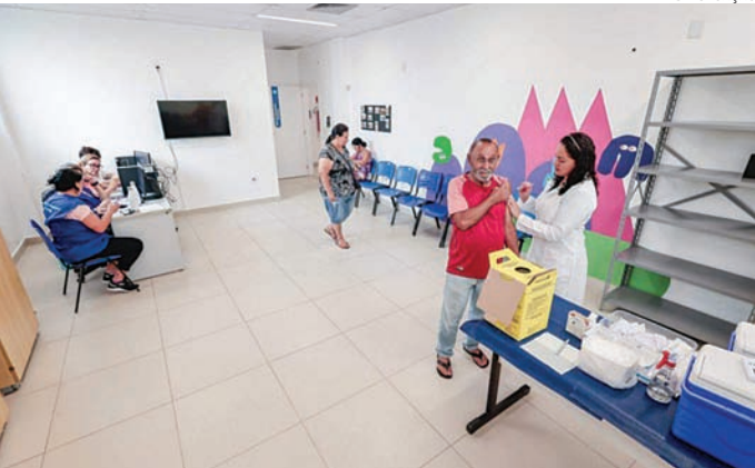
A aplicação da dose ocorre, preferencialmente, no período da manhã