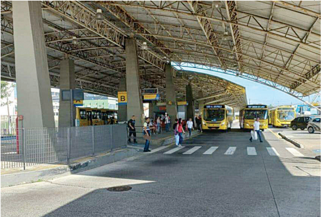
O conflito começou dentro do Terminal Vila Arens e continuou no bairro Jundiaí-Mirim, quando a vítima desembarcou

A Guarda Municipal de Jundiaí informa que não foi acionada para esta ocorrência específica e não há registros da mesma no sistema da corporação. Ainda assim, a Unidade de Gestão de Segurança Municipal (UGSM) está colaborando com a Delegacia de Investigações Gerais (DIG), fornecendo imagens do sistema de monitoramento que possam auxiliar na elucidação do caso.