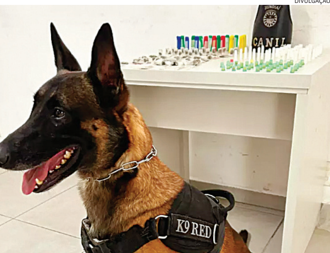
Os agentes colocaram o cão farejador em ação

Guardas Municipais de Operações com Cães apreenderam drogas que estavam escondidas em uma bananeira, num ponto de tráfico no bairro Santa Gertrudes, em Jundiaí. A ocorrência foi nes-