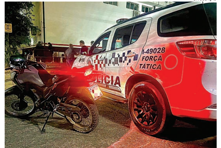
Uma moto roubada foi recuperada pelos PMs

temente, incluindo ações criminosas em postos de combustíveis localizados na avenida Dom Pedro I, em Várzea Paulista, e na Estrada da Bragantina, em Campo Limpo Paulista.