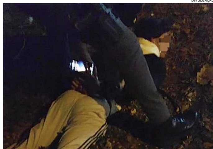
O suspeito foi encaminhado ao Plantão, onde foi preso em flagrante

Com as características do bandido, os policiais iniciaram buscas pela região.