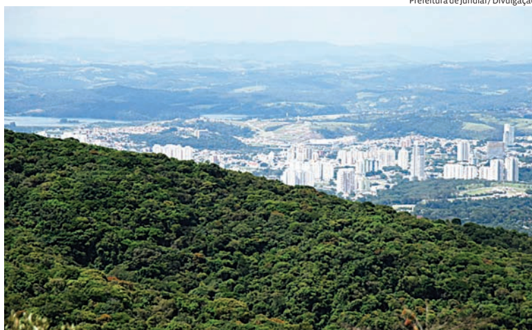
Projeto de preservação definitiva à Serra deve passar por audiência pública

Um grupo de cerca de 3 mil entidades empresariais, entre elas a Federação das Indústrias do Estado de São Paulo (Fiesp), divulgou nesta terça-feira (9) manifesto em defesa da PEC nº 12/2026, conhecida como PEC do Trabalho Flexível. A proposta, apresentada pelo senador Rogério Marinho (PL-RN), prevê a possibilidade de adoção de jornadas baseadas em horas flexíveis mediante escolha do trabalhador. Segundo o movimento, a medida preserva direitos como 13º salário, férias, FGTS e INSS, ao mesmo tempo em que amplia a autonomia dos empregados para adequar a jornada às necessidades pessoais e profissionais. O texto aguarda análise da Comissão de Constituição e Justiça (CCJ) e é apresentado por seus defensores como alternativa ao debate sobre o fim da escala 6x1.