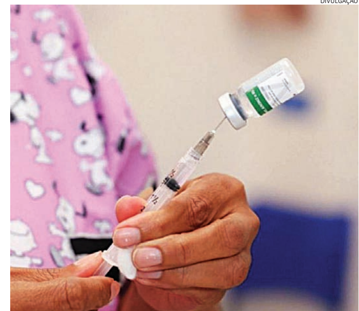
A suspensão temporária vale para alguns grupos

diaí não foi registrado nenhum caso de reação grave ou óbito relacionado à aplicação da vacina e que a suspensão temporária afeta os públicos contemplados por essa estratégia de vacinação, incluindo profissionais de saúde e pessoas de 59 anos, que receberam o imunizante pelo Instituto Butantan.