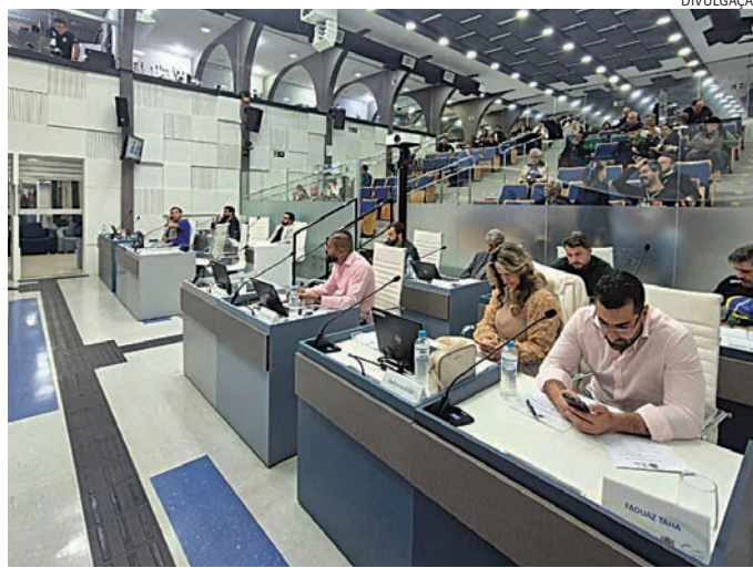
Câmara estava quase vazia durante aprovação de projetos