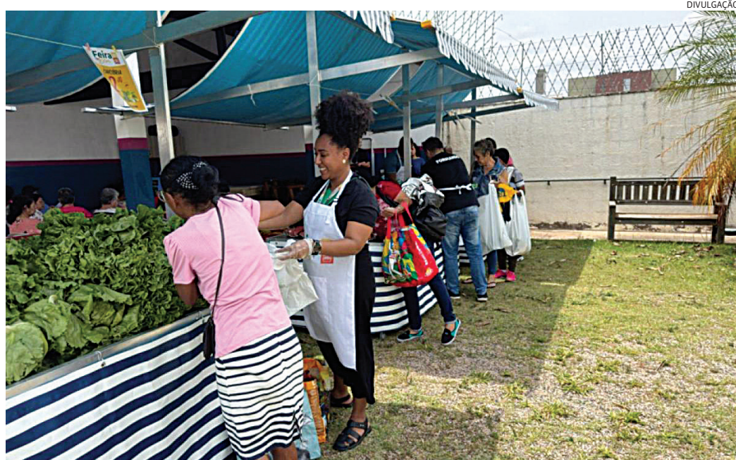
A Feira do Bem já distribuiu cerca de 7,2 toneladas de alimentos