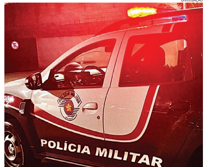
O capturado foi encaminhado ao DP, onde o mandado foi cumprido

Em consulta aos sistemas policiais, foi constatado que havia um man-