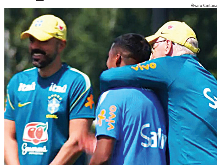
Seleção faz ajustes finais antes do duelo contra Marrocos na estreia

Durante os primeiros minutos liberados para a imprensa, os atletas participaram de exercícios físicos e movimentações com bola. A comissão técnica aproveitou os dias finais antes da