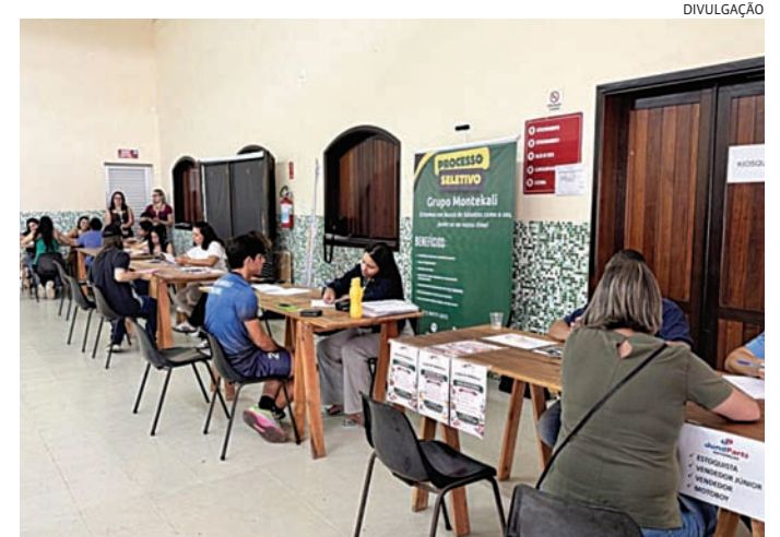
A ação acontece na Paróquia Nossa Senhora de Fátima

Os interessados devem comparecer ao local com documentos pessoais e currículo atualizado. O atendimento é gratuito e será realizado por ordem de chegada. A Paróquia Nossa Senhora de Fátima fica na rua Guatapar, 26.