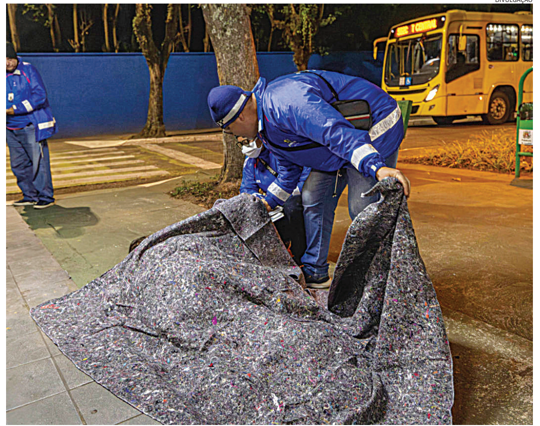
O acolhimento é oferecido, mas também é dada a oportunidade do recâmbio