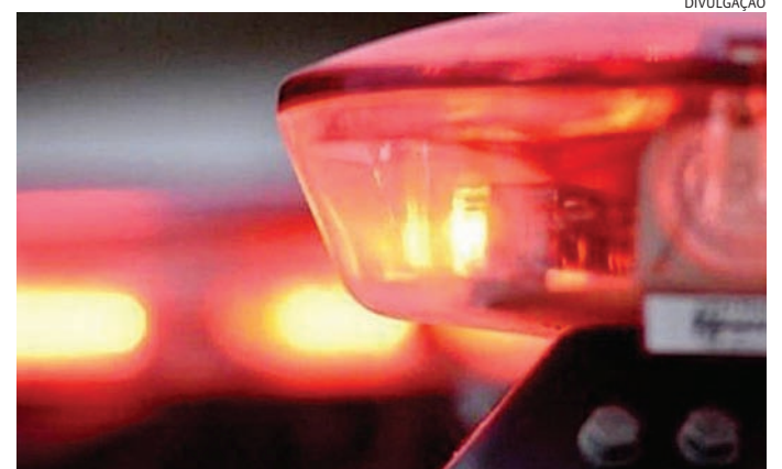
O adolescente foi conduzido ao DP, onde ficou à disposição da Justiça

dras de crack. O adolescente foi conduzido à delegacia, juntamente com as drogas apreendidas. Após o registro da ocorrência, ele permaneceu à disposição da Justiça.