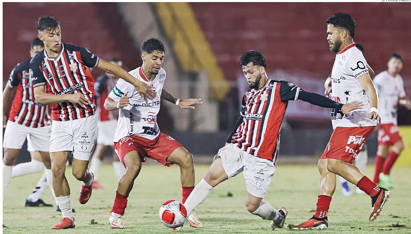
O Paulista estreia no torneio no dia 22 de janeiro de 2025, às 20h, em casa

Todos os jogos do Galo na primeira fase serão às quartas e sábados. Dos oito jogos fora de Jundiaí, entretanto, três serão às 15h de uma quarta-feira: diante do Jabaquara, em Santos, do Nacional, em São Paulo, e do Taquaritinga, no interior do estado.