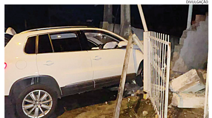
Os bandidos perderam o controle e bateram, invadindo uma casa

Quando estavam no bairro Igoturucaia, os bandidos perderam o controle e bateram, invadindo o quintal de uma casa. Eles rapidamente desembarcaram e correram para lados opostos, sendo um deles alcançado e detido.