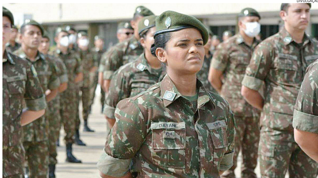
Mulheres podem integrar as Forças Armadas do Brasil para aumentar o efetivo das corporações