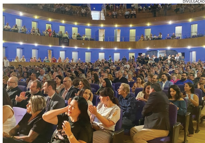
Posse e alinhamentos marcaram a o evento no Polytheama