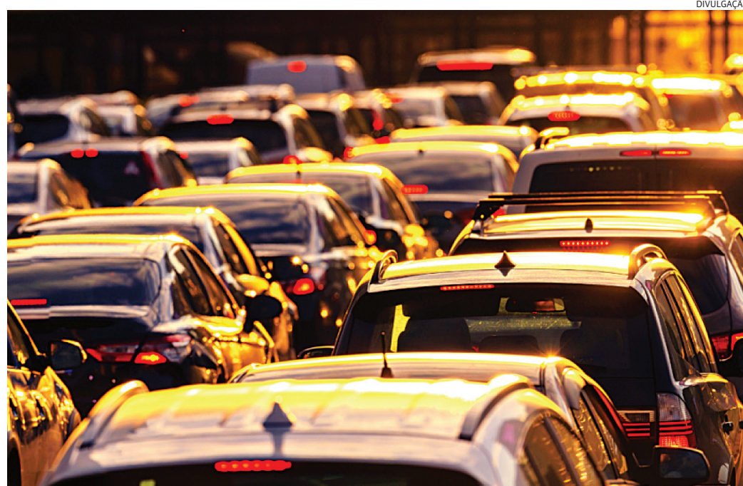
Veículos com menos de 20 anos têm o imposto, que deve ser pago anualmente

Os caminhões têm prazos diferenciados: para o pagamento integral em janeiro é concedido desconto de 3%. Aos que escolherem pagar em cota única, sem desconto, o vencimento será em 22 de abril. Para os proprietários que optarem pelo parcelamento em três, quatro ou cinco vezes, sem desconto, os vencimentos são em 20 de março, 20 de maio, 20 de julho, 20 de agosto e 20 de setembro.