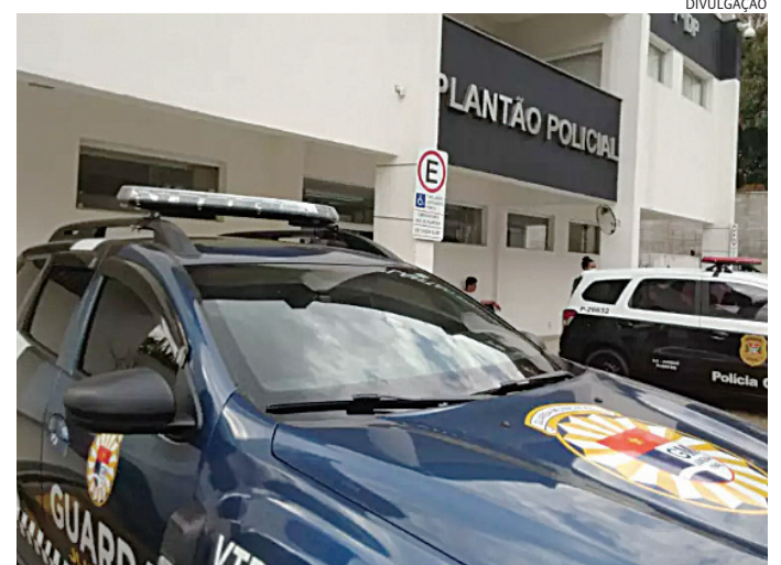
Os guardas prenderam o suspeito e recuperaram os produtos furtados

Ela telefonou para a GM, que enviou uma equipe. Os guardas coletaram as características do bandido e saíram à caça, rumo a uma área estratégica, na Ponte São João - próximo à cracolândia