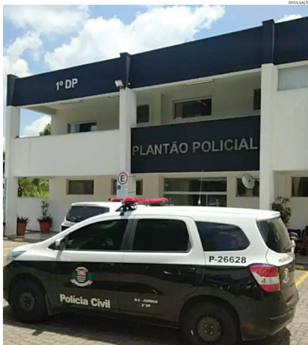
Os registros de crimes, de modo geral, diminuíram em relação a 2023 em Jundiaí

Já no tocante à violência física dolosa, quando existe a intenção de ferir, Jundiaí teve 992 registros entre janeiro e novembro passados. No ano de 2023,