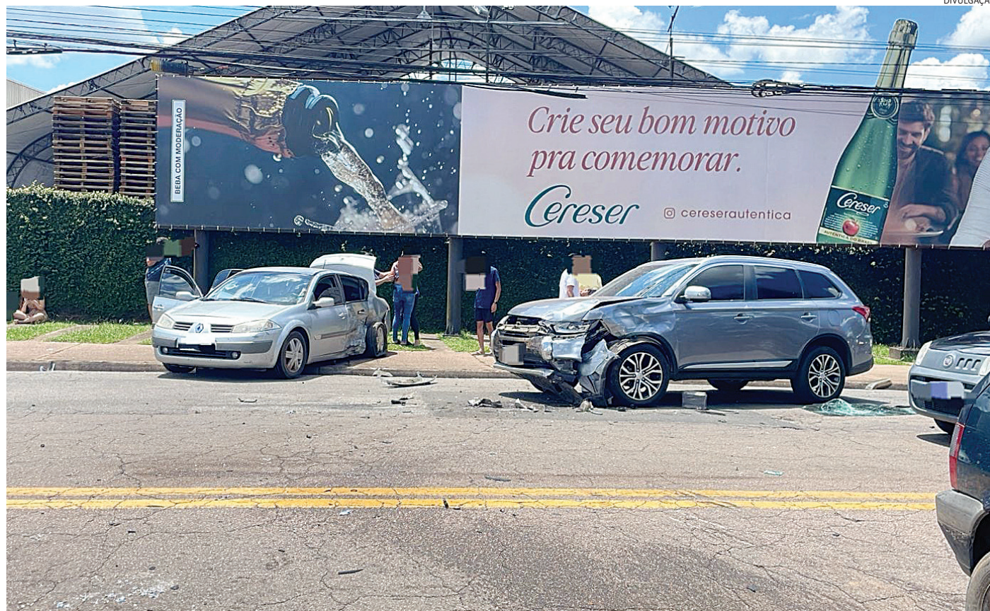
O criminoso precisou ser socorrido ao hospital com vários ferimentos

relato aos PMs, ele havia acabado de ir ao São Camilo, onde comprou drogas - no chão do carro foi localizado uma cápsula de cocaína.