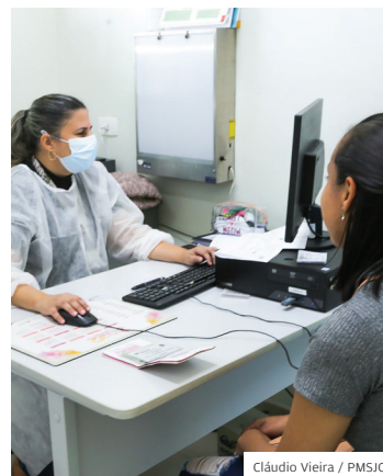
Atenção. Não é preciso agendar

SAÚDE. A Prefeitura realizou em 23 de novembro, mais uma edição do Bem Me Quero, programa que tem como objetivo cuidar da saúde da mulher com exames ginecológicos preventivos e encaminhamento para mamografia. Não é necessário agendamento prévio. Basta comparecer numa das unidades durante o horário de funcionamento do programa.