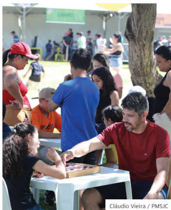
Lazer. Conexão reúne famílias

AÇÃO. O dia 24 de novembro começou um pouco nublado mas o tempo melhorou e fez a festa de quem foi ao Centro Poliesportivo Jardim Cerejeiras. A região leste da cidade recebeu mais uma edição do Conexão Juventude, realizado pela Prefeitura de São José dos Campos. Foi uma tarde inteira de atrações gratuitas para a comunidade.