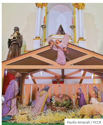
Paulo Amaral / FCCR

VISITE. O Museu de Arte Sacra, que fica ao lado do Mercado, na região central, iniciou a sua tradicional exposição de presépios. A abertura aconteceu em 26 de novembro, como parte da programação de Natal. A exposição, que vai até 31 de janeiro de 2025, é gratuita. O Museu fica aberto de terça a sexta-feira, das 9h às 17h, e aos sábados, das 9h às 14h.