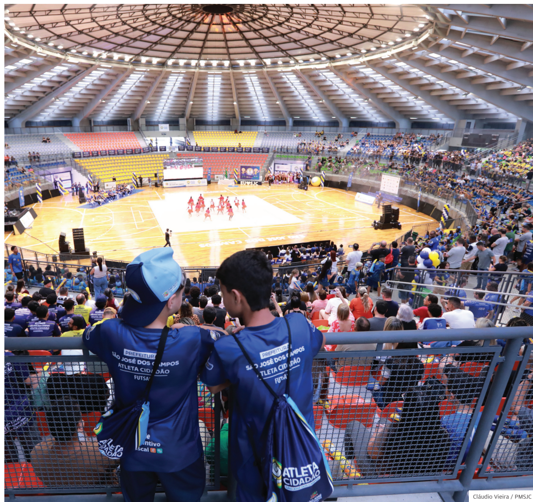
Festa. Programa Atleta Cidadão comemorou 25 anos com evento festivo no Teatro, na Vila Industrial

Não é nenhuma novidade que a região leste de São José cresce cada vez mais. Mas, além dos investimentos em obras, a Prefeitura amplia serviços que garantem qualidade de vida para as pessoas. Confira um pouquinho do que rolou em novembro.