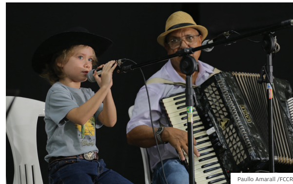
Novo Horizonte. Roda de viola no bairro todo mês