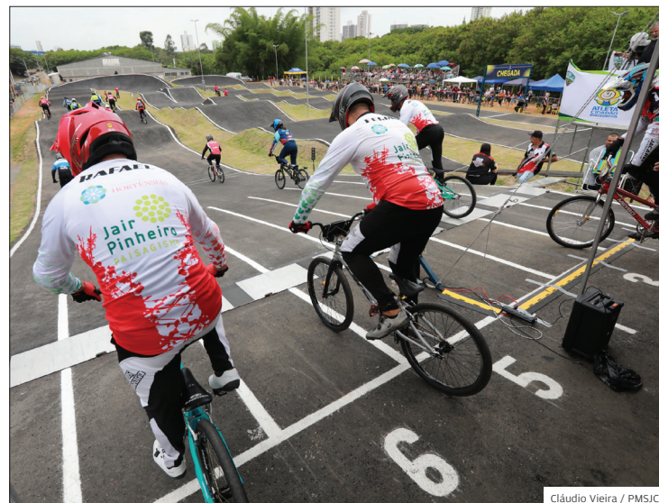
Marca. Após 11 anos, São José voltou a sediar prova da modalidade