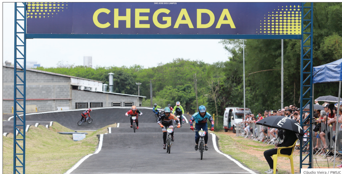
Pedal. Mais de 300 atletas participaram em novembro da 7ª Etapa do Campeonato Paulista de BMX

OBRAS COM 420 METROS DE EXTENSÃO, PISTA DE BMX DO PARQUE INDUSTRIAL PASSOU POR REFORMA SIGNIFICATIVA