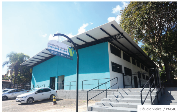
Tesouro. Casa Chico Triste celebra 28 anos com festa