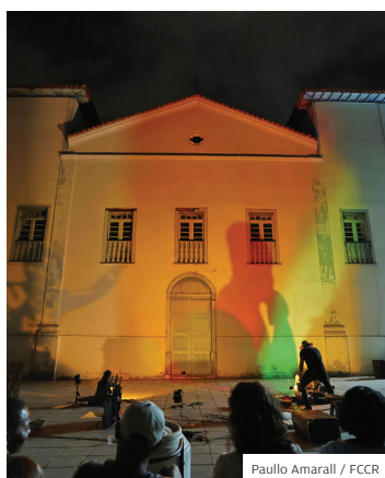
Paullo Amarall / FCCR

EVENTO. O Dia Nacional da Consciência Negra foi celebrado com muita festa, atraindo cerca de 1.500 pessoas ao Largo São Benedito, na região central. Durante sete horas, as diversas atrações de manifestações artísticas e culturais emocionaram e animaram o público, que acompanhou e participou de atividades na região central.