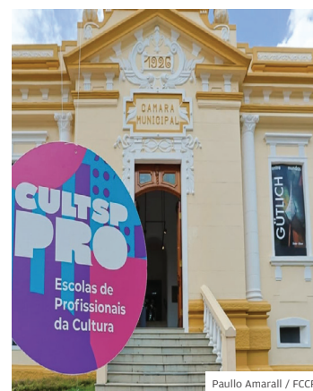
Paullo Amarall / FCCR

GRATUITOS. O Museu Municipal abriu as portas em novembro para o GiroSP Pro, evento de apresentação das iniciativas do CULTSP PRO. No evento, foi apresentado o CULTSP PRO, programa composto por seis escolas temáticas, além de um programa especial de qualificação, cada uma com foco em diferentes áreas da cultura e economia criativa.