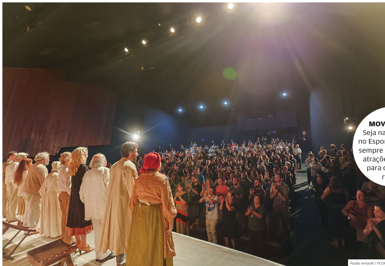
Paullo Amarall / FCCR