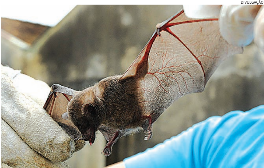
Ações preventivas estão sendo feitas na região do Medeiros pela VISAM

As prefeituras de Jarinu, Cabreúva e Louveira foram procuradas, mas não retornaram aos questiona-