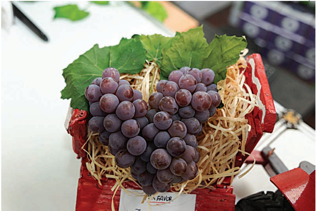
A Niagara, carro-chefe da Festa da Uva, agora é reconhecida nacionalmente

“A conquista da Indicação Geográfica da Uva Niagara Rosada de Jundiahy é um divisor de águas para a nossa agricultura. Olhem para o exemplo da região de Champagne, na França: o