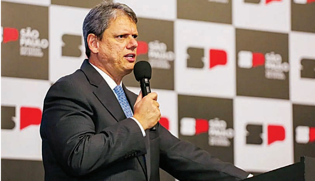
Governador de São Paulo mantém agenda interna, após cancelar visita a Bolsonaro

Ele havia sido informado de que Bolsonaro queria vê-lo e aceitou o convite, de acordo com integrantes de sua equipe, para reforçar ao ex-presidente que tem pro-