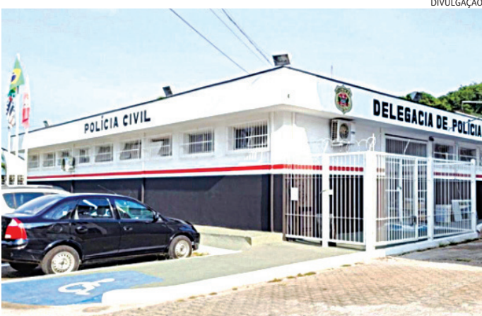
A PM atenuou a ocorrência e a Polícia Civil vai investigar o caso

se deslocaram até o hospital, onde a vítima permanecia internada e consciente. Aos policiais, ele relatou que o autor dos disparos seria o filho de uma mulher com quem manteve um relacionamento amoroso, acreditando que esse tenha sido o motivo do ataque.