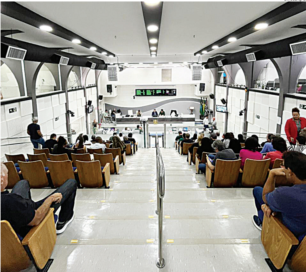
Parlamentares vivem últimos dias de recesso e se preparam para o retorno às sessões em fevereiro