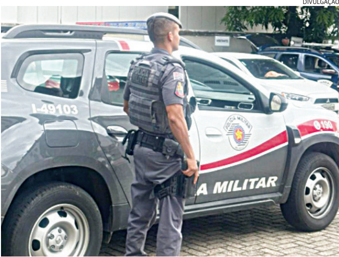
Os PMs conduziram o suspeito ao DP, onde ele foi preso em flagrante

A mulher havia deixado a residência sem informar