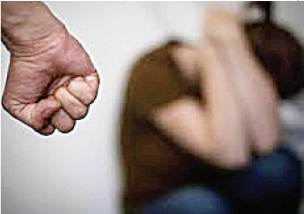
A mulher disse que o marido é violento já a agrediu outras vezes

O entregador realizava entregas pelo bairro Ivo-turucaia quando foi surpreendido pela mulher, que correu em sua direção acompanhada dos filhos, pedindo ajuda. Ela relatou que havia sido agredida pelo marido, que dizia que