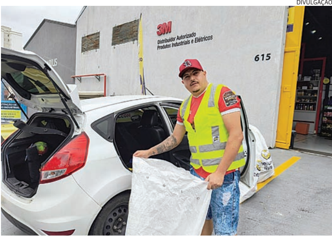
Anderson Silva paga o estudo das filhas e a construção da casa