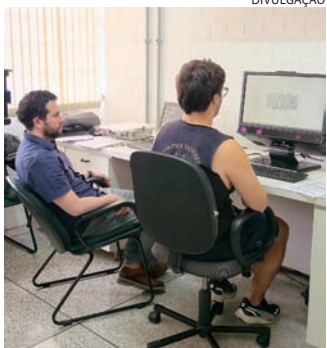
A participação da população pode ajudar no tratamento