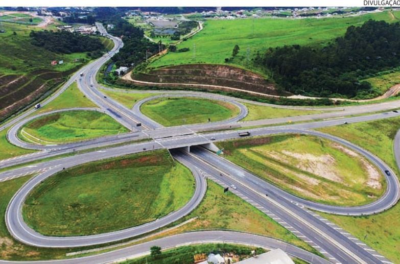
Na região, Itatiba, Jundiaí, Jarinu e Louveira receberam R$ 14,7 milhões

dro garante a ligação entre a Região Metropolitana de Campinas (RMC) e o Vale do Paraíba e tem um total de 297 km de extensão. A malha administrada pela Rota das Bandeiras é composta pelas rodovias D. Pedro I (SP-065), entre Campinas e Jacareí, José Roberto Magalhães Teixeira (SP-083), entre Campinas e Valinhos, Perimetral de Ita-