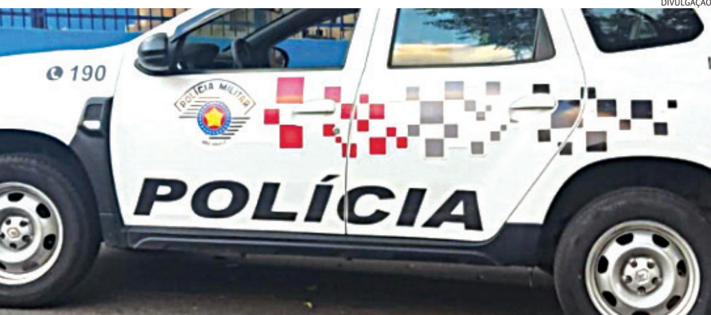
Os PMs prenderam o ex-marido por lesão corporal

A ocorrência foi registrada no Plantão Policial como tentativa de homicídio de autoria desconhecida, já que o suspeito não havia sido identificado.