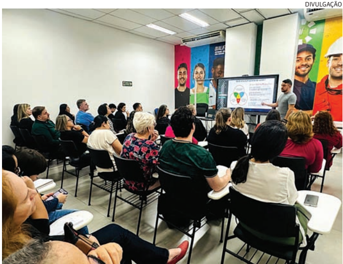
A palestra será no dia 5 com foco na venda para empreendedores

A participação é gratuita, mas os organizadores solicitam a doação de 1 litro de leite, que será destinado ao Fundo Social de Solidariedade de Jundiaí.