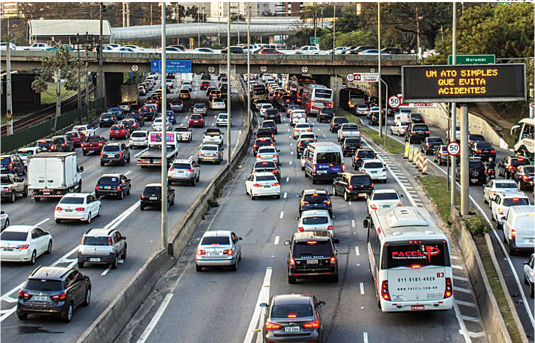
Até setembro de 2025 foram registrados 59.354 veículos com opção elétrica

Vale frisar que os veículos parcialmente elétricos ou com a alternativa do álcool podem ser do tipo flex, que permite o uso de gasolina. Já a fatia de veículos 0km puramente elétricos passou de 429 em 2019 para 16.643 até o mês de setembro, um aumento superior a 3.780% em seis anos.