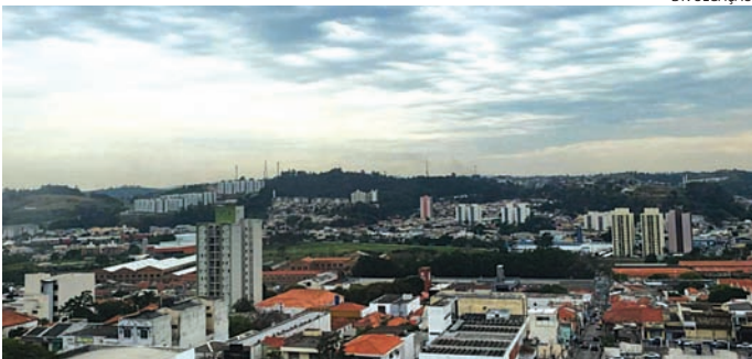
O final de semana deve ser chuvoso, mas nada além da média normal

O mês de novembro começará chuvoso. Há previsão de precipitações no sábado (1) e principalmente no domingo (2) e na segunda (3). A terça (4) promete trégua, mas a chuva deve voltar na quarta (4) e se estender novamente até o fim da próxima semana, segundo o Climatempo.