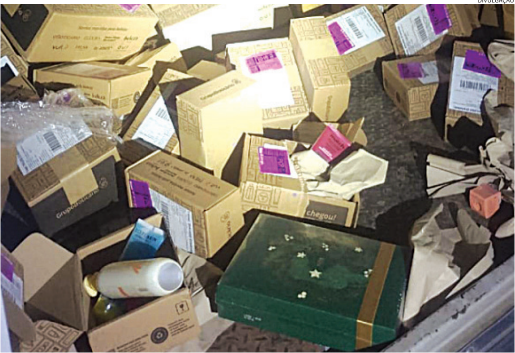
O caminhão e a carga recuperados foram devolvidos à empresa