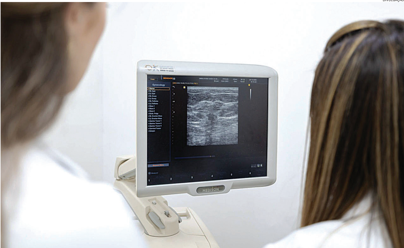
O Ambulatório de Saúde da Mulher de Jundiaí marca o início de um estudo conduzido em parceria entre a FMJ, o hCOR e a Unifesp

“Esse procedimento representa uma das principais