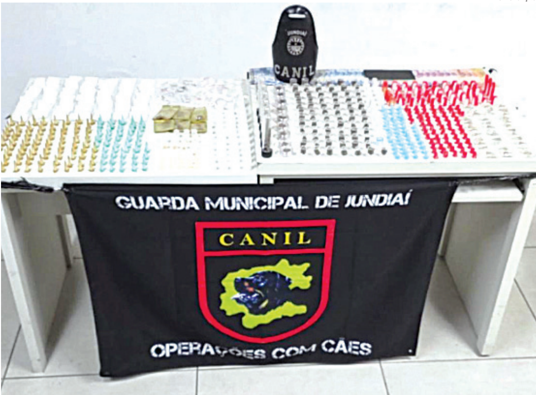
Com eles foram apreendidas 671 porções de entorpecentes

ções de entorpecentes, além de mais de R$ 200. Ambos foram conduzidos à delegacia, onde o maior foi preso em flagrante e, o adolescente, ficou apreendido. A ocorrência contou com apoio dos GMs Odirley, Marco e Ferreira.