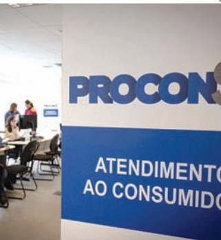
O Procon reforça a atenção para propostas que chegam por telefone

Em um empréstimo com 48 parcelas, por exemplo, um trabalhador da iniciativa privada pode pagar juros que vão de 2,66% ao mês a 5,39% ao mês, dependendo do banco — uma diferença superior a 100%,