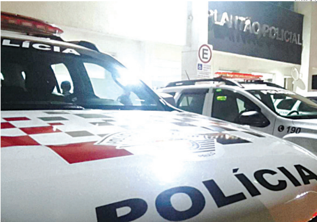
Os PMs conduziram as partes para o DP, onde o idoso foi preso

Um caminhoneiro de 75 anos foi preso em flagrante por crime de racismo contra um colega de profissão, nesta quarta-feira (29), enquanto ambos estavam em uma empresa no Distrito Industrial de Jundiaí, para serviço de carga/descarga e pesagem. O idoso não gostou de ser provocado pelo colega, de 48 anos, com os dizeres “tem que se aposentar”, e então retrucou com “tinha que ser preto, tinha que ser macaco”. O suspeito do crime precisava realizar uma manobra para acessar o portão da empresa. Este motorista solicitado atendeu ao pedido do idoso e, logo em seguida, outro caminhoneiro chegou com seu veículo. Teve início então uma discussão e tumulto. Durante o bate-boca, a vítima gritou para o idoso: “não precisava desse tumulto, tinha que se aposentar”. O idoso se revoltou, foi até o caminhoneiro que lhe provocou e emendou: “tinha que se preto” e “tinha que ser macaco”. A Polícia Militar foi acionada e compareceu ao local, conduzindo os envolvidos e também uma testemunha até o Plantão Policial. O idoso acabou preso em flagrante.