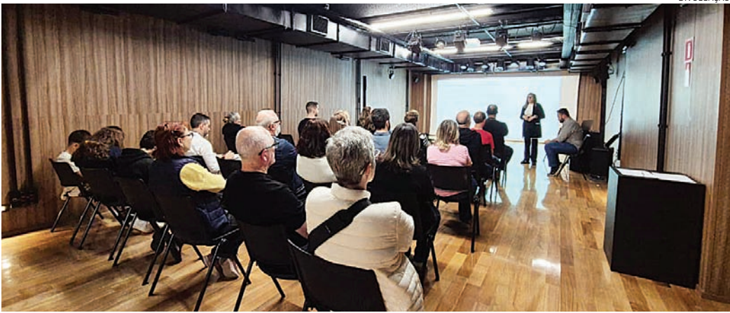
Grupo tem avançado em discussões que buscam melhorar as condições da região central

O ministro Alexandre de Moraes, do STF, determinou nesta quinta-feira (30) o início do cumprimento da pena do tenente-coronel Mauro Cid, condenado a dois anos de reclusão, em regime aberto, pela participação na trama golpista de 2022. O militar deve participar de uma