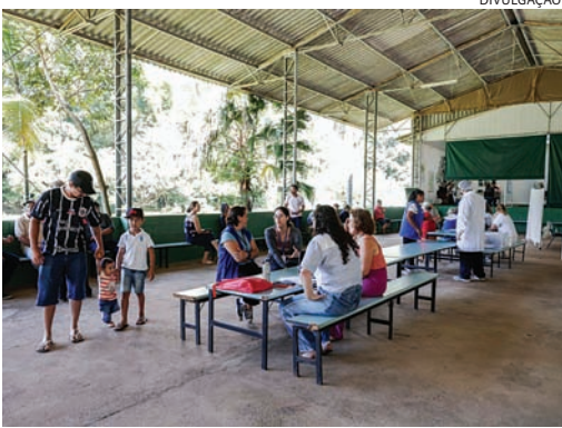
Os moradores poderão acessar atendimentos e orientações do CRAS

No mesmo dia, a população da área rural contará com atendimento da UBS Maringá, que realiza o Consultório Avançado de Saúde. A ação ocorre uma vez por semana no CREAM e oferece atendimento clínico para adultos, feito por or-