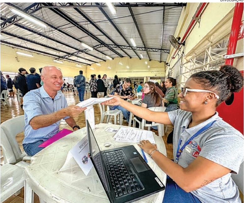
Há emprego para diversas faixas etárias, PCDs e para quem busca 1ª oportunidade

Bairros, desta vez no Centro Comunitário São Francisco de Assis (Cáritas). A iniciativa levará aos moradores da região mais de 1.200 vagas de emprego, em diferentes áreas e níveis de formação. Cidades 4