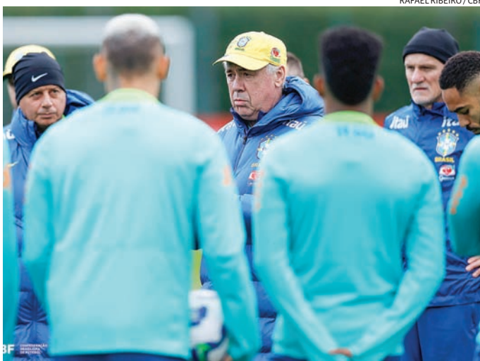
Ancelotti concederá entrevista coletiva antes do treino de hoje

Durante a atividade, o treinador distribuiu coletes para Marquinhos, Gabriel Magalhães, Wesley, Caio Henrique, Bruno Guimarães, Fabinho, Rodrygo, Luiz Henrique, Vitor Roque e Vini Jr. A tendência é que a equipe atue com força máxima entre os convocados, retomando o esquema 4-2-4 usado na goleada sobre a Coreia do Sul. A provável formação tem Ederson; Wesley, Marquinhos, Gabriel Magalhães e Alex Sandro; Bruno Guimarães e Casemiro; Estevão, Matheus Cunha, Rodrygo e Vini Jr. Antes da atividade, Ancelotti conversou indivi-