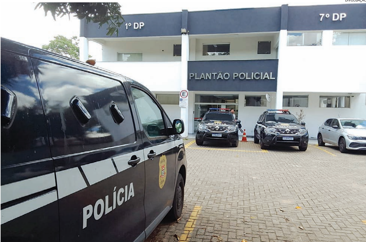
A vítima foi levada para o HU, onde foram confirmadas múltiplas fraturas

Um homem de 43 anos e sua esposa, de 37, foram presos na noite desta quarta-feira (12), em uma escola particular infantil, na Vila Municipal, em Jundiaí, suspeitos de violência com requintes de tortura