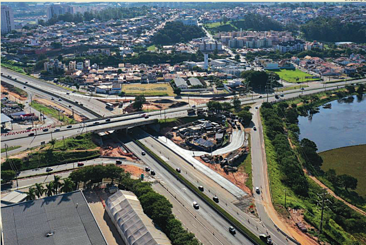
Geraldo Dias é uma das rodovias com crescimento de acidentes na Região

Gut, aumento de 45% em comparação ao mesmo período do ano passado, que teve 101 sinistros e três mortes. Cidades 4