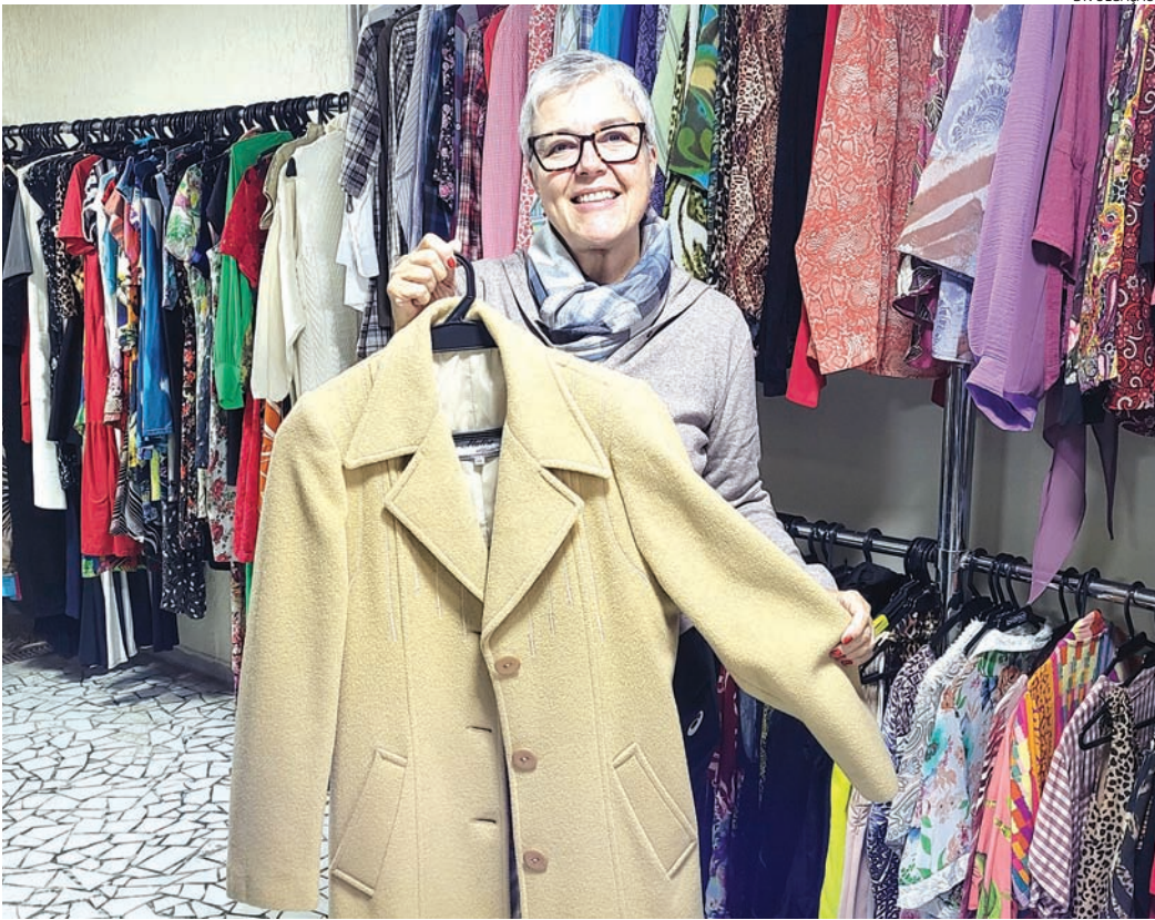
As doações serão recebidas sempre às quartas-feiras no hospital

A iniciativa tem dupla importância: contribui financeiramente para o Hos-