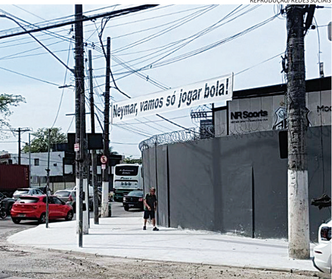
Neymar, vamos só jogar bola”, diz a faixa