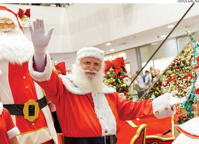
Papai Noel está instalado na Entrada do Sol para fotos e pedidos

A vacinação também é oferecida gratuitamente durante todo o ano no posto fixo da VISAM para cães e gatos a partir de três meses de idade. O endereço é Rua dos Bandeirantes, 375 – Ponte de Campinas e os tutores devem agendar o atendimento pelos telefones (11) 4589-6340 e 4589-6350.