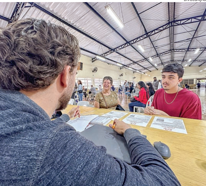
Serão ofertas para vários tipos de empresas e cargos

a presença do Sesi Jundiaí, que irá apresentar o programa SEJA PRO+ Trabalho e Emprego. A iniciativa busca oferecer uma segunda oportunidade para jovens entre 18 e 29 anos concluir a Educação Básica, obter qualificação técnica e ampliarem o acesso ao mundo do trabalho.