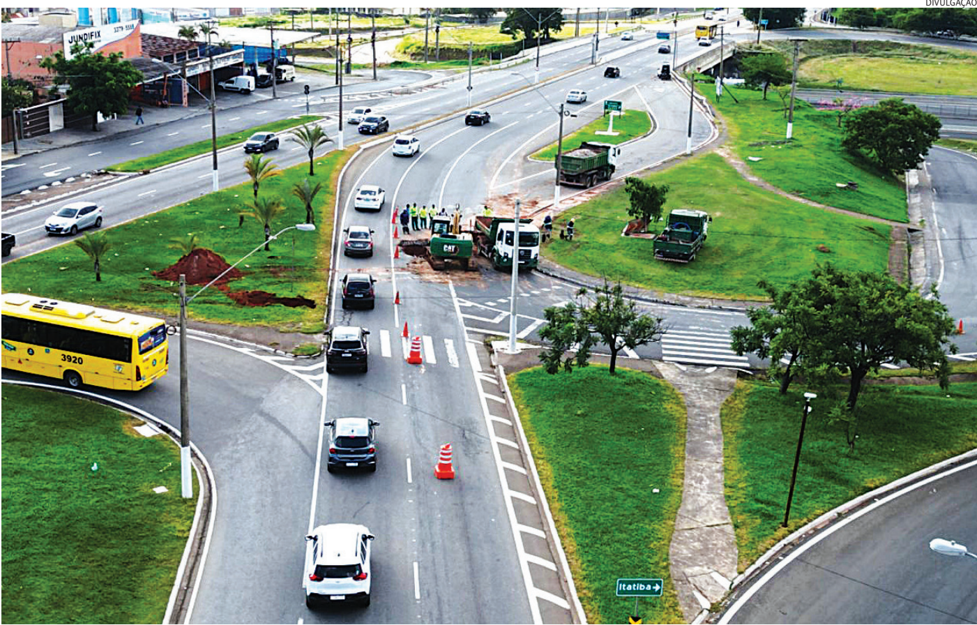
A Geraldo Dias, sob a concessão da DER, tem sido alvo de acidentes constantes

Em contrapartida, outras rodovias que cortam