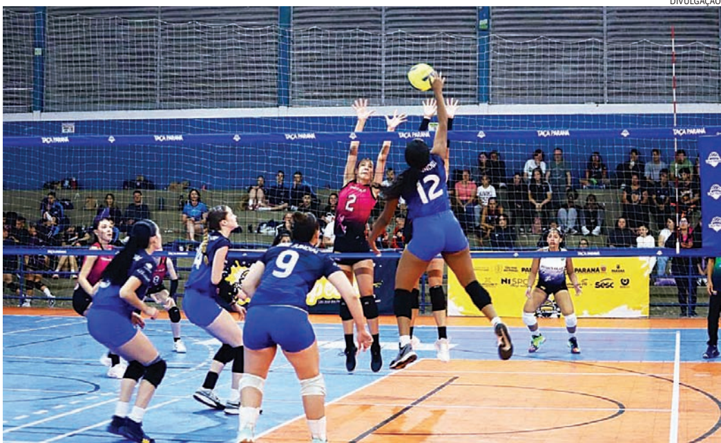
No sub-19, Jundiaí garantiu vaga na semi após vencer Vinhedo