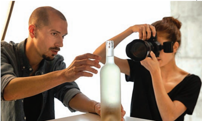
Entre os cursos oferecidos está o de fotografia para e-commerce

Cada participante poderá se inscrever em apenas um curso. A lista dos contemplados será publicada no site da Prefeitura, e os selecionados receberão uma mensagem via WhatsApp para confirmar a ma-