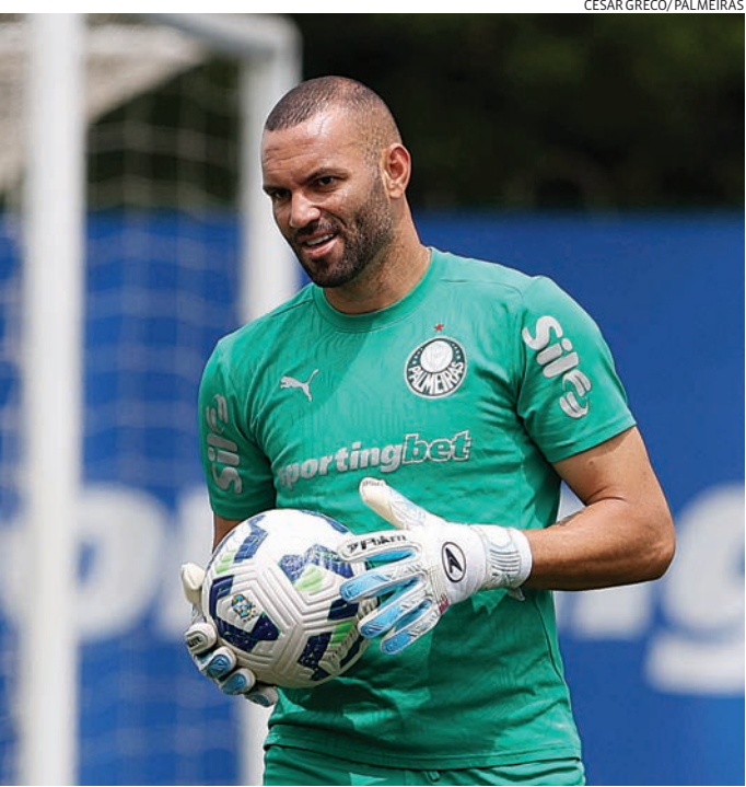
O goleiro se recupera de uma fissura na mão direita