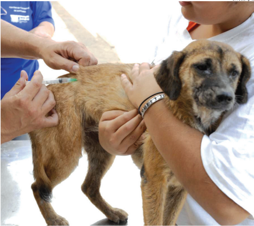
No final de semana tem postos preparados na Vila Arens com doses gratuitas

Visam realiza ações de vacinação específica na região da Vila Arens – bairro onde houve a confirmação do caso. A imunização acontecerá nas praças Gal. Newton Estilac Leal (Av. Samuel Martins X R. Bento Pires) e Sebastião Pontes (Praça do Coreto). No sábado (15), a ação será repetida na praça Gal. Newton Estilac Leal e no estacionamento da Faculdade de Medicina de Jundiaí (FMJ), na