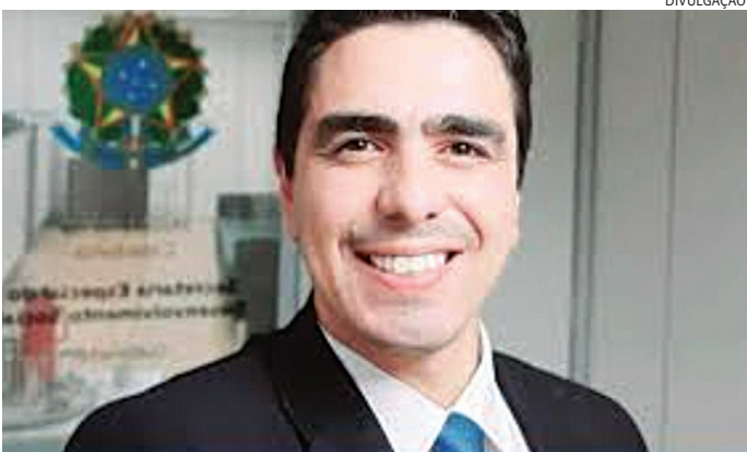
Adeildo Nogueira acumula polêmicas desde que foi eleito prefeito

O ex-ministro do Trabalho e Previdência Social José