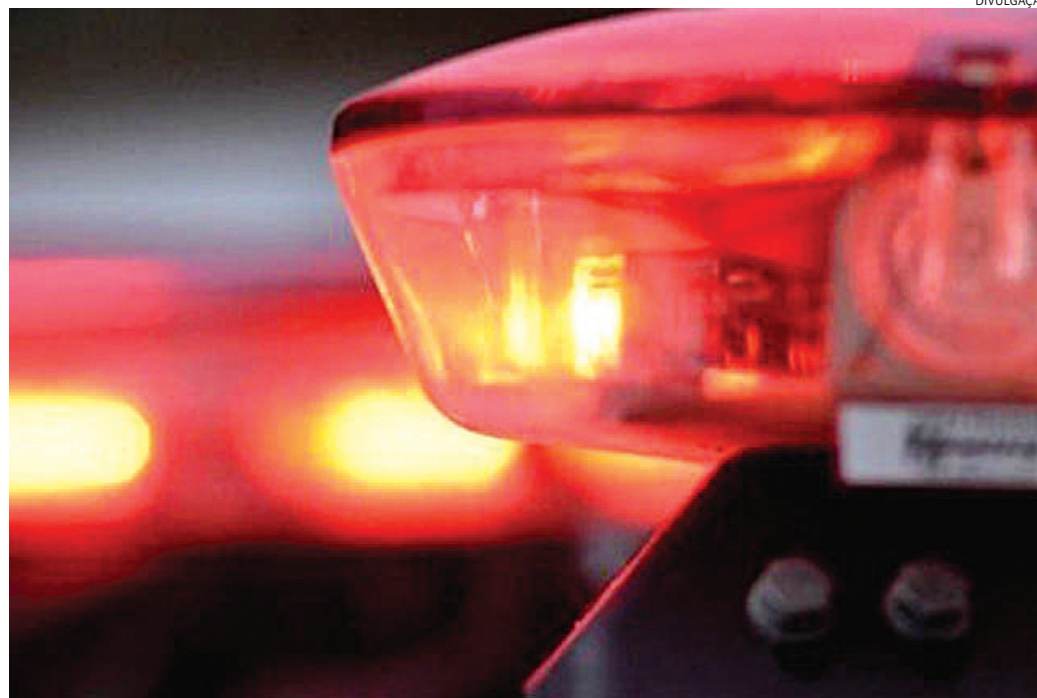
O suspeito foi preso em flagrante por tentativa de roubo

A vítima contou que estava com o filho no veículo, aguardando o marido, que estava no supermercado fazendo compras. Nesse momento um homem encostou no automóvel e ela o questionou se ele desejava algo. “Foi aí que ele se afastou sem dizer nada, mas retornou logo em seguida armado com uma faca e for-