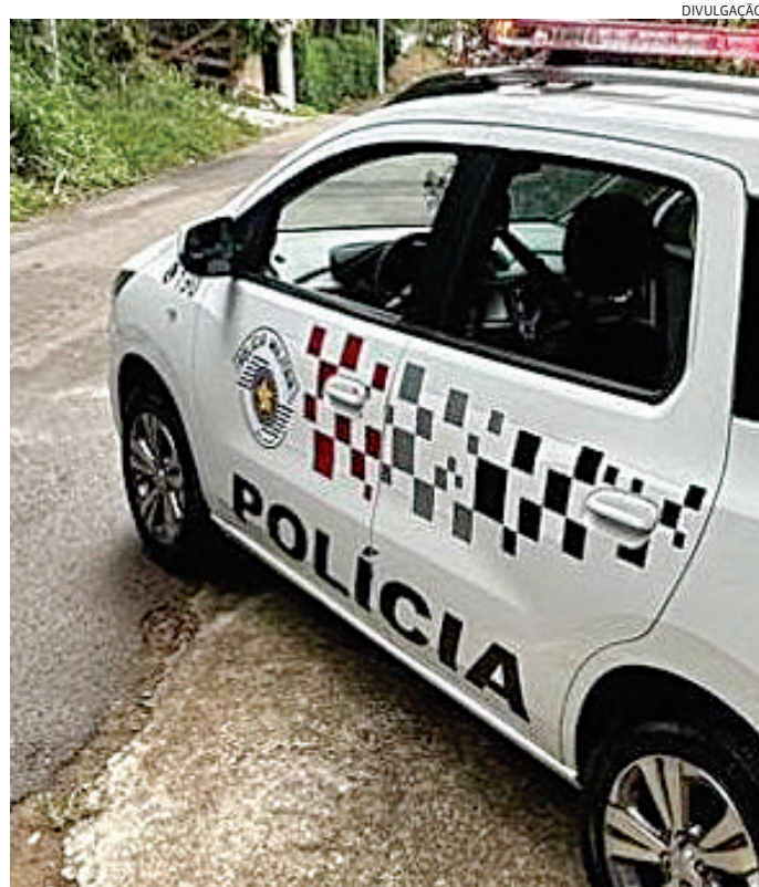
A Polícia Militar foi acionada e deteve o ex-companheiro da vítima

Em seu relato à polícia, ela contou que estava dentro de casa, quando ouviu barulho de alguém abrindo o portão. “Inicialmente acreditei que fosse meu sogro. No entanto, ao verificar a situação, constatei que se tratava de meu ex-companheiro, contra quem posuo uma medida protetiva de urgência em vigor. Diante disso, imediatamente fechei a porta, mas fui surpreendida por um empurrão dado por ele, que conseguiu abri-la à força”, disse ela. “Percebi então que ele aparentava estar embriagado. Assim que ele entrou na residência, com o barulho da porta nossa filha acordou assustada e começou a gritar. Nesse momento, ele preferiu xingamentos contra mim. Tentei dialogar, mas ele apresentava falas desco-