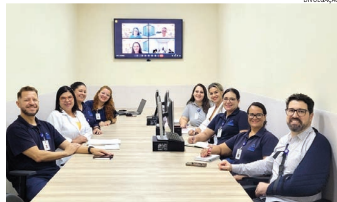
Profissionais participam de treinamento para início do DRG

Criado na década de 1970, na Universidade Yale, nos Estados Unidos, o método chegou ao Brasil, em 2011. Entre públicos e particulares, alguns hospitais conceituados já utilizam o recurso. “Criamos um setor direcionado para aplicação da metodologia. O departamento é constituído de profissionais codificadores, formado por três enfermeiras que, com o auxílio da tecnologia, irão levantar as informações disponíveis em cada categoria do DRG clínico e