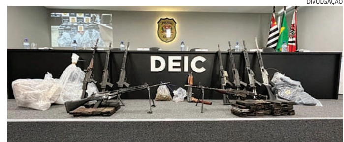
As drogas e armas foram apreendidos em um sítio

No decorrer das apurações, os policiais identificaram que a quadrilha mudou a rotina para evitar a localização do bando. No entanto, com o monitoramento de um