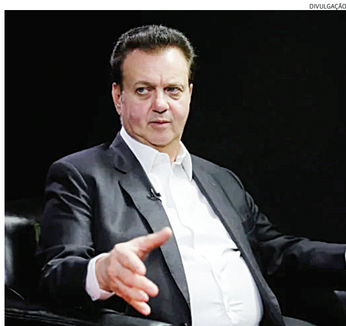
Super-secretário, Gilberto Kassab, sai fortalecido das eleições