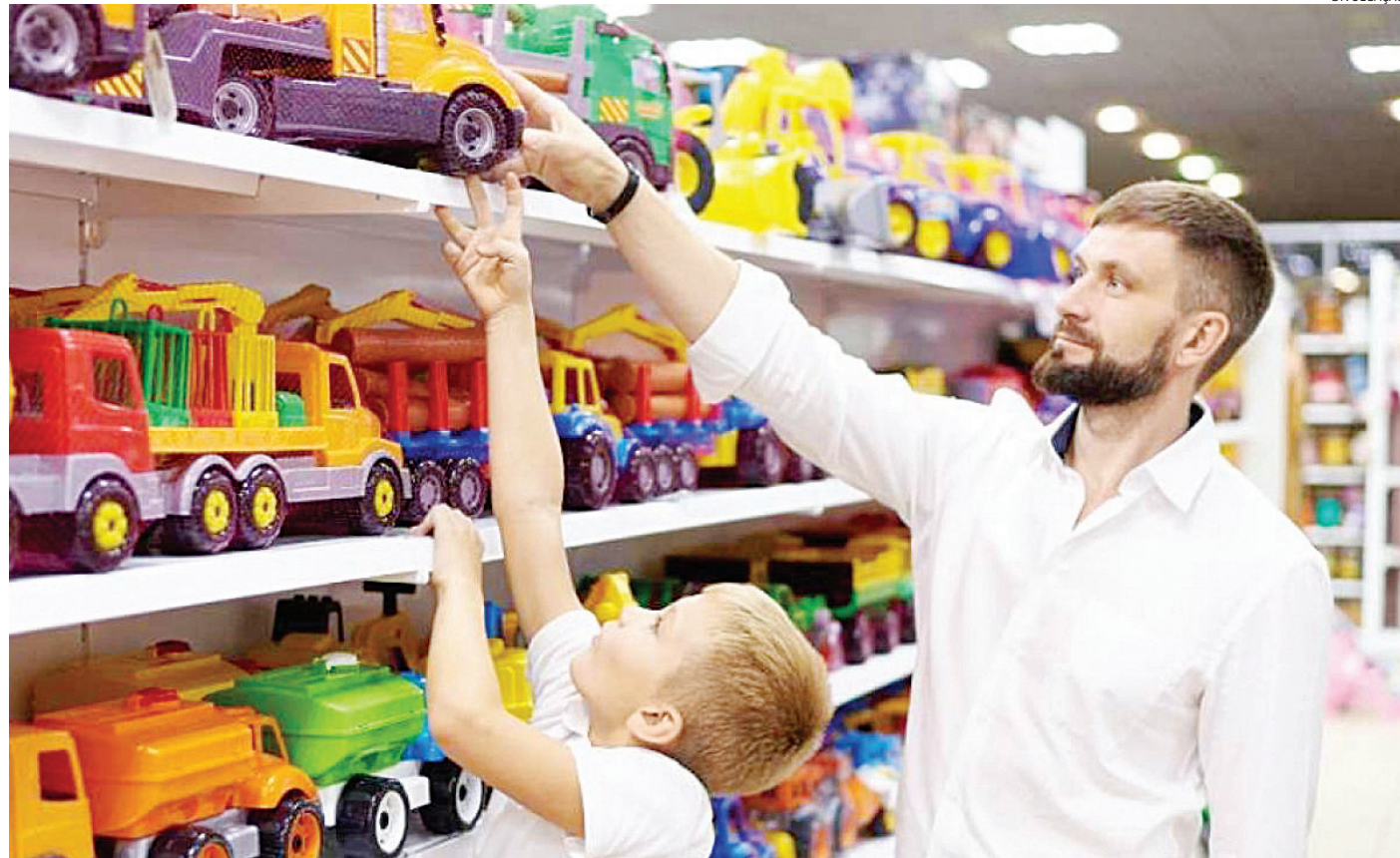
Os brinquedos lideram a lista de itens mais procurados, com 55% das intenções de compra, seguidos por eletrônicos (40%) e roupas (5%)

Os lojistas já estão se preparando para a alta demanda, com 58% deles relatando um aumento nos estoques. A pesquisa também revela que 44% dos comerciantes acreditam em um desempenho positivo nas vendas, especialmente no comércio físico, que continua a ser a principal escolha dos consumidores. Shoppings e lojas de rua deverão atrair 54% do público, enquanto o e-commerce mantém sua relevância,