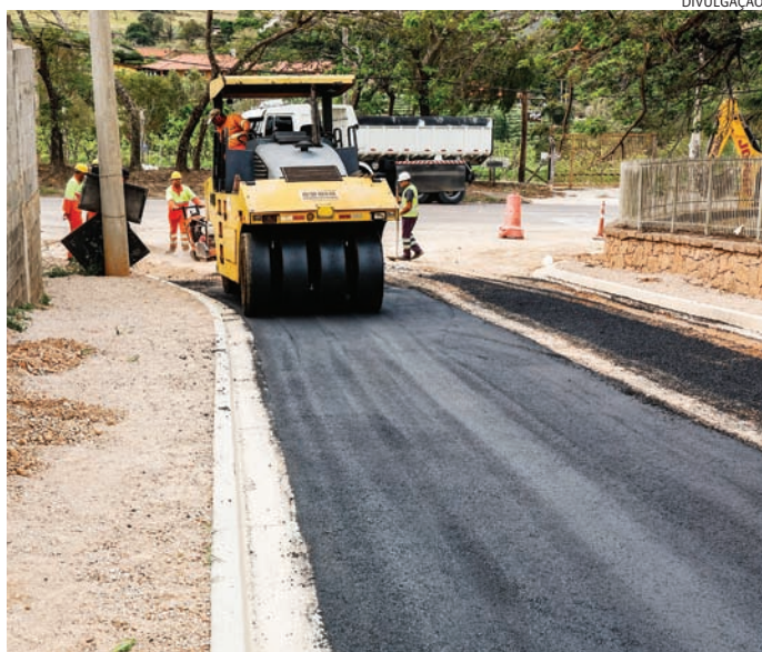
O investimento no programa, neste ano de 2024, é de R$ 4,8 milhões