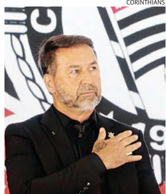
O encontro pode ter sido decisivo sobre a situação do presidente

Outra situação que também gerou grande desgast entre o Conselho e dirigentes foi o erro na “dívida misteriosa” de R$ 200 milhões. Na última sexta-feira (5), o departamento financeiro reco-