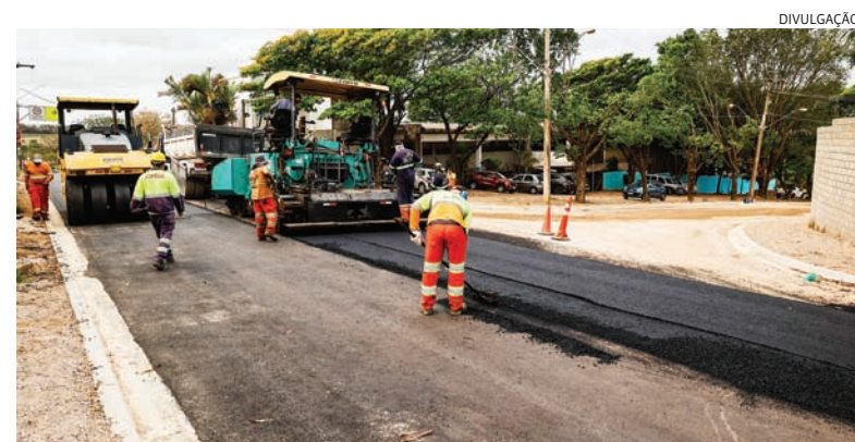
Expectativa é de que a obra seja encerrada em uma semana

impacto ao meio ambiente. Neste ano, mais de 30 vias receberam esse tipo de cobertura, o que representa quase 260 mil metros asfaltados ecologicamente. Cidades 5