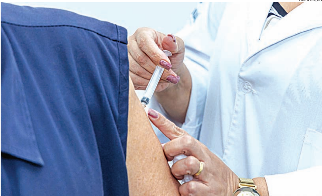
Algumas unidades contam com horário estendido para agilizar a vacinação

A Secretaria Municipal de Promoção da Saúde (SMPS), por meio da Vigilância Epidemiológica (VE), informa que a vacinação contra a covid-19 para pessoas com 12 anos ou mais foi retomada em Jundiaí, após o recebimento de novas doses enviadas pelo Estado. Também há disponibilidade do imunizante para crianças de 6 meses a 4 anos, 11 meses e 29 dias. No momento, não há doses disponíveis no município para crianças de 5 a 11 anos, 11 meses e 29 dias, devido ao desabastecimento por parte da Secretaria de Estado da Saúde. A VE segue monitorando a situação e man-