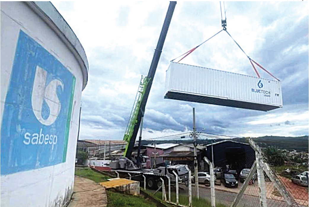
Unidade móvel tem a capacidade de produzir 2,6 milhões de litros de água por dia

A Companhia acelerou também a entrega do novo reservatório da Vila Primavera, que entra em operação nesta semana de pré-Carnaval. A estrutura física está concluída e as equipes trabalham agora nas in-