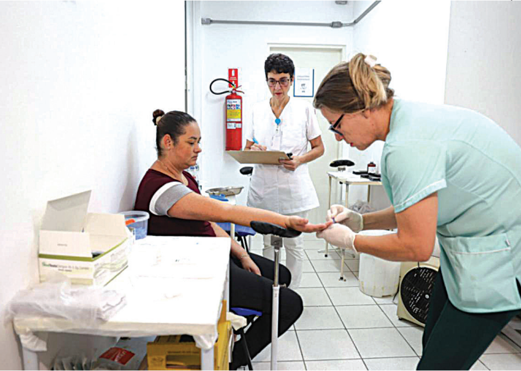
Alguns recursos ajudaram a manter serviços essenciais e prioritário