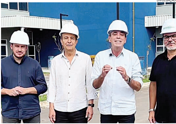
Quarteto vistoriou obras no hospital, que será inaugurado ainda neste ano

A Prefeitura de Várzea Paulista fará, nos dias 4 e 7 de março, duas audiências públicas para discutir a proposta da Lei Municipal de Anistia de Construções Irregulares. A medida visa viabilizar a aprovação de projetos que não atendam aos índices urbanísticos da legislação atual. Os encontros abrirão espaço para que a população apresente sugestões, esclareça dúvidas e proponha alterações no texto, junto ao corpo técnico da Prefeitura. A iniciativa busca promover regularização urbana, segurança jurídica e desenvolvimento organizado, permitindo a valorização dos imóveis e acesso facilitado a financiamentos. No dia 4, a audiência será às 18h30, no Auditório da Praça CEU. No dia 7, às 10h, no Jardim do Lar.