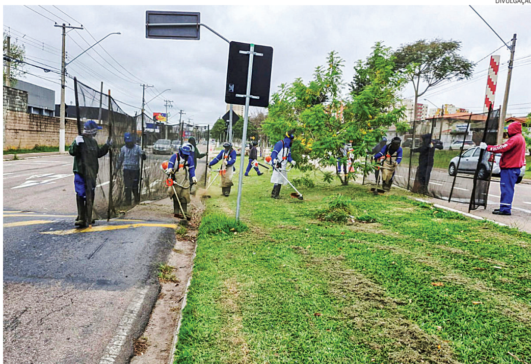
A operação funciona de acordo com cronograma e solicitações do 156