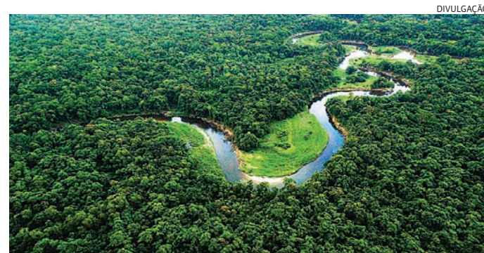
O desmatamento da região amazônica ficou quase estável neste ano

O dado deste ano significa um aumento de 4% na comparação com 2023/2024, que por sua vez registrou o menor acumulado da história, de 4.321 km v.1,3 - foi a maior redução de destruição do bioma na série histórica (quase 50%), após o