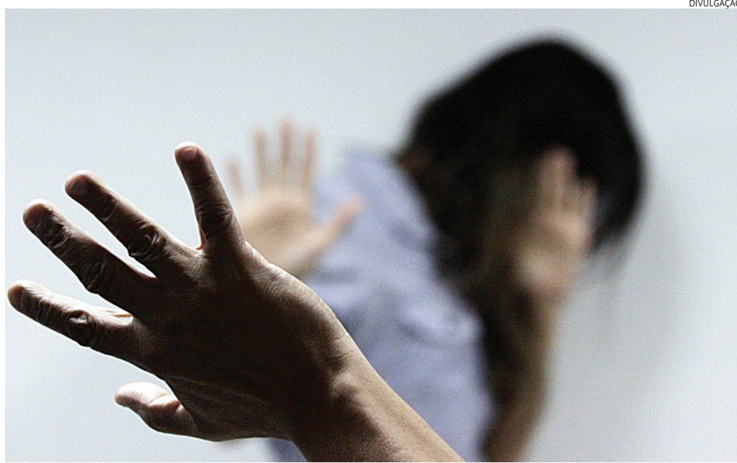
Em Jundiaí, foram registradas este ano 162 ocorrências de atendimentos a mulheres com medidas protetivas

O acesso é feito por encaminhamento da Delegacia de Defesa da Mulher (DDM), plantões policiais, serviços da UGADS ou pelo sistema de garantias de direitos, do qual fazem parte, ainda, a GMJ, o Ministério Público, a Defensoria e o Poder Judiciário. A maioria das mulheres encaminhadas já possui Boletim de Ocorrência (BO) registrado e solicitação de medida protetiva, mas, em casos de urgência, o acolhimento po-