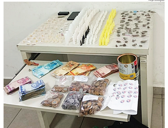
A polícia encontrou 294 porções de drogas no total

em flagrante e encaminhado ao Plantão Policial para as providências cabíveis. Com ele, havia, no total, 294 porções de drogas (60 unidades maconha, 11 unidades de haxixe, 69 unidades de cocaína (pequenas),