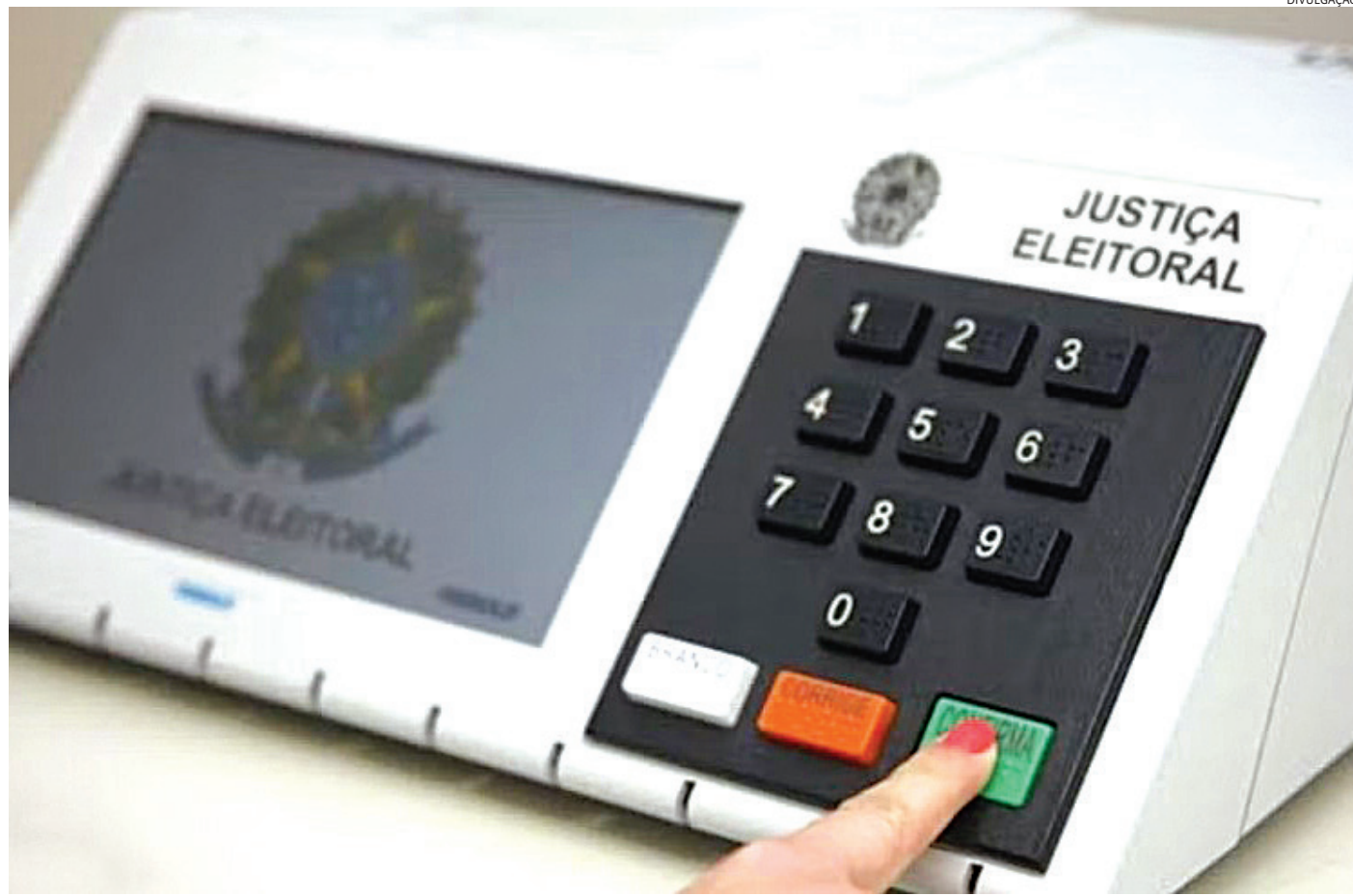
Partidos tendem a lançar somente uma candidatura em toda a RMJ