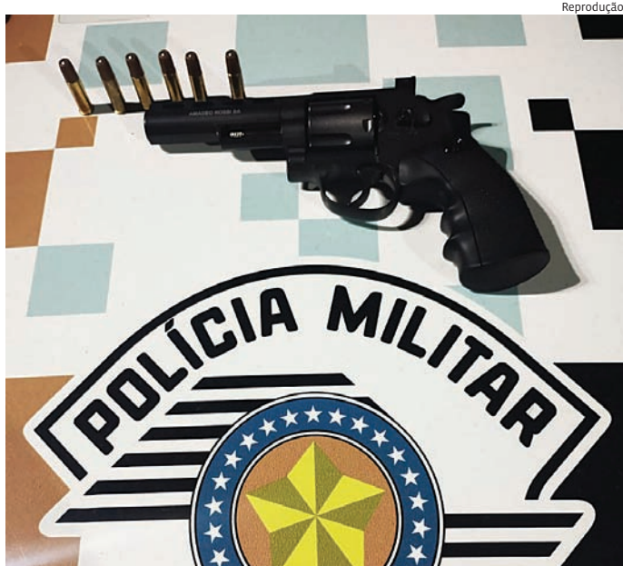
O artefato foi apreendido e o homem preso

A perícia técnica foi acionada e determinou as providências cabíveis visando aos levantamentos dos elementos informativos.