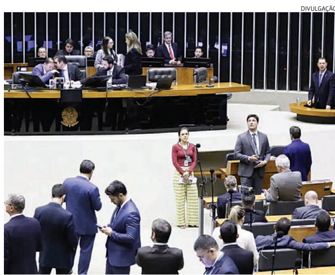
MP oferece gratificação a servidores para acelerar processos parados

Também podem fazer parte do programa os processos e serviços administrativos cujo prazo de análise tenha superado 45 dias ou com prazo judicial expirado; as avaliações sociais que compõem a análise