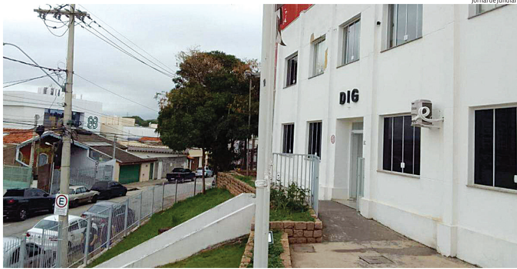
O homem ainda não foi identificado e o caso será investigado pela DIG de Jundiaí

Durante atendimento da ocorrência, constatou-se que a área pertence ao Jardim Tamoio, em Jun-