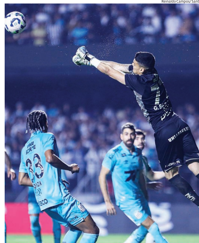
O Santos quer aproveitar o embalo da última vitória

Já o Santos, com 18 pontos e três de vantagem sobre a zona da degola, tenta manter o embalo após a vitória por 3 a 1 sobre o