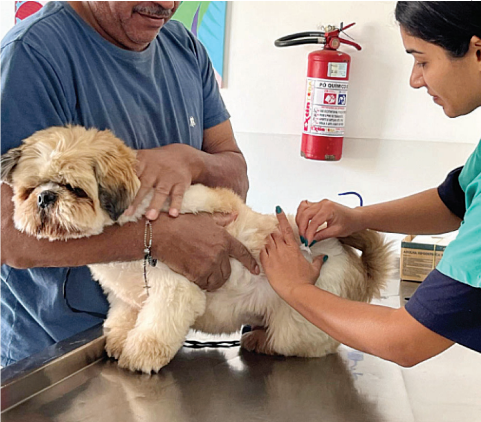
A imunização está disponível para cães e gatos saudáveis a partir de 3 meses