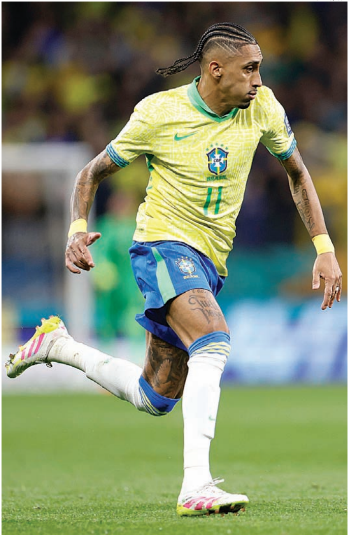
A cerimônia premia os melhores do futebol na última temporada

O Botafogo, campeão da América e do Campeonato Brasileiro na temporada passada, concorre na categoria de melhor clube do