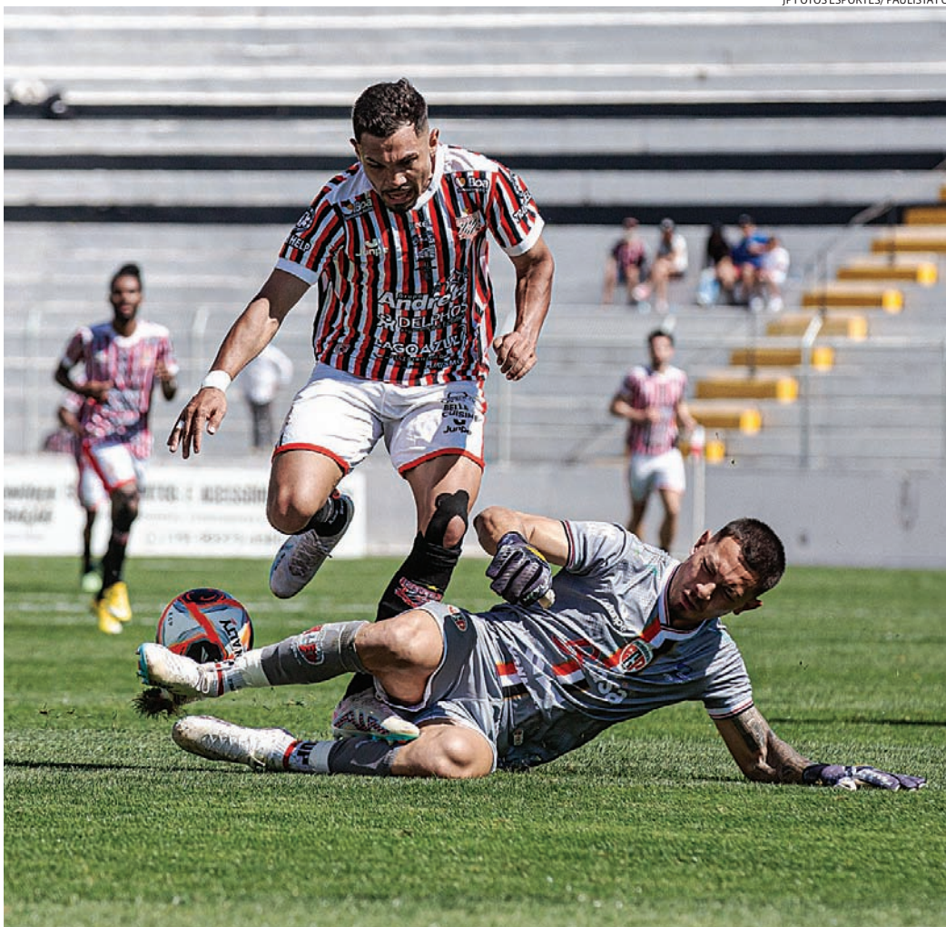
O Galo vem de derrota no último jogo, mas segue muito perto da classificação

O Paulista vem de derrota no último jogo, contra o Primavera, em Campinas, por 2 a 0. Porém, apesar do resultado negativo, o time segue na 3ª colocação do Grupo 3, com 10 pontos, e está à frente do Guarani, em 4º lugar, com sete pontos, e do São Bento, em 5º, também com sete. A lanterna está ocupada pelo Rio Branco, com apenas 4 pontos, já sem chances de chegar ao mata-mata. Já classificados, XV de Piracicaba e Primavera têm 18 pontos e estão na li-