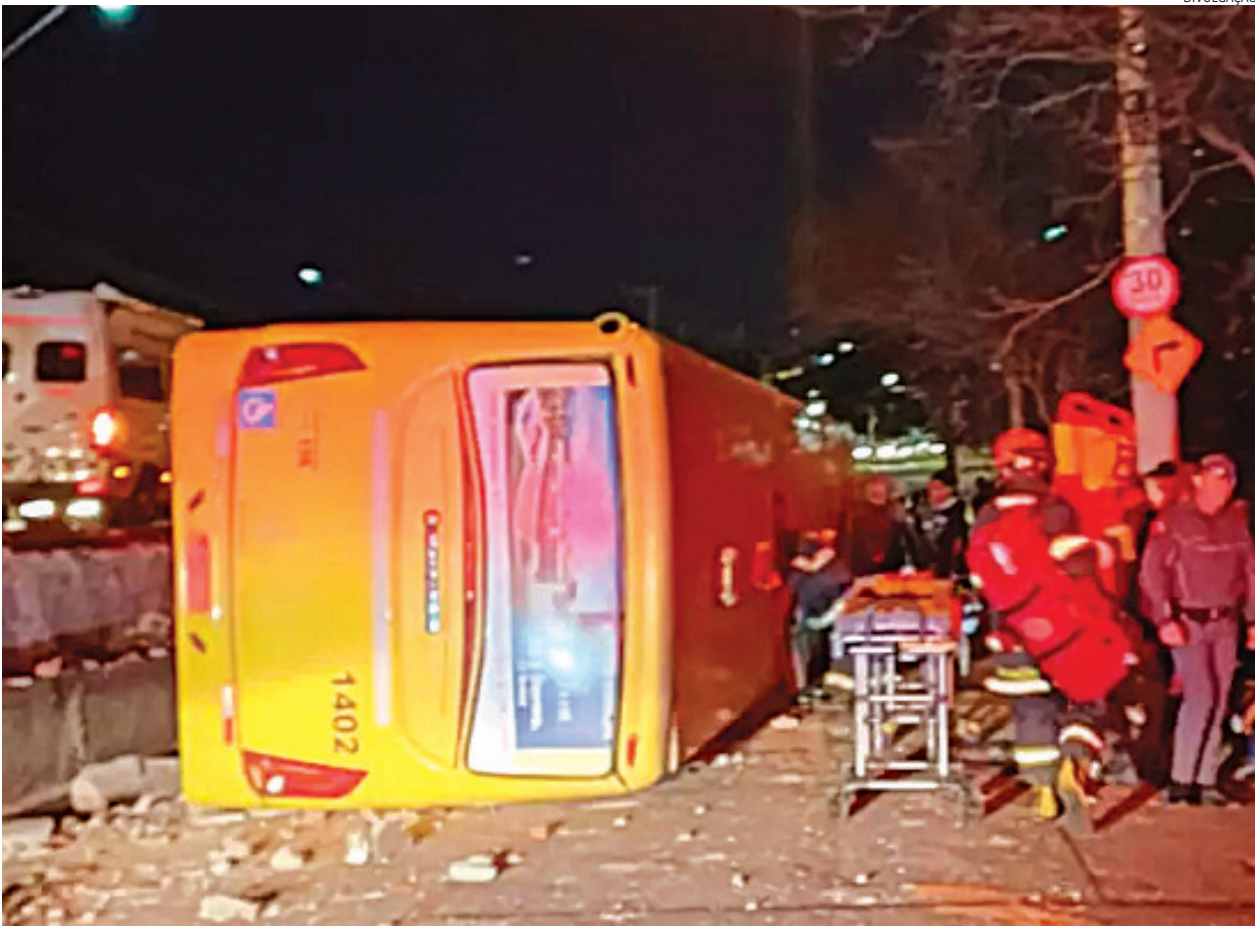
Vítimas leves foram atendidas pelo Corpo de Bombeiros e equipes de resgate

O motorista do ônibus que tomou com pelo menos 20 passageiros na noite desta quarta-feira (6), na rodovia Geraldo Dias, em Jundiaí, sofreu um mal súbito e por isso perdeu o controle do veículo, segundo seu relato a policiais militares rodoviários que atenderam