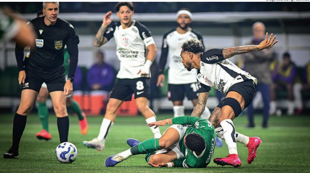
Palmeiras foi eliminado após perder para o Corinthians

O São Paulo vive cenário mais apertado. Não briga no topo do Brasileirão, mas ainda tem a Libertadores para tentar compensar financeiramente a frustração na Copa do Brasil. Palmeiras e Flamengo também seguem vivos na competição continental, sempre como um dos favoritos ao título.