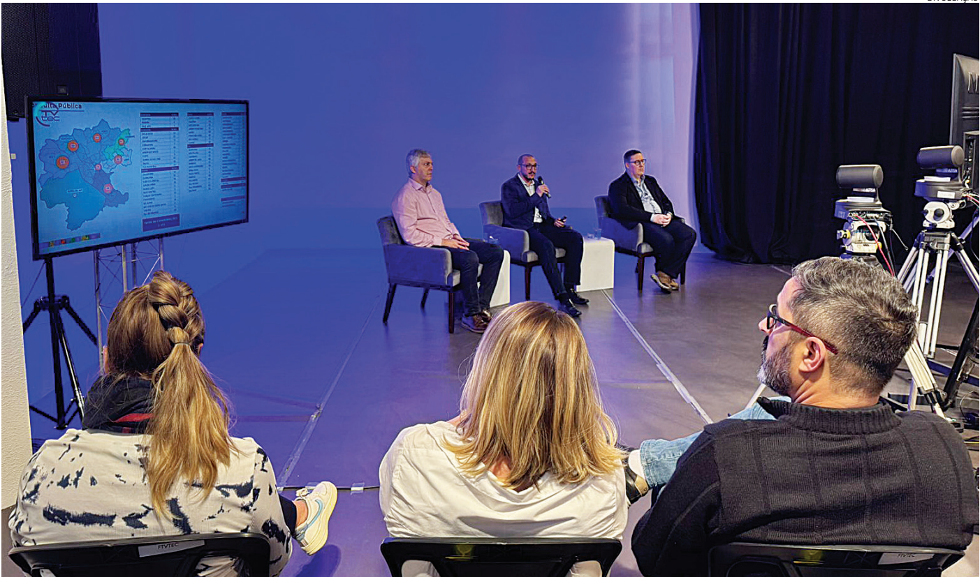
Gestores municipais apresentaram os programas temáticos para os próximos anos

Em audiência pública realizada nesta quinta-feira (7), a Prefeitura de Jundiaí apresentou as prioridades destacadas no Plano Plurianual (PPA) 2026–2029. A princípio, foram definidos 13 programas temáticos, com cerca de 300 ações voltadas a áreas como saúde, educação, zeladoria da cidade, habitação, esporte, mobilidade, segurança, cultura, tecnologia e inovação. A estimativa de recursos necessários para o cumprimento do plano é de R$ 19,2 bilhões, sendo R$ 4,5 bilhões apenas para o próximo ano. O programa ainda não está finalizado, mas deverá ser encaminhado para aprovação do Poder Legislativo até o final de agosto. A construção do PPA foi baseada nos diagnósticos obtidos por meio de reuniões nos bairros, diretrizes, planos setoriais, plano de governo e consulta pública on-line. Vale ressaltar que, até o dia 31 de julho, mais de duas