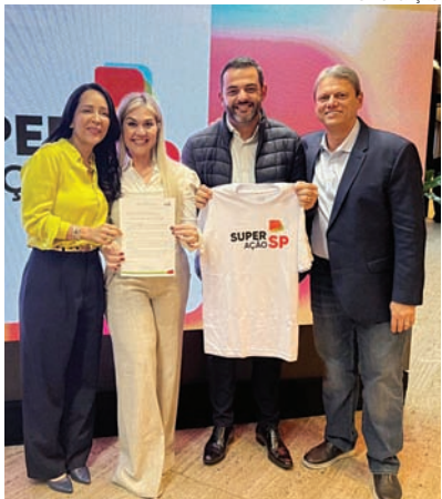
Para o prefeito Gustavo Martinelli, a participação de Jundiaí é fundamental para dar dignidade às famílias

voltado ao SuperAção SP, programa ao qual a Prefeitura de Jundiaí aderiu, com foco na superação da pobreza e no fortalecimento da inclusão produtiva nas regiões mais vulneráveis. Cidades 4