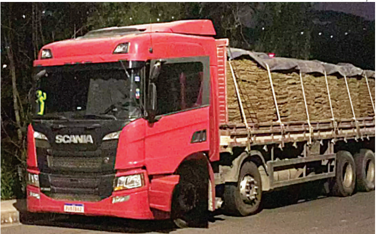
Equipes de patrulhamento encontraram homem suspeito e comparsa

(Romu) e também do patrulhamento comunitário do plantão Alfa, em Itatiba, na quarta-feira (6). Um caminhão avaliado em R$ 600 mil, carregado com grama, foi recuperado. Polícia 6