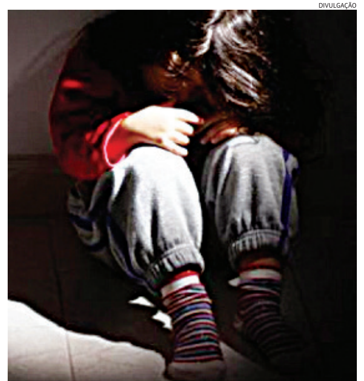
O crime ocorreu no dia 21 de abril

As ações da Polícia Civil continuam para capturar o adulto foragido e apreender o quarto adolescente envolvido.