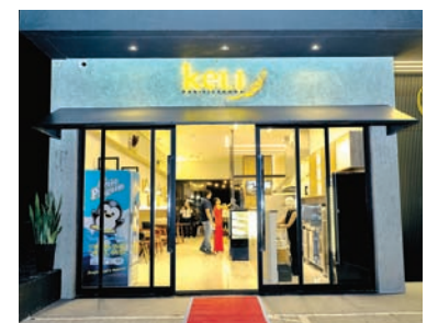
Um prédio supermoderno