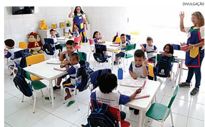
83% das creches brasileiras não têm o mínimo para funcionar

Procurado, o Ministério da Educação (MEC) informou, em nota, que vem “intensificando as ações para apoiar os municípios, responsáveis diretos pela educação infantil, na ampliação do acesso com qualidade a essa etapa do ensino”.