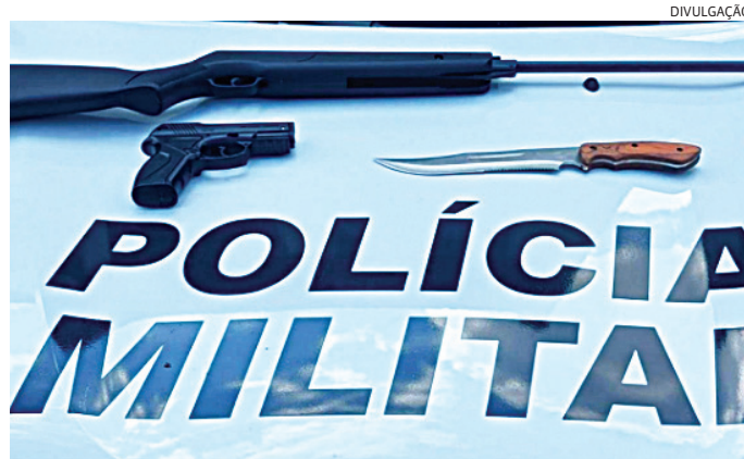
As armas foram apreendidas pelos policiais militares

agentes ordenaram que o homem saísse da casa com as mãos na cabeça. Ele obedeceu e foi abordado sem resistência.