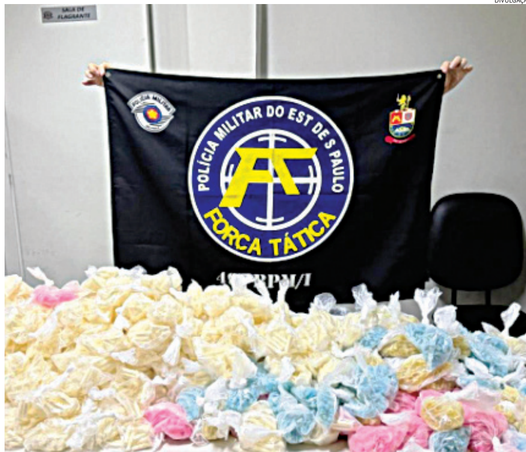
As drogas estavam divididas em centenas de mulas

Inicialmente, o suspeito negou qualquer irregularidade, mas acabou confessando e indicou uma