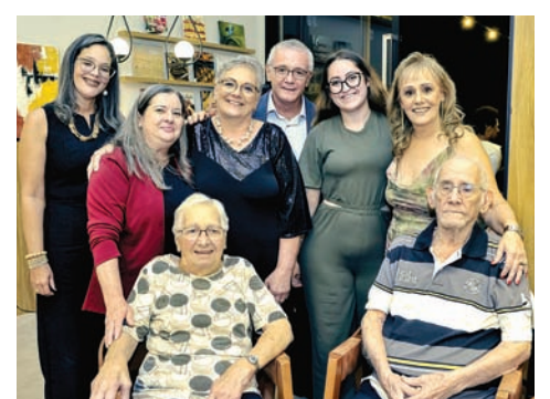
Família Pereira e funcionários reunidos