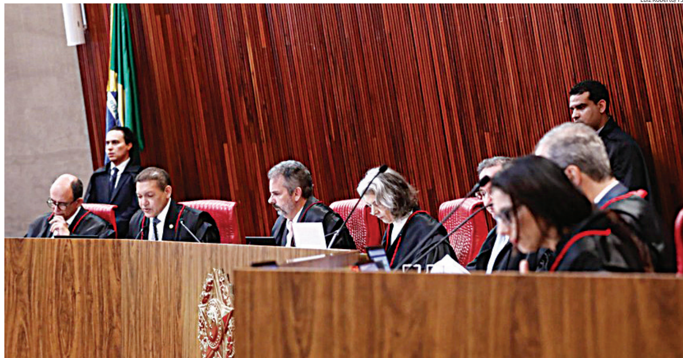
TSE aprovou 14 resoluções eleitorais, incluindo o regramento para propaganda com IA