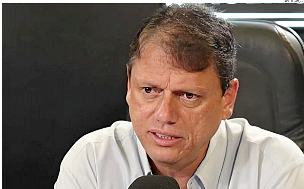
Tarcísio ganharia a reeleição em SP, aponta pesquisa