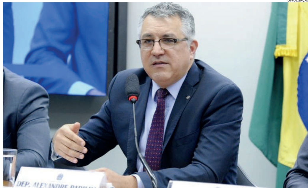
Segundo Alexandre Padilha, não há necessidade de se recorrer da decisão do STF

“Talvez não seja o ideal, porque também o Supremo tem aquilo que vê como ideal, o Congresso aquilo que vê como ideal, o governo aquilo que vê como ideal. Às vezes, se ficar só no ideal de cada um, você não consegue avan-