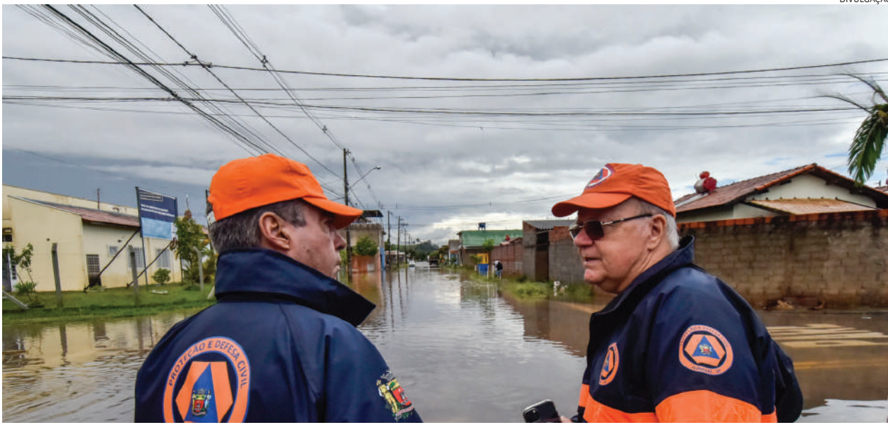
Desde terça-feira (24), a Defesa Civil do Estado de São Paulo monitora as cidades com maiores acumulados de chuva