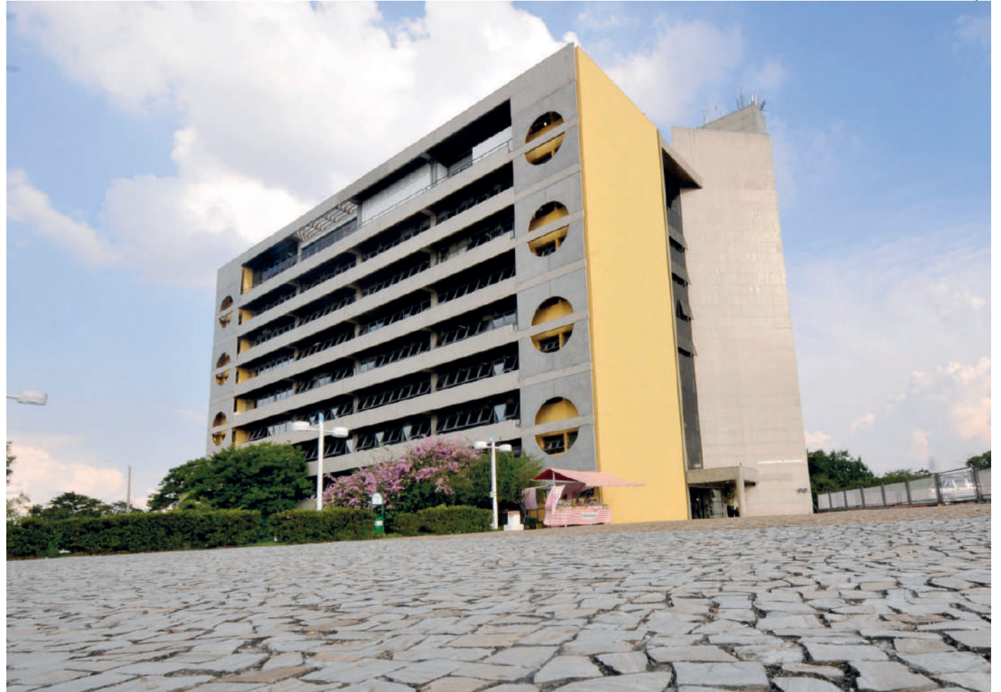
Paço estará fechado nos dias 30, 31 de dezembro e reabre ao público em 1º de janeiro