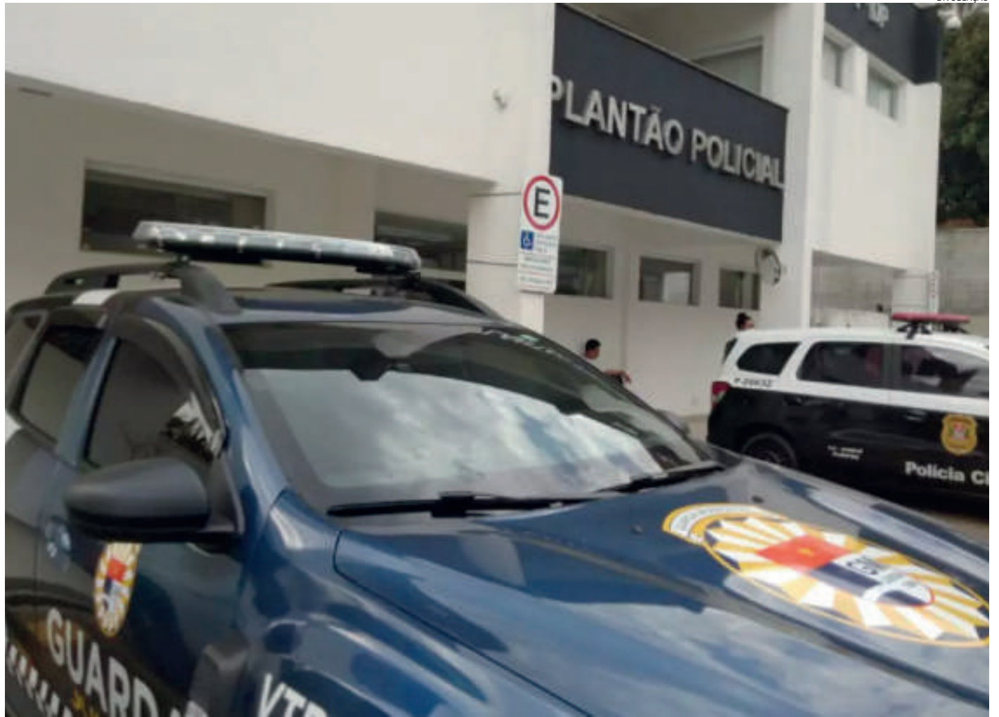
Os guardas prenderam o suspeito em flagrante

A ocorrência teve supervisão do subinspetor Vaz.