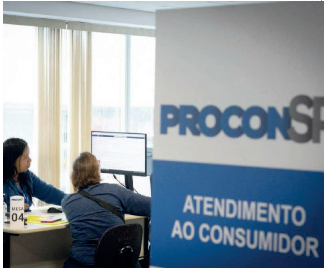
O consumidor deve se lembrar de manter a integridade do produto e atender às condições estabelecidas

Ao efetuar a troca, deverá prevalecer o valor pago pelo produto, mesmo quando houver liquidações ou aumento do preço. Lembrando que, quando a troca é pelo mesmo produto (marca e modelo, mudando apenas o tamanho ou a cor), o fornecedor não pode exigir complemento de valor; nem o consumidor poderá solicitar abatimento do preço, caso haja mudança entre o valor pago no dia da compra e o preço no dia da troca.