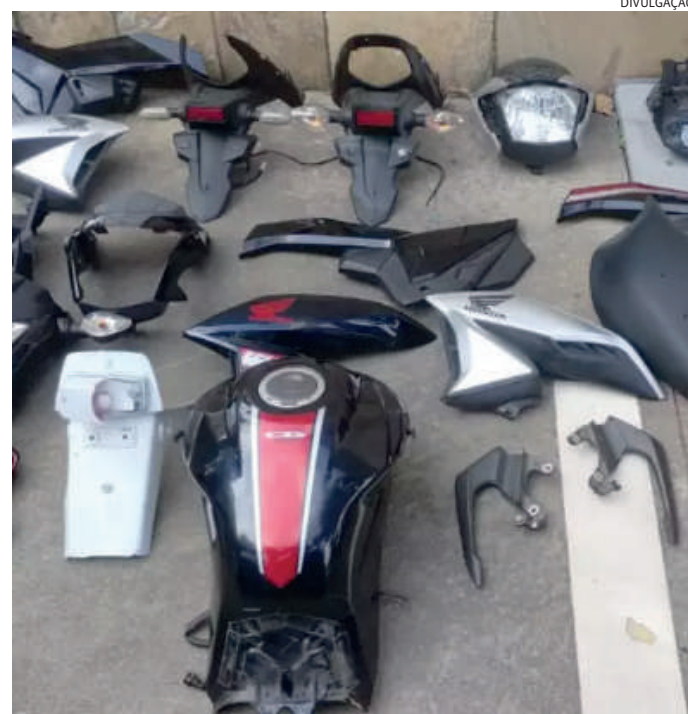
As peças que estavam no quintal serão periciadas

Todos foram levados para a delegacia, onde ficaram à disposição da Justiça.