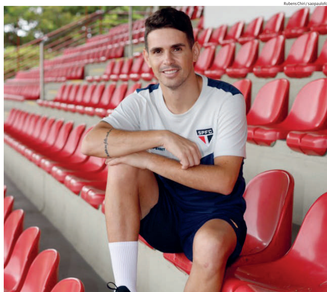
O meia-atacante assinou com o São Paulo até dezembro de 2027

Agora, repatriado pelo São Paulo, ele volta com status de "super reforço". São Paulino declarado, ele tem a chance de reconquistar a torcida após sair pela porta dos fundos e de cumprir seu desejo antigo: de fazer mais pelo clube que o formou.