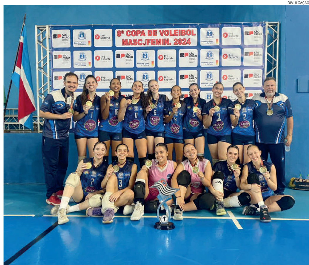
O time jundiaense fez uma campanha invicta