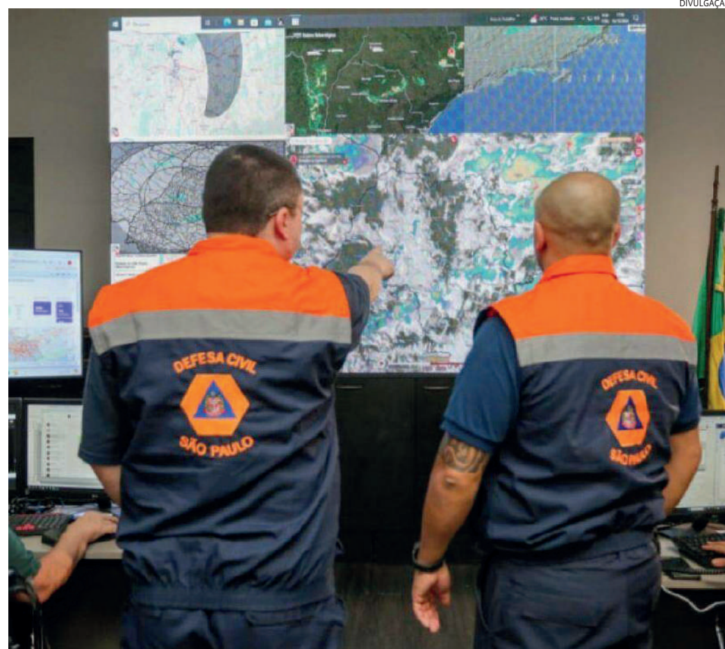
Em Jundiaí, este mês de dezembro já tem mais de 400 milímetros de chuva

O gabinete de crise está mobilizado desde terça-feira (24) de forma remota. Nesta quinta-feira (26), representantes dos serviços essenciais e integrantes das empresas de energia elétrica e abastecimento de