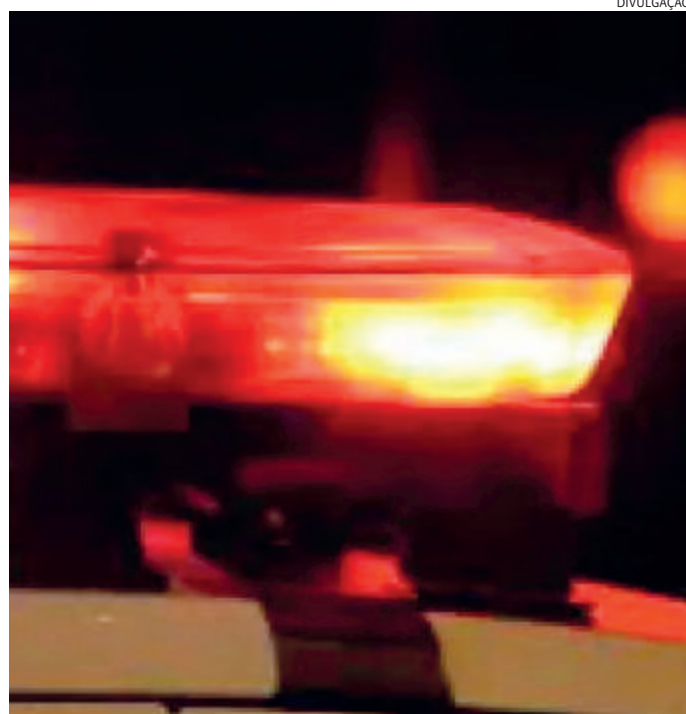
O homem estava sendo procurado com mandado de prisão

A ocorrência teve supervisão do subinspetor Vaz.