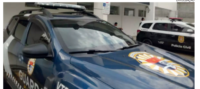
A briga ocorreu em semáforo e ladrão levou celular de dentro da bolsa

do carro a vítima chegou a disputar a bolsa com o ladrão. Um motociclista assistiu a tudo e seguiu o criminoso, acionando uma viatura da Guarda Municipal, que o prendeu. Polícia 7