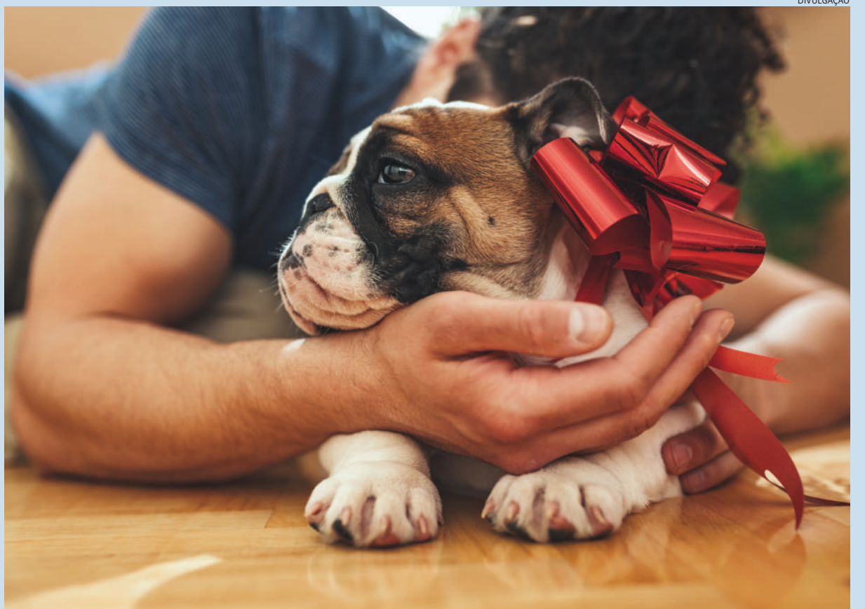
Sem responsabilidade, tutores deixam para trás seus animais durante as festas de final de ano