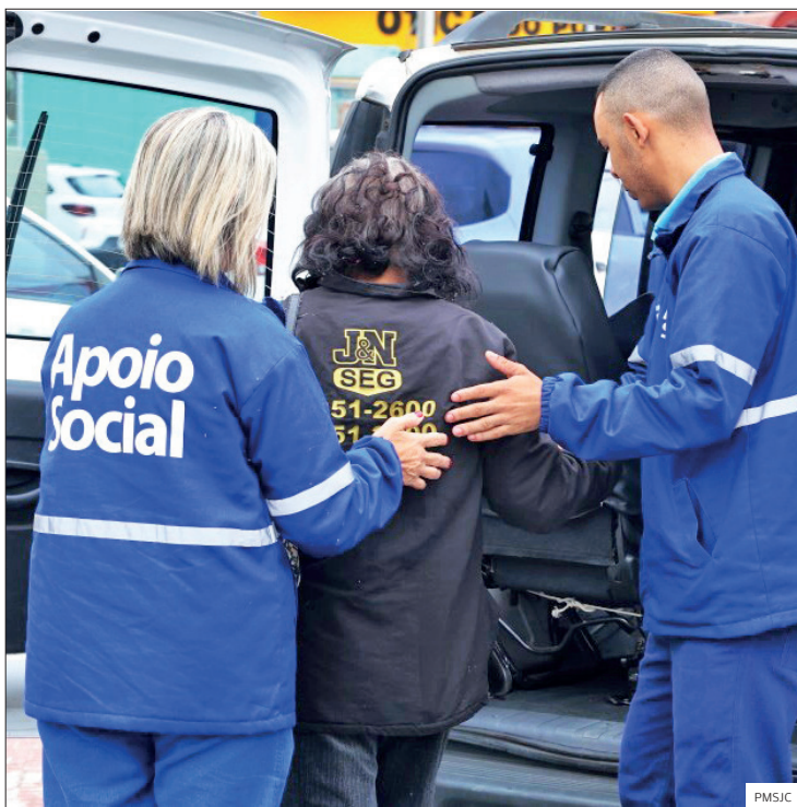
Operação Inverno. As rondas e a oferta de vagas são reforçadas em São José dos Campos com a chegada do frio

Ações estão sendo realizadas por toda a cidade para orientar a população sobre a