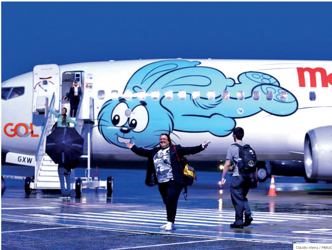
Novos voos em São José. Passageiros embarcam no Aeroporto de São José dos Campos, que amplia a oferta de voos para o Rio com uma nova frequência semanal

Com a nova frequência, haverá também voos às terças-feiras saindo de São José no mesmo horário. Já no sentido contrário, do Rio para São José, a nova opção será oferecida às segundas-feiras, com decolagem às 21h40. ■