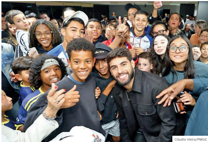
Artilheiro. Formado nas categorias de base do Atletia Cidadão, Yuri Alberto é um dos craques brasileiros no cenário do futebol

A Prefeitura recebeu na noite de 11 de junho a presença de Yuri Alberto, jogador do Corinthians e primeiro joseense a alcançar a artilharia do Brasileirão, feito conquistado na temporada de 2024. O evento marcou a homenagem ao atacante do Timão com a Medalha Mérito Esportivo Ubiratan Pereira Maciel, concedida pela Câmara Municipal, e contou com a presença de torcedores e alunos do Atletia Cidadão e Escola Ativa, programas da Prefeitura que incentivam os esportes. ■