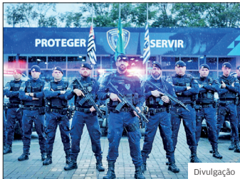
Segurança. A Romu tem papel estratégico no combate aos crimes mais graves em São José