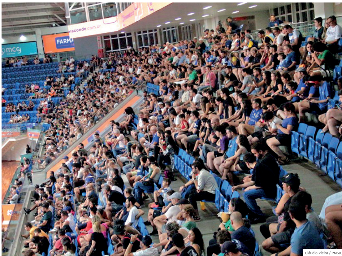
Em casa, com apoio da torcida. A abertura da competição esportiva será realizada na Farma Conde Arena, no dia 4 de julho, sexta-feira, a partir das 10h

A abertura do evento será na Farma Conde Arena, no dia 4 de julho, sexta-feira, a partir das 10h. As competições serão realizadas em ginásios e espaços públicos mantidos pela Prefeitura, com apoio de entidades parceiras. No ano passado, em São Sebastião, a delegação joseense conquistou o título pela 11ª vez consecutiva. Meses depois, foi campeã pela sexta vez seguida dos Jogos Abertos do Interior, em São José do Rio Preto. ■