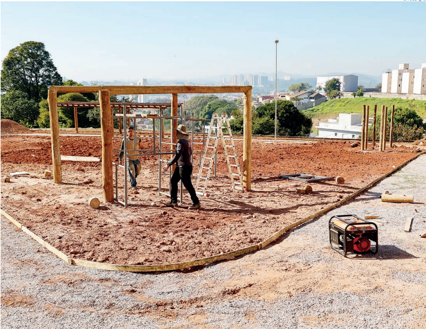
No Jd. Bonfiglioli as obras são para implantação de mais uma praça com espaço para cães e gatos ficarem em segurança. O investimento é de R$ 400 mil

“Jundiaí é uma cidade reconhecida pela qualidade de vida. Os investimentos na revitalização de parques e outras áreas incentivam as pessoas a ocuparem os espaços públicos para a prática de atividades físicas e ter momentos de convivên-