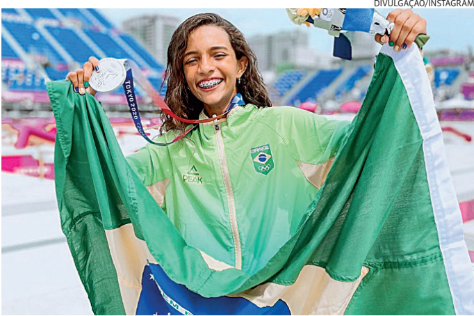
Apartir das 7h, Rayssa Leal, a ‘Fadinha’, entra em ação nas pistas de skate

Às 7h, Pâmela Rosa e a ‘Fadinha’, Rayssa Leal entram em ação nas pistas do