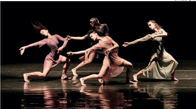
As inscrições podem ser realizadas até o dia 23 de agosto gratuitamente

Já na dança serão 20 projetos aprovados, com investi-