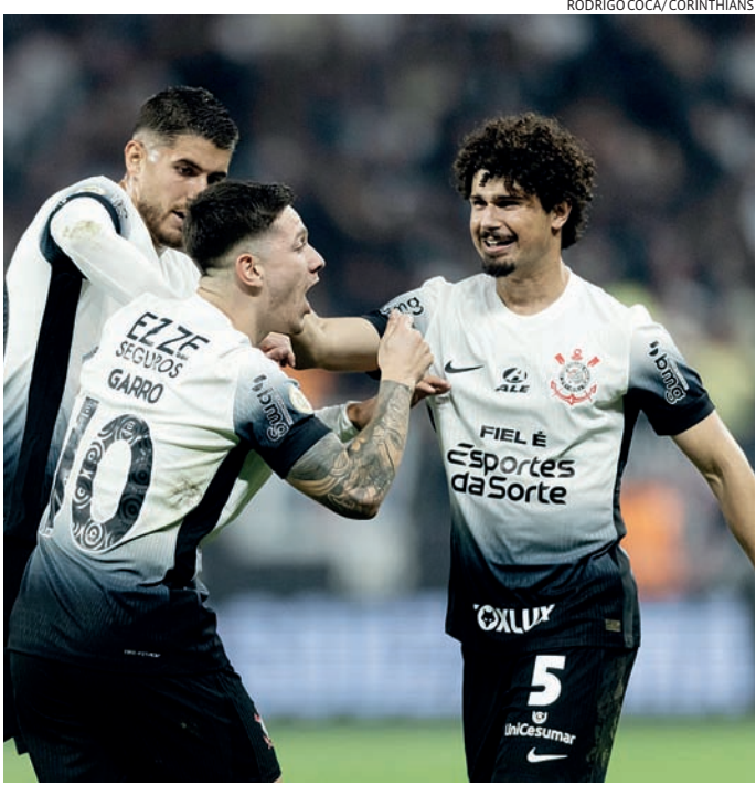
O Corinthians ocupa o 14º lugar da tabela do Brasileiro, com 19 pontos

A provável escalação do Corinthians tem: Hugo Souza; Félix Torres, André Ramalho e Gustavo Henrique (João Pedro); Matheuzinho, Alex Santana (Raniele), Ryan, Rodrigo Garro e Hugo; Romero e Yuri Alberto.