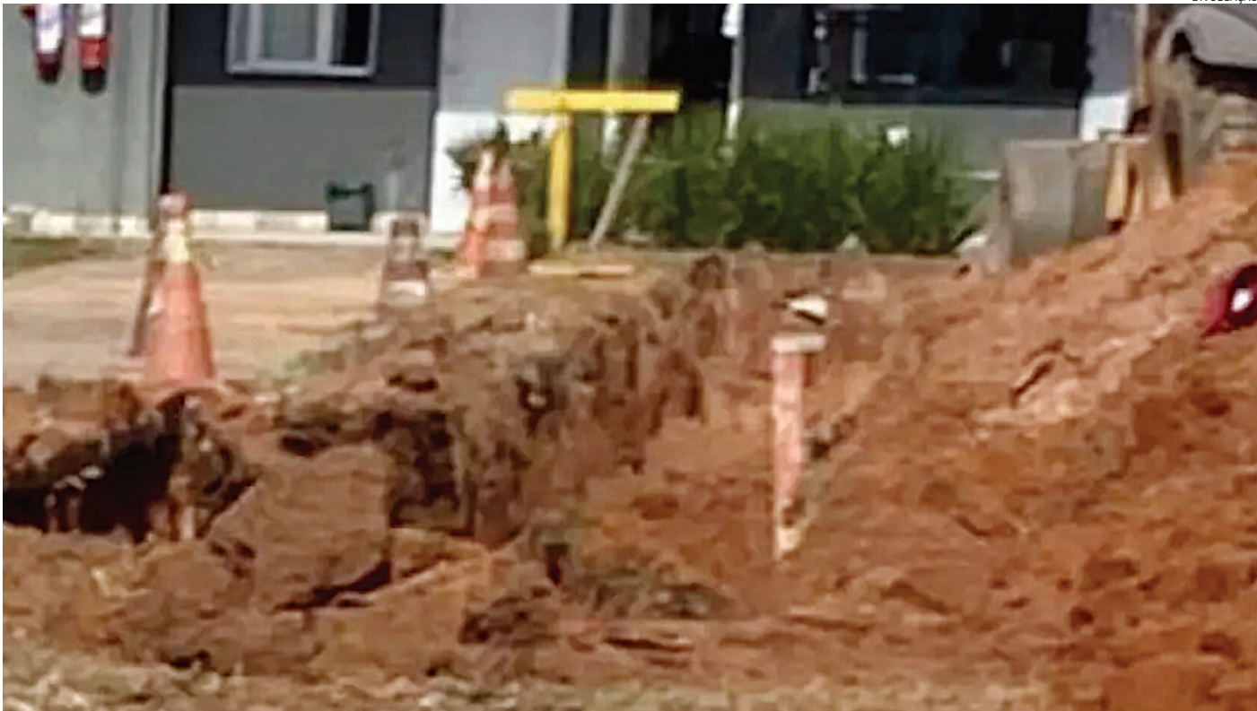
Soldados do Corpo de Bombeiros e equipes do Serviço de Atendimento Móvel de Urgência (SAMU) foram ao local

Um trabalhador morreu e outros dois ficaram feridos na manhã deste sábado (27) em soterramento de obra na rede de esgoto de uma empresa têxtil em Jundiaí, no Distrito Industrial de Jundiaí. Soldados do Corpo de Bombeiros e equipes do Serviço de Atendimento Móvel de Urgência (SAMU) foram destacados para o local. Uma das vítimas foi socorrida pelos soldados do Corpo de Bombeiros. A outra foi levada ao hospital pelo SAMU. O local foi preservado para perícia da Polícia Científica. O corpo do trabalhador que morreu no soterramento passará por exames no Instituto Médico Legal (IML) de Jundiaí.