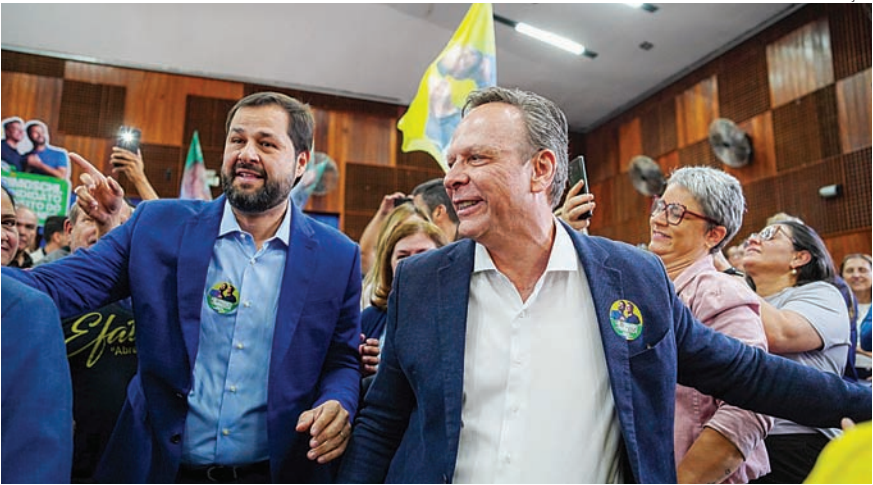
O encontro contemplou a convenção do Partido Liberal (PL) e demais partidos da base aliada

Depois foi office boy, almoxarife e gerente de RH, para depois tornar-se policial civil, profissão que exerceu durante 27 anos. É técnico em Contabilidade, advogado e pós-graduado em Segurança Pública e Privada. Atua como consultor imobiliário e advogado. Em 2016, o candidato foi eleito ao cargo de vereador com 2.345 votos. O vereador foi reeleito, em 2020, como o candidato mais votado, em Jundiaí, com 7.345 votos.