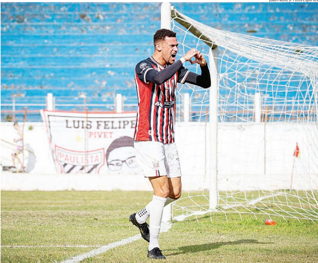
Caveira fez seu sexto gol e é um dos artilheiros da competição

Assim que o árbitro apitou o início do jogo, o Paulista foi para cima do Manthiqueira. Precisando de apenas um ponto para carimbar vaga na próxima fase, o Galo não tomou conhecimento do adversário, que já havia sido presa fácil no jogo de ida desta fase de grupos. Aos 4 minutos Vi-