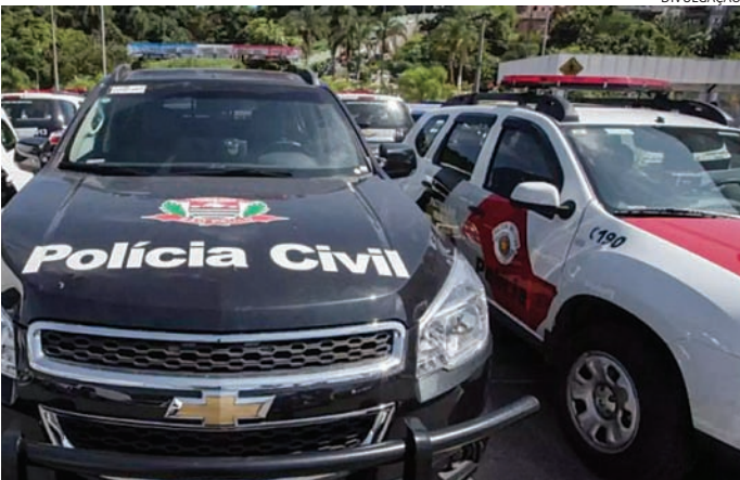
Ele foi preso por policiais militares e levado para a DIG

Policiais militares prenderam na tarde desta sexta-feira (26), na Vila Marlene, em Jundiaí, um homem suspeito de importunação sexual praticado por duas vezes contra uma balconista de uma loja, no Centro de Jundiaí. Os crimes foram praticados nesta semana, na segunda-feira (22) e terça-feira (23). Ele foi conduzido à Delegacia de Investigações Gerais (DIG) - que vinha investigando os casos e já havia o identificado -, onde ele foi indiciado por importunação e também furto. De acordo com a polícia, no dia 22 um criminoso entrou em um estabelecimento comercial, no Centro e, após consumir produtos, mostrou o pênis para a vítima, a qual começou gritar, fazendo com que ele assustasse e fugisse. No dia seguinte ele voltou a atacar, no mesmo estabelecimento, e novamente mostrou o órgão genital à mesma vítima. Mais uma vez coagido pelos