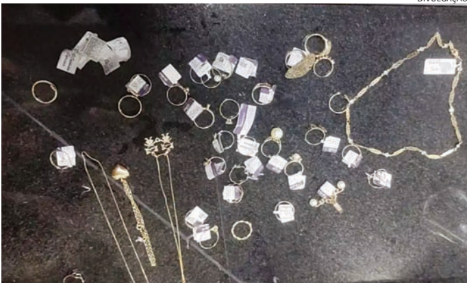
Parte das joias furtadas foi recuperada pela Guarda Municipal