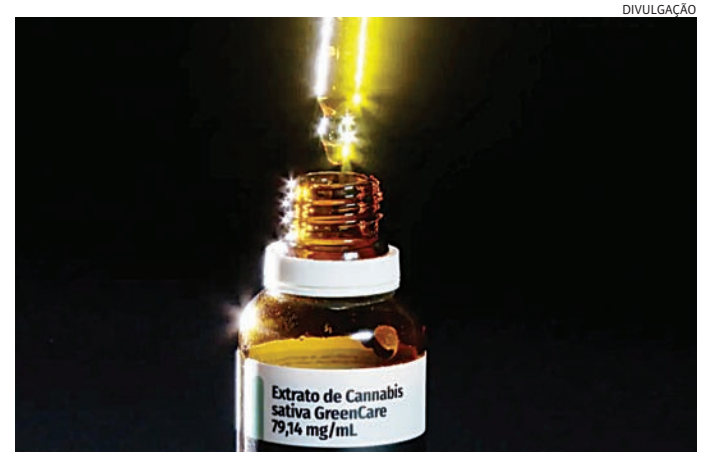
A maior parte das mulheres trabalha (79,9%) e se exercita regularmente (75,1%)

Os distúrbios do sono e a dor crônica são as quei-