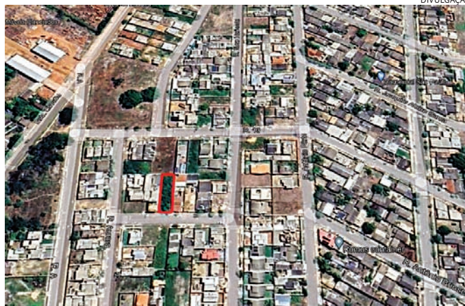
Bairros, como Novo Horizonte, sofrem com grande adensamento