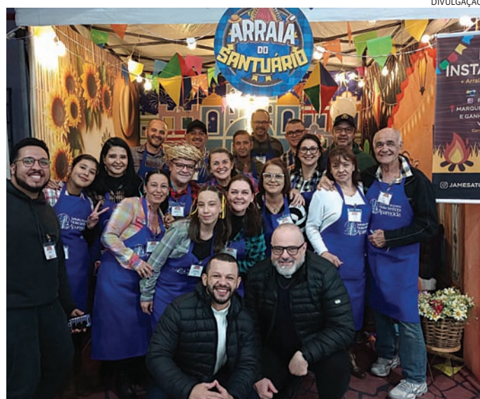
No Santuário Diocesano, as festas representam preservação da fé

Apesar de ser uma festividade voltada para a criação de laços na comunidade e a expressão da espiritualidade, também existe uma parte financeira que não pode