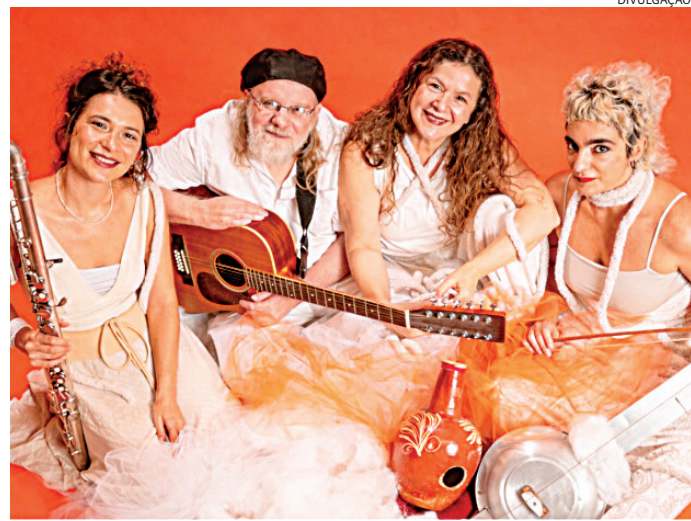
As cias reúnem músicas, jogos, ritmos e gestos preservados

atividade reúne brincadeiras tradicionais de diferentes culturas do mundo. Com músicas, jogos, ritmos e gestos preservados pelas crianças ao longo do tempo, o encontro propõe vivências que estimulam movimento, musicalidade e convivência, valorizando a diversidade da cultura infantil e os saberes compar-