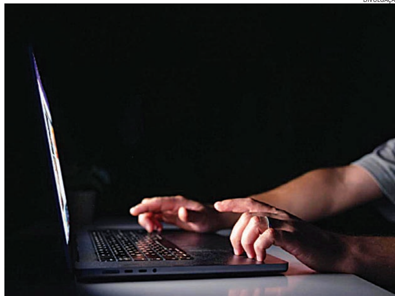
Números podem estar subnotificados, já que nem todo mundo registra BO

Tanto no mundo físico quanto no virtual, as pessoas precisam aprender a conviver o tempo todo com ameaças de golpes. E em um momento em que crimes como assassinato, latrocínio e roubo têm baixa recorde, uma pesquisa do Fórum Brasileiro de Segurança Pú-