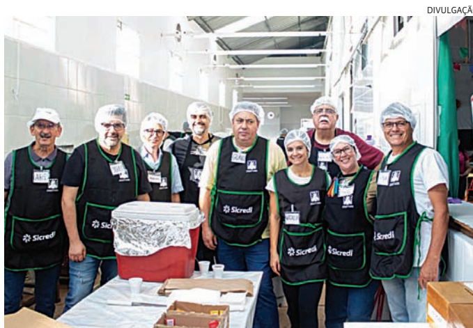
Na paróquia Santo Antônio, as queremmes aproximam família