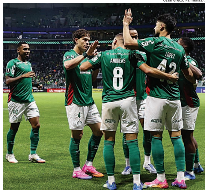
Equipes paulistas entram em campo pela 18ª rodada

Já o São Paulo enfrenta o Remo às 18h30, no Morumbi, buscando iniciar um período mais tranquilo antes da paralisação do calendário nacional. O técnico Luis Zubeldía começou a preparação da equipe após a sequência de jogos decisivos das últimas semanas.