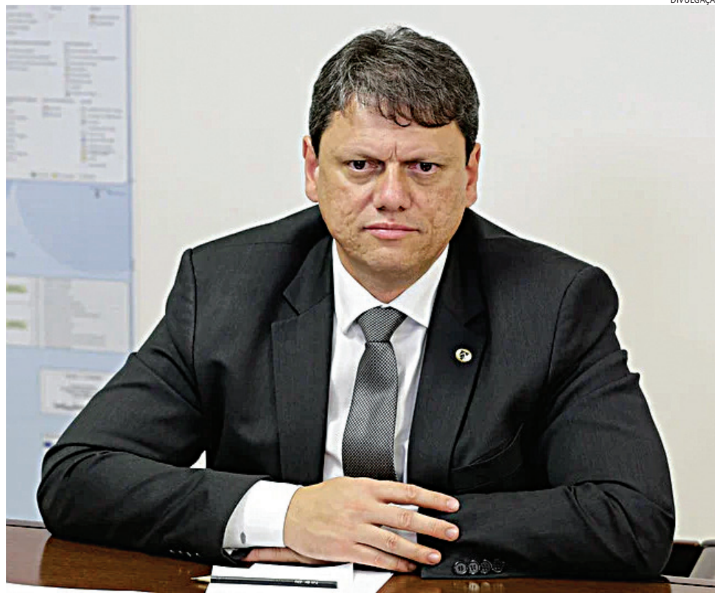
Partidos de centro-direita em Jundiaí estão alinhados com o governador Tarcísio

O vereador afirma que, dentro do PL, as alianças podem se desenhar de forma mais ampla, embora critique aproximações com setores de centro. “Dentro do próprio PL tem muito camaleão”, afirmou. Segundo ele, muitos políticos hoje se apropriam do discurso da direita mesmo mantendo posições mais próximas do