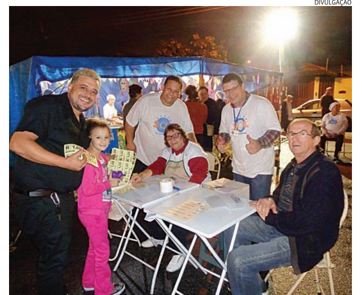
No Jardim Danúbio, a união entre voluntários de diferentes igrejas