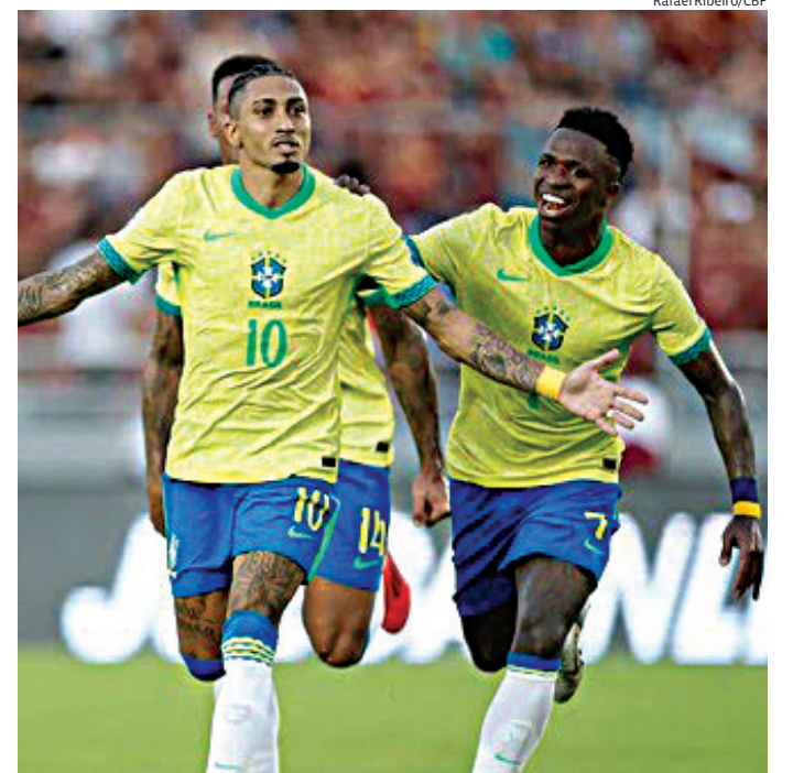
Seleção enfrenta o Panamá neste domingo nos Estados Unidos

A principal ausência segue sendo Neymar, que se recupera de lesão muscular na panturrilha direita e ainda não participou das atividades com bola. A expectativa da comissão técnica é contar com o atacante durante a fase de grupos da Copa do Mundo.