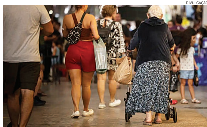
Sem apoio, idosos tem andar sozinhos em calçadas

A violência urbana também gera insegurança contínua. O estudo mostra que 12,1% dos idosos brasileiros consideram a vizinhança muito insegura. Esse percentual representa aproximadamente 3,8 milhões de pessoas vivendo em contextos marca-