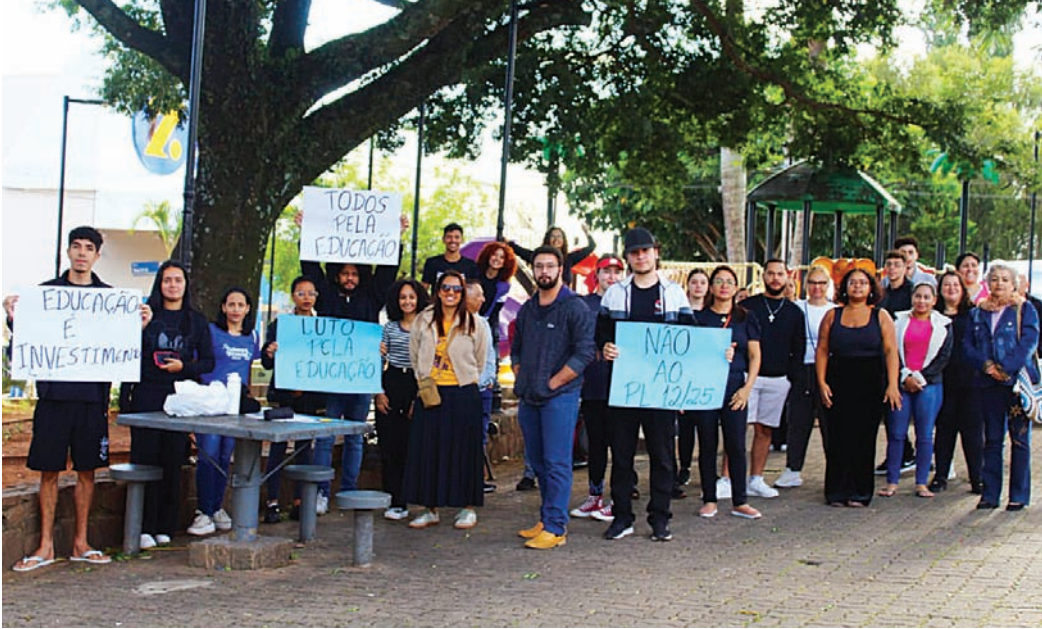
Estudantes já protestaram e planejam novo ato na Câmara