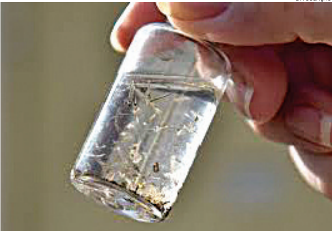
Até o dia 9 de abril, o município contabilizou 2.203 casos da doença