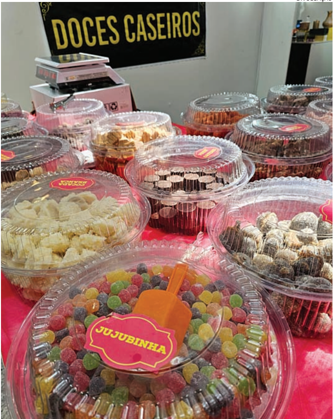
Os amantes da gastronomia podem saborear delícias do Brasil

E não podemos esquecer da Nostrosul, que traz o melhor do Rio Grande do Sul: salames, queijos, cracovias, vinhos e sucos. É uma verdadeira festa de sabores! De Minas Gerais, teremos os irresistíveis