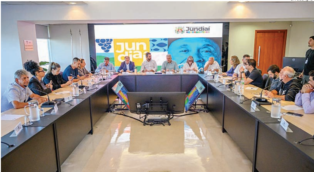
Gestores também participaram da reunião para ouvir demandas