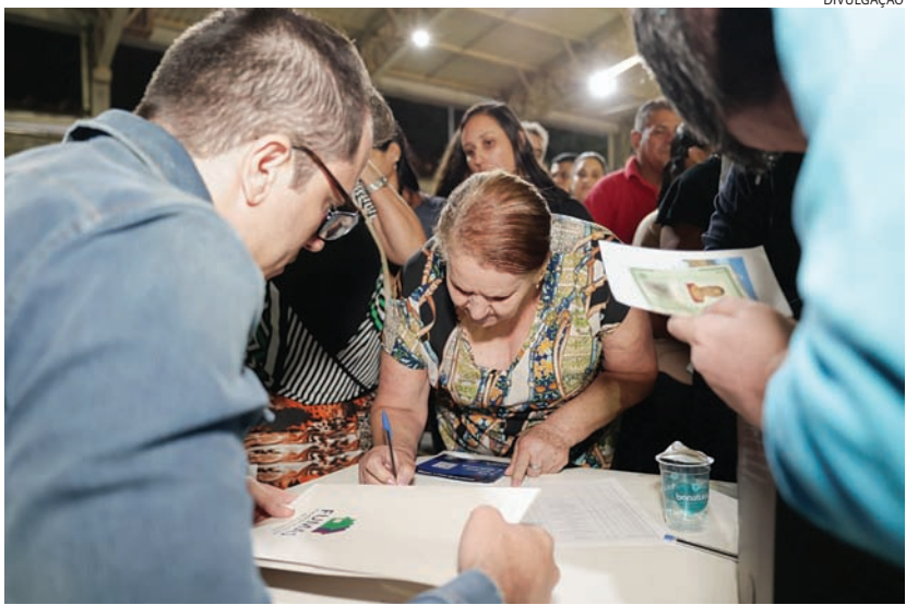
Matrícula traz segurança jurídica e valorização da permanência do cidadão no