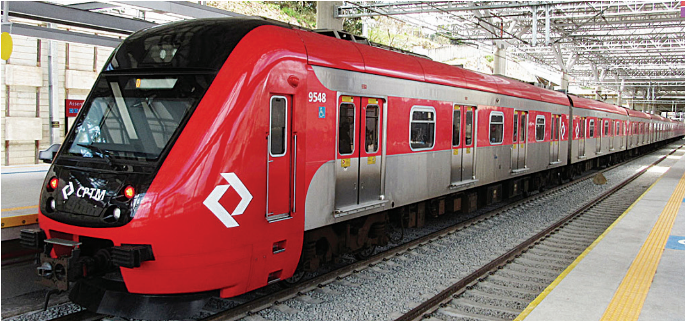
Atualmente, ambos estão na fase de desenvolvimento do projeto básico, com conclusão prevista para setembro

O Trem Intercidades (TIC) – Eixo Norte, que ligará São Paulo a Campinas com uma parada em Jundiaí, terá capacidade para até 860 passa-