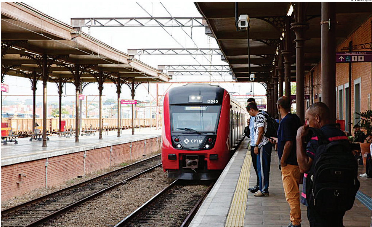
Em Jundiaí, a administração municipal apresentou 11 pedidos de travessias sob a ferrovia