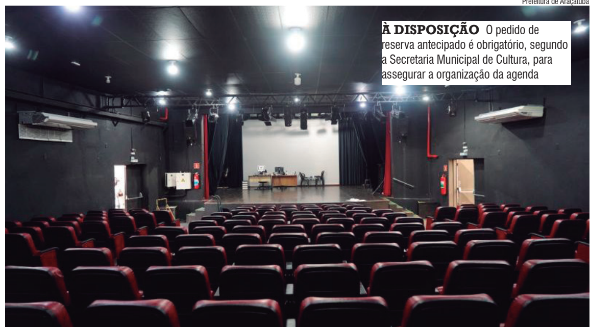
Prefeitura de Araçatuba

O teatro, reconhecido como um dos principais palcos culturais da cidade, homenageia Castro Alves, renomado poeta brasileiro do século 19 e reconhecido por seu engajamento político e social,