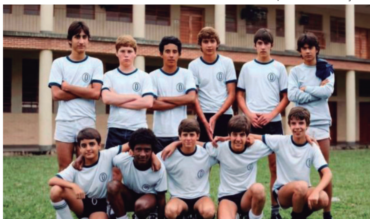
Time de futebol de alunos do Colégio Salesiano em 1983