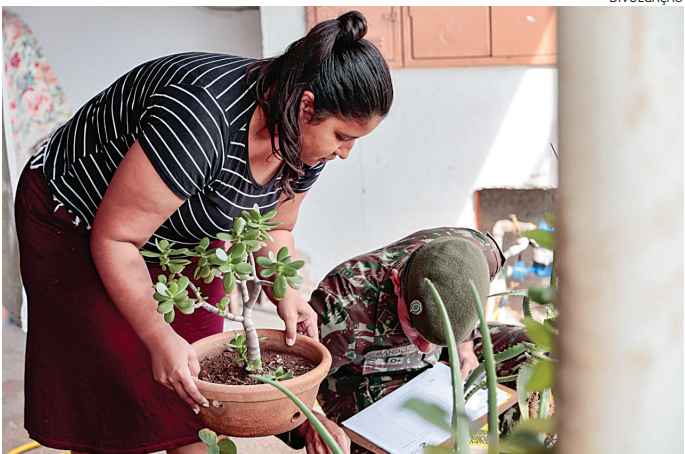
A atenção deve ser redobrada em épocas de chuvas e de calor

Eliminar os criadouros é a medida mais eficaz para prevenir a dengue. Para isso, é essencial evitar qualquer acúmulo de água em pneus, latas, garrafas vazias, vasos de plantas, potes e outros recipientes que possam servir de abrigo para as larvas do mosquito. Leia mais na versão on-line do JJ (jj.com.br).