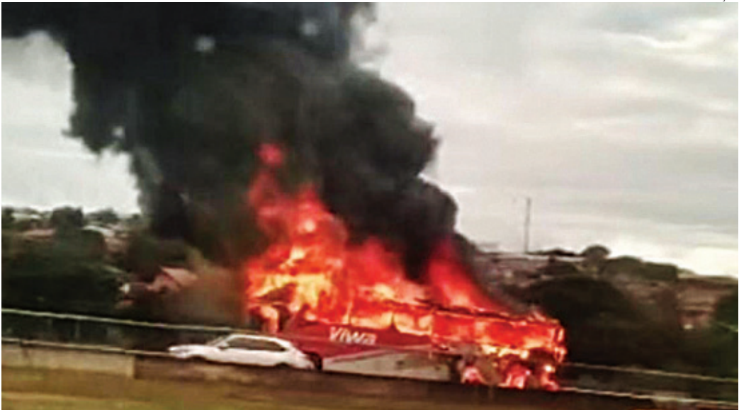
O fogo se alastrou rapidamente e destruiu todo o veículo

O Corpo de Bombeiros foi acionado, assim como a Polícia Militar Rodoviária. As causas do incêndio serão investigadas.