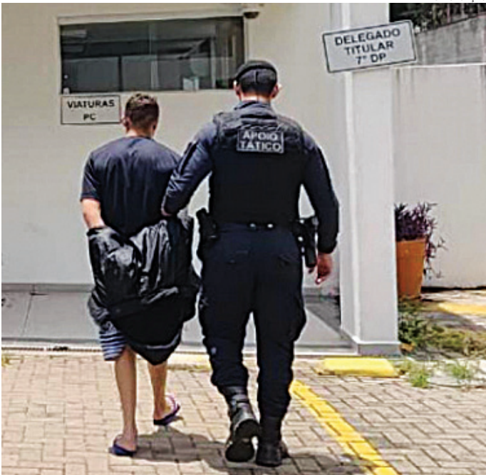
Ele foi levado para o sistema prisional para cumprir sua pena

Durante a checagem de seus dados pessoais, os agentes descobriram que ele era um assaltante condenado a quase 5 anos de prisão e que estava sendo procurado.