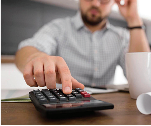
O cidadão aproveita para quitar as pendências com o dinheiro extra recebido

“A digitalização dos serviços dos Cartórios de Protes-