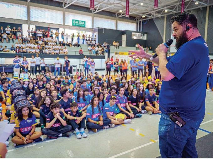
Além das equipes da rede Sesi-SP, participam escolas públicas e privadas

“A nova temporada traz uma proposta instigante que é explorar a arqueologia como ponto de partida para projetos que conectam passado, presente e futuro. Para os estudantes, é uma chance de mergulhar em histórias, descobertas e mistérios que ajudam a entender a trajetória humana. Para os educadores, abre-se um leque de possibilidades para trabalhar temas interdisciplinares, promovendo uma aprendizagem ativa e significativa”, destaca Caio de Go-