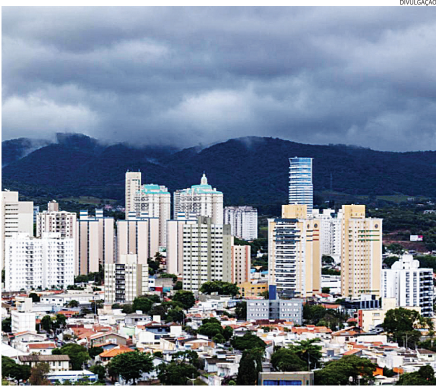
Segundo a Defesa Civil, a previsão é que os ventos chegam a 100 km

tre terça e quarta-feira, principalmente na região central. Todos os equipamentos já foram restabelecidos. Nas últimas 24 horas, o volume de chuva superou 90 mm em regiões como a Fazenda Grande, levando o município a entrar em Estado de Atenção na madrugada de quarta. Até o momento, não há registro de desabrigados.