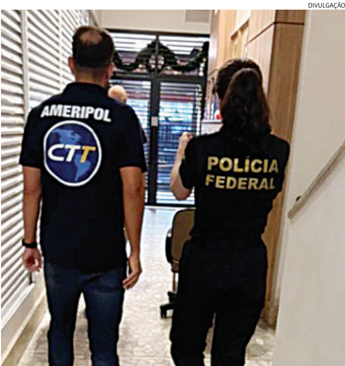
Os mandados foram cumpridos em São Paulo, São Pedro e Jundiaí

A Polícia Federal estima que a organização criminosa tenha obtido aproximadamente R$ 40 milhões com o tráfico de pessoas. A pedido da PF, esse montante foi bloqueado judicialmente.