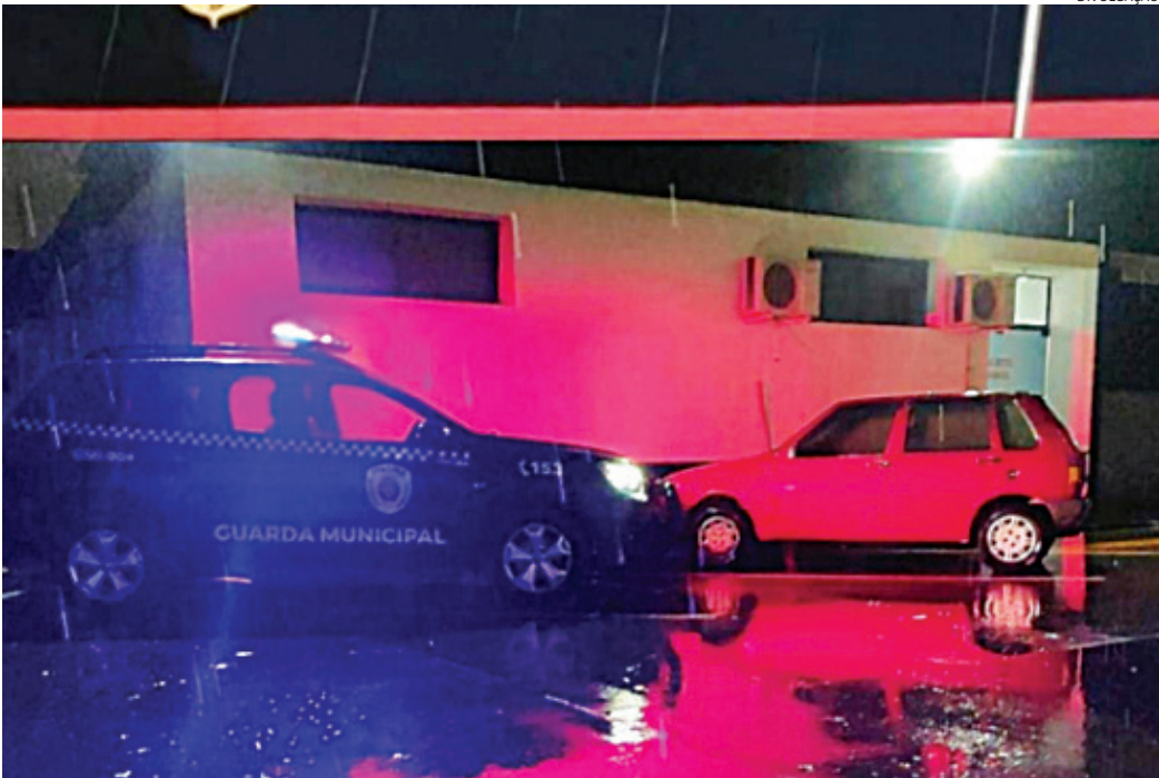
De imediato os agentes perceberam que o condutor estava bêbado