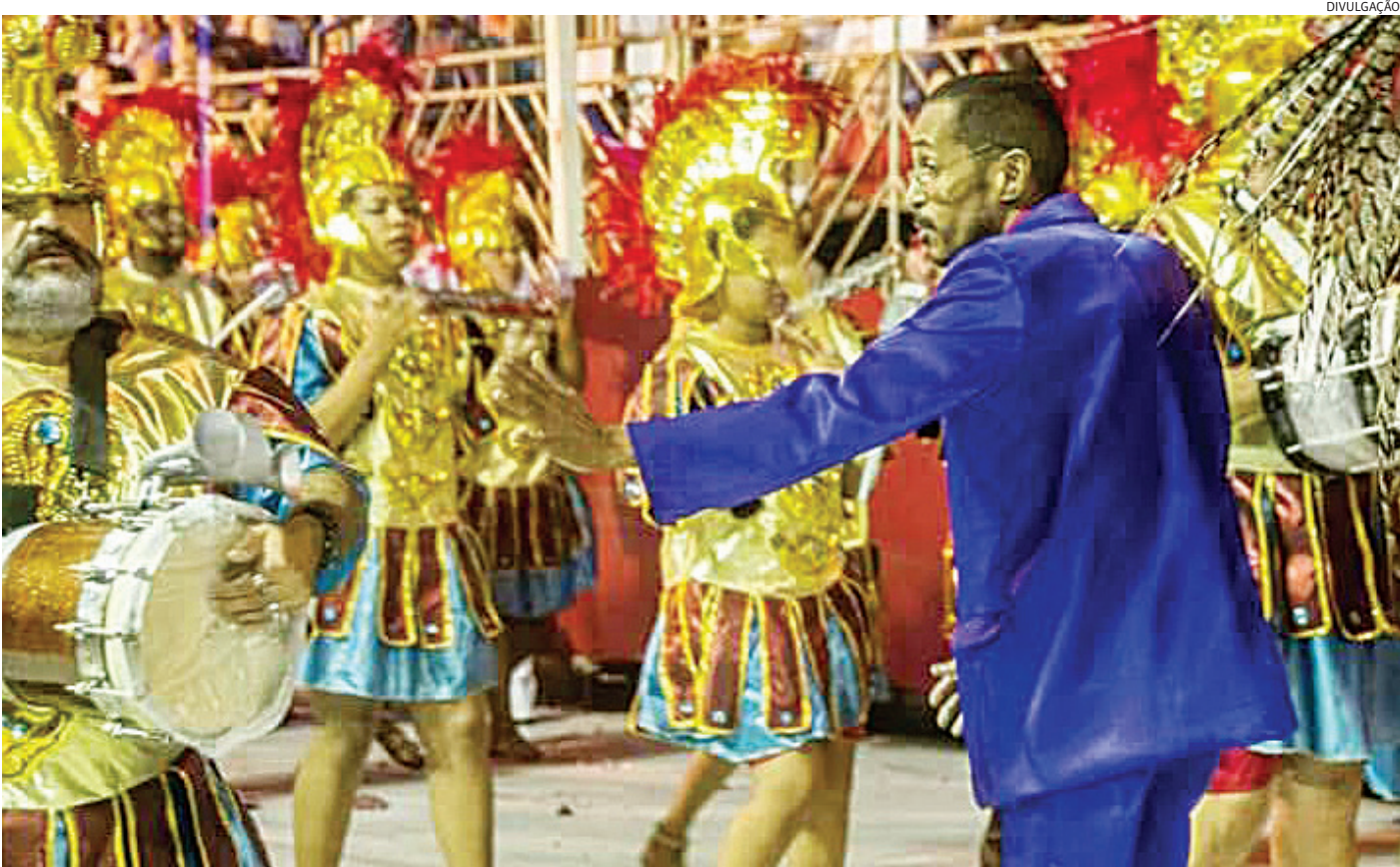
A Prefeitura confirmou que o evento será realizado em 8 de março e já conduz reuniões de alinhamento entre as secretarias envolvidas

“A realização fora de época, assim como em anos anteriores, é estratégica, assim descentralizamos o ca-