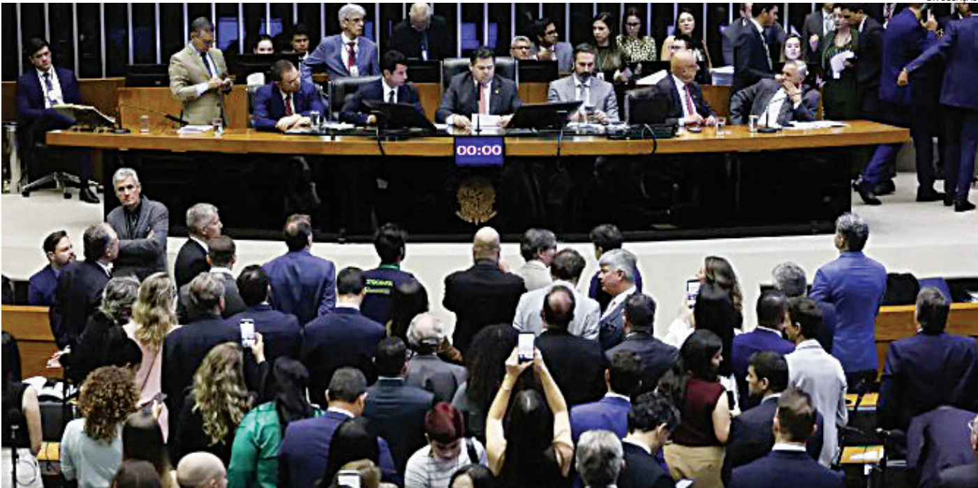
Câmara dos Deputados votou o projeto durante a madrugada, após episódios polêmicos