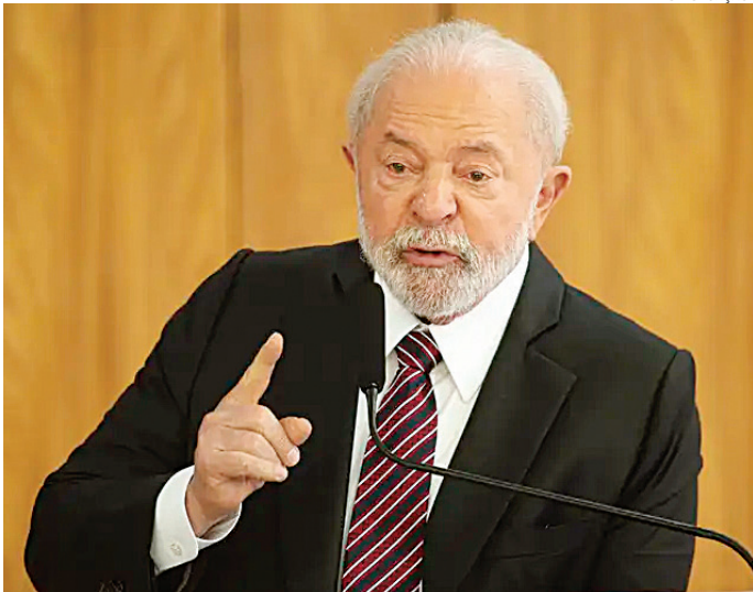
Aprovação de dosimetria em penas não deve ter aval da presidência

A época, a direção do PT se manifestou contra a pro-