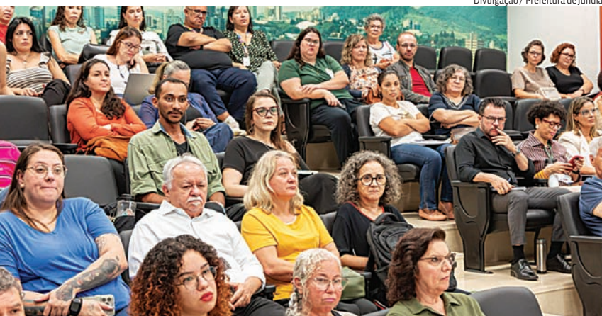
Seminário reuniu representantes do poder público, instituições e sociedade civil