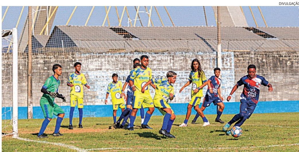
Jundiaí recebe seletiva da SKF para a Gothia Cup, marcada para julho, em Gotemburgo, na Suécia.

Promovido pela multinacional sueca SKF, o campeonato tem caráter social e esportivo, utilizando o futebol como ferramenta de integração e oportunidade para jovens atletas. A etapa em Jundiaí foi apontada como uma das maiores edições do projeto no Brasil e reforçou o papel da cidade como polo esportivo regional.