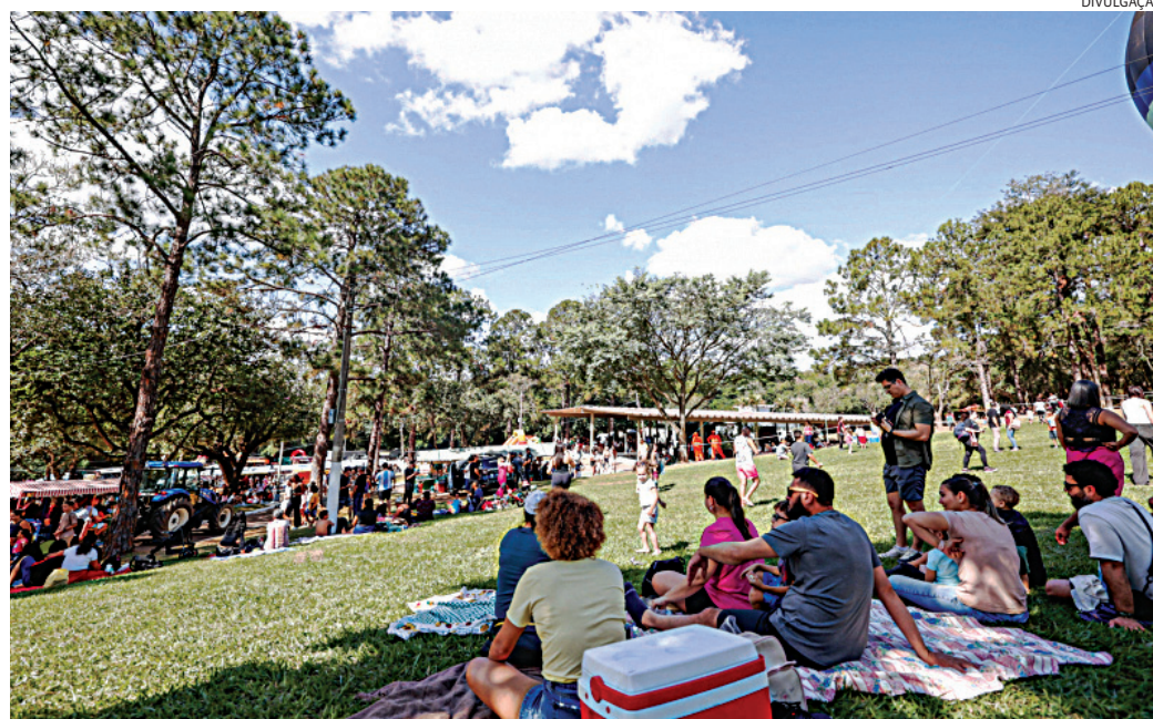
Os parques públicos e centros esportivos ficam abertos normalmente

O Caps AD e o Caps 3 permanecem abertos 24 horas