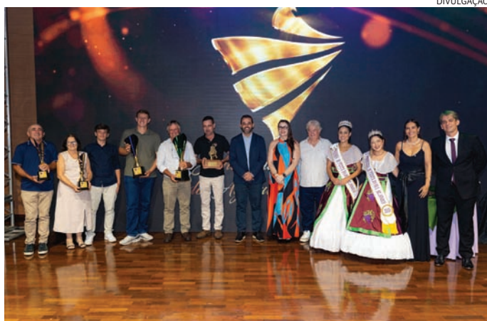
As melhores frutas apresentadas na festa da uva foram premiadas

Os agricultores que participaram da 41ª Festa da Uva e 12ª Expo Vinhos de Jundiaí foram homenageados em uma noite de reconhecimento ao trabalho de quem movimenta a economia rural e mantém viva uma das principais tradições da cidade. O Jantar de Premiação dos Agricultores 2026 reuniu produtores, autoridades e representantes do setor para celebrar os homens e mulheres do campo que fazem de Jundiaí