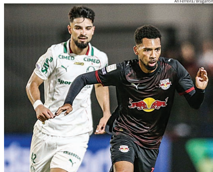
O jogo terá transmissão exclusiva pelo Paramount+

O jogo terá transmissão exclusiva pelo Paramount+ e é tratado internamente como decisivo pelo clube de Bragança Paulista. A expectativa é de bom público, com a venda de ingressos iniciada nesta terça-feira para a torcida local.