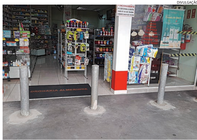
Os estabelecimentos precisam instalar barras de aço na calçada

Em março, uma farmácia no Almerinda Chaves foi assaltada. Segundo a proprietária que falou com exclusividade ao Jornal de Jundiaí, o prejuízo foi de mais de R$ 5 mil, já que precisou fazer o conserto da porta. "Como eu não comercializo as canetas emagrecedoras, eles levaram