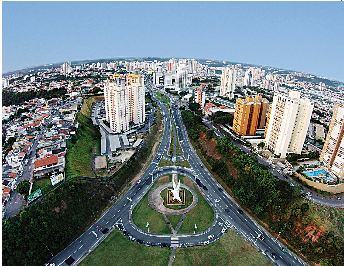
O objetivo é coletar informações detalhadas sobre como a população se desloca

Os endereços foram selecionados a partir de amostras extraídas do Cadastro Nacional de Ende-