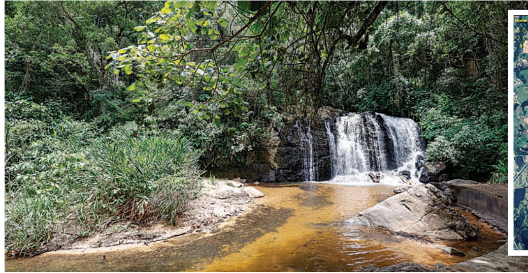
Novo projeto habitacional impactaria os arredores da Serra do Japi