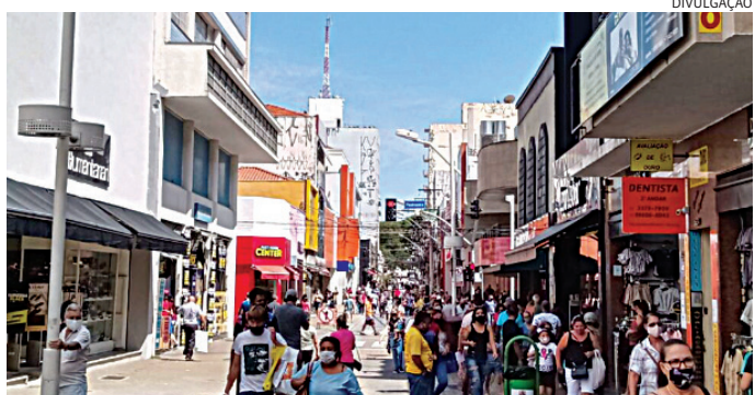
Os horários ampliados irão facilitar nas compras para o Dia das Mães

Na quinta (7) e sexta (8) deve atender até as 22h; e no sábado (9) das 9h às 18h. O Dia das Mães consolida-se como a segunda data mais importante para o varejo brasileiro, perdendo apenas para o Natal. A data impulsiona setores como o de perfumes, cosméticos, vestuário e é responsável por garantir faturamento e giro de estoque no primeiro semestre de cada ano.