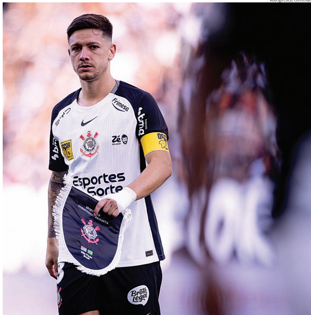
Timão joga em casa para encaminhar vaga no grupo E da competição intercontinental

são da ESPN e do Disney+ e pode deixar o Corinthians em situação confortável na