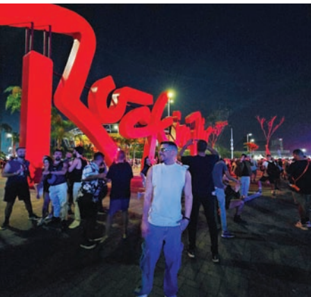
O famoso letreiro do RIR, que celebra 40 anos

A noite pop do Rock in Rio foi um sucesso, com shows vibrantes de Katy Perry, Karol G e Cyndi Lauper. Katy incendiou o palco com seus maiores hits, como “Firework”, enquanto Karol G trouxe o poder do reggaeton com “Tusa”. Cyndi Lauper emocionou o público ao cantar clássicos como “Girls Just Want to Have Fun”. A mistura de gerações e estilos fez dessa sexta-feira uma celebração inesquecível da música pop.