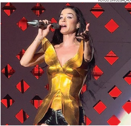
Katy Perry foi a headliner da noite