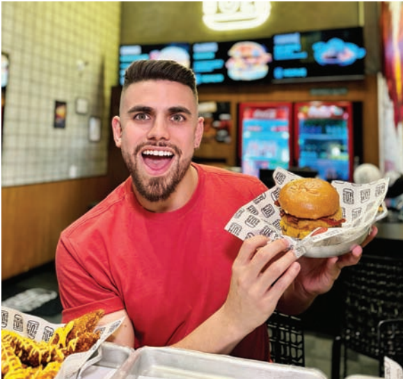
Hambúrgueres com ingredientes sofisticados

equipamentos e acessórios para o preparo de café especiais, que agora ganha um café, bar e restaurante que desvendam os sabores da tradicional mesa japonesa. Cutura 8