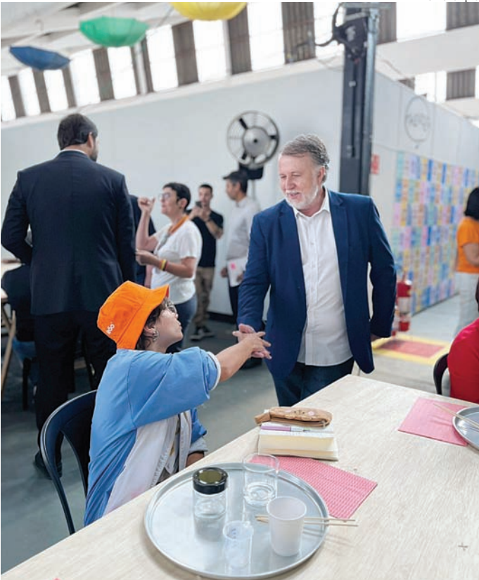
Galpão Criativo já teve mais de R$ 700 mil vendas revertidas aos criativos

Os vereadores de Várzea Paulista encaminharam indicação ao Executivo em que solicitam estudo técnico para construção de uma Escola de Educação Especial destinada a atender crianças e adolescentes com Transtorno do Espectro Autista (TEA) e Transtorno do Déficit de Atenção com Hiperatividade (TDAH) naquele município.