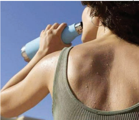
Para evitar o desabastecimento, a prefeitura alerta a população quanto ao consumo consciente

umidade relativa do ar ficou entre 20% e 65%. Para amanhã (26), é prevista mínima de 21°C e máxima de 34°C. Na sexta (27), há previsão de chuva, a mínima já pode cair um pouco, para 14°C, e a máxima deve continuar em 34°C. Já no sábado, após a chuva de sexta, o dia terá mínima de 15°C e máxima de 25°C, amenizando um pouco o calorão, de acordo com o Instituto Nacional de Meteorologia (Inmet).