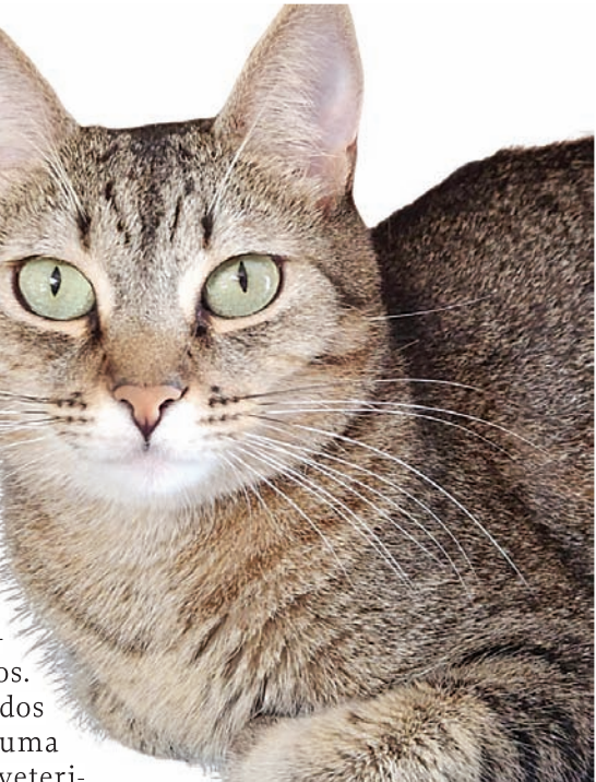
Gatos e cachorros já castrados estarão disponíveis para adoção no sábado

Visite a Feira de Adoção de Animais, do Instituto Focinho Feliz, que acontece no próximo dia 28 de setembro, das 11h às 15h, no Hall da Entrada G2 Leste do Maxi Shopping Jundiáí. O evento terá cães e gatos adultos, castrados, vermifugados, vacinados e microchipados, além de filhotes de cães e gatos. A novidade é que todos os adotantes ganham uma consulta grátis com a veterinária parceira do Instituto. 7