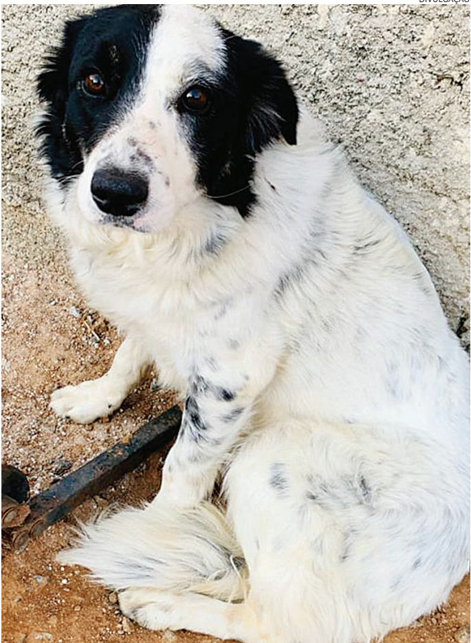
Para adotar é necessário levar RG, CPF e comprovante de residência

Visite a Feira de Adoção de Animais, do Instituto Focinho Feliz, que acontece no próximo dia 28 de setembro, das 11h às 15h, no Hall da Entrada G2 Leste do Maxi Shopping Jundiaí, e deixe-se cativar. O evento, vai ter cães e gatos adultos, castrados, vermifugados, vacinados e microchipados, além de filhotes de cães e gatos. A novidade é que todos os adotantes ganham uma consulta grátis com a veterinária parceira do Instituto.