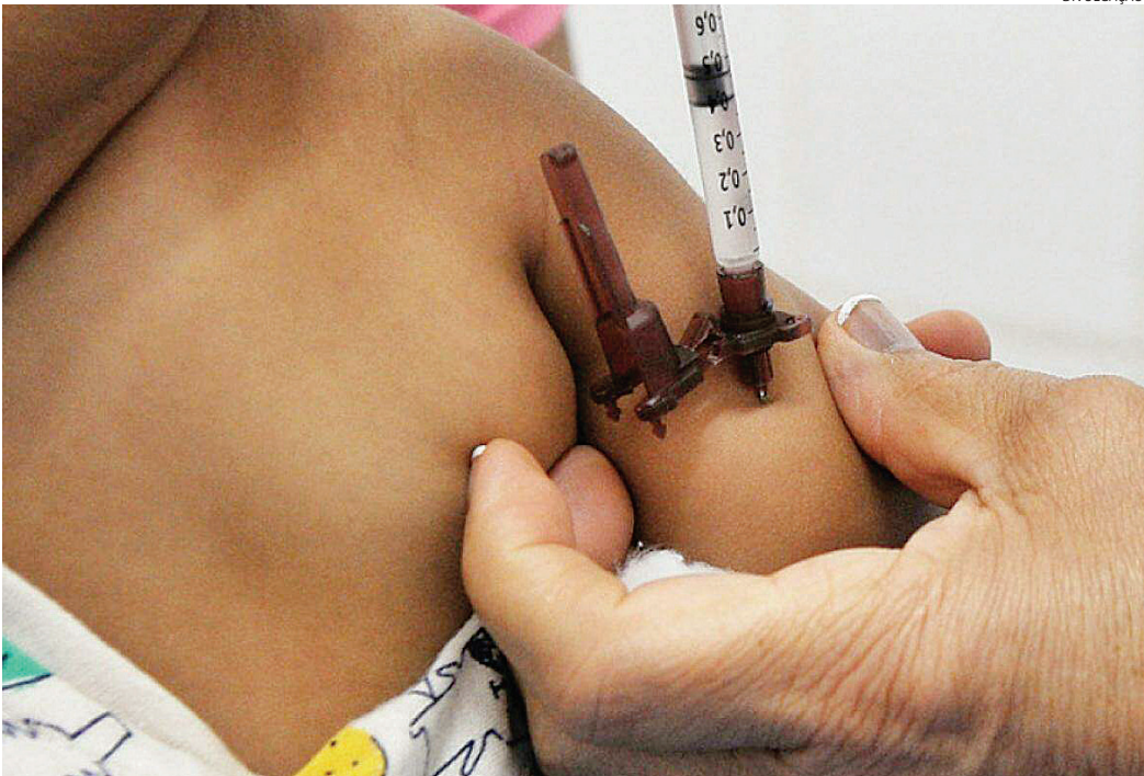
Sem agendado para crianças que tenham de 6 meses a menores de 5 anos e de 5 anos a 11 anos

A lista do grupo prioritário para vacinação contra covid-19 está disponível no link https://jundiai.sp.gov.br/coronavirus/calendario-de-vacinacao/ .