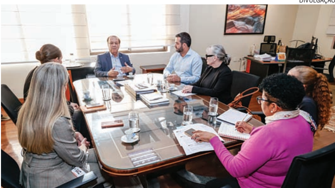
Gestão segue buscando alternativas para resolver problemas na saúde

O presidente Luiz Inácio Lula da Silva sancionou, nesta sexta-feira (8), com vetos, o polêmico projeto de lei (PL) aprovado pelo Congresso Nacional que elimina ou reduz exigên-