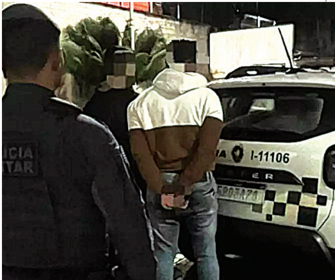
Dois deles foram alcançados e presos pelos PMs

Os policiais faziam patrulhamento, quando notaram a porta do escritório - que oferece salas de reuniões e apresentações para empresas -, entreaberta. Quando se aproximaram para averiguar, três criminosos saíram do local e correram. Eles