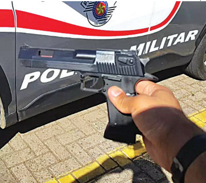
Ele disse que iria usar o simulacro para ameaçar alunos de outra escola

Ele disse aos PMs que iria usar o simulacro para ameaçar e amedrontar alunos de uma escola no Tulipas.