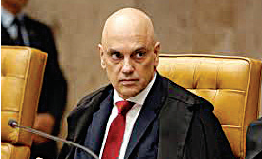
Pedido de impeachment a Moraes pode ser apresentado por qualquer cidadão

Governadores da direita planejam encontros para