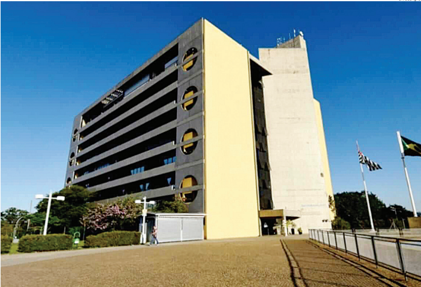
Reforma administrativa foi citada como compromisso da gestão no início do mandato

Segundo a administração municipal, a proposta visa modernizar a estrutura da Prefeitura, com foco em eficiência, inovação e economia de recursos. Entre os pontos centrais está a transformação da Fumas (Fundação Municipal de Ação Social) em Secretaria Municipal de Habitação Social. A