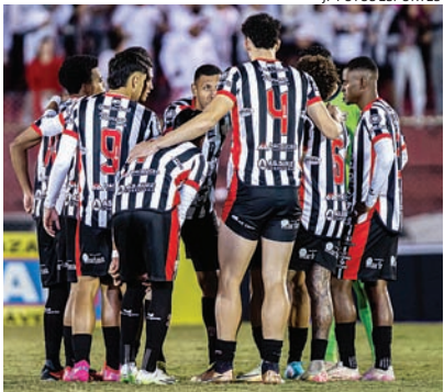
JP FOTOS ESPORTES

O Paulista venceu o Rio Branco, por 2 a 1, no Estádio Dr. Jayme Cintra, em Jundiáí, na noite desta sexta-feira (8), pela 9ª rodada da Copa Paulista. Esportes 8