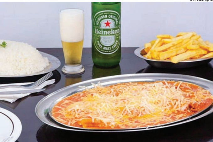
Entre as opções, a tradicional parmegiana da Bella Parma

Bella Parma Jundiaí Avenida Carlos Salles Block, 210. Mais informações pelo telefone (11) 4521-4132; ou rua do Retiro, 1454. Instagram @bellaparmajundiaí Garden Jundiaí: Rua Conrado Offa, 480, Chácara Urbana. Instagram @gardenjundiaí Coco Bambu: Av. Nove de Julho, 3333. Instagram @cocobambujundiaí