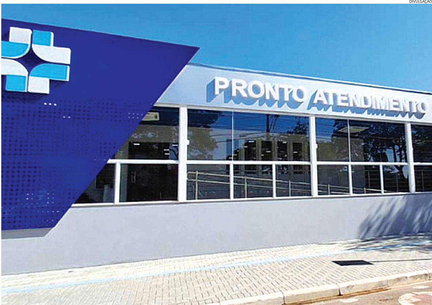
Na quinta-feira o idoso retornou e apresentou súbita deterioração clínica

Na quinta-feira (07), retornou à unidade, sendo novamente atendido dentro do tempo recomendado pelo Protocolo de Manchester. A triagem foi realizada das 16h48 às 17h08 e o primeiro atendimento médico ocorreu das 17h34 às 18h01. Foram realizados exames de imagem, laboratoriais e medicação.