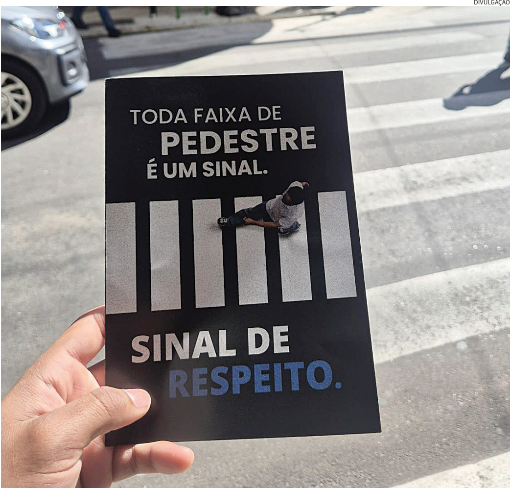
O informativo entregue mostra a importância do respeito no trânsito para diminuir os índices de acidentes

Oferecendo folders com frases de efeito como ‘Civilidade é o respeito de um pelo outro. Pratique, respeitando a faixa de pedestre’, ‘Empatia é se colocar no lu-