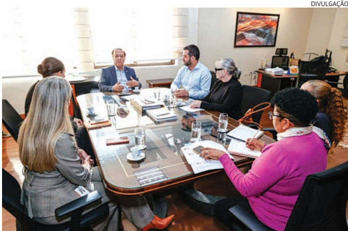
O prefeito se reuniu com o secretário estadual da Saúde, Eleuses Paiva

O secretário Eleuses Paiva confirmou avanços. “Provavelmente, nas próximas duas semanas, teremos uma nova reunião para definir a mudança no perfil assistencial, o que deve permitir ampliar cerca de 200 cirurgias no Hospital Regional. E o mais importante: estamos trabalhando na abertura de novos leitos na região. Essa é uma prioridade do governador Tarcísio, ampliar a oferta de serviços em parceria com os municípios e garantir saúde de qualidade.”