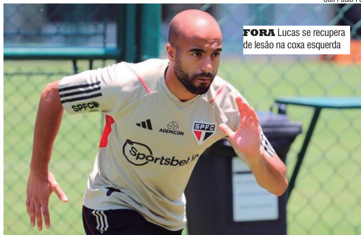
FORA Lucas se recupera de lesão na coxa esquerda

Isso vale para o meia Wellington Rato, que também foi ao gramado do