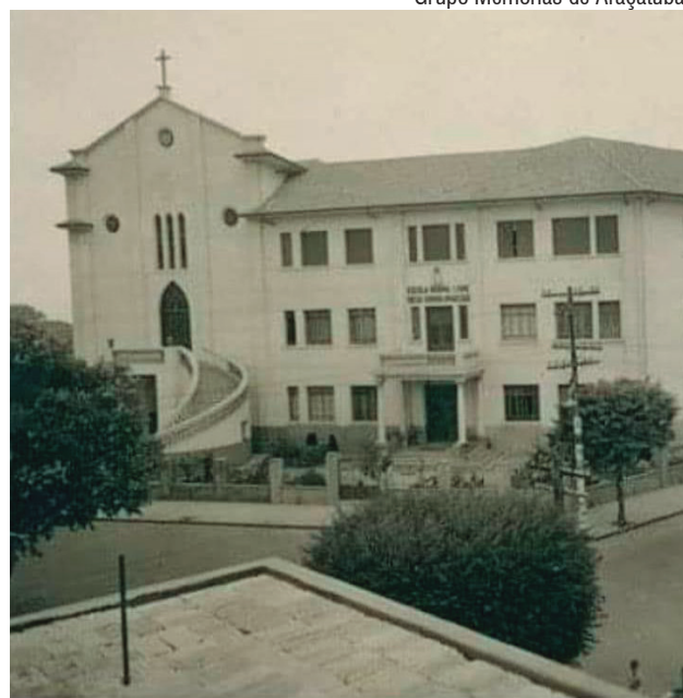
Colégio Nossa Senhora