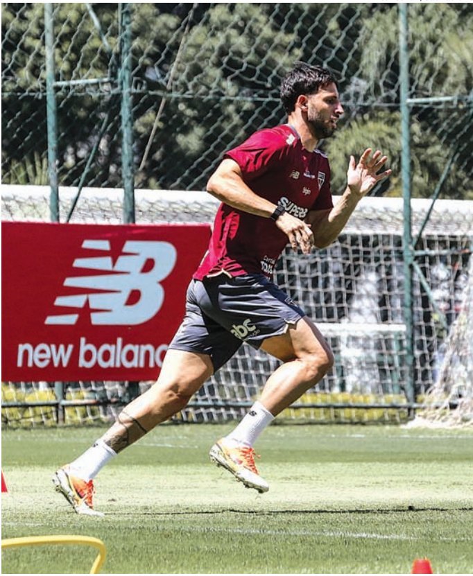
O transfer ban já foi oficializado e publicado no site da Fifa

Ao UOL, o São Paulo afirmou que “houve um desacordo” entre os valores devidos ao agente e que fará o pagamento do montante junto à entidade máxima do futebol.