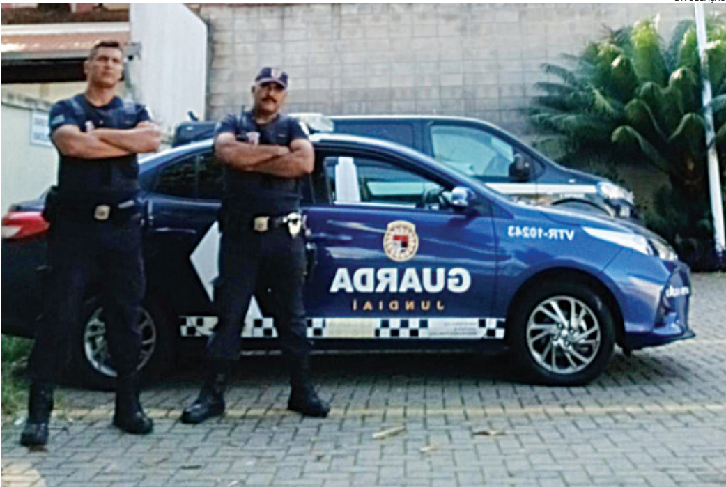
A mulher foi capturada por guardas municipais nesta quarta-feira

O corpo da vítima foi encontrado em uma área de mata às margens da avenida Armando Giassetti, no bairro Engordadouro, em 5 de novembro,