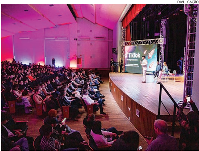
O encontro é gratuito, porém é necessário inscrição antecipada

O programa TikTok Pro Meu Negócio oferece capacitação prática para empreendedores de diferentes