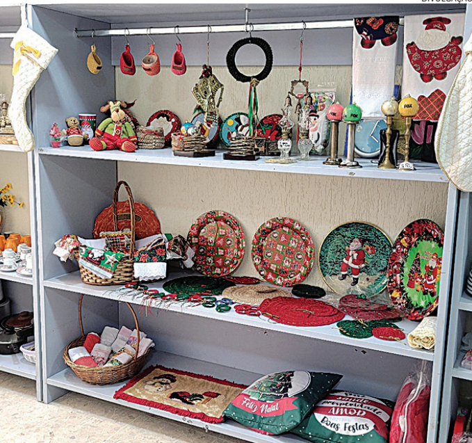
O bazar de Natal será realizado no dia 9, com vários itens