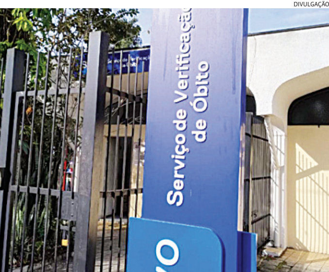
O corpo foi encaminhado ao Instituto Médico Legal (IML) de Jundiaí

Um motociclista de 25 anos morreu em um acidente no início da noite desta terça-feira (2), no km 57 da rodovia Presidente Tancredo de Almeida Neves, em Jundiaí.