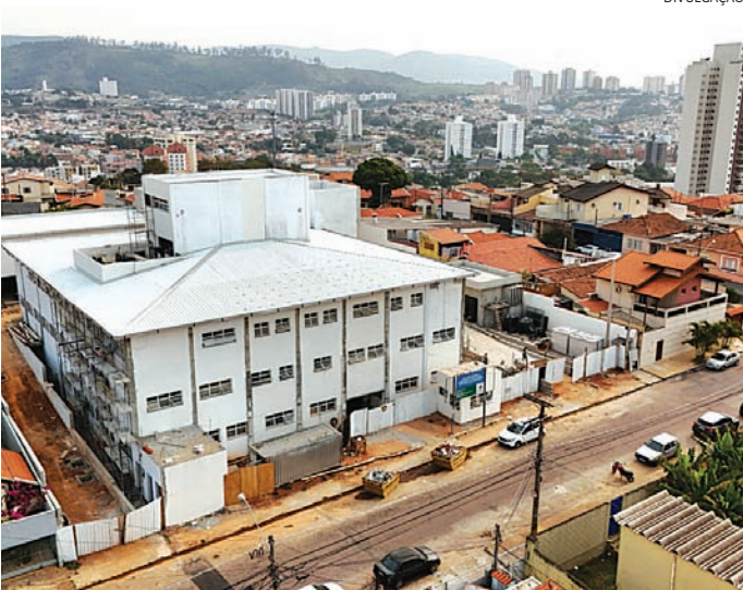
A previsão é que as obras sejam concluídas em 13 meses

No pavimento térreo, funcionará o Pronto Atendimento Vila Progresso, que reforçará a assistência de urgência e emergência, com foco em clínica médica e pediatria. A estrutura ampliará em 20% a capacidade atual da cidade, com estimativa de atender cerca de 90 mil moradores da região. O espaço contará com consultórios médicos e odontológico, salas de triagem, medicação e procedimentos, sala de observação com 10 leitos, sala de emergência com dois leitos, quarto de isolamento e sala de raio-X.