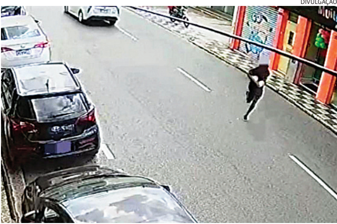
Ele foi flagrado durante a fuga após o assalto

Quando estavam na rua Nossa Senhora das Graças, avistaram um homem com as mesmas características e, ao perceber a aproximação da equipe, ele tentou se esconder em uma oficina mecânica, mas foi abordado. Nada de ilícito foi encontrado com ele, que confessou ser o autor do crime e informou que havia