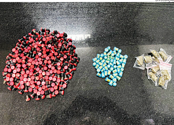
Os GMs apreenderam 300 porções de drogas com o traficante