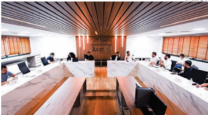
Vereadores acompanham caso da bebê vítima de maus-tratos

A Câmara Municipal aprovou, na noite desta terça-feira (2), o Orçamento de 2026. Será o primeiro ano em que a atual administração irá executar uma peça orçamentária elaborada integralmen-