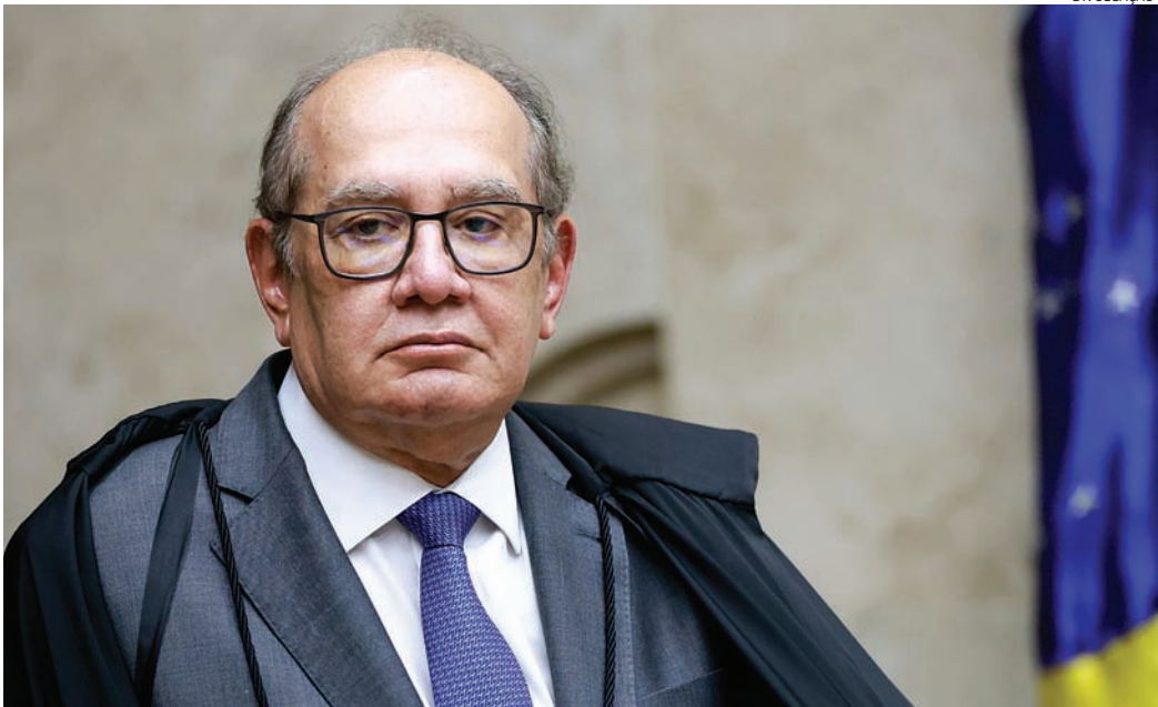
Gilmar Mendes suspendeu decisão liminar sobre impeachment da corte

Nos últimos anos, partidos têm discutido a possibilidade de formar em 2026 uma composição no Senado que permita o impeachment de ministros do STF. Os principais defensores são aliados do ex-presidente Jair Bolsonaro (PL), con-